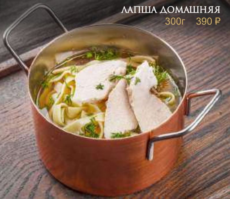
ЛАПША ДОМАШНЯЯ 300г 390 Р