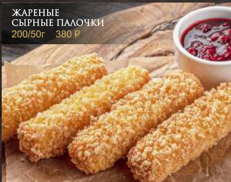
ЖАРЕННЫЕ СЫРНЫЕ ПАЛОЧКИ 200/50г 380 Р