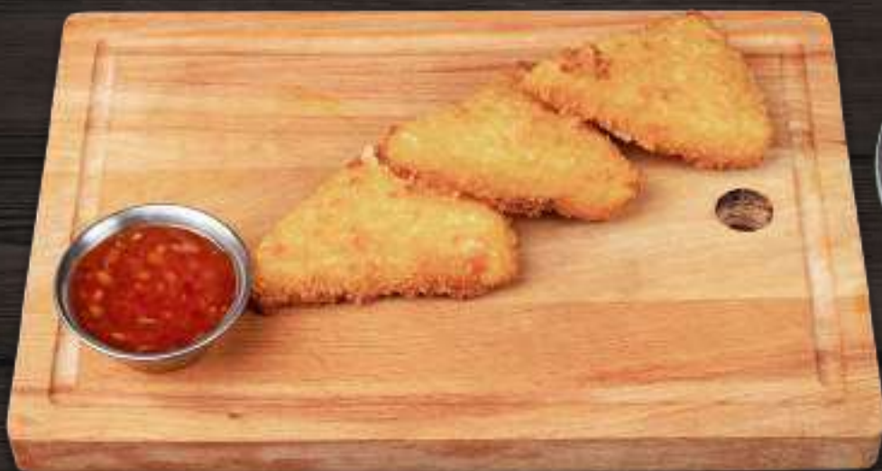
ЖАРЕННЫЙ СЫР СУЛУТУНИ 250г 380 Р