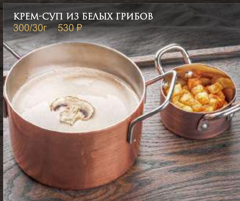
КРЕМ-СУП ИЗ БЕЛЫХ ГРИБОВ 300/30г 530 Р