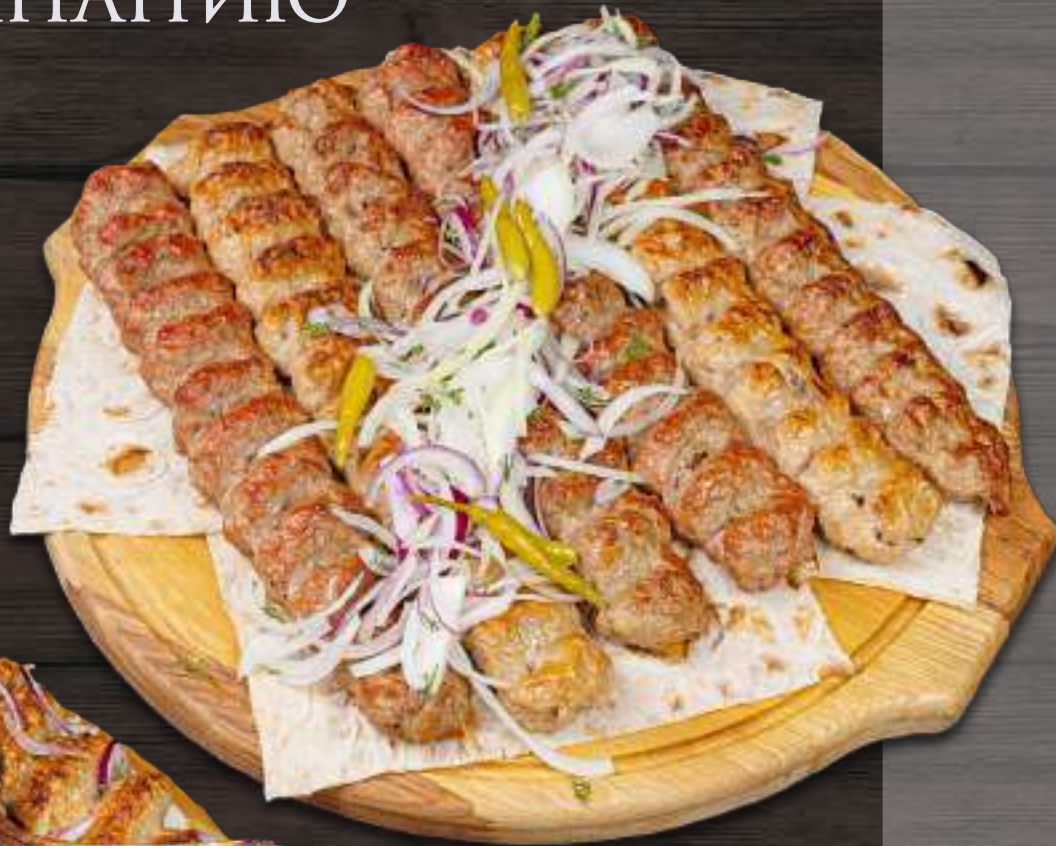
КЕБАБ АССОРТИ 1500г 3400 ₽