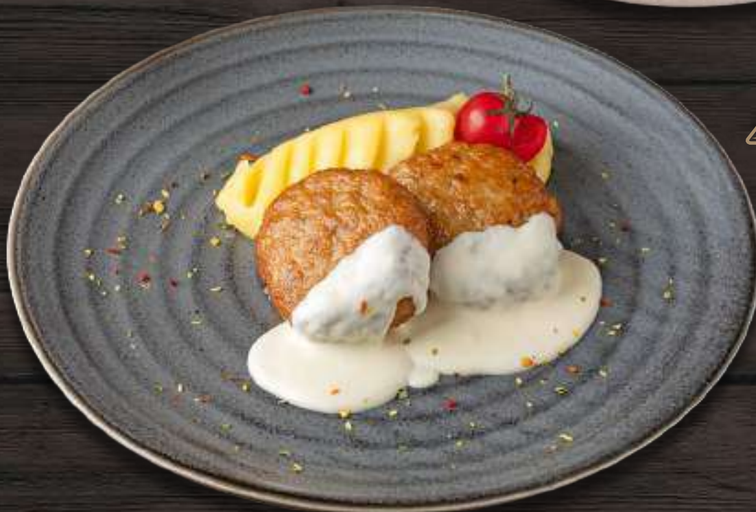
КУРИНЫЕ КОТЛЕТКИ С КАРТОФЕЛЬНЫМ ПЮРЕ И СЛИВОЧНЫМ СОУСОМ 180/100/50г 610 Р