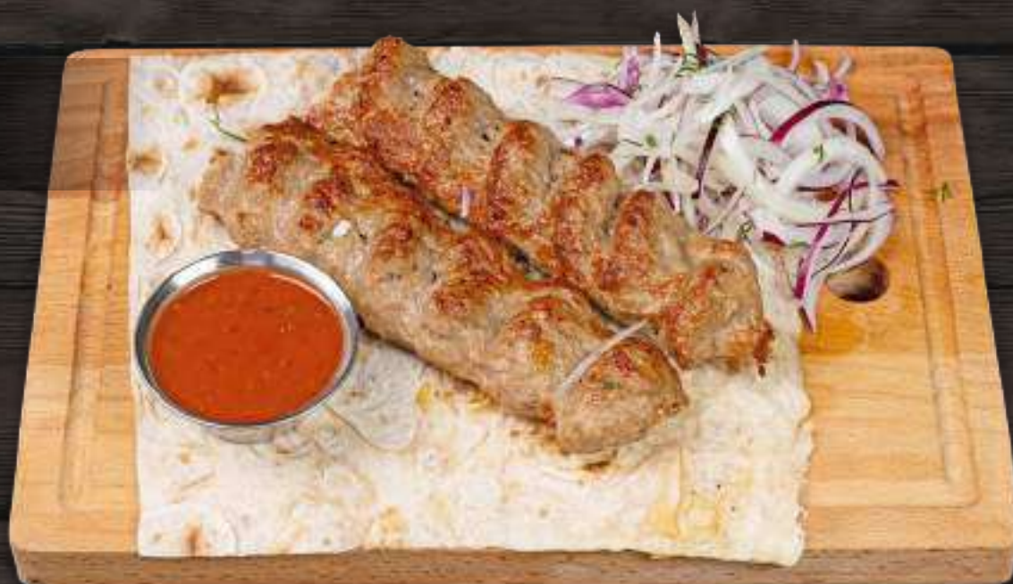
ЛЮЛЯ-КЕБАБ ИЗ ГОВЯДИНЫ 200/50г 530 Р