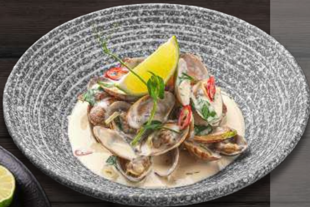
ВОНГОЛЕ В СОУСЕ сливочном / томатном / горгондзола / сливочном с трюфелем 250г 650 ₺