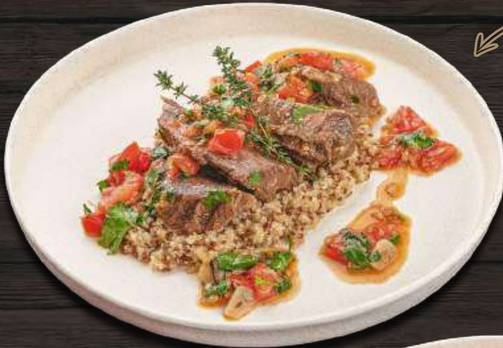
ТЕЛЯЧЬИ ШЕЧКИ, ТОМЛЕННЫЕ В ПИВЕ • киноа, томаты, лук-шалот, чеснок, тимьян, петрушка • 180/100/30г 780 Р