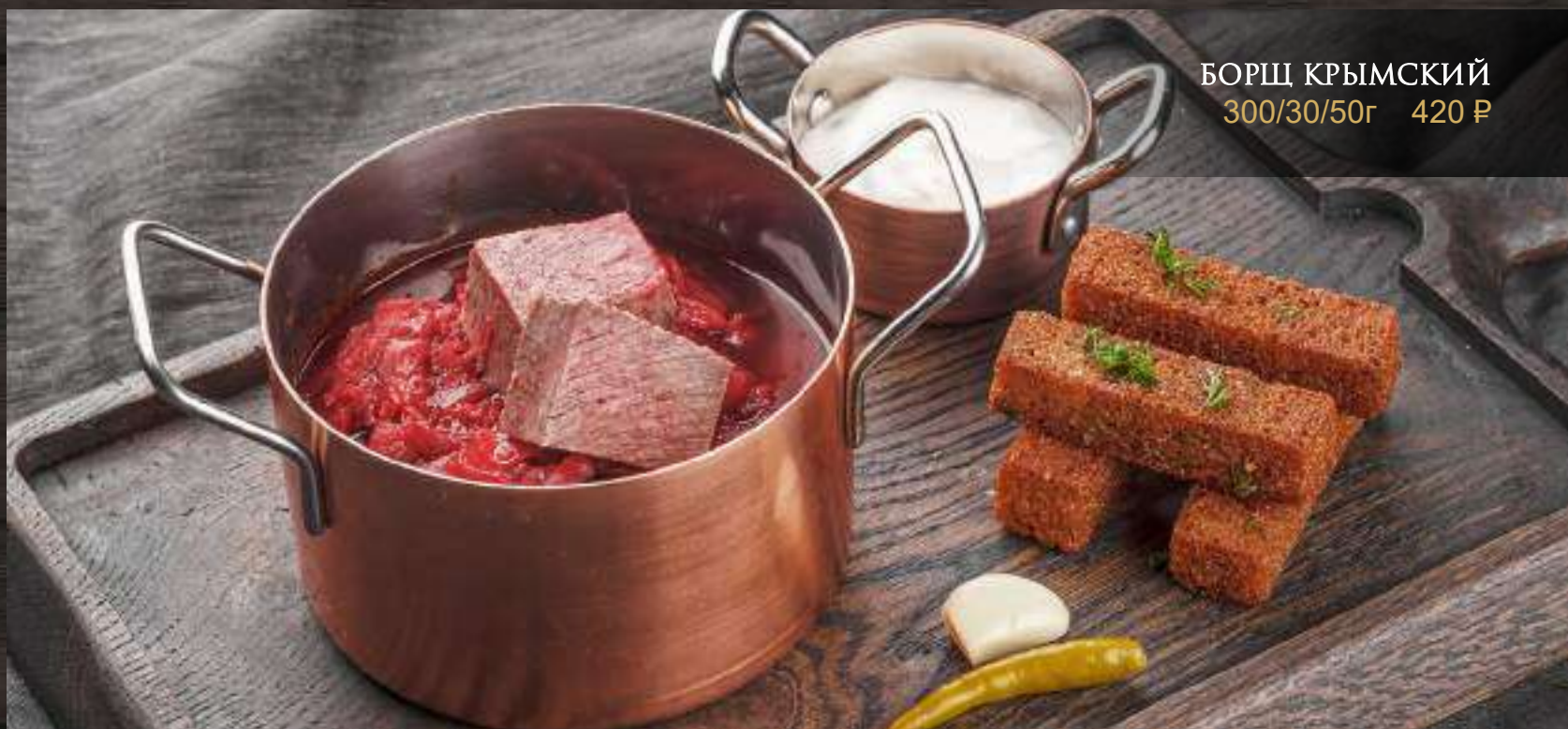
БОРЩ КРЫМСКИЙ 300/30/50г 420 Р