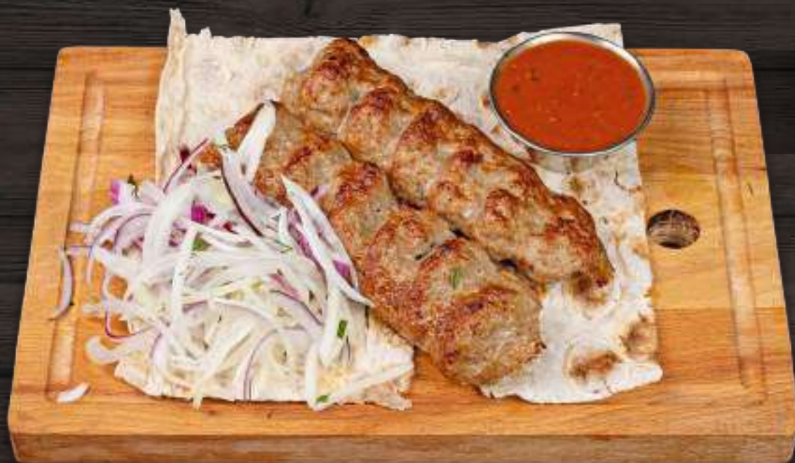
ЛЮЛЯ-КЕБАБ ИЗ БАРАНИНЫ 200/50г 540 Р