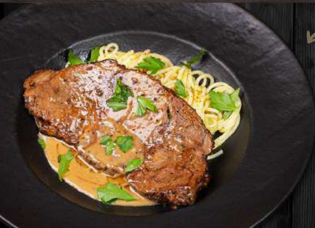
ТОМЛЕНАЯ ГОВЯЖЬЯ ГОЛЯШКА 200/100/30г 810 Р