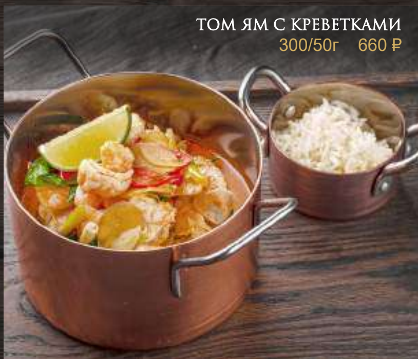
ТОМ ЯМ С КРЕВЕТКАМИ 300/50г 660 Р