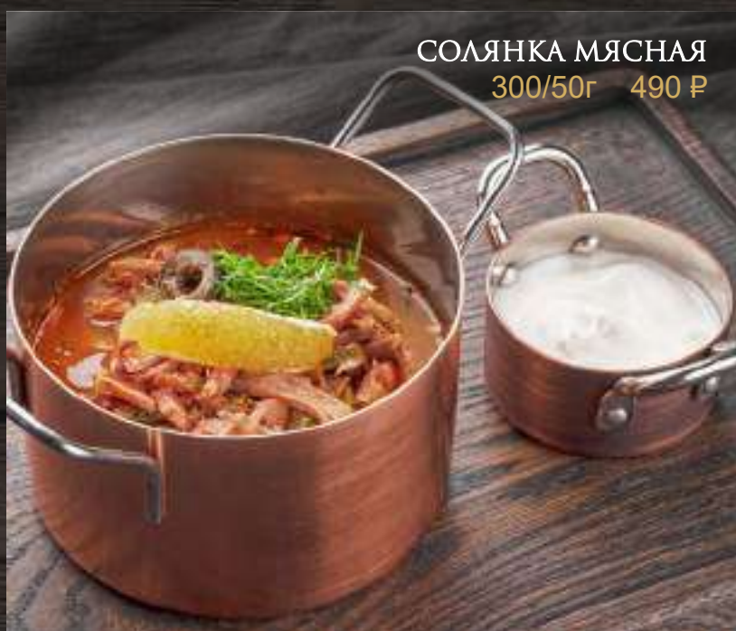
СОЛЯНКА МЯСНАЯ 300/50г 490 Р