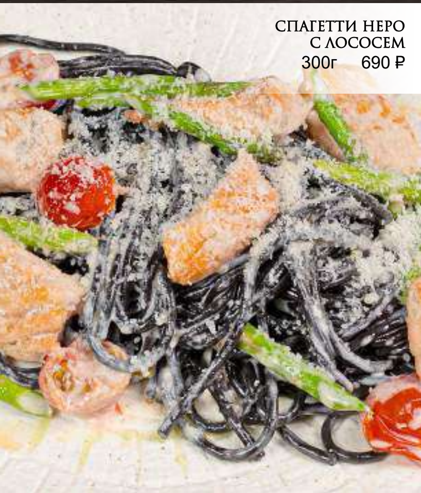
СПАГЕТТИ НЕРО С ЛОСОСЕМ 300г 690 ₺