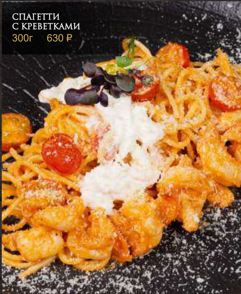
СПАГЕТТИ С КРЕВЕТКАМИ 300г 630 ₺