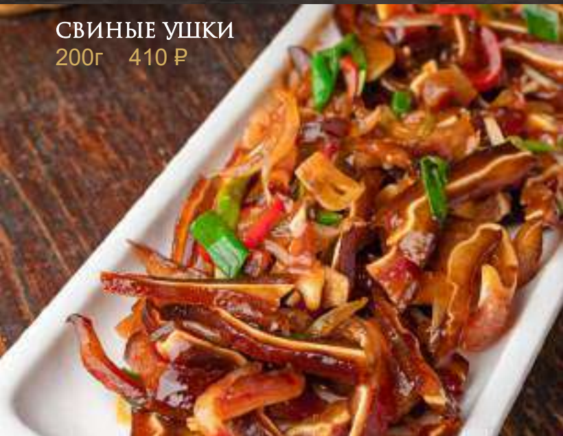
СВИНЫЕ УШКИ 200г 410 ₺