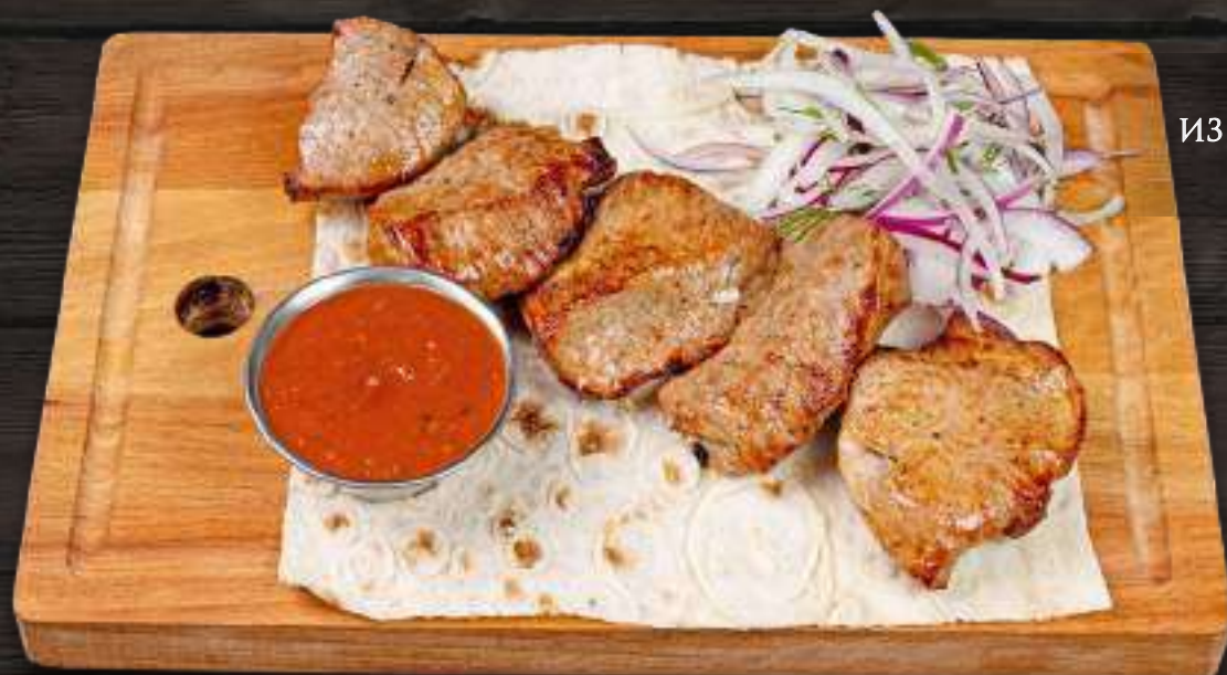
ШАШЛЫК ИЗ ТЕЛЯЧЬЕЙ МЯКОТИ 200/50г 880 Р