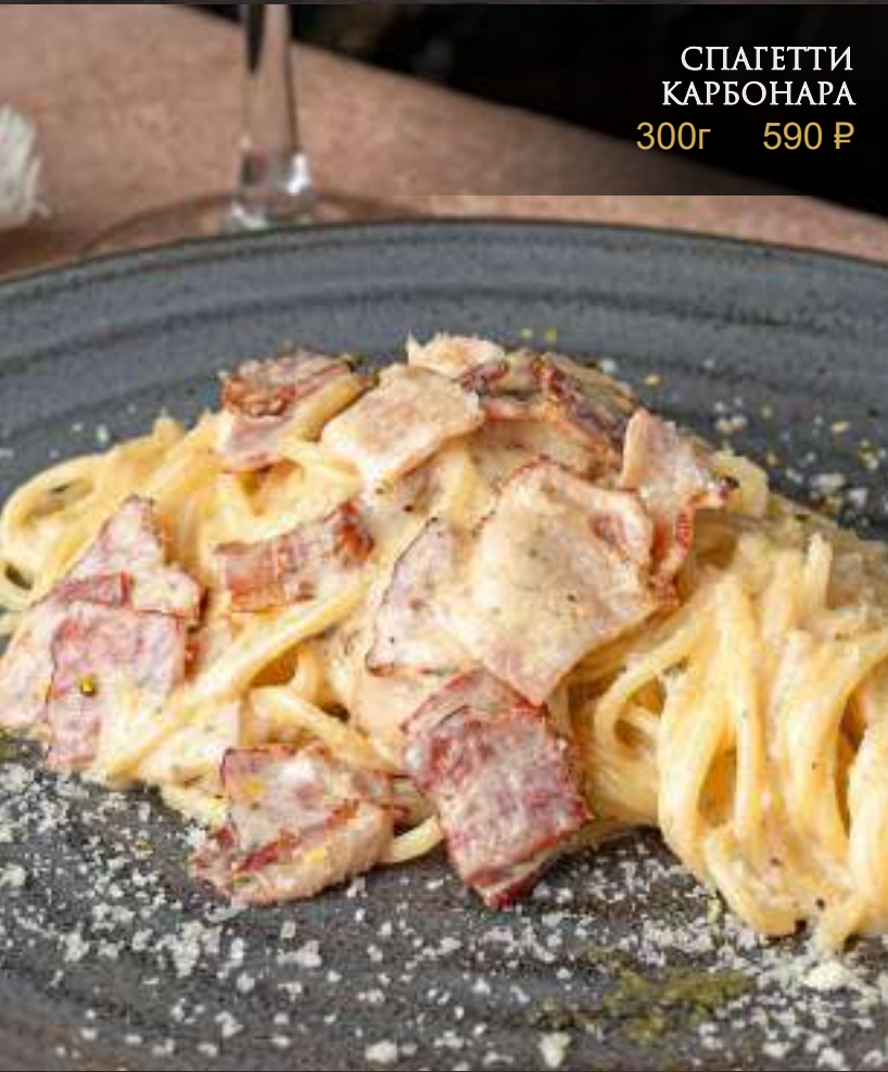
СПАГЕТТИ КАРБОНАРА 300г 590 ₺