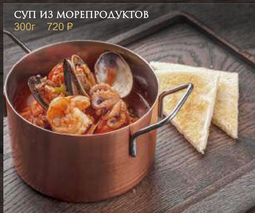
СУП ИЗ МОРЕПРОДУКТОВ 300г 720 Р