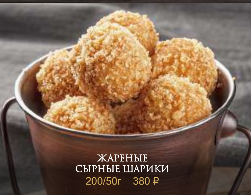
ЖАРЕННЫЕ СЫРНЫЕ ШАРИКИ 200/50г 380 Р