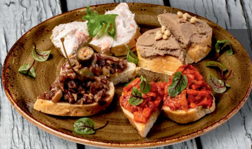
Брускеты 240 гр. 440Р