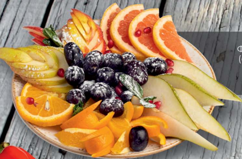
Фруктовая тарелка (сезонные фрукты)