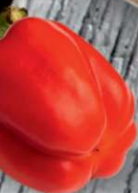
Овощная тарелка (сезонные овощи)