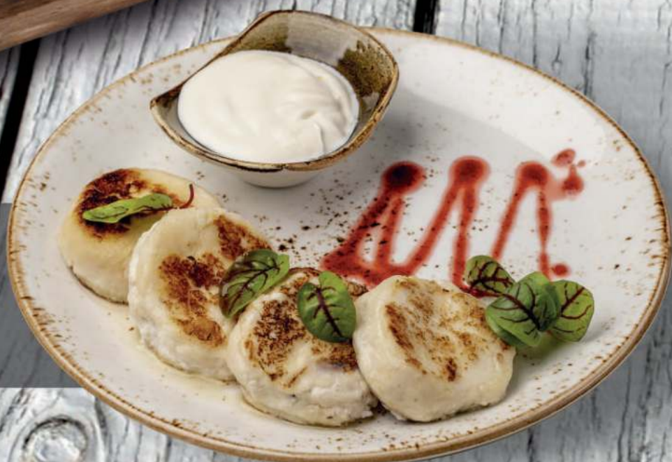
Сырники Vuogirno a tutti