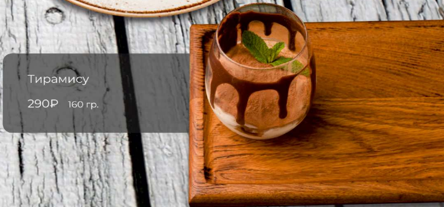
Тирамису 290Р 160 гр.