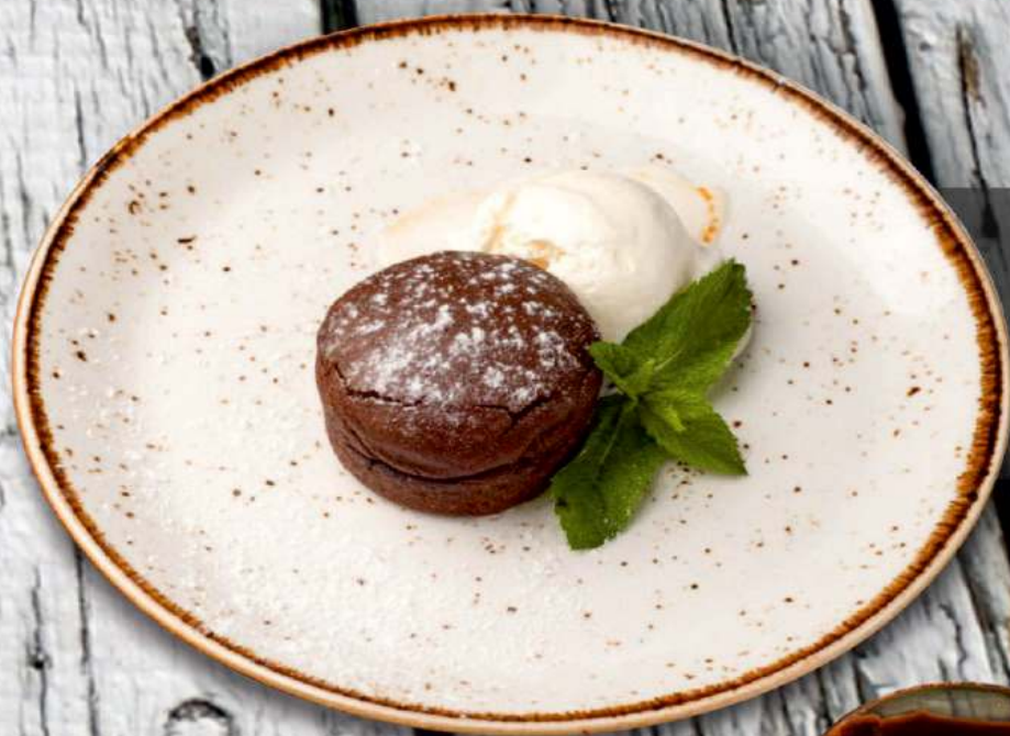
Фондан 150 гр. 290Р