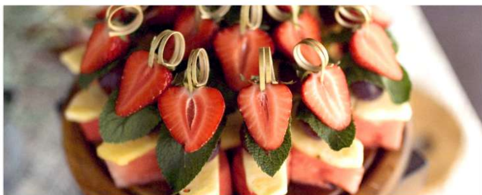
ФРУКТОВЫЕ ШПАЖКИ ИЗ СЕЗОННЫХ ФРУКТОВ