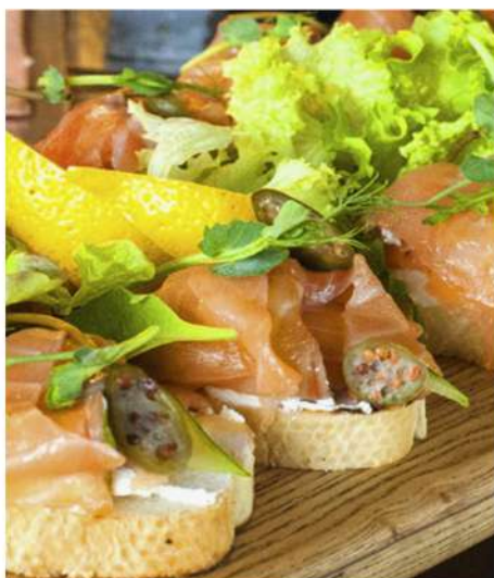
КРОСТИНИ С СЕМГОЙ, СЛИВОЧНЫМ СЫРОМ И КАПЕРСАМИ (8 штук)