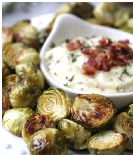
БРЮССЕЛЬСКАЯ КАПУСТА С СОУСОМ АЙОЛИ