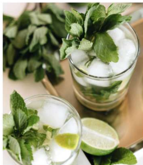
ХОЛОДНЫЙ ОСВЕЖАЮЩИЙ ЧАЙ С МЯТОЙ И ЛИМОНОМ (черный, зеленый)