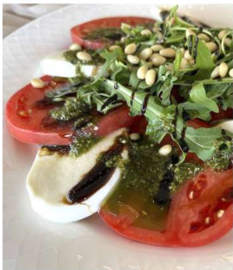
КАПРЕЗЕ С РУКОЛОЙ И КЕДРОВЫМИ ОРЕШКАМИ