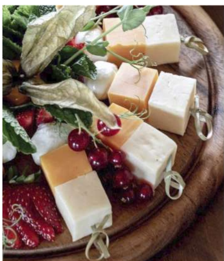
СЫРНОЕ КАНАПЕ (тильзитер, чеддер, моцарелла)