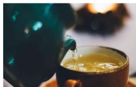
ЧАЙ ПАКЕТИРОВАННЫЙ (черный, зеленый)