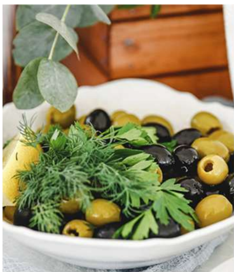
МАСЛИНЫ И ОЛИВКИ