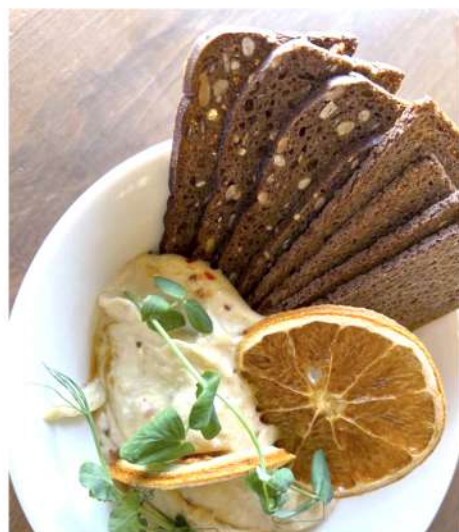
ХУМУС С ХЛЕБЦАМИ