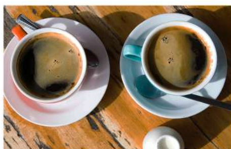
КОФЕ (американо, капучино)