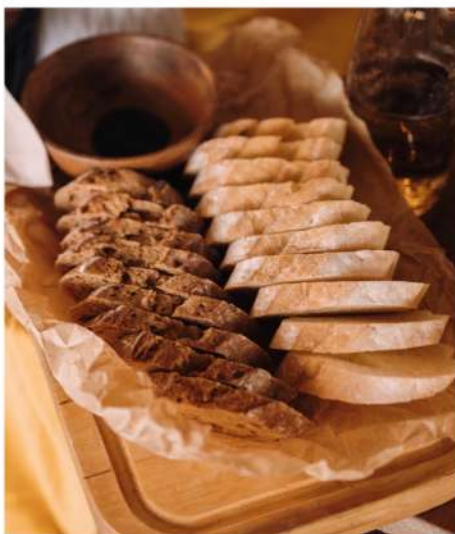
ПЛАТО С ДВУМЯ ВИДАМИ БАГЕТОВ И ЧЕРНОЙ СОЛЮ