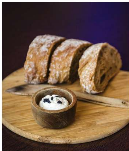
ЧЕСНОЧНОЕ МАСЛО МАСЛО С ЗЕЛЕНЬЮ