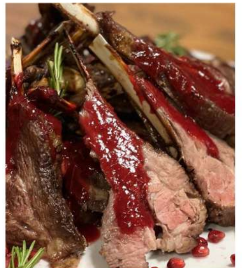
КАРЕ ЯГНЕНКА НА ГРИЛЕ С ЯГОДНЫМ СОУСОМ