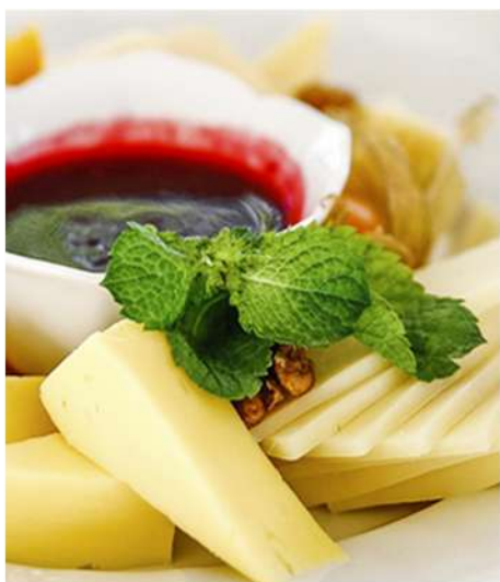
СЫРНОЕ АССОРТИ С ЯГОДНЫМ СОУСОМ И ОРЕШКАМИ (маздам, чеддер, тильзитер, джугас)