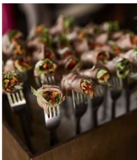
РОСТБИФ СО СВЕЖИМИ ОВОЩАМИ И ПРЯНОЙ ЗАПРАВКОЙ (подаётся на вилке)