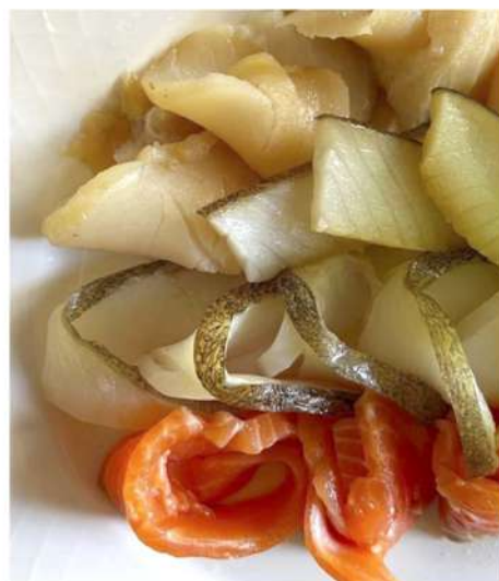
РЫБНОЕ АССОРТИ (масляная рыба, семга, палтус)