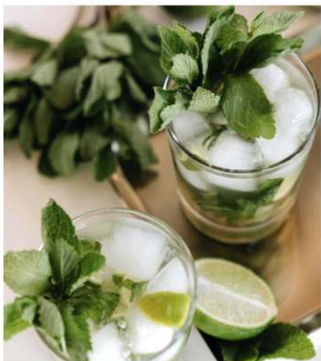
ХОЛОДНЫЙ ОСВЕЖАЮЩИЙ ЧАЙ С МЯТОЙ И ЛИМОНОМ (черный, зеленый)