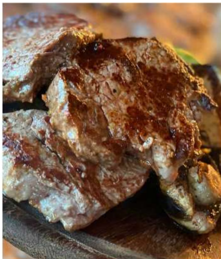
ШАШЛЫК ИЗ СВИНИНЫ