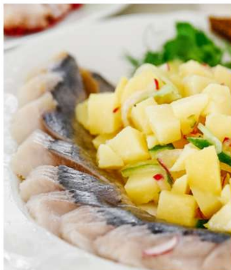
СЕЛЬДЬ С БОРОДИНСКИМИ ХЛЕБЦАМИ И ОБЖАРЕННЫМ КАРТОФЕЛЕМ