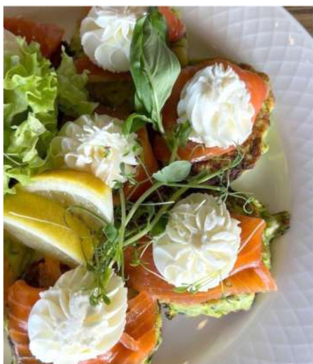
ДРАНИКИ ИЗ ЦУКИНИ СО СЛАБОСОЛЕННЫМ ЛОСОСЕМ