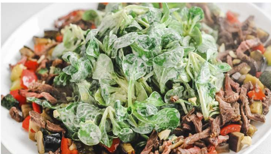
САЛАТ С РОСТБИФОМ И ЗАПРАВКОЙ ИЗ КАПЕРСОВ