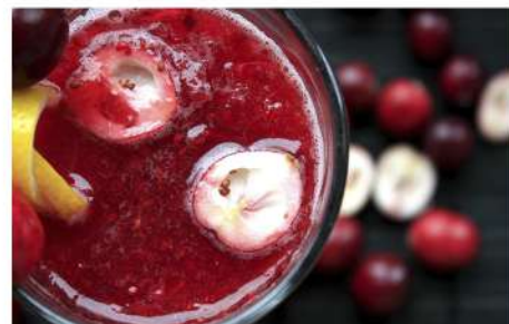
МОРС ЯГОДНЫЙ МИКС