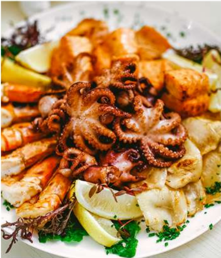
РЫБНОЕ АССОРТИ ГРИЛЬ (семга, кальмары, креветки, осьминоги)