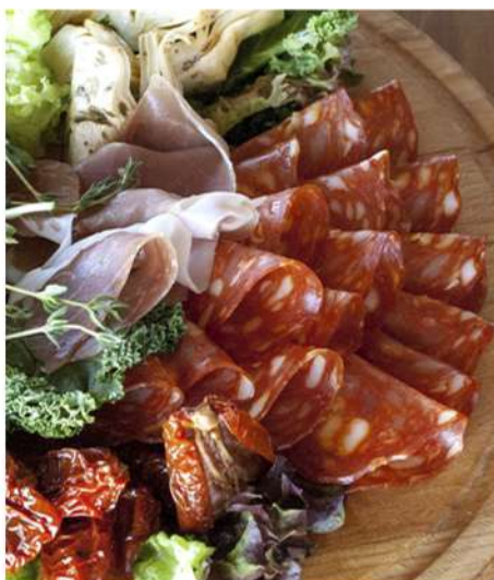
МЯСНАЯ ТАРЕЛКА "РАНЧО" (пармская ветчина, сальчичон, чоризо. Подается с вялеными томатами, артишоками и руколой с соусом трюфельный бальзамик)