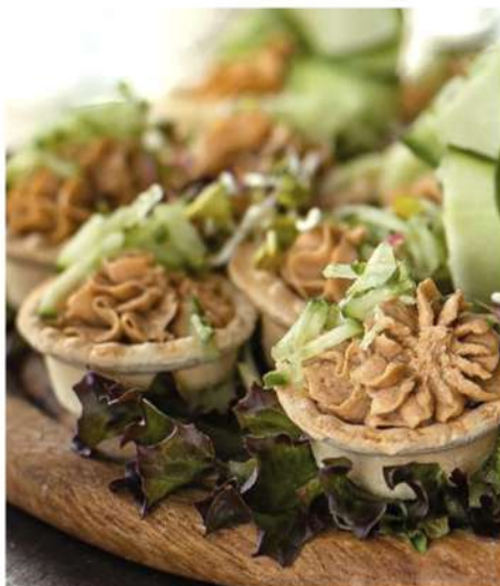
ПАШТЕТ ИЗ ИНДЕЙКИ НА КРЕКЕРЕ С ПЕРЕПЕЛИНЫМ ЯЙЦОМ