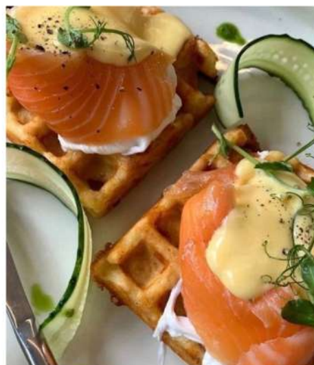
ВАФЛИ С СЁМГОЙ, АВОКАДО И КУНЖУТНЫМ СОУСОМ