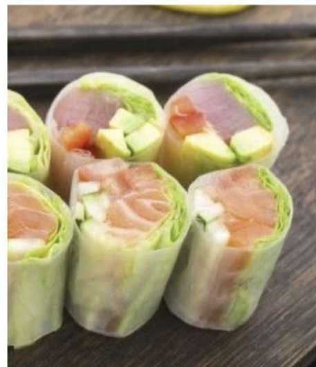
ЗАКУСКА В АЗИАТСКОМ СТИЛЕ