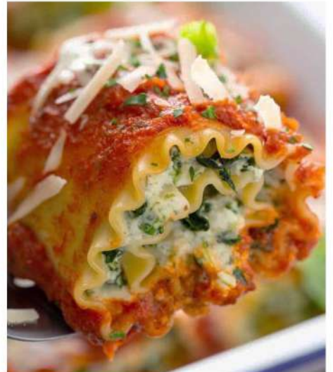
ЛАЗАНЬЯ-РОЛЛ С ГРИБАМИ, ШПИНАТОМ И СЫРОМ