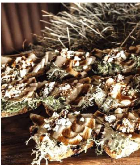
БРУСКЕТТА С ГРУШЕЙ И СЫРОМ ДОРБЛЮ