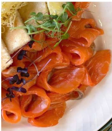
СЛАБОСОЛЕНАЯ СЕМГА С ОБЖАРЕННЫМИ КРОСТИНИ И СЛИВОЧНЫМ МАСЛОМ