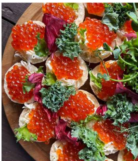
КРОСТИНИ С КРАСНОЙ ИКРОЙ И СЛИВОЧНЫМ МАСЛОМ (10 штук)