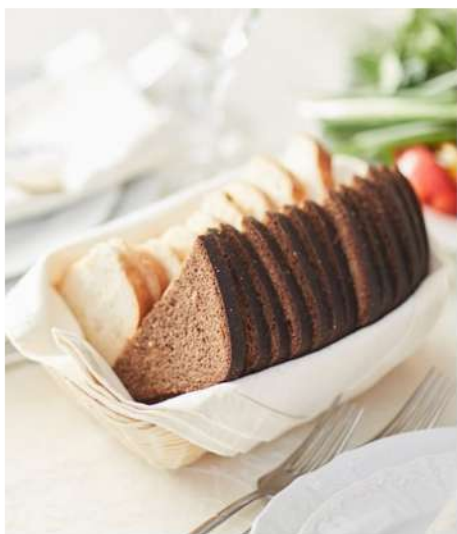
ХЛЕБНАЯ КОРЗИНКА (хлеб бородинский, багет белый)