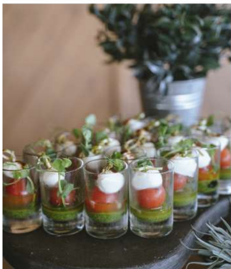
МИНИ МОЦАРЕЛЛА С ЧЕРРИ, СОУСОМ ПЕСТО И БАЗИЛИКОМ