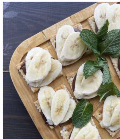
КРЕКЕР С НУТЕЛЛОЙ И БАНАНОМ