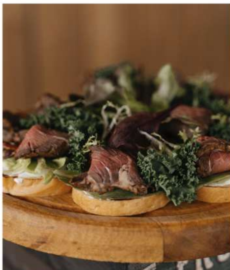
ТАПАС С РОТБИФОМ И ВЯЛЕНЫМИ ТОМАТАМИ