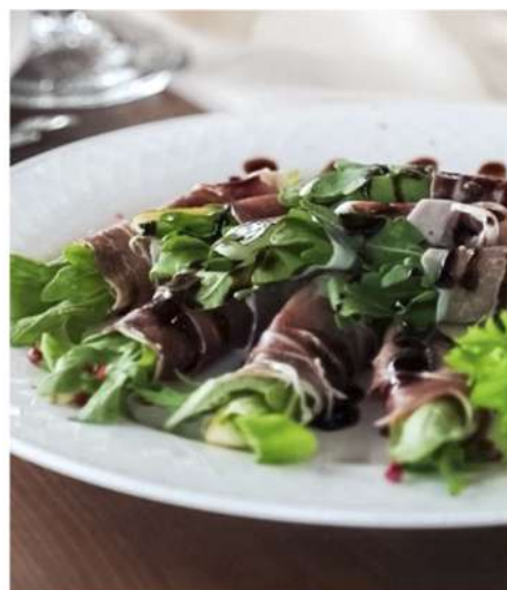
КРУДИТЕ С ГРУШЕЙ И ПАРМОЙ (8 штук)