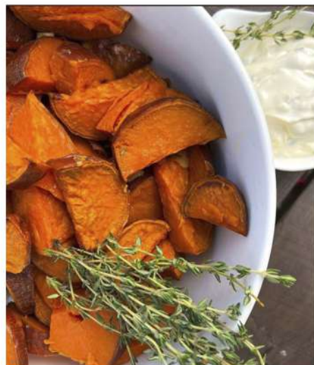
ДОЛЬКИ БАТАТА С ЧЕСНОЧНЫМ СОУСОМ