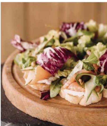
КРОСТИНИ С СЕМГОЙ, СЛИВОЧНЫМ СЫРОМ И КАПЕРСАМИ