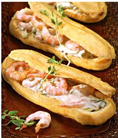
ЭКЛЕР С КРЕВЕТКОЙ И СОУСОМ ОТ ШЕФА (5 шт.)