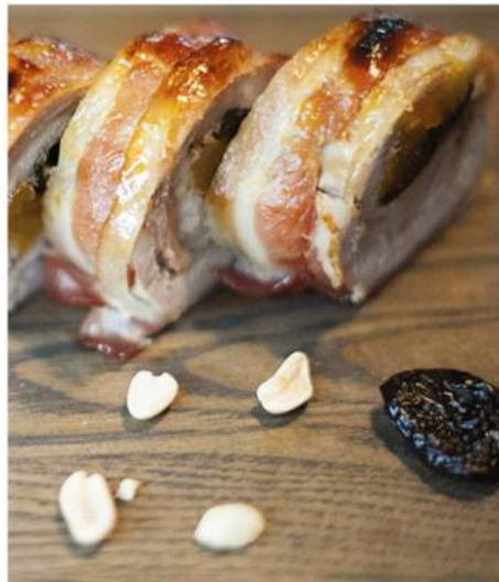
ЗАПЕЧЕННАЯ БУЖЕНИНА С СУХОФРУКТАМИ