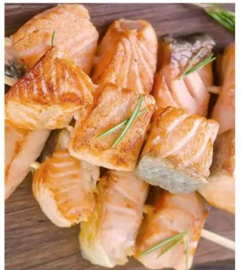
ШАШЛЫК ИЗ СЕМГИ