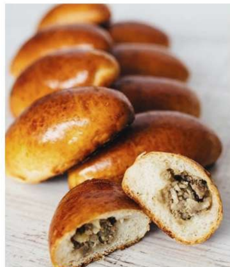
ПИРОЖКИ МИНИ (капуста, картошка, мясо, яйцо/лук)