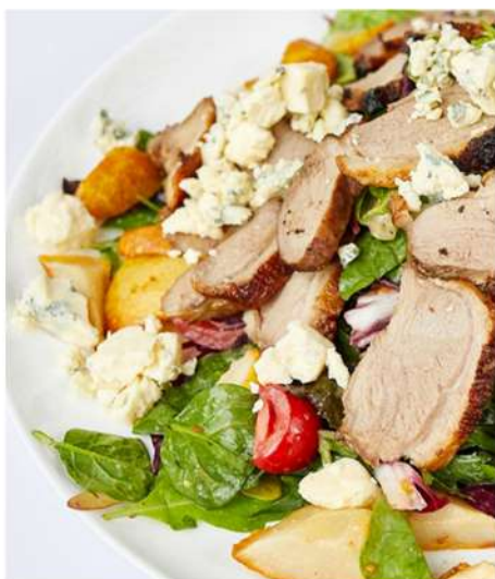
САЛАТ ИЗ УТИНОЙ ГРУДКИ С ГРУШЕЙ И СЫРОМ ДОРБЛЮ ПОД ГОРЧИЧНО-МЕДОВЫМ СОУСОМ