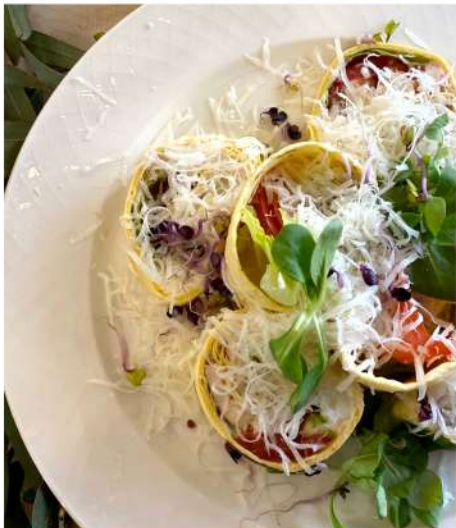
РОЛЛ С ФЕРМЕРСКИМ ЦЫПЛЕНКОМ В СОУСЕ "ЦЕЗАРЬ"