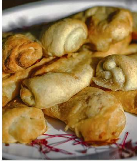
ТРУБОЧКА ИЗ СЛОЕНОГО ТЕСТА С СЕМГОЙ, ЛУКОМ ПОРЕЙ И УСТРИЧНЫМ СОУСОМ