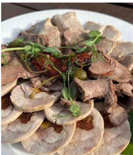
МЯСНОЕ АССОРТИ ДОМАШНЕГО ПРИГОТОВЛЕНИЯ (буженина запеченная, рулет куриный с сыром чеддер, ростбиф запеченный с пряностями)