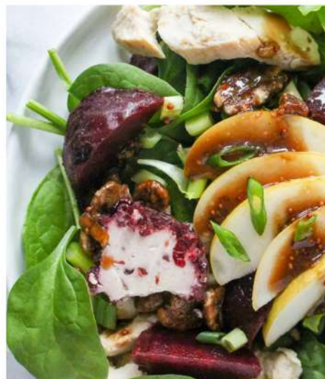
САЛАТ С КУРИНОЙ ГРУДКОЙ, СВЕКЛОЙ, ФЕТОЙ, ВЯЛЕНЫМИ ТОМАТАМИ, ГРУШЕЙ, МОЛОДЫМ ШПИНАТОМ ПОД СОУСОМ ДИЖОН И БАЛЬЗАМИК