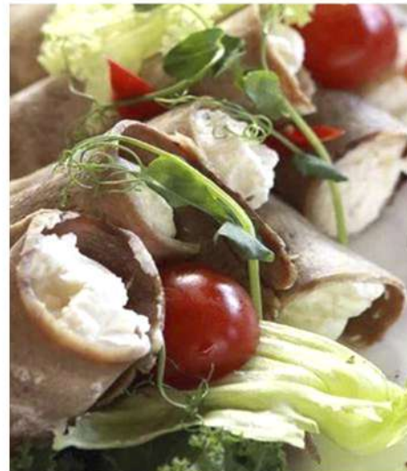
РУЛЕТКИ ИЗ ГОВЯЖЬЕГО ЯЗЫКА С МУССОМ ИЗ СЛИВОЧНОГО СЫРА И ХРЕНА