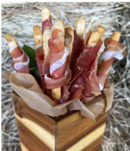
ГРИССИНИ С СЫРОВЯЛЕННЫМ ОКОРОКОМ (от 10 шт)