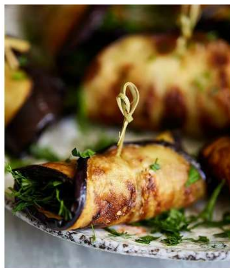
БАКЛАЖАНЫ МЯСНЫЕ С КИСЛО-СЛАДКИМ СОУСОМ