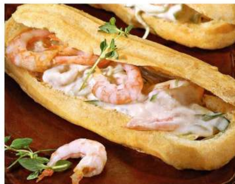
ЭКЛЕР С КРЕВЕТКАМИ И СОУСОМ ОТ ШЕФА