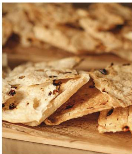
ОСТРЫЕ ЛЕПЕШКИ С ЧИЛИ ПЕРЦЕМ И ТМИНОМ