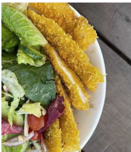
САЛАТ С ХРУСТЯЩЕЙ КУРИЦЕЙ, АВОКАДО, ЗЕЛЕНЫМ САЛАТОМ И ЗАПРАВКОЙ ДИЖОН