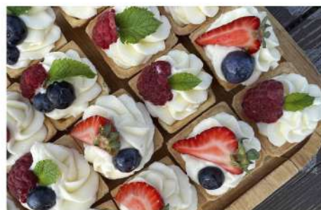
ТАРТ С КРЕМОМ И ЯГОДАМИ