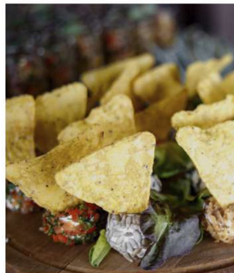
СЫРНЫЙ БОЛС С НАЧОС (с зеленью, с семечками, луком фри, болгарским перцем, кунжутом)