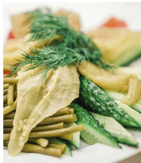
СОЛЕНЬЯ (помидоры, огурцы, перец острый, черемша, чеснок маринованный)