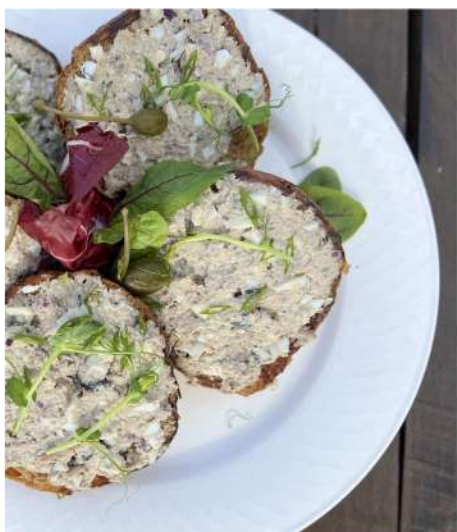
БРУСКЕТТЫ С САЛАТОМ ИЗ ШПРОТ И ИКРЫ ТРЕСКИ (5 шт.)