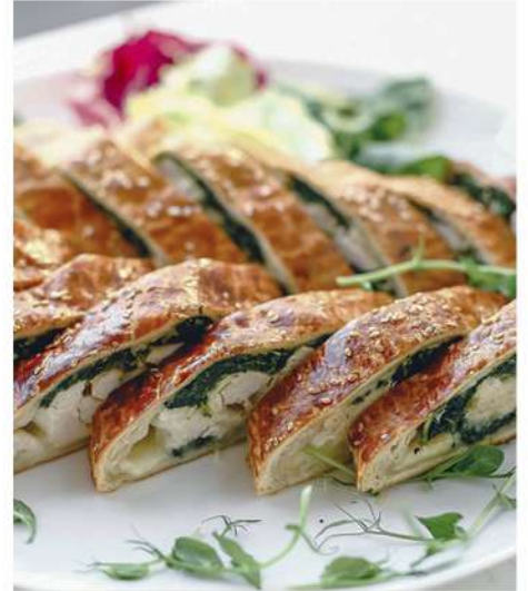
ШТРУДЕЛЬ С КУРИЦЕЙ, ШПИНАТОМ И СЫРОМ