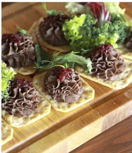
КРЕКЕР С НЕЖНЫМ КУРИНЫМ ПАШТЕТОМ И ЛУКОВЫМ КОНФИТЮРОМ