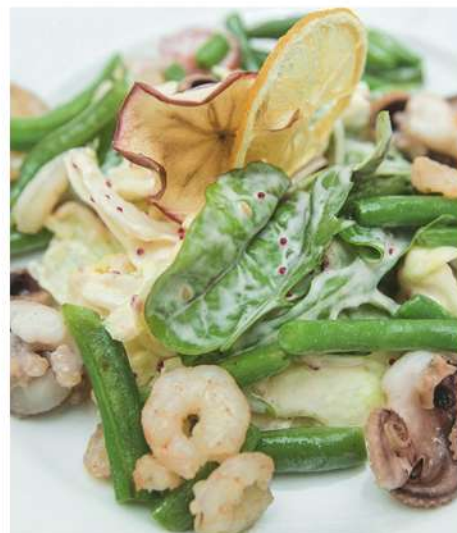
САЛАТ ИЗ МОРЕПРОДУКТОВ, МИКС САЛАТА И СОУСОМ БАЛЬЗАМИК