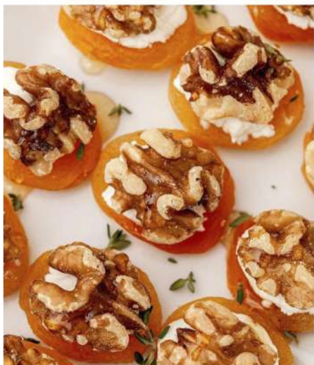
КУРАГА СО СЛИВОЧНЫМ СЫРОМ, ОРЕШКОМ И МЕДОМ