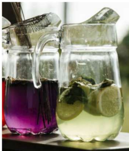
ДОМАШНИЙ ЛИМОНАД (лимон, огурец, клубника, яблоко, имбирь, лаванда)