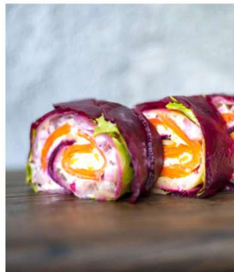
РОЛЛЫ "СЕЛЕДКА ПОД ШУБОЙ"