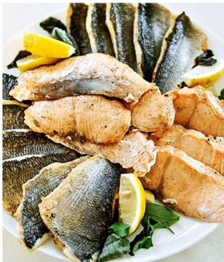
АССОРТИ РЫБ (семга, сибас, филе дорадо)