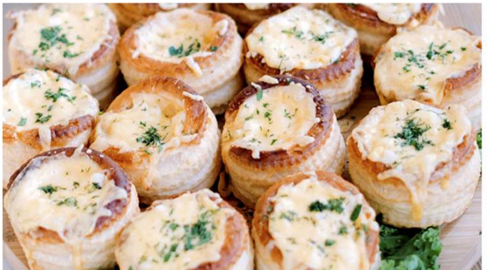
ВОЛОВАНЫ С КУРИЦЕЙ