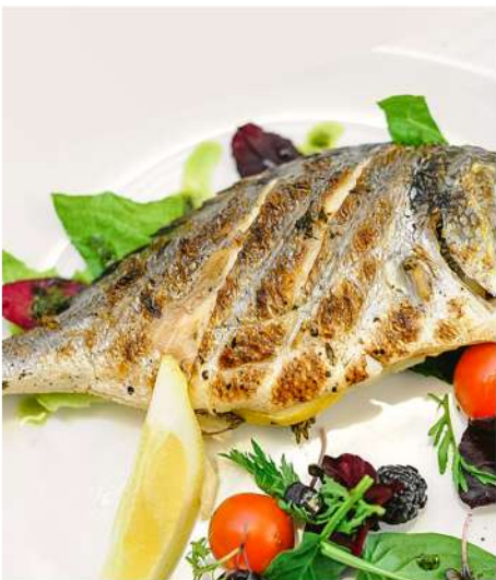
ДОРАДО НА ГРИЛЕ С ПРОВАНСКИМИ ТРАВАМИ (1 шт.)