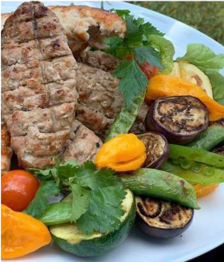
ЛЮЛЯ-КЕБАБ ИЗ БАРАНИНЫ