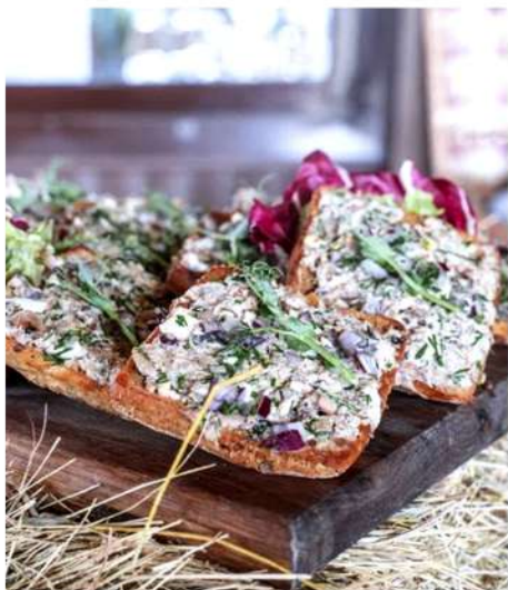
БРУСКЕТТА С САЛАТОМ ИЗ ШПРОТ И ИКРОЙ ТРЕСКИ