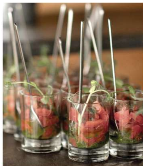
ТАРТАР ИЗ ТОМАТОВ С СОУСОМ ПЕСТО И БАЗИЛИКОМ