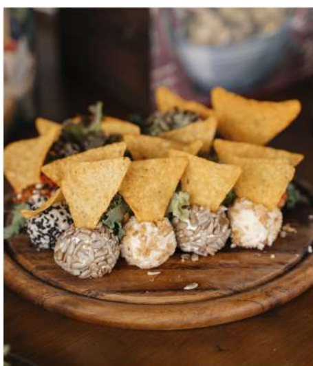
СЫРНЫЙ БОЛС С НАЧОС (с зеленью, с семечками, луком фри, болгарским перцем, кунжутном)