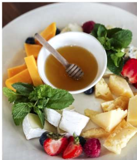
СЫРНОЕ АССОРТИ С МЁДОМ И ЯГОДАМИ (chedder, камамбер, пармизан, дорблю)