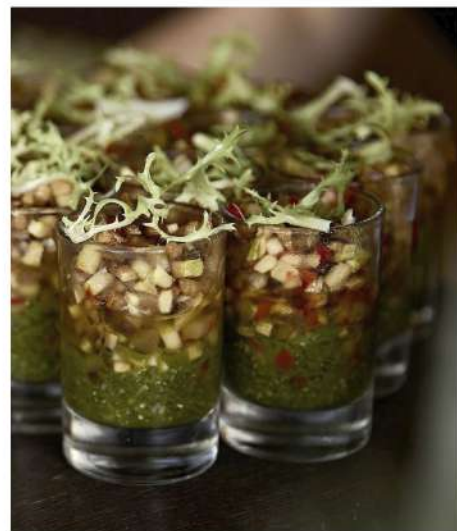
ТАРТАР ИЗ ПЕЧЕНЫХ ОВОЩЕЙ (баклажан, болгарский перец, цуккини) С СОУСОМ БАЛЬЗАМИКО