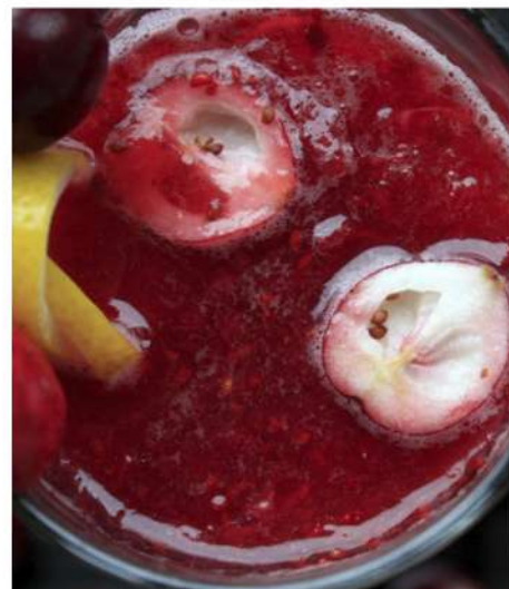
МОРС ЯГОДНЫЙ МИКС