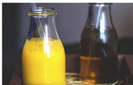
СОК (ПЭК) (яблоко, вишня, мультифрукт, апельсин, ананас, грейпфрут)