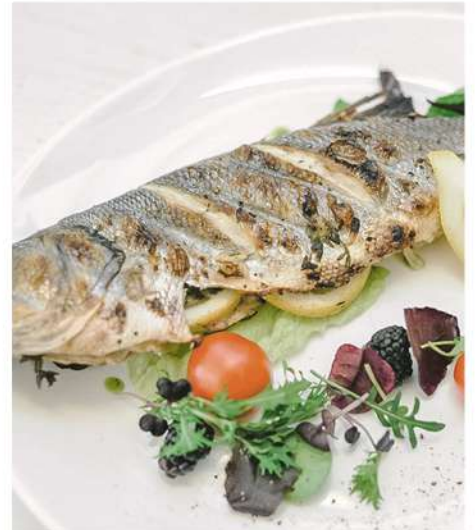
СИБАС НА ГРИЛЕ С СОУСОМ ПЕСТО (1 шт.)