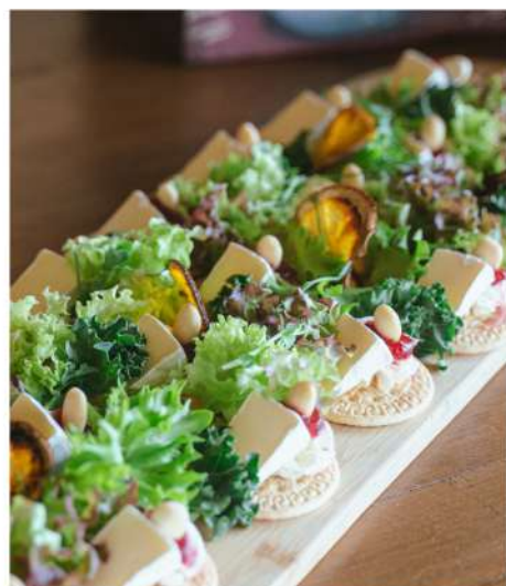
КРЕКЕР С КАМАМБЕРОМ, ДЖЕМОМ И ОРЕШКОМ.