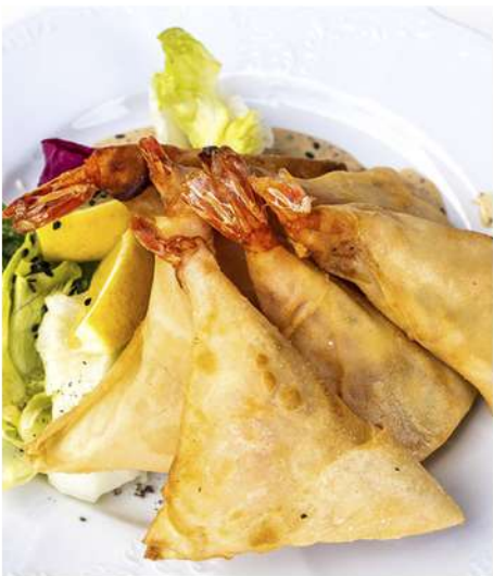
ТИГРОВЫЕ КРЕВЕТКИ В ТЕСТЕ ФИЛО С СЫРОМ ДОРБЛЮ (2 ШТ.)