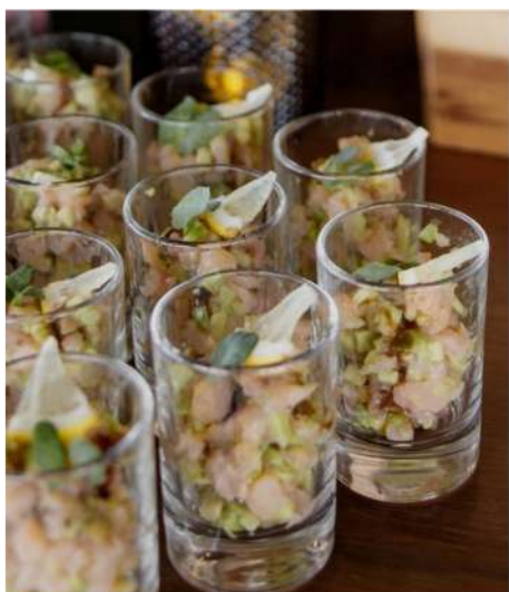
ТАРТАР ИЗ СЛАБОСОЛЕННОЙ СЕМГИ С АВОКАДО ПОД ИМБИРНЫМ СОУСОМ