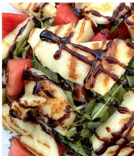
САЛАТ С ХАЛУМИ, АРБУЗОМ (ГРУША), МОЛОДЫМ ШПИНАТОМ, АВОКАДО ПОД КРЕМ БАЛЬЗАМИК