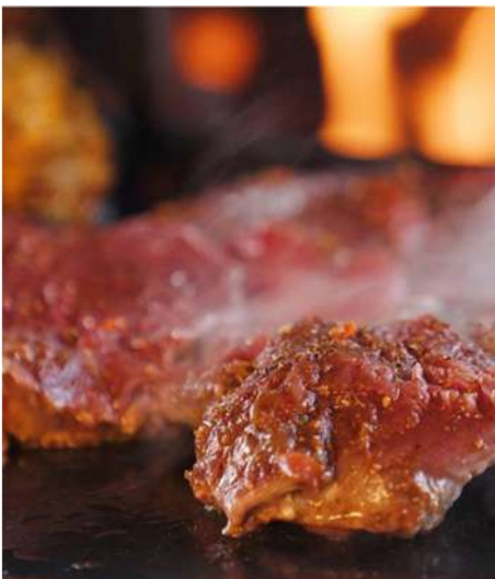
ШАШЛЫК ИЗ БАРАНИНЫ