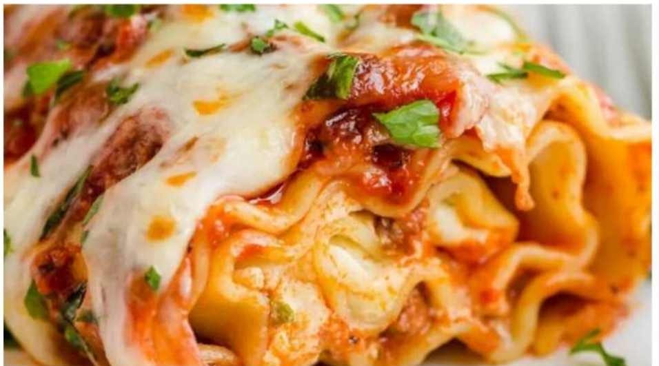
ЛАЗАНЬЯ-РОЛЛ С СОУСОМ БОЛОНЬЕЗЕ