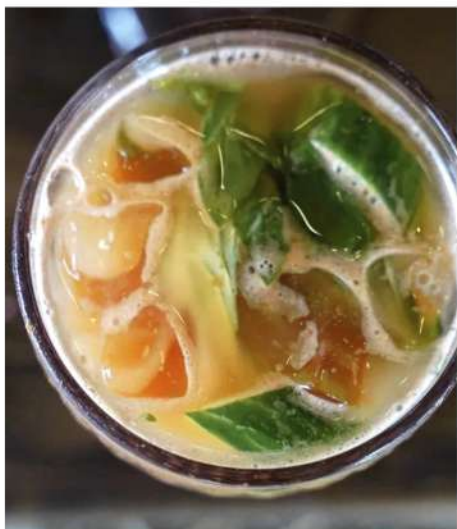
МОХИТО ЦИТРУСОВЫЙ (облепиха, апельсин, лимон, лайм)