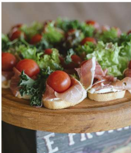
ТАПАС С СЫРОВЯЛЕННЫМ ОКОРОКОМ