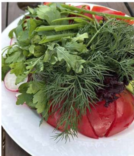
АССОРТИ ИЗ СВЕЖИХ ОВОЩЕЙ (помидоры, огурцы, перец болгарский, редис, зелень)