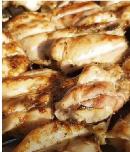
ШАШЛЫК ИЗ ЦЫПЛЕНКА