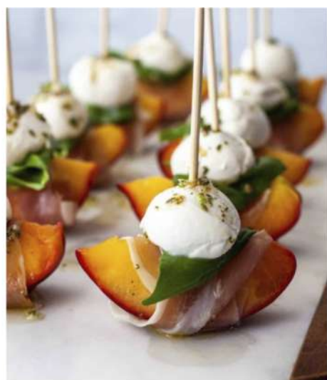
ПЕРСИК С СЫРОВЯЛЕННЫМ ОКОРОКОМ, БАЗИЛИКОМ И МИНИ МОЦАРЕЛЛОЙ