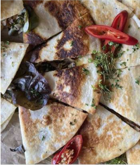
КЕСАДИЛЬЯ ИЗ КУРИЦЫ С ОВОЩАМИ (4 порции)

КЕСАДИЛЬЯ ГРИБНАЯ С СОУСОМ САЛЬСА (4 порции)