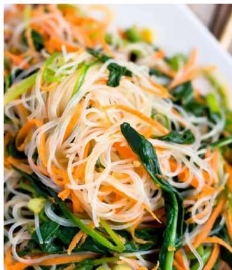
САЛАТ СО СТЕКЛЯННОЙ ЛАПШОЙ, ОВОЩАМИ, ШАМПИНЬОНАМИ И СОЕВЫМ СОУСОМ