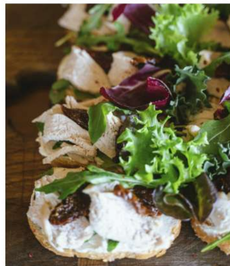
ХРУСТЯЩАЯ ЧИАБАТТА С ПОДКОПЧЕННЫМ ЦЫПЛЕНКОМ И ВЯЛЕННЫМИ ТОМАТАМИ