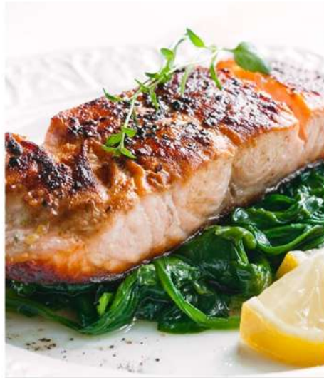
СТЕЙК ИЗ СЕМГИ С ОБЖАРЕННЫМ ШПИНАТОМ 150/100