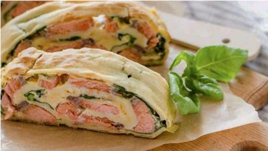
ШТРУДЕЛЬ С СЕМГОЙ И БРОККОЛИ