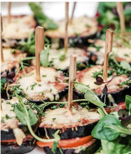
БАКЛАЖАНЫ ЗАПЕЧЕННЫЕ С СЫРОМ