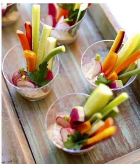
КРУДИТЕ С ХУМУСОМ (огурец, сельдерей, морковь, перец сладкий)