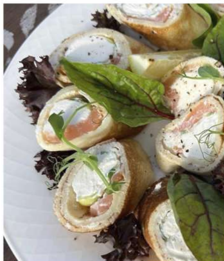
ДОМАШНИЕ БЛИНЫ С СЕМГОЙ И СЛИВОЧНЫМ СЫРОМ