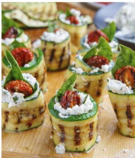
ЦУКИНИ С ВЯЛЕННЫМИ ТОМАТАМИ И БРЫНЗОЙ