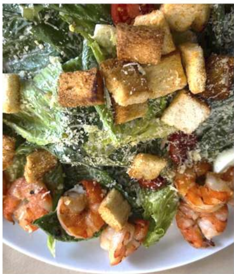
ЦЕЗАРЬ С КОРОЛЕВСКИМИ КРЕВЕТКАМИ