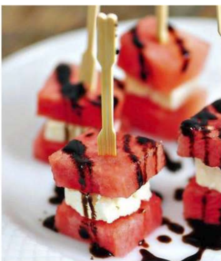
АРБУЗ С ФЕТОЙ И МЯТОЙ