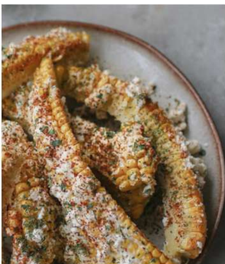
ЗАПЕЧЕНАЯ КУКУРУЗА С ЧЕСНОЧНЫМ СОУСОМ