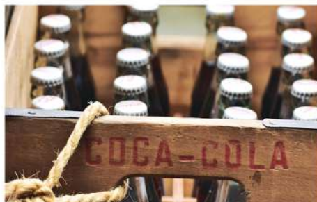
КОЛА, СПРАЙТ, ФАНТА (ПЭТ/СТЕКЛО)