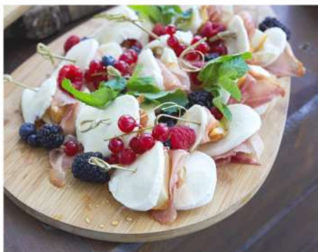
МОЦАРЕЛЛА С САХАРНОЙ ГРУШЕЙ И СЫРОВЯЛЕННЫМ ОКОРОКОМ