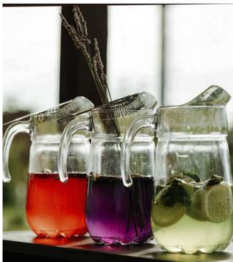
ДОМАШНИЙ ЛИМОНАД (лимон, огурец, клубника, яблоко, имбирь, лаванда)