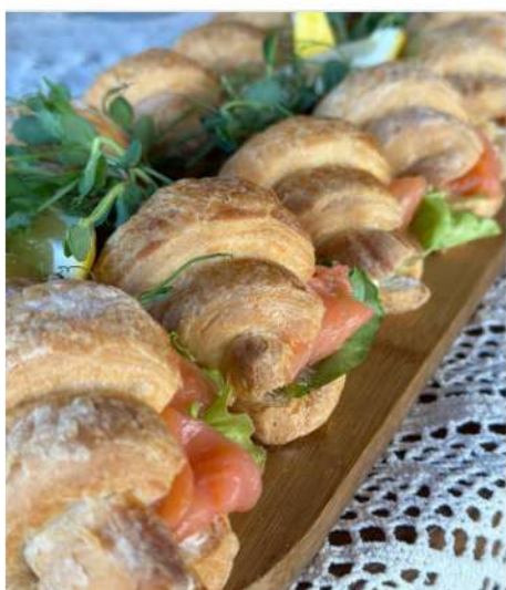
МИНИ КРУАССАН С СЁМГОЙ