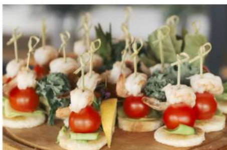
КАНАПЕ ИЗ КРЕВЕТОК С АВОКАДО И ПОМИДОРАМИ ЧЕРРИ