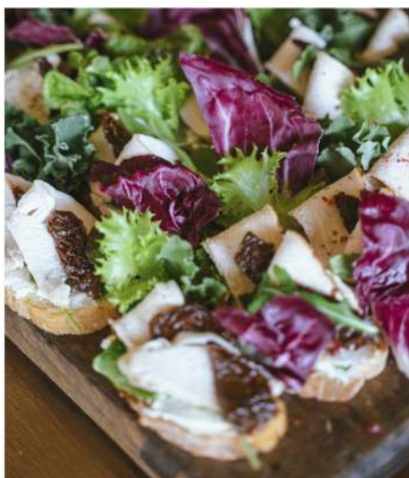
ХРУСТЯЩАЯ ЧИАБАТТА С КОПЧЕНЫМ ЦЫПЛЕНКОМ И ВЯЛЕНЫМИ ТОМАТАМИ (5 штук)