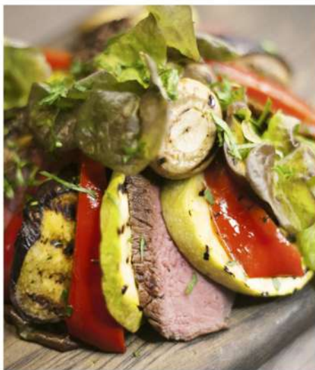
ТЕПЛЫЙ САЛАТ ИЗ ГОВЯДИНЫ ГРИЛЬ И БАКЛАЖАНОВ