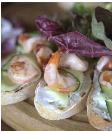
БРУСКЕТТА С КРЕВЕТКАМИ И ОГУРЦОМ В СТИЛЕ РАНЧО