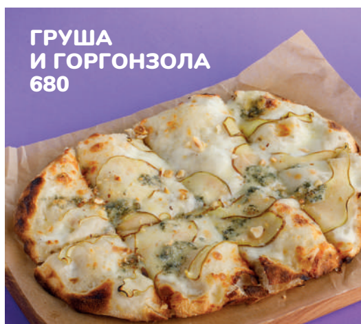
ГРУША И ГОРГОНЗОЛА 680