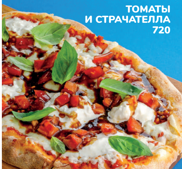
ТОМАТЫ И СТРАЧАТЕЛЛА 720