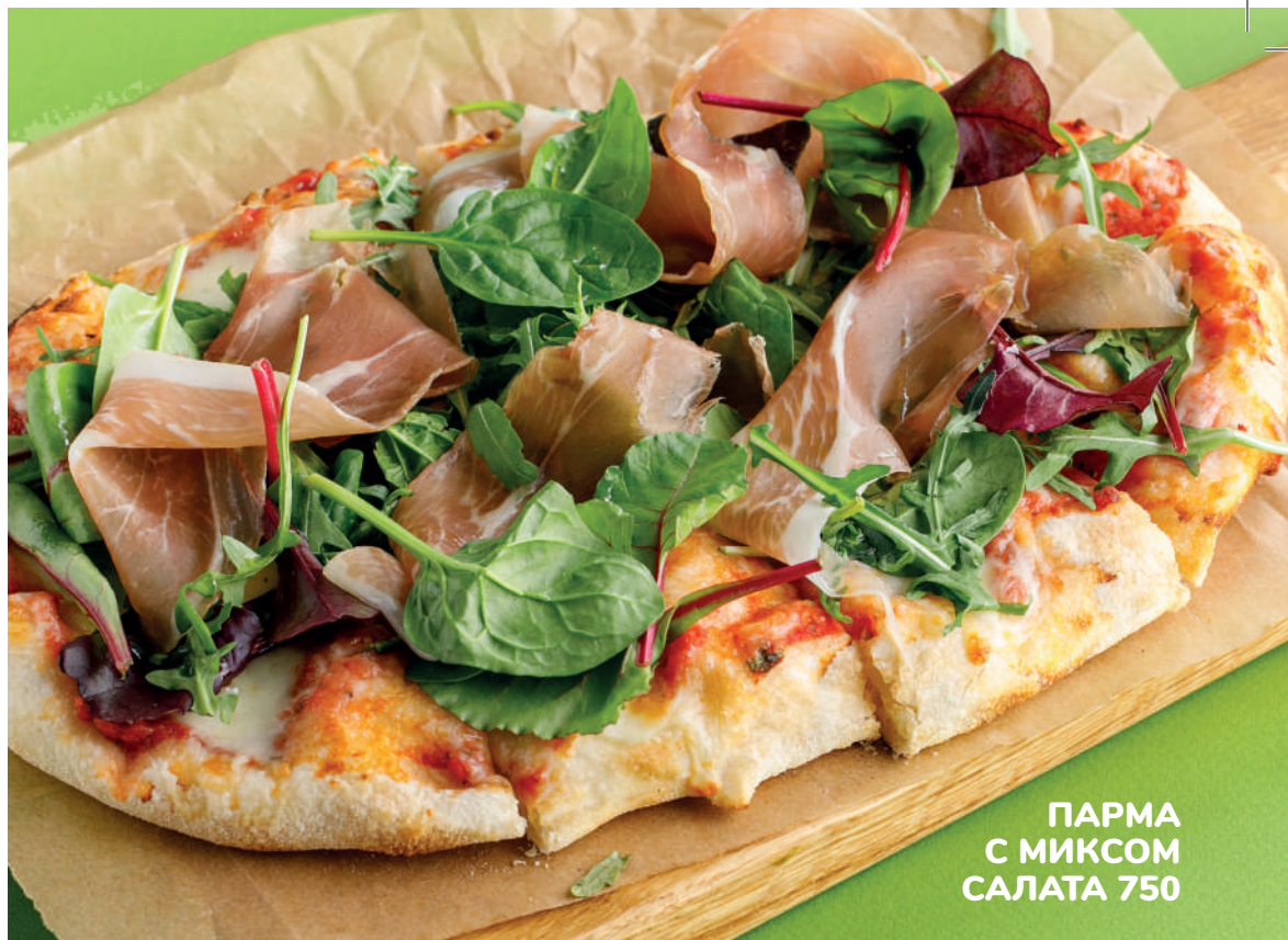
ПАРМА С МИКСОМ САЛАТА 750