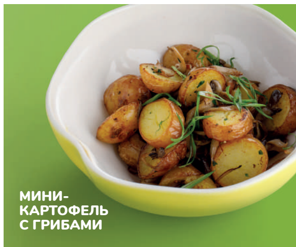
МИНИ-КАРТОФЕЛЬ С ГРИБАМИ