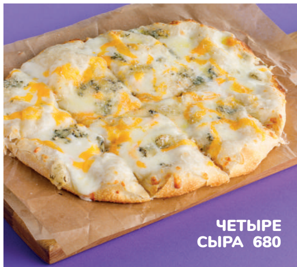
ЧЕТЫРЕ СЫРА 680