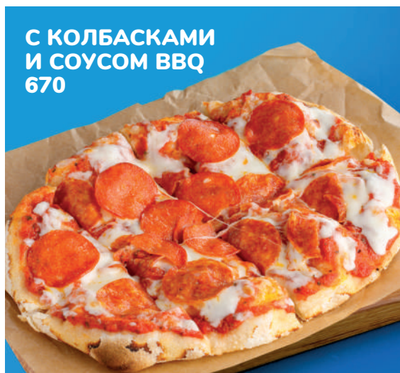
С КОЛБАСКАМИ И СОУСОМ BBQ 670