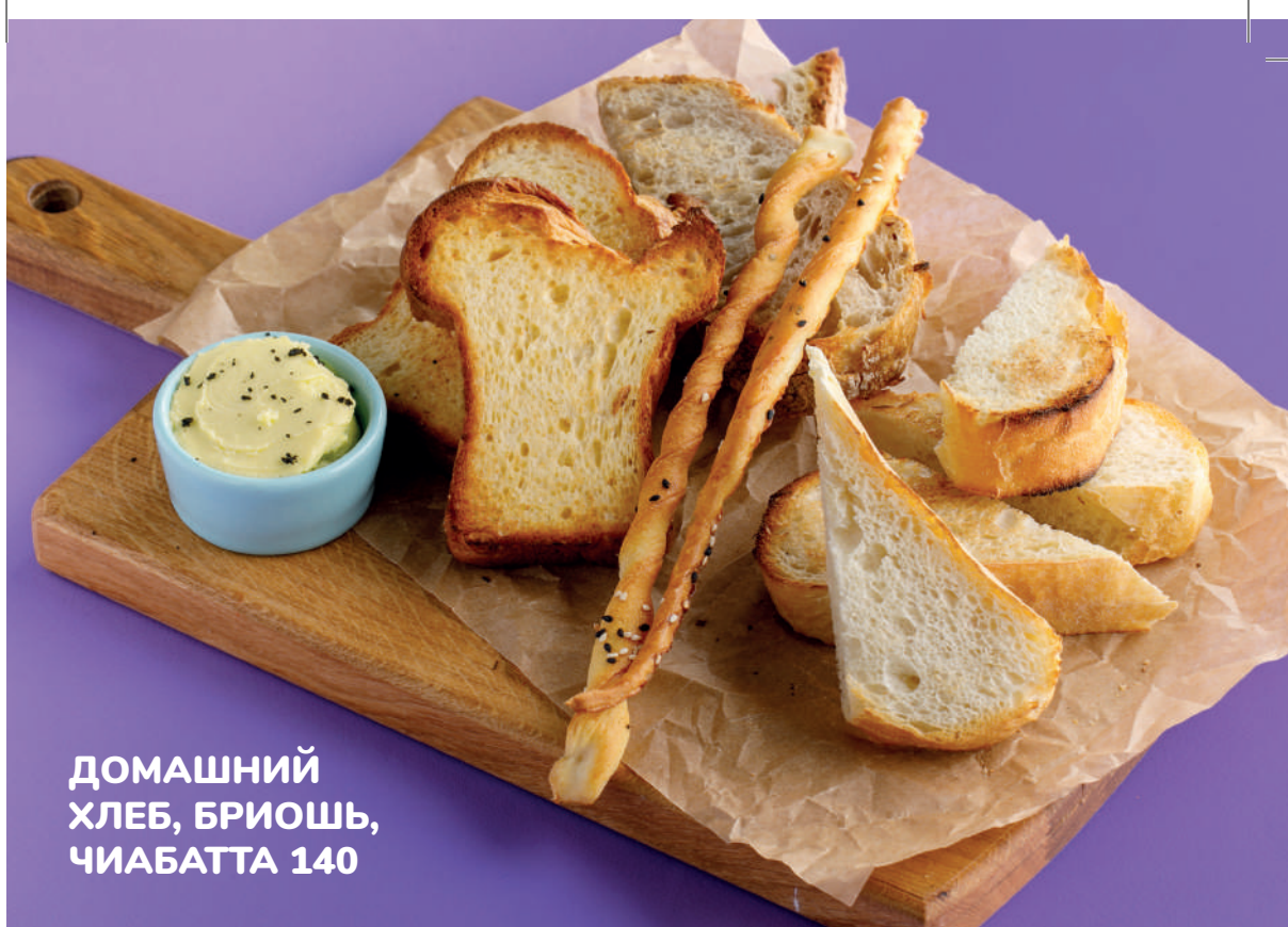
ДОМАШНИЙ ХЛЕБ, БРИОШЬ, ЧИАБАТТА 140