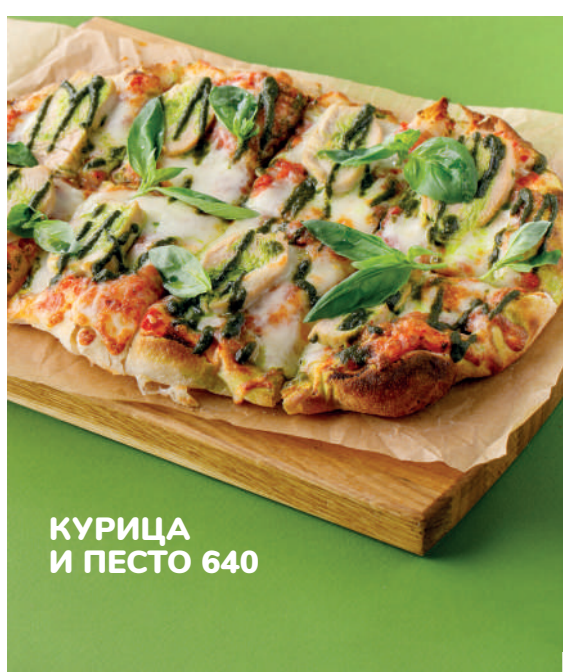
КУРИЦА И ПЕСТО 640