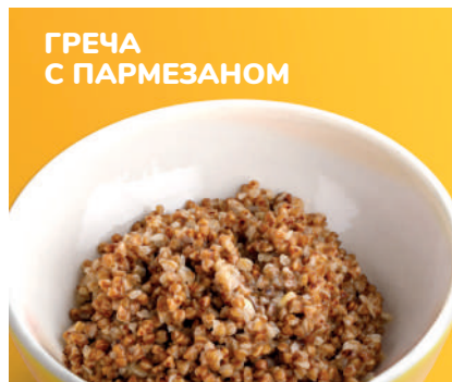
ГРЕЧА С ПАРМЕЗАНОМ