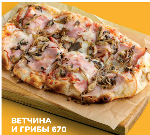
ВЕТЧИНА И ГРИБЫ 670