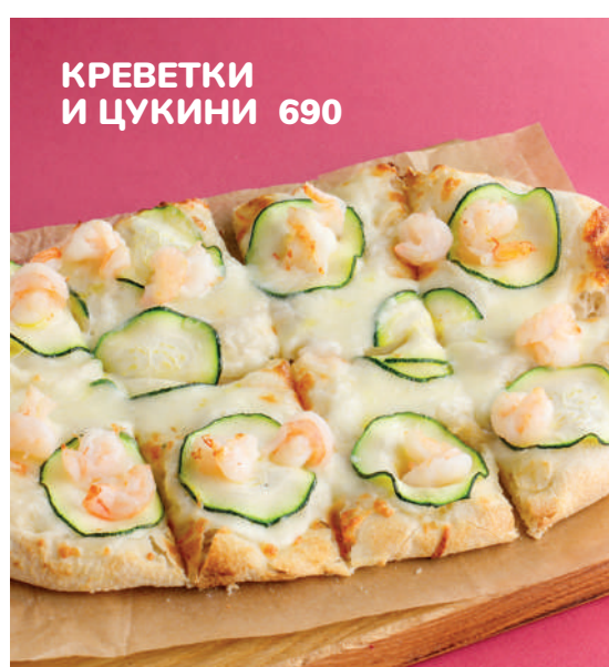
КРЕВЕТКИ И ЦУКИНИ 690