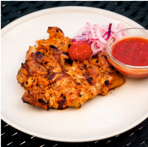
Стейк из бедра цыпленка на гриле (куриное бедро без кости, шашлычный соус, маринованный лук) 240 г 549р.