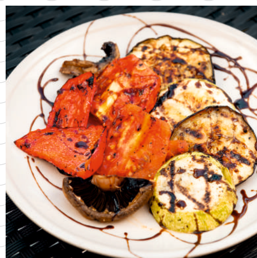
Овощи на гриле (перец болгарский, баклажаны, кабачок, шампиньоны, томаты, лук красный) 200 г 499р.

Обращаем Ваше внимание, что при обслуживании на летней веранде в счет включается наценка 5% за обслуживание.