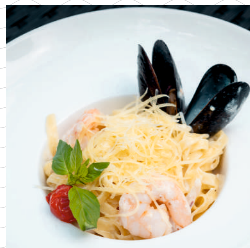
Паста с морепродуктами 320 г 569р.

Обращаем Ваше внимание, что при обслуживании на летней веранде в счет включается наценка 5% за обслуживание.