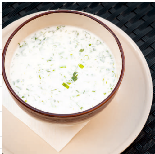
Окрошка домашняя 300 г 389р.