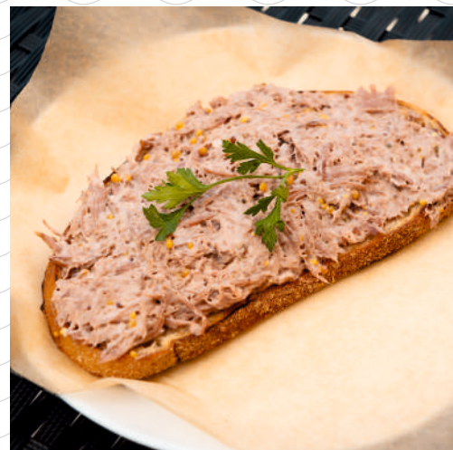
Сморреброд с говяжьей домашней тушёнкой (говядина, горчица зернистая, майонез, воздушный хлеб, редиска, огурец) 120 г 386р.