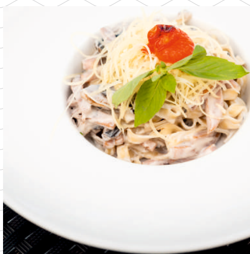
Тальятелли с ветчиной и грибами (паста тальятелли, сливки, ветчина из индейки, «Пармезан», томаты черри, грибы) 320 г 479р.