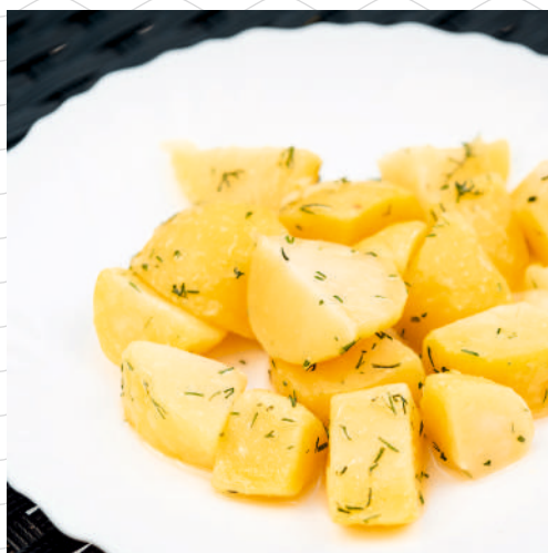
Картофель отварной с зеленью и сливочным маслом 180 г 269р.