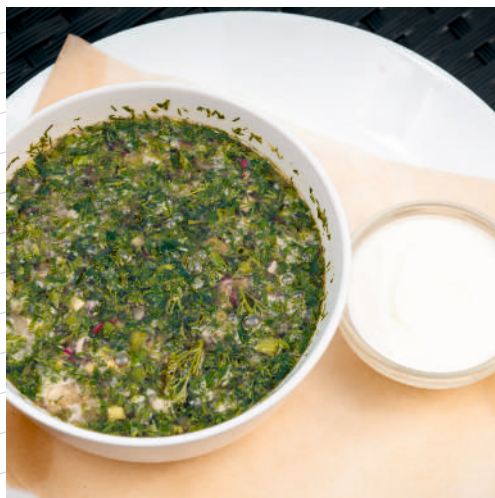
Окрошка на квасе 300 г 389р.