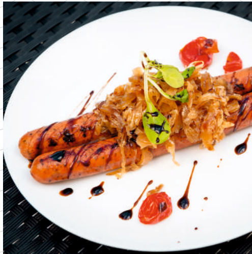
Колбаски из баранины (2 шт.)