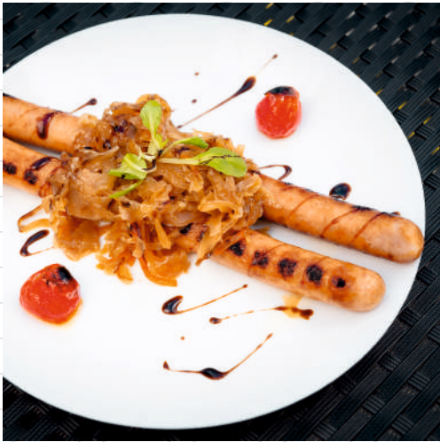
Колбаски куриные (2 шт.)