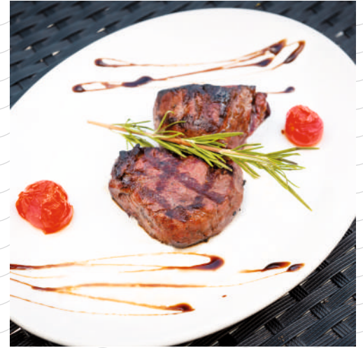
Медальоны из сочной говяжьей вырезки (подаются с томатно-шашлычным соусом и маринованным луком) 220 г 590р.