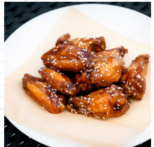
Крылышки (куриные крылышки, терияки, кунжут) 300 г 489р.

Обращаем Ваше внимание, что при обслуживании на летней веранде в счет включается наценка 5% за обслуживание.