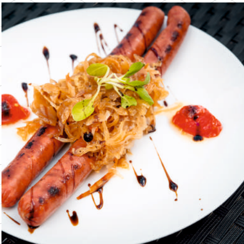
Колбаски говяжьи (2 шт.)