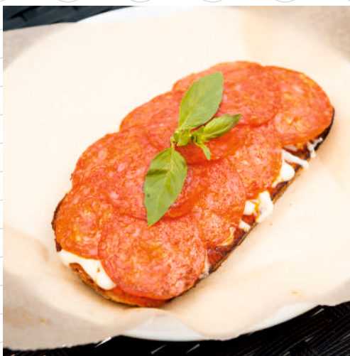
Сморреброд с пепперони (темный воздушный хлеб, томатный соус, сыр «Моцарелла», колбаса «Пепперони») 120 г 299р.