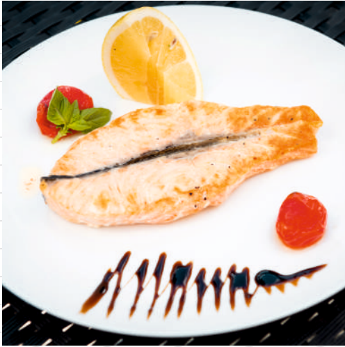
Стейк из лосося на гриле 180 г 650р.