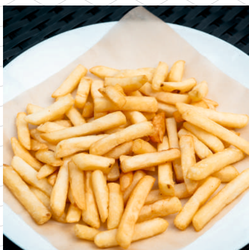
Картофель фри (картофель фри, обжаренный во фритюре с золотистой корочкой) 150 г 319р.