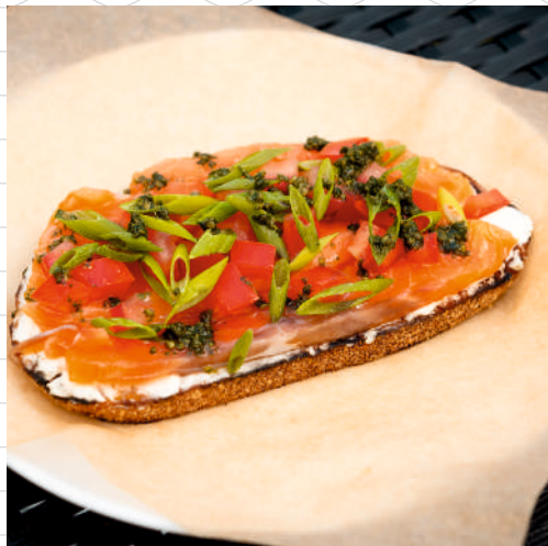
Сморреброд с лососем и сыром (темный воздушный хлеб, сыр «Креметте», слабосоленый лосось, томаты, лук зеленый) 120 г 386р.