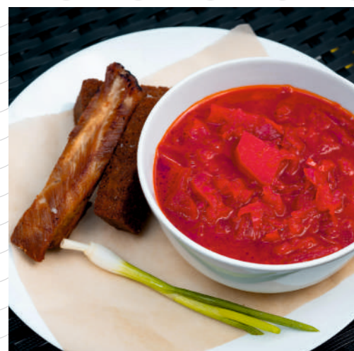
Борщ на свиных рёбрышках с чесночными гренками 300/40/20 г 389р.