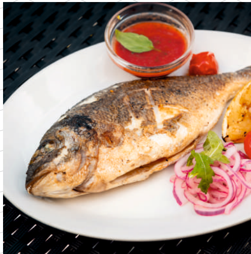
Дорадо на гриле (подаётся с соусом из маслин и оливок, с долькой лимона) 300/350 г 899р.