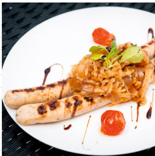
Колбаски баварские (2 шт.)