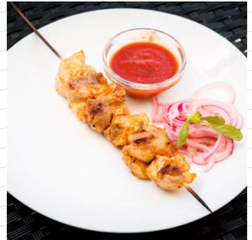
Шашлык из мяса цыпленка (куриное бедро, соус шашлычный, маринованный лук) 220 г 549р.

Обращаем Ваше внимание, что при обслуживании на летней веранде в счет включается наценка 5% за обслуживание.