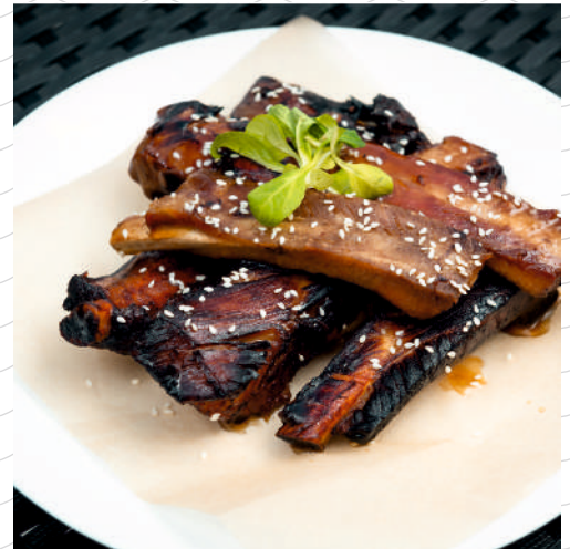
Ребрышки поросёнка терияки 300 г 799р.