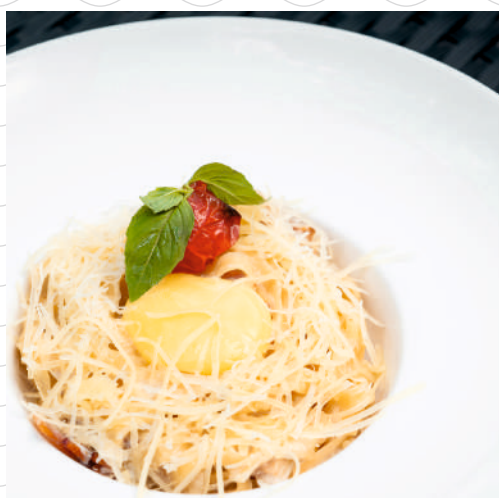
Паста тальятелли карбонара (паста тальятелли, сливки, бекон, желток, «Пармезан», томаты черри) 320 г 469р.