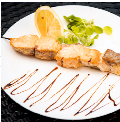
Шашлык из филе семги (соус «Наршараб», долька лимона) 180 г 710р.