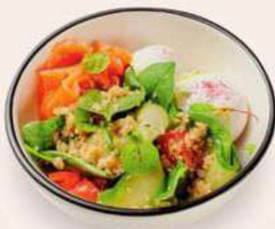
BREAKFAST BOWL ЗДРАСТЕ 549.-

Сбалансированный и полезный завтрак — боул из двух яиц пашот, слайсов огурца, сочных томатов, киноа и листьев шпината. Заправка из сока лайма и оливкового масла.