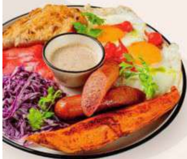
БОЛЬШОЙ ЗАВТРАК 699.-

ЗАВТРАКИ САЛАТЫ ЗАКУСКИ ВАФЛИ СУПЫ ГОРЯЧЕЕ ПОКЕ ПИЦЦА