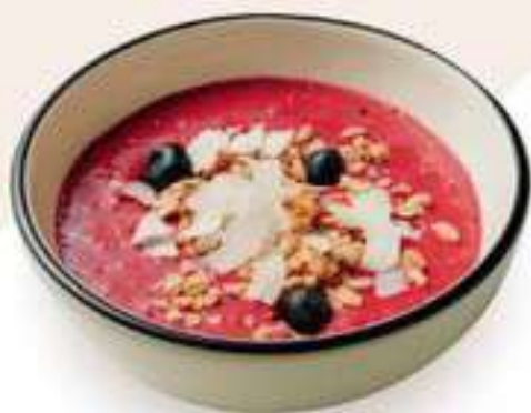
СМУБОЛ ЯГОДНЫЙ 399.-

Сбалансированный и полезный завтрак — боул из двух яиц пашот, слайсов огурца, сочных томатов, киноа и листьев шпината. Заправка из сока лайма и оливкового масла.