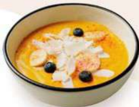
МАНГО БАЛИ-БЭЙ 429.-

Банан, ягода, клубника, миндальное молоко, гранола, чипсы кокосовые, голубика.