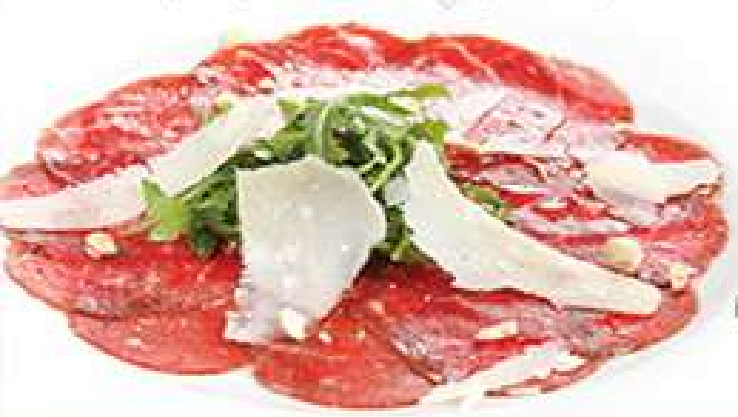
КАРПАЧЧО ИЗ МРАМОРНОЙ ГОВЯДИНЫ