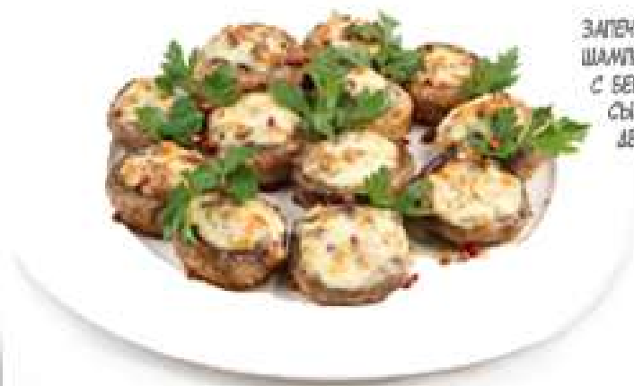
ЗАПЕЧЕННЫЕ ШАМПИньОНЫ С БЕКОНОМ И СЫРОМ ДВОЙНАЯ ПОРЦИЯ