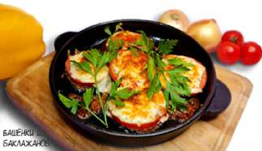
БАШЕНКИ ИЗ БАКЛАЖАНОВ