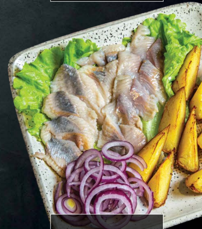
Сельдь с картошкой и ароматным луком 300 гр -350-