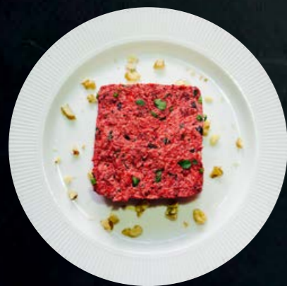
Пхали из свеклы с капустой 160 гр -350-