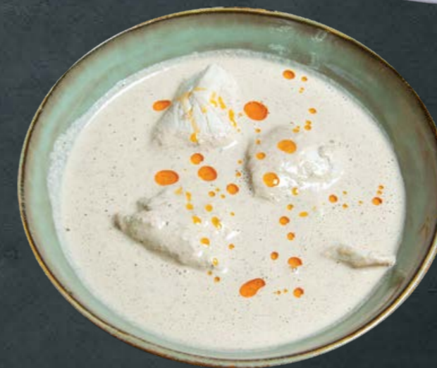
Сациви из курицы 250 гр -420-