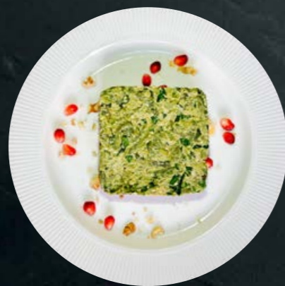
Пхали из стручковой фасоли (с орехами и специями) 160 гр -350-