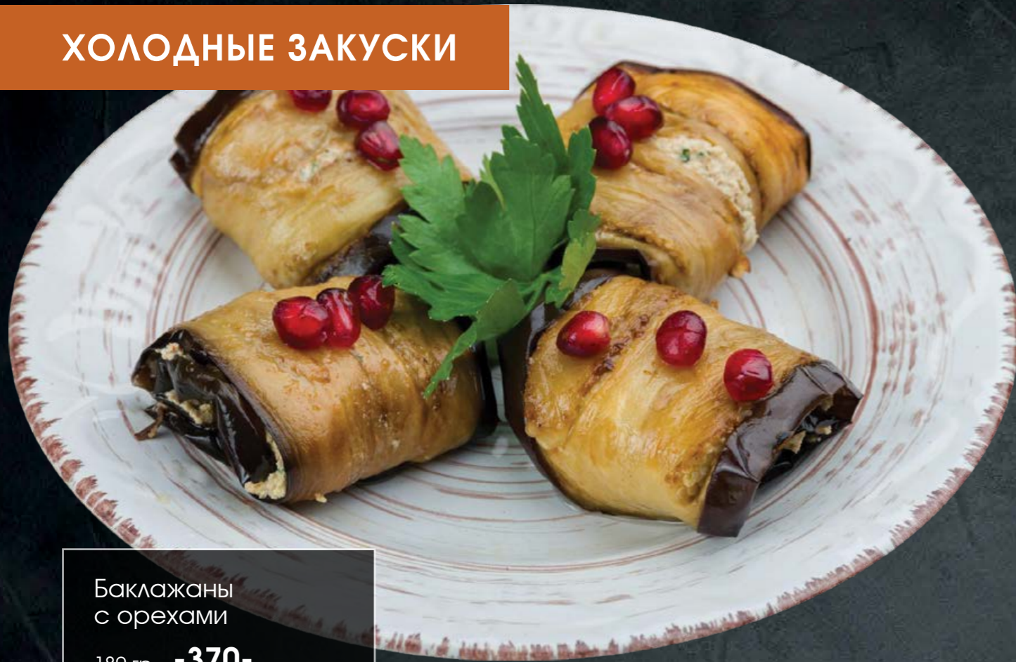
Баклажаны с орехами 180 гр -370-