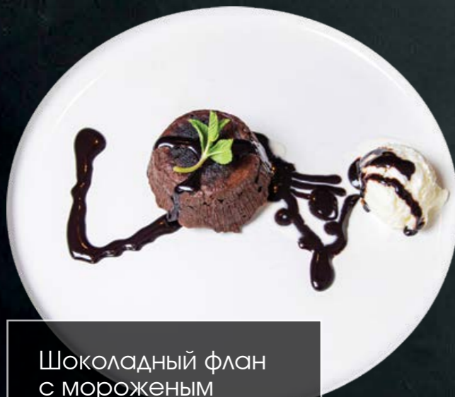
Шоколадный флан с мороженым