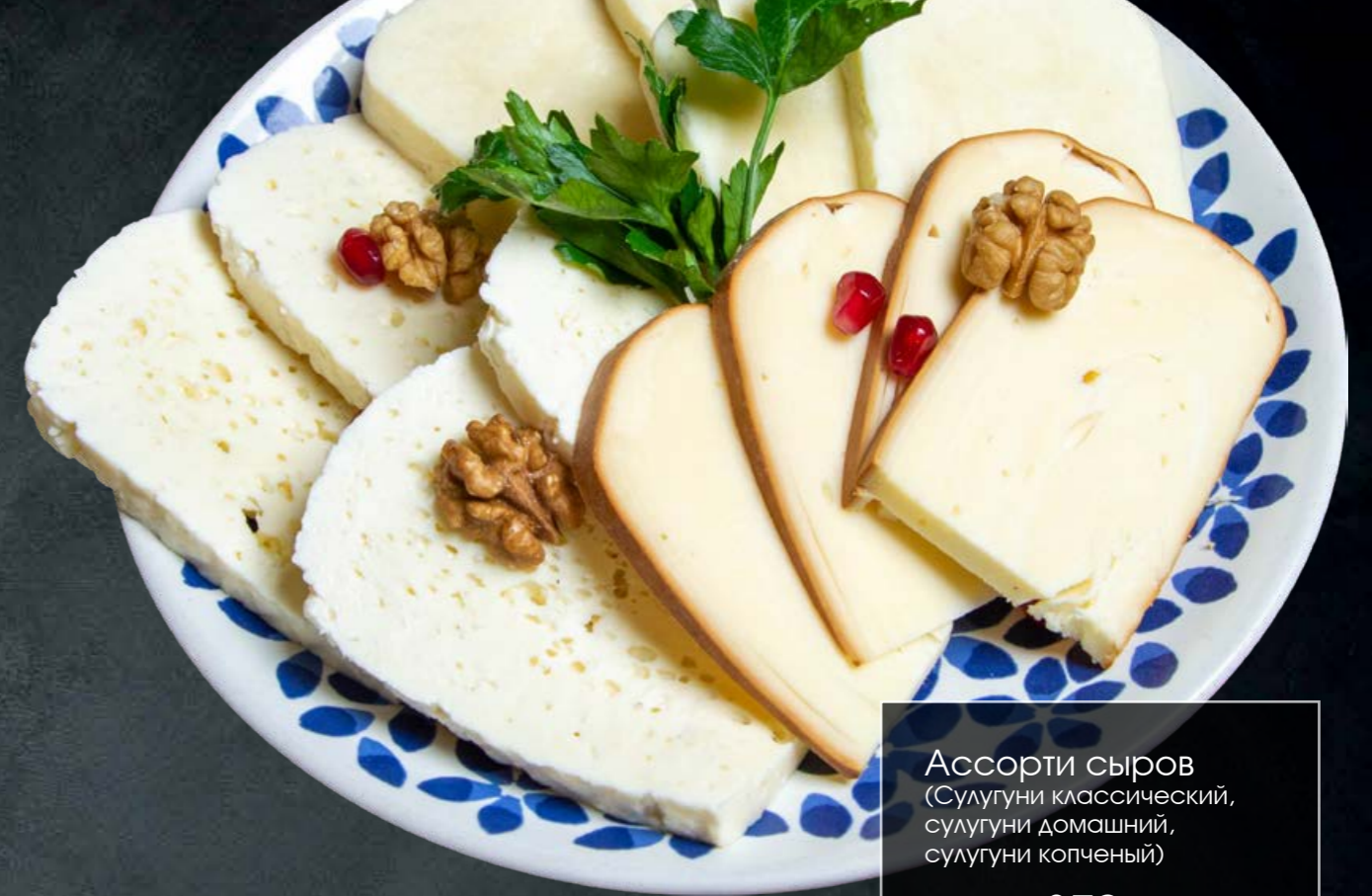
Ассорти сыров (Сулугуни классический, сулугуни домашний, сулугуни копченый) 180 гр -370-