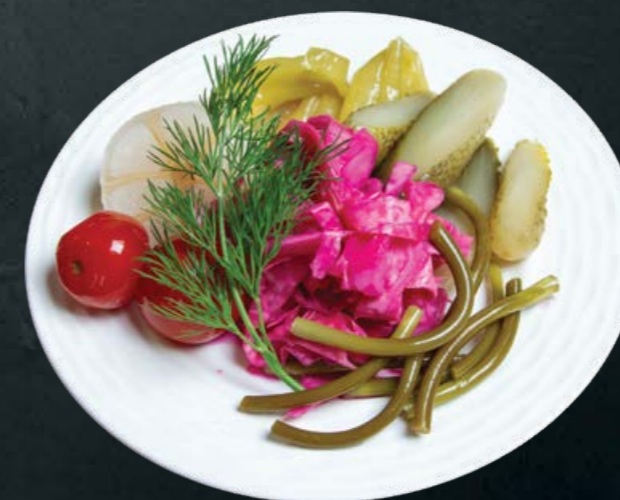
Соленья ассорти 250 гр -330- (огурцы, помидоры, чеснок, острый перец)