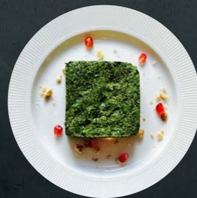
Пхали из шпината 160 гр -350-