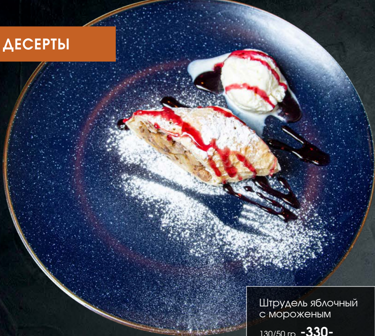
Штрудель яблочный с мороженым