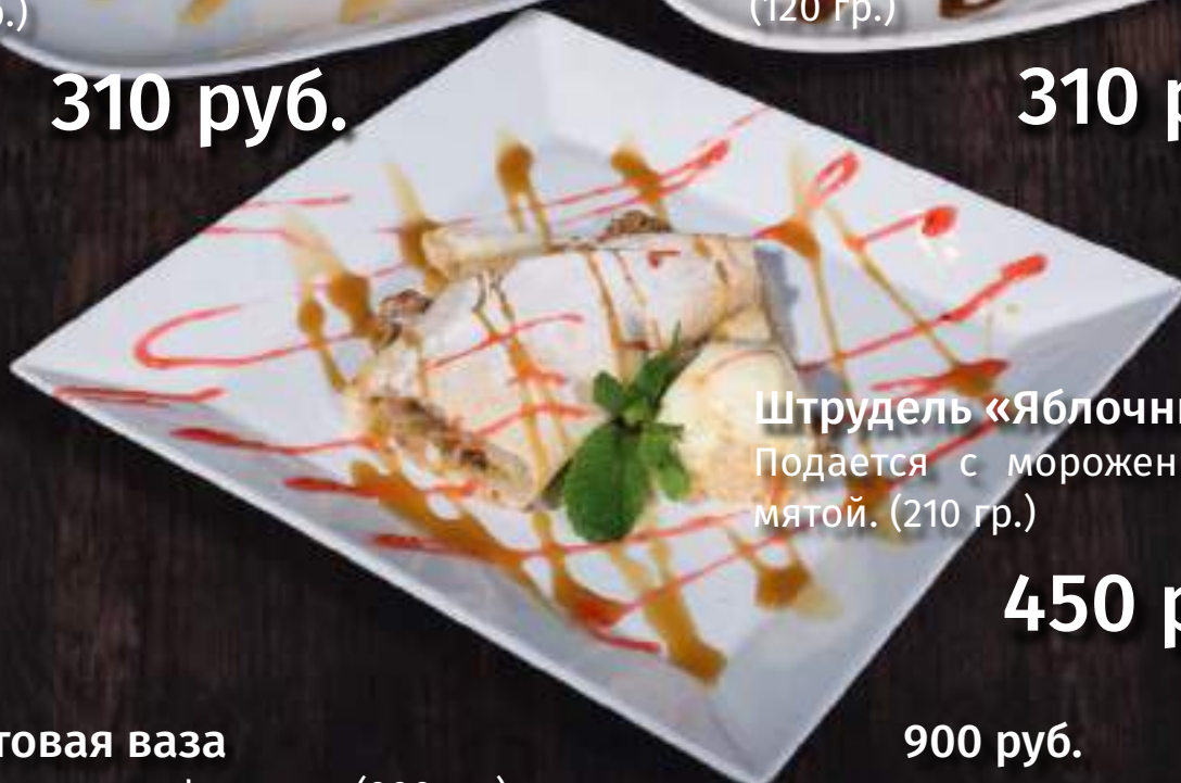
Штрудель «Яблочный» Подается с мороженым и мятой. (210 гр.)