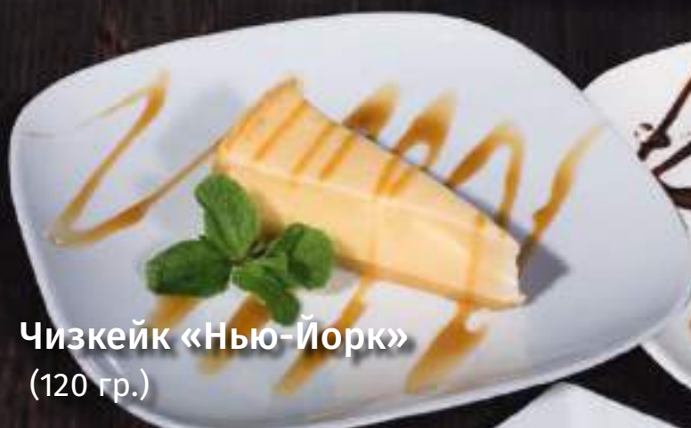
Чизкейк «Нью-Йорк» (120 гр.)