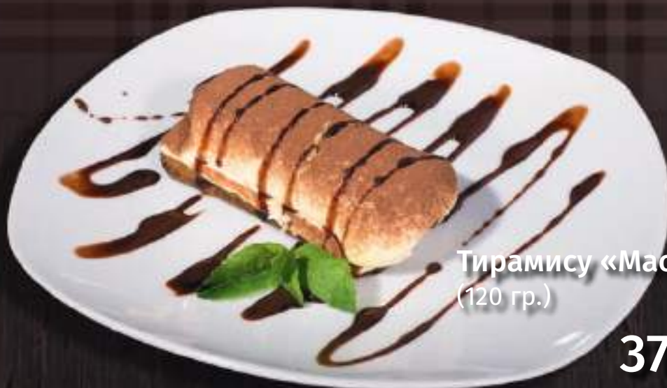
Тирамису «Маскарпоне» (120 гр.)