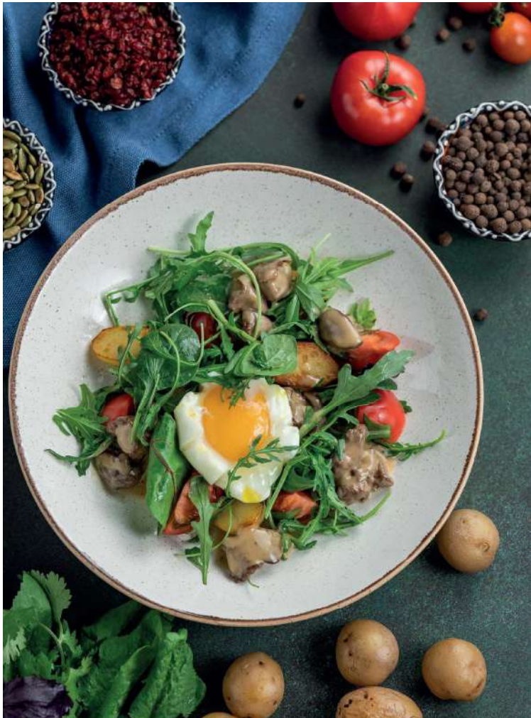
САЛАТ С ПЕЧЕНЬЮ И ЯЙЦОМ ПАШОТ