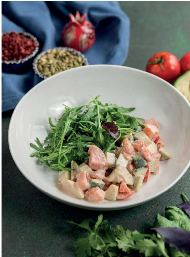
САЛАТ С КОПЧЁНЫМ ЛОСОСЕМ И АВОКАДО