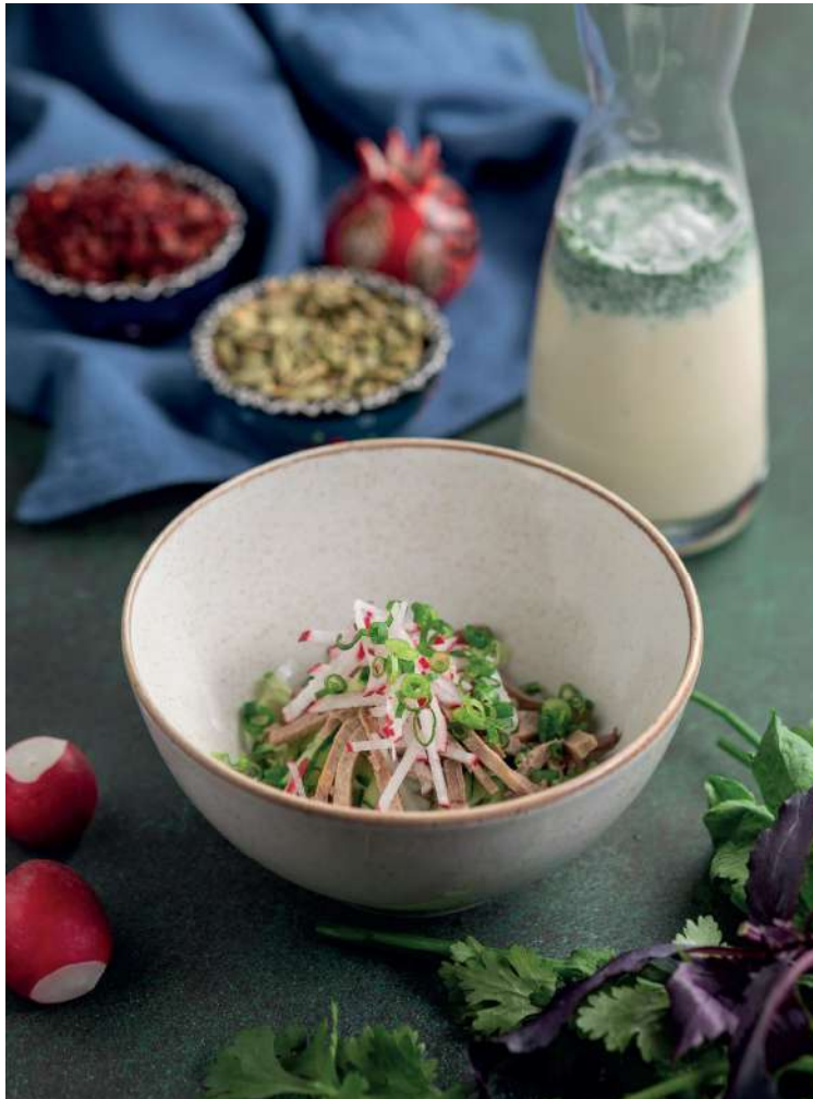
ОКРОШКА НА КВАСЕ/МАЦОНИ