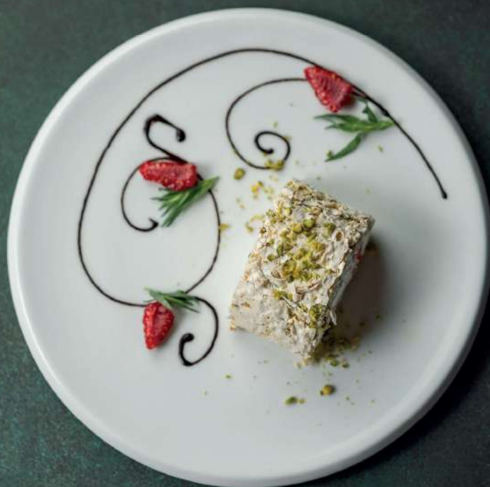
ФИСТАШКОВЫЙ РУЛЕТ С МАЛИНОЙ