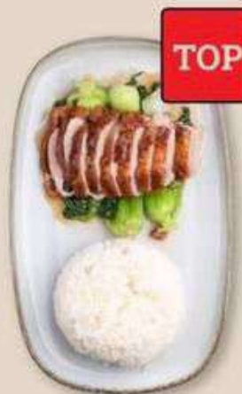
УТКА ПО-ГОНКОНСКИ С РИСОМ