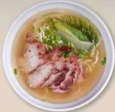
СУП-ЛАПША СО СВИНИНОЙ ЧА ШАО