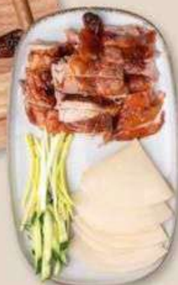
УТКА ПО-ПЕКИНСКИ 1/4