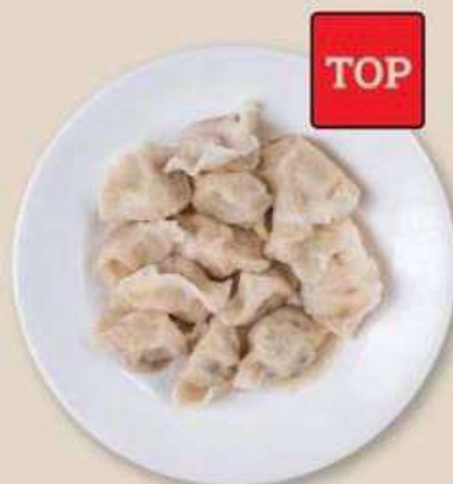
КИТАЙСКИЕ ПЕЛЬМЕНИ С ГОВЯДИНОЙ