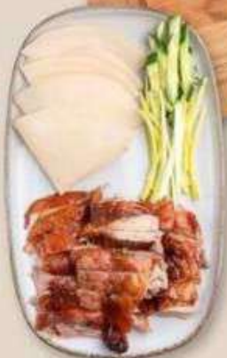
УТКА ПО-ПЕКИНСКИ 1/2