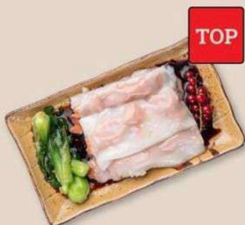
РИСОВЫЕ БЛИНЧИКИ СО СВИНИНОЙ ЧА ШАО