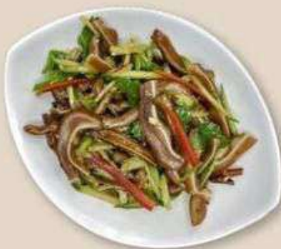
ЗАКУСКА ИЗ СВИННЫХ УШЕЙ