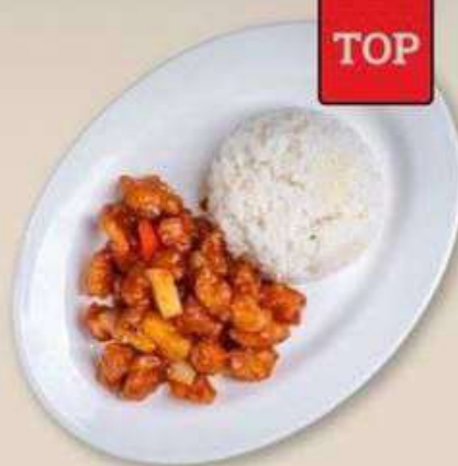
КУРИЦА С АНАНАСАМИ В КИСЛО-СЛАДКОМ СОУСЕ