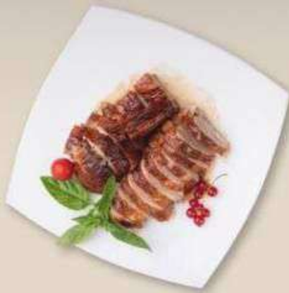
УТКА ПО-ГОНКОНСКИ 1/2