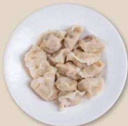
КИТАЙСКИЕ ПЕЛЬМЕНИ СО СВИНИНОЙ