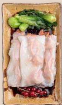
РИСОВЫЕ БЛИНЧИКИ СО СВИНИНОЙ