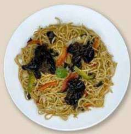
С ОВОЩАМИ И ДРЕВЕСНЫМИ ГРИБАМИ