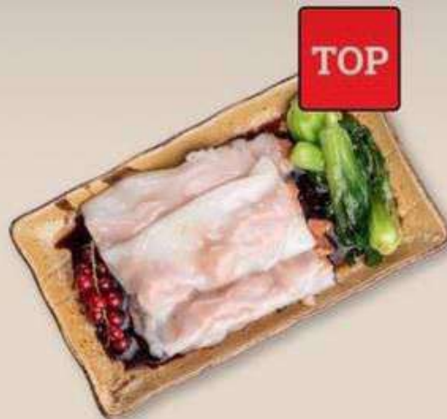
РИСОВЫЕ БЛИНЧИКИ НА ПАРУ С КРЕВЕТКАМИ