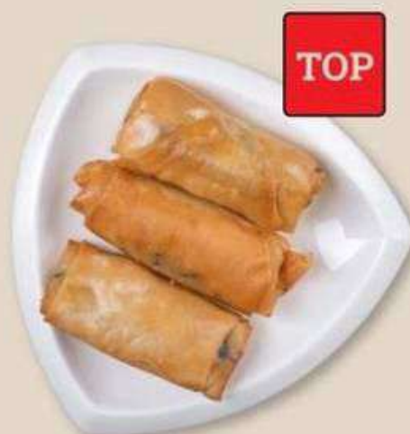
СПРИНГ РОЛЛЫ СО СВИНИНОЙ