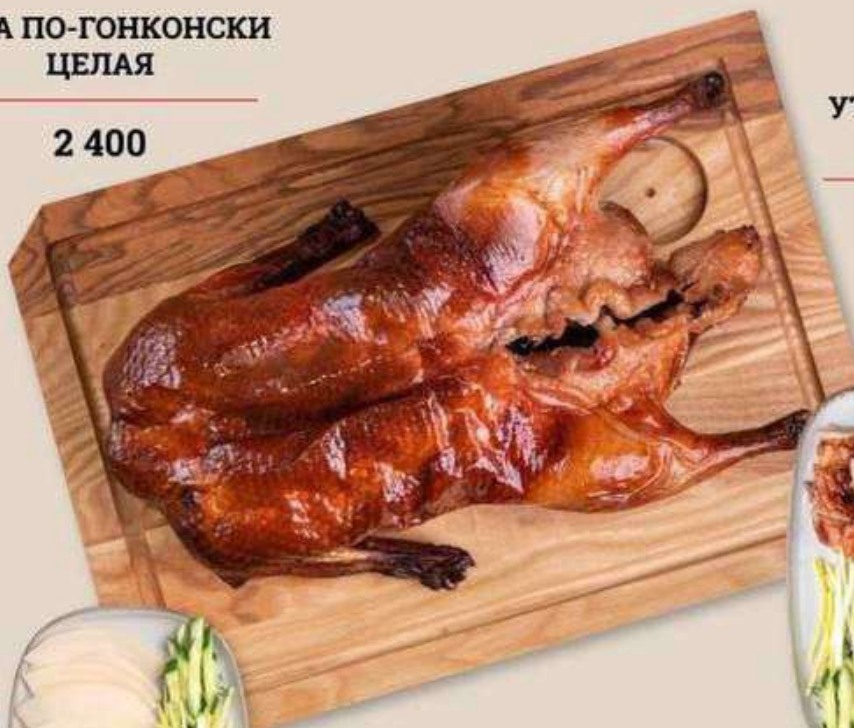
УТКА ПО-ПЕКИНСКИ ЦЕЛАЯ