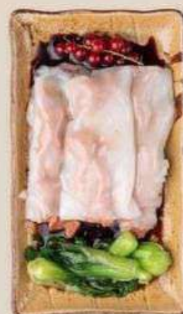
РИСОВЫЕ БЛИНЧИКИ С ЯЙЦОМ