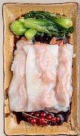
РИСОВЫЕ БЛИНЧИКИ НА ПАРУ С ГОВЯДИНОЙ