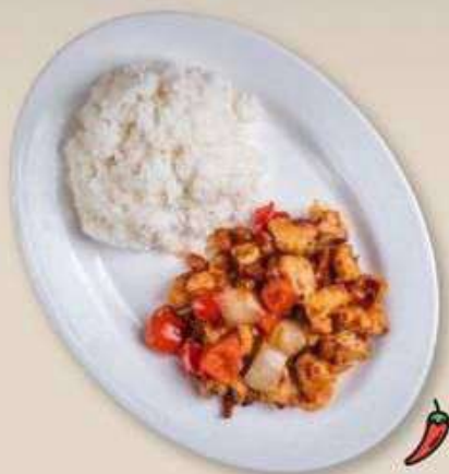
КУРИЦА ГУНБАО В КИСЛО-ОСТРОМ СОУСЕ