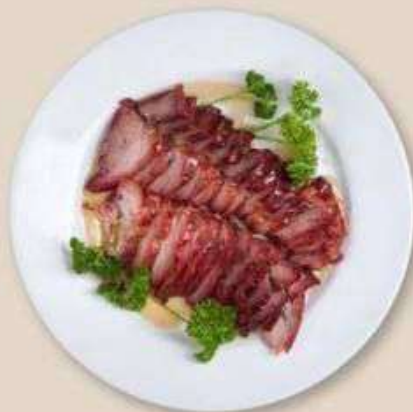
СВИНИНА ЧА-ШАО В МЕДОВОМ СОУСЕ