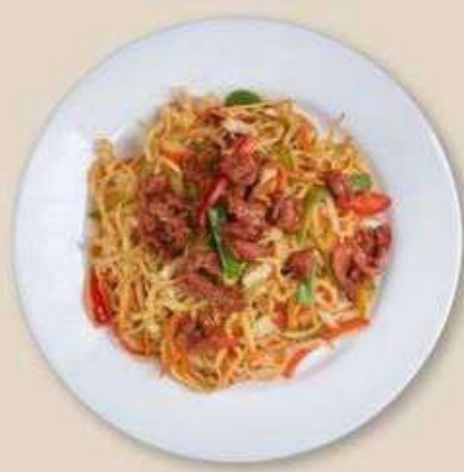
С ГОВЯДИНОЙ В СОЕВО-УСТРИЧНОМ СОУСЕ