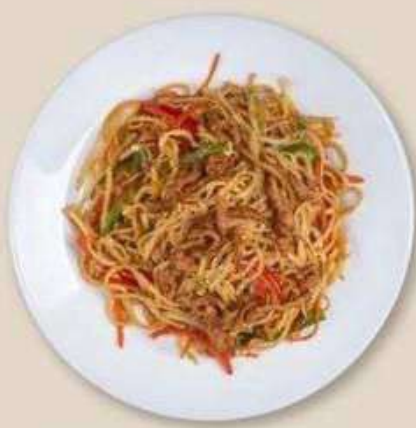
СО СВИННОЙ ВЫРЕЗКОЙ И ОВОЩАМИ