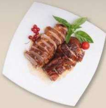
УТКА ПО-ГОНКОНСКИ 1/4