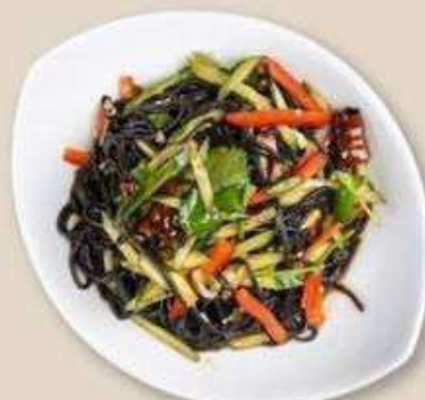
ЗАКУСКА ИЗ ЧЕРНОЙ ЛАПШИ