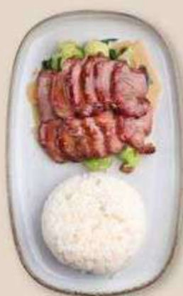
СВИНИНА ЧА-ШАО В МЕДОВОМ СОУСЕ