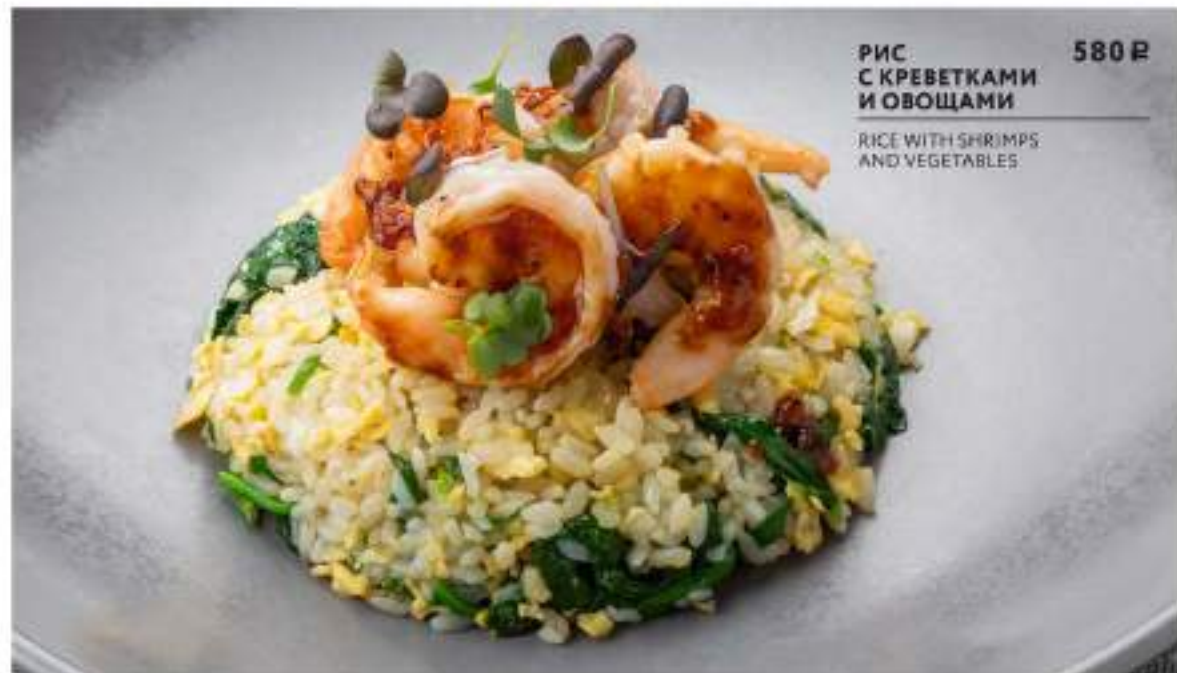
РИС С КРЕВЕТКАМИ И ОВОЩАМИ

CHICKEN WITH VEGETABLES IN SWEET AND SOUR SAUCE