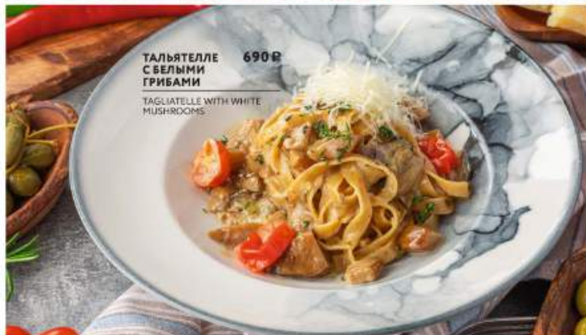
ТАЛЬЯТЕЛЛЕ С БЕЛЫМИ ГРИБАМИ 690 Р