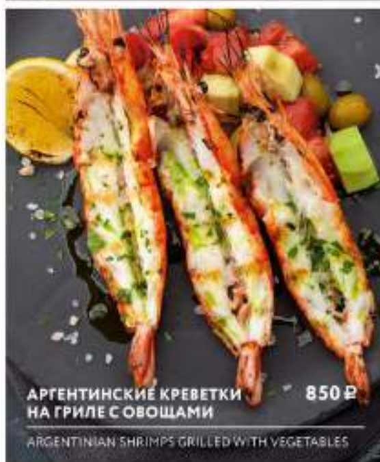
АРГЕНТИНСКИЕ КРЕВЕТКИ НА ГРИЛЕ С ОВОЩАМИ