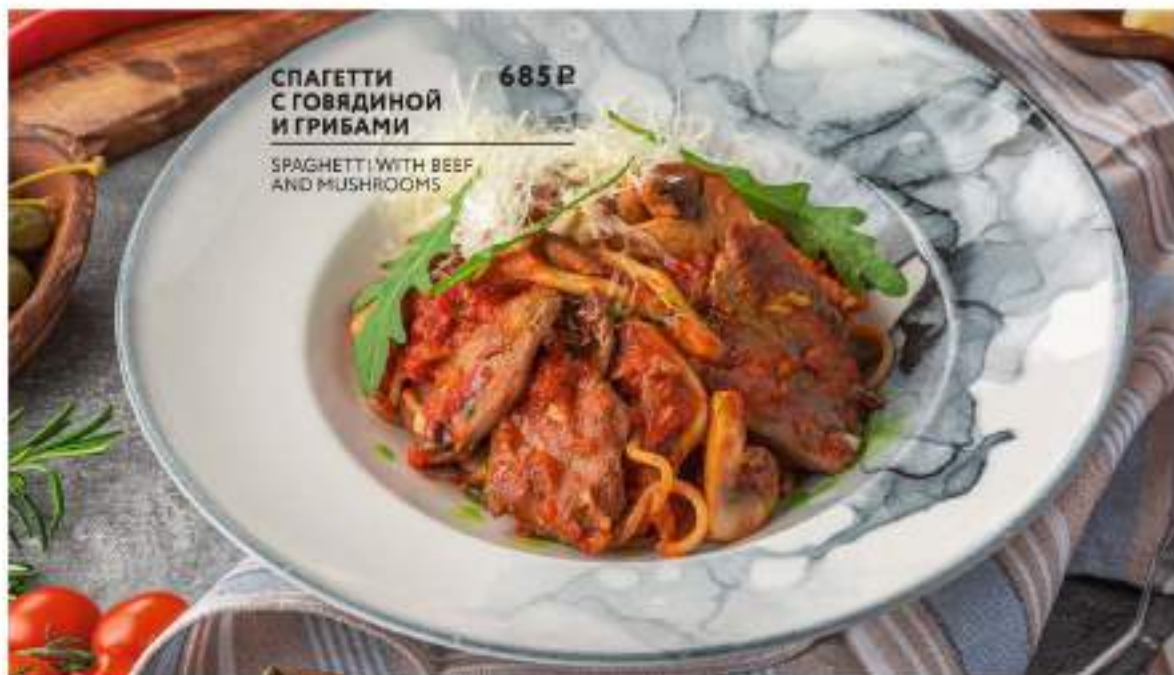
СПАГЕТТИ С ГОВЯДИНОЙ И ГРИБАМИ 685 Р