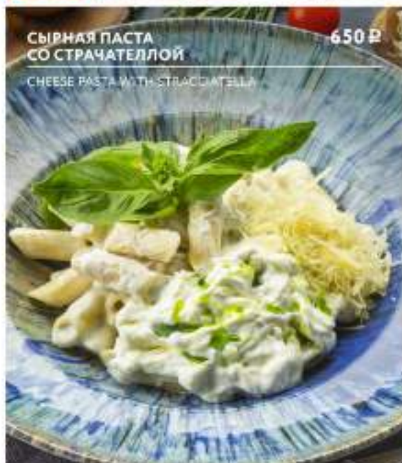
СЫРНАЯ ПАСТА СО СТРАЧАТЕЛЛОЙ 650 Р