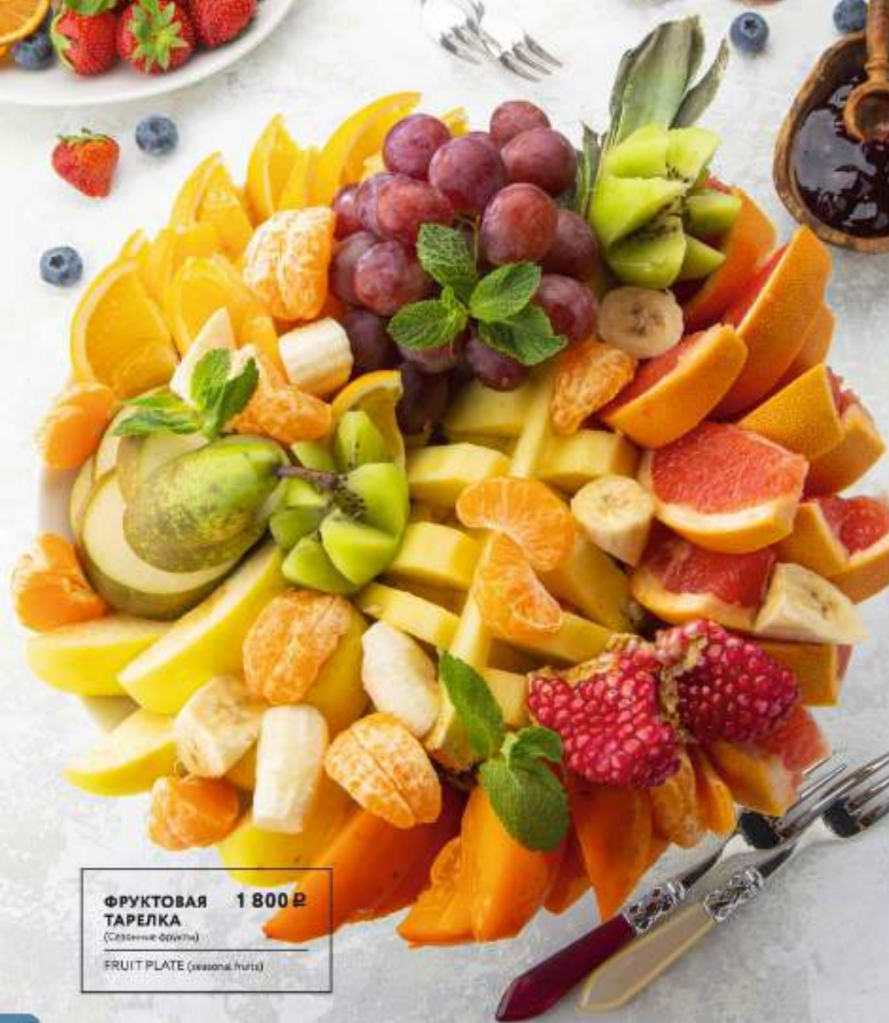
ФРУКТОВАЯ ТАРЕЛКА 1 800 Р (Сезонные фрукты) FRUIT PLATE (seasonal fruits)