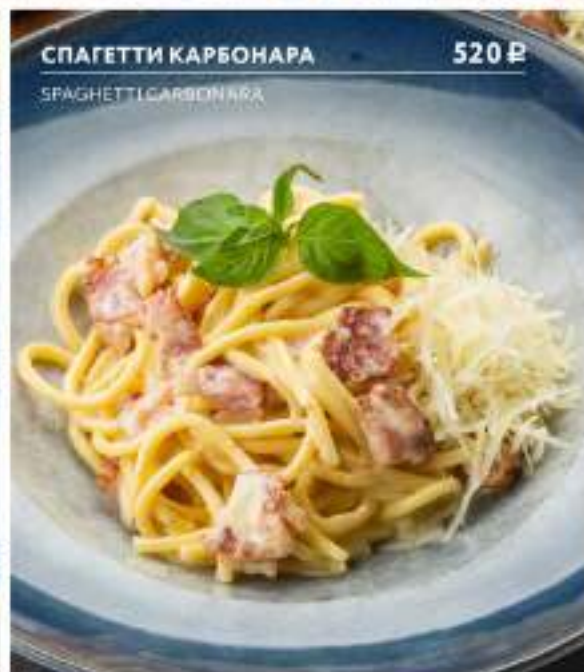
СПАГЕТТИ КАРБОНАРА 520 Р