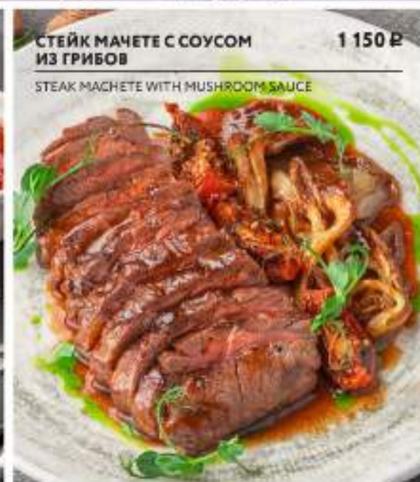
СТЕЙК МАЧЕТЕ С СОУСОМ ИЗ ГРИБОВ