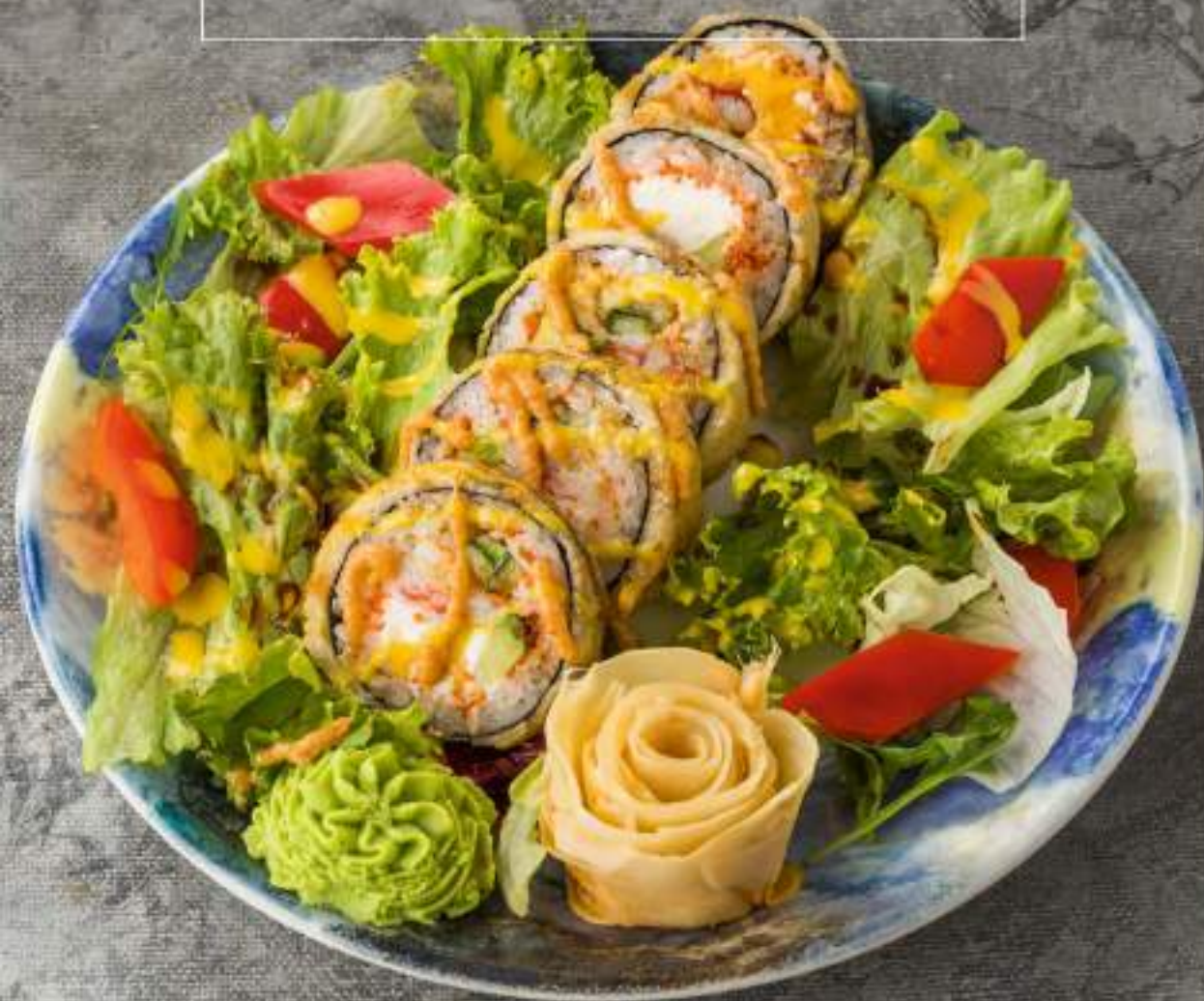
РОЛЛ ТЕМПУРА С КАМЧАТСКИМ КРАБОМ И САЛАТНЫМ МИКСОМ 1 250 Р

Секундари, камчатский краб, авокадо, сыр, салатный микс, кунжут, лимонный сок, салатный микс.