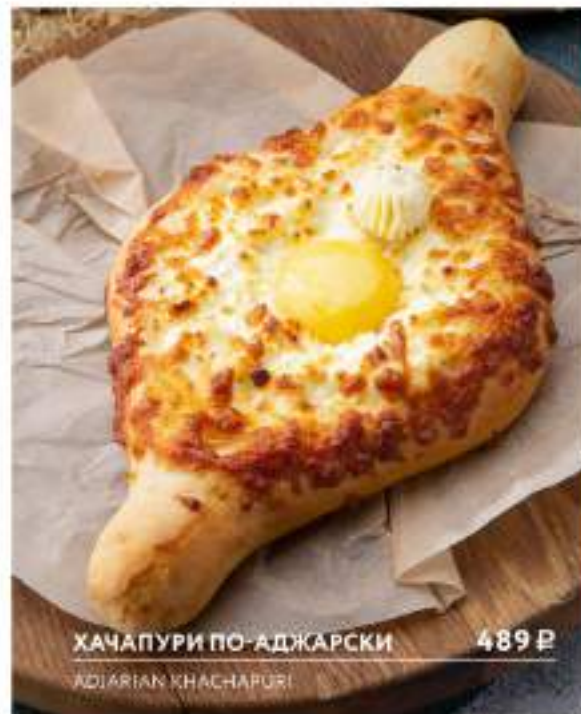
ХАЧАПУРИ ПО-АДЖАРСКИ 489 Р ADJARIAN KHACHAPURI