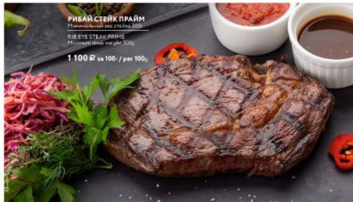
РИБАЙ СТЕЙК ПРАЙМ