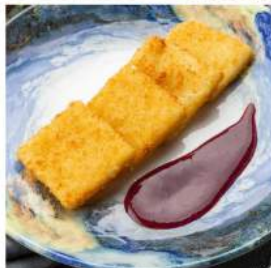
ЖАРЕННЫЙ СУЛУГУНИ С ЯГОДНЫМ СОУСОМ 389 Р FRIED SULLUGUNI CHEESE WITH BERRY SAUCE