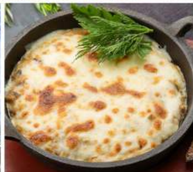
ЖУЛЬЕН ИЗ КУРИЦЫ С ГРИБАМИ 489 Р CHICKEN JULIENNE WITH MUSHROOMS