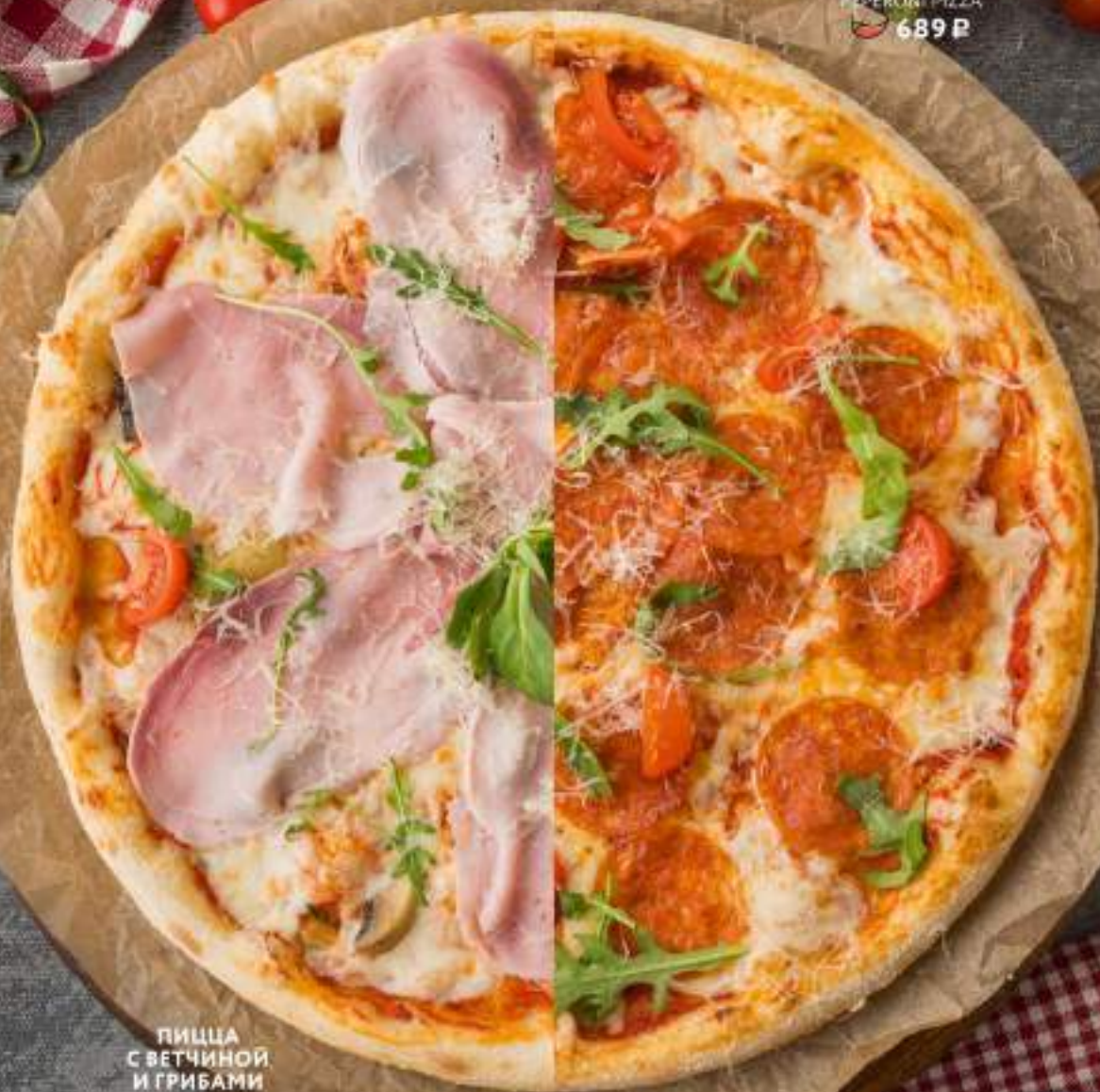
ПИЦЦА С ВЕТЧИНОЙ И ГРИБАМИ HAM & MUSHROOM PIZZA 689 Р