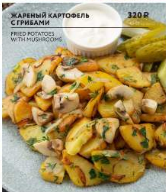
ЖАРЕННЫЙ КАРТОФЕЛЬ С ГРИБАМИ 320 Р FRIED POTATOES WITH MUSHROOMS