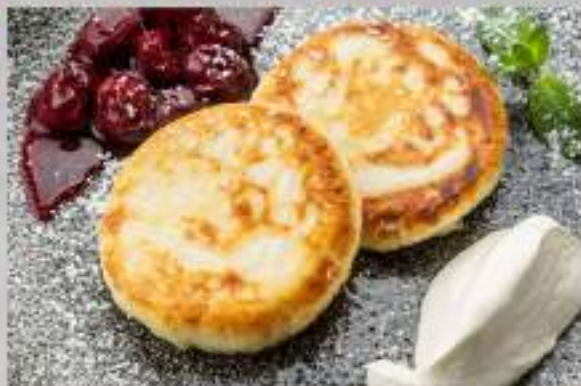
СЫРНИКИ СО СМЕТАНОЙ И ВАРЕНЬЕМ (2 шт)