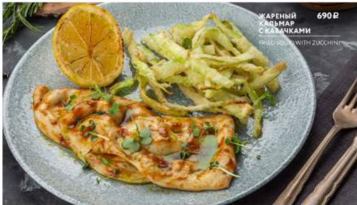
ЖАРЕННЫЙ КАДЬМАР С КАБАЧКАМИ 690 Р FRIED MASHED WITH ZUCCHINI