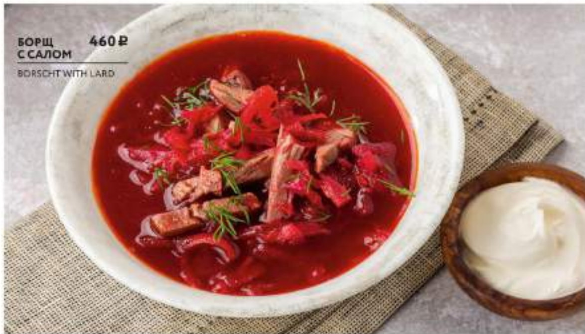
БОРЩ С САЛОМ BORSCHT WITH LARD