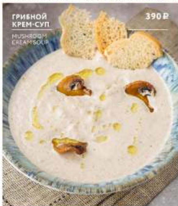
ГРИБНОЙ КРЕМ-СУП MUSHROOM CREAM SOUP