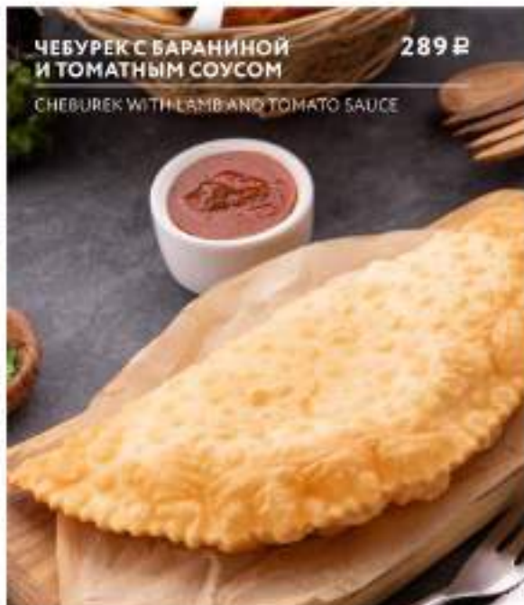
ЧЕБУРЕК С БАРАНИНОЙ И ТОМАТНЫМ СОУСОМ 289 Р CHEBUREK WITH LAMB AND TOMATO SAUCE