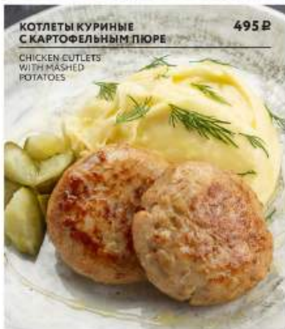
КОТЛЕТЫ КУРИНЫЕ С КАРТОФЕЛЬНЫМ ПЮРЕ 495 Р CHICKEN CUTLETS WITH MASHED POTATOES