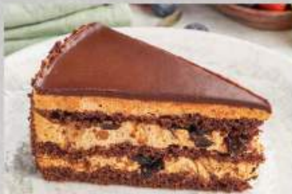
ШОКОЛАДНЫЙ ТОРТ С ЧЕРНОСЛИВОМ