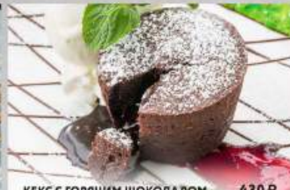
КЕКС С ГОРЯЧИМ ШОКОЛАДОМ