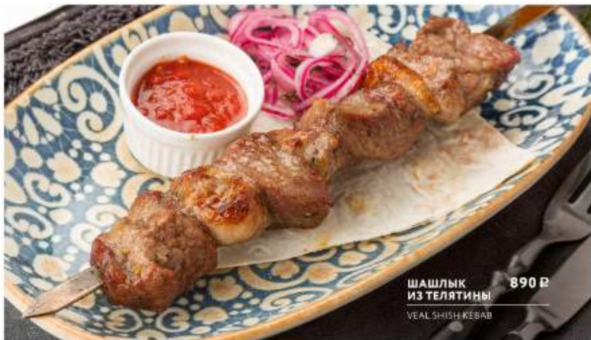
ШАШЛЫК ИЗ ТЕЛЯТИНЫ 890 Р VEAL SHISH KEBAB