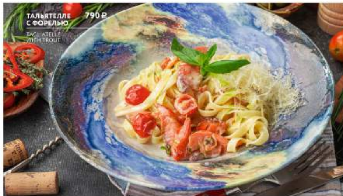
ТАЛЬЯТЕЛЛЕ С ФОРЕЛЬЮ 790 Р