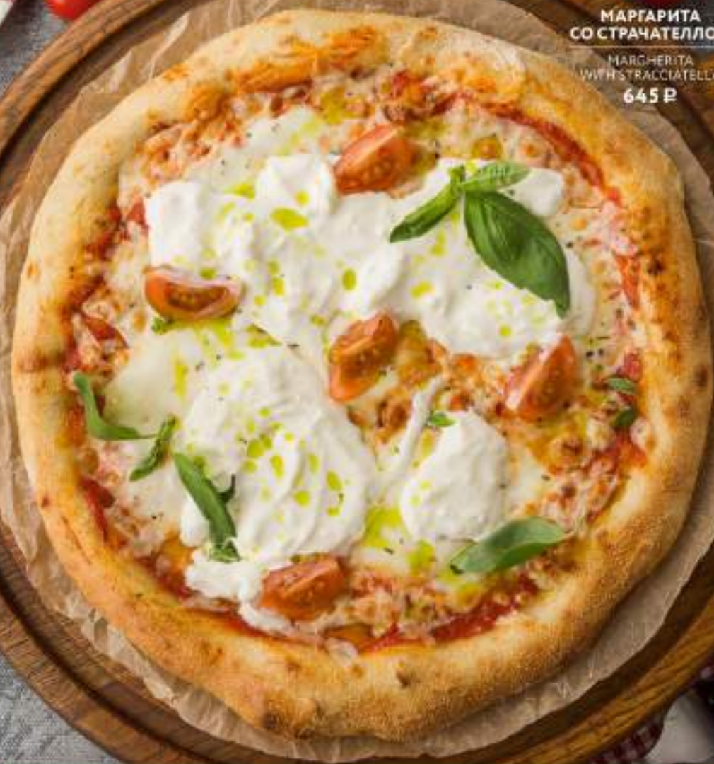
МАРГАРИТА СО СТРАЧАТЕЛЛОЙ MARGHERITA WITH STRACCIATELLA 645 Р