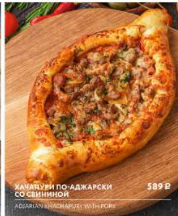
ХАЧАПУРИ ПО-АДЖАРСКИ СО СВИНИНОЙ 589 Р ADJARIAN KHACHAPURI WITH PORK