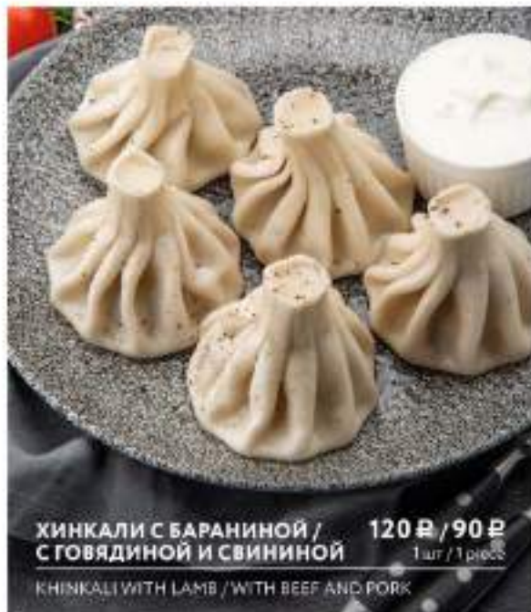
ХИНКАЛИ С БАРАНИНОЙ / С ГОВЯДИНОЙ И СВИНИНОЙ 120 Р / 90 Р 1 шт / 1 piece KHINKALI WITH LAMB / WITH BEEF AND PORK