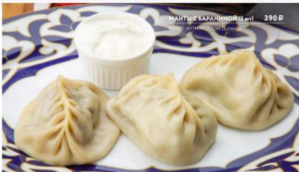
МАНТЫ С БАРАНИНОЙ (3 шт) 390 Р MANTI WITH MUTTON (3 pieces)