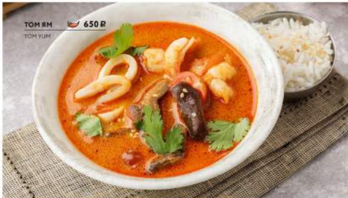
ТОМ ЯМ TOM YUM