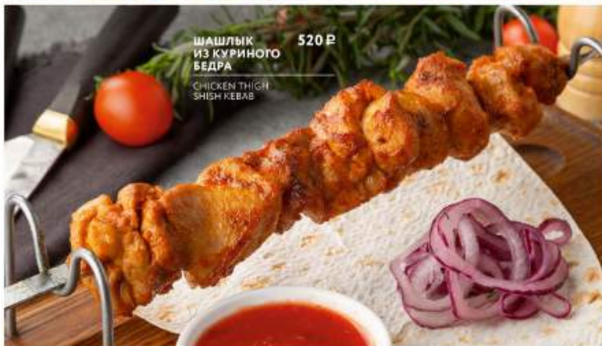
ШАШЛЫК ИЗ КУРИНОГО БЕДРА 520 Р CHICKEN THIGH SHISH KEBAB