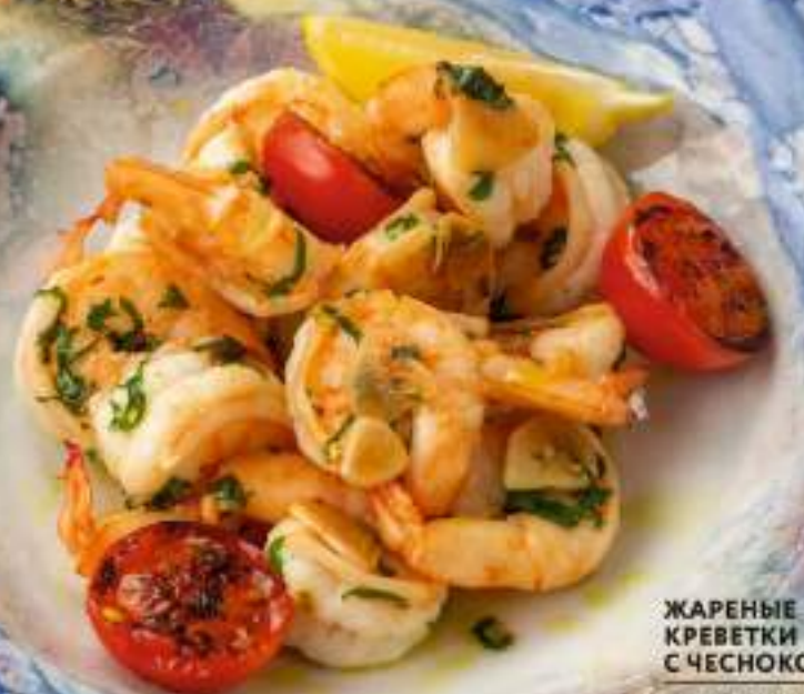
ЖАРЕННЫЕ КРЕВЕТКИ С ЧЕСНОКОМ 990 Р FRIED SHRIMPS WITH GARLIC