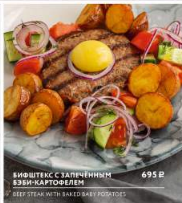
БИФШТЕКС С ЗАПЕЧЕННЫМ БЭБИ-КАРТОФЕЛЕМ

ARGENTINIAN SHRIMPS GRILLED WITH VEGETABLES