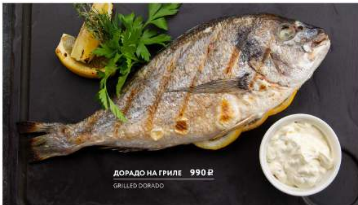
ДОРАДО НА ГРИЛЕ 990 Р