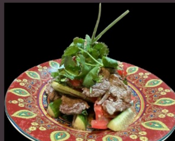
ФИРМЕННЫЙ САЛАТ ХОБА