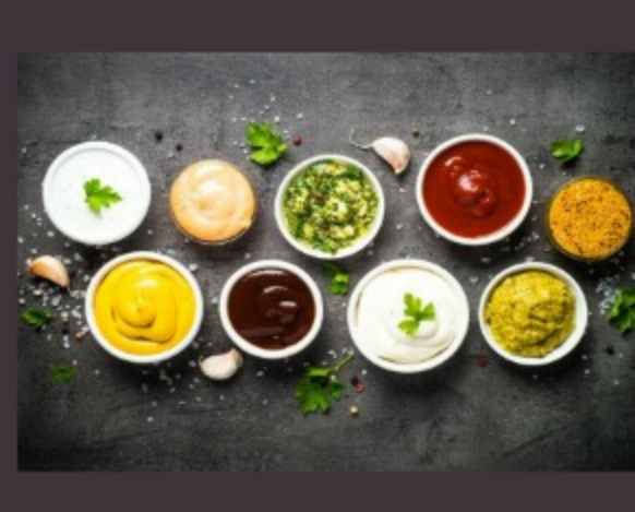
АЙОЛИ, БЛЮЧИЗ, ЯГОДНЫЙ, СЫРНЫЙ, СПАЙСИ, ТАР-ТАР, ГОРЧИЧНЫЙ, СЛАДКИЙ ЧИЛИ, КИСЛО-СЛАДКИЙ, КЕТЧУП