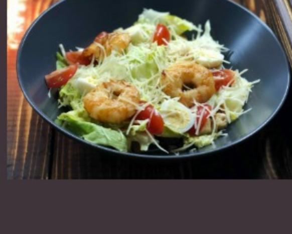
ЦЕЗАРЬ С КРЕВЕТКАМИ