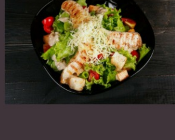
ЦЕЗАРЬ С КУРИЦЕЙ