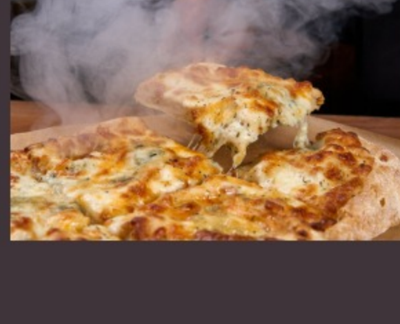
ПИЦЦА ЧЕТЫРЕ СЫРА