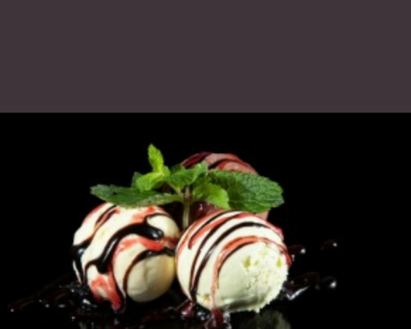
МОРОЖЕНОЕ ВАНИЛЬНОЕ, ШОКОЛАДНОЕ, ФИСТАШКОВОЕ