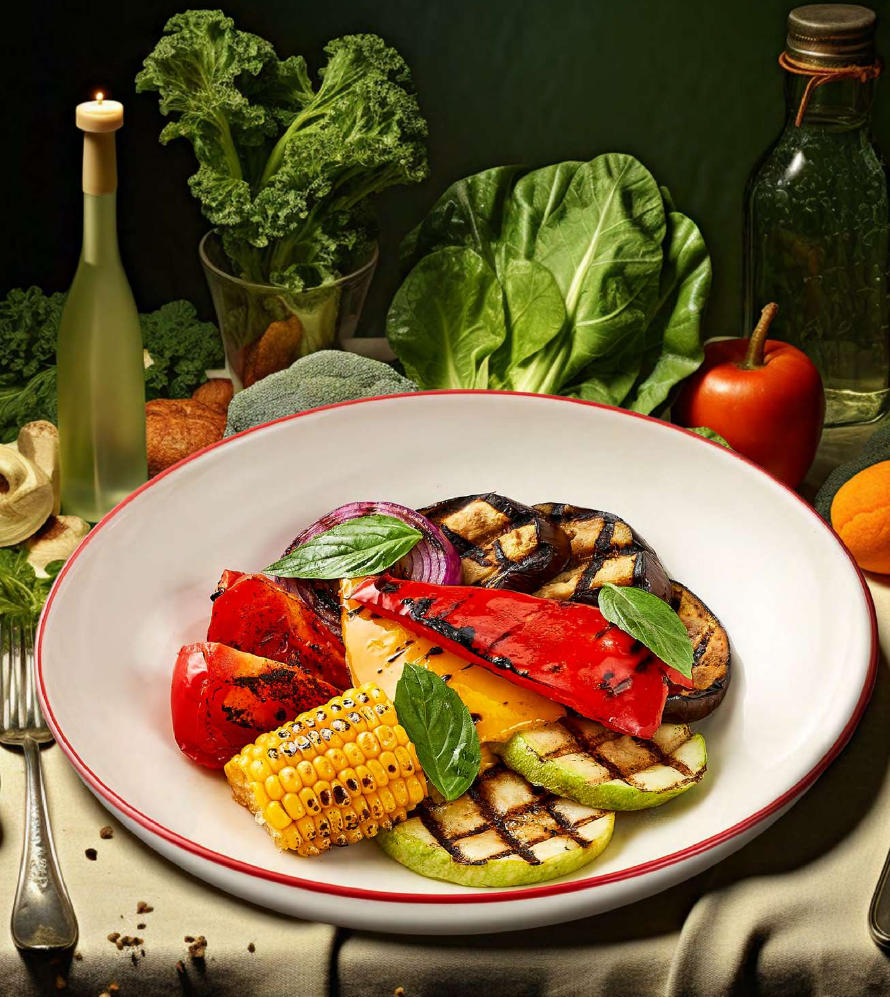
ГАРНИРЫ / SIDE DISHES