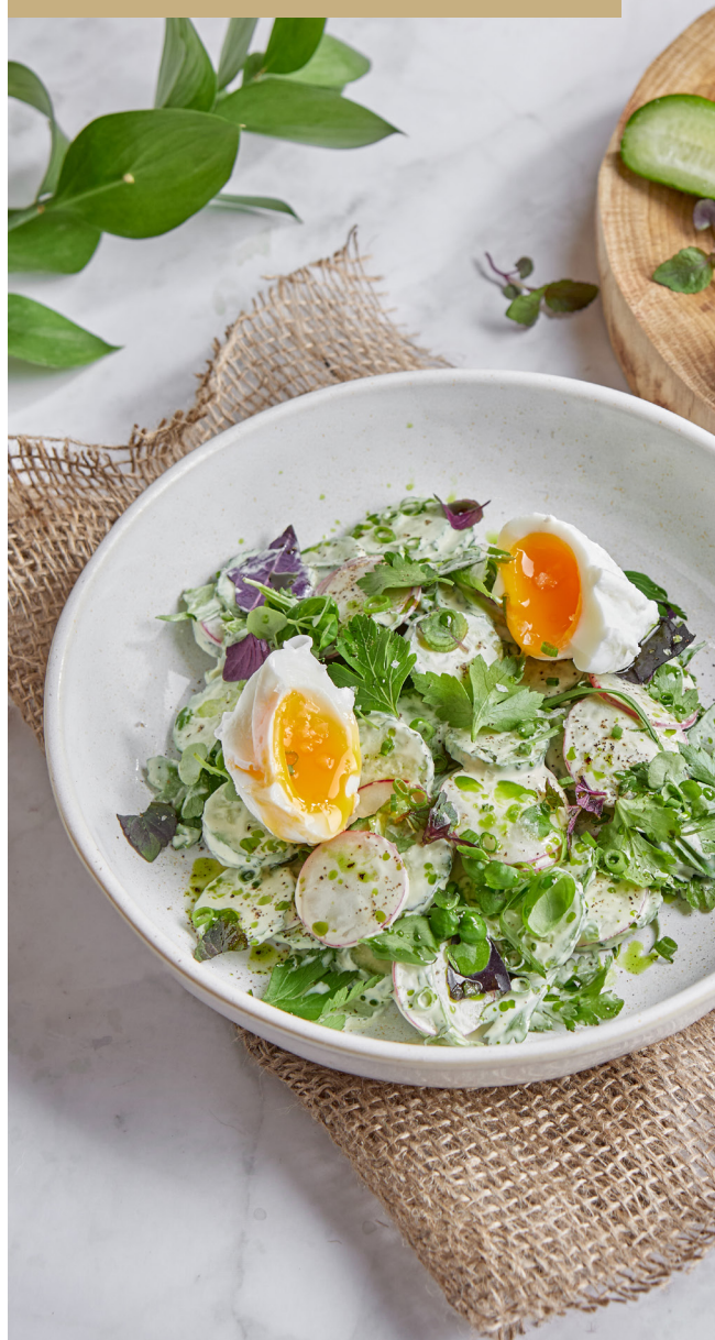
Деревенский салат с огурцом, зеленью и яйцом пашот 550.-