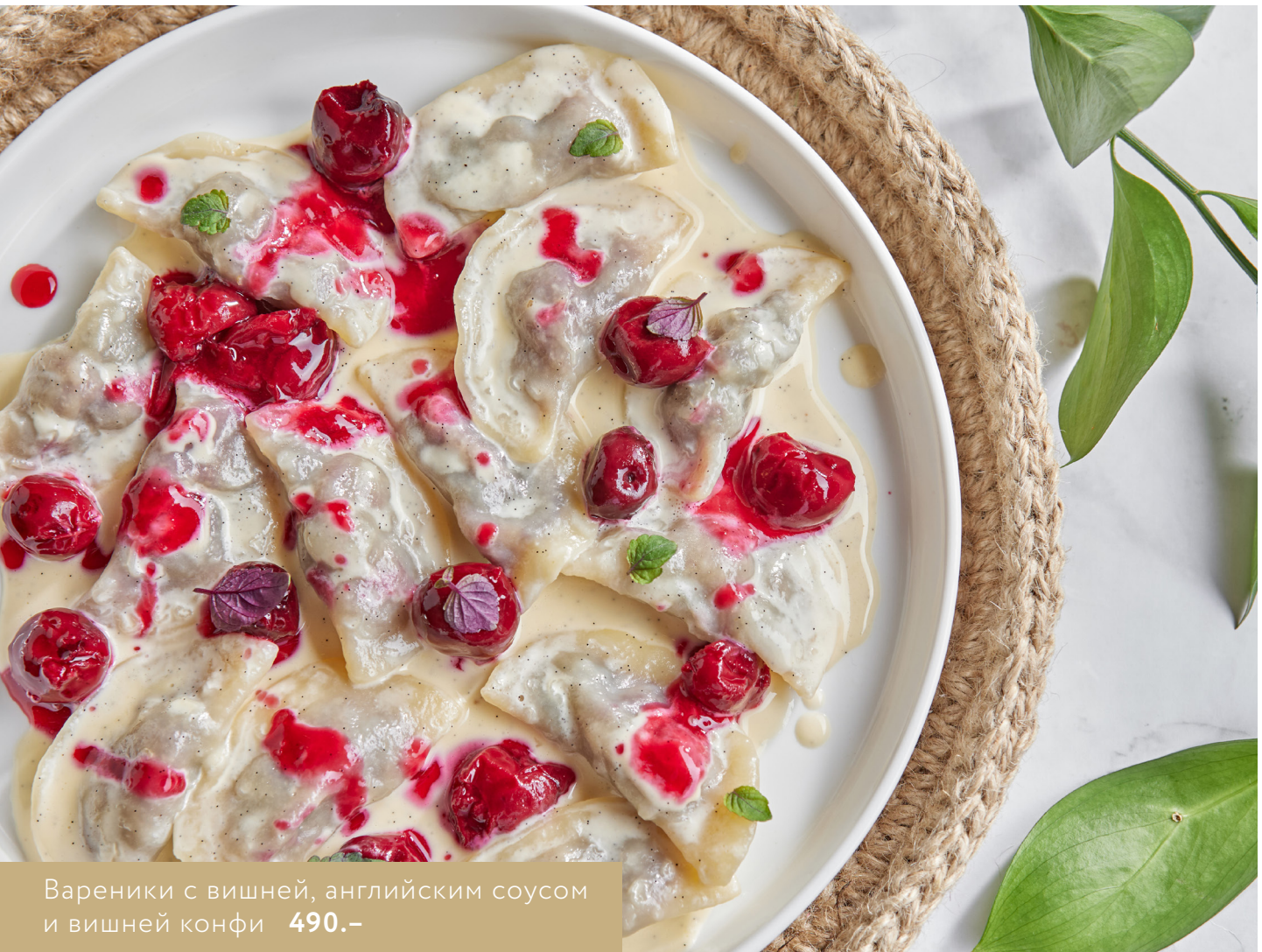
Вареники с вишней, английским соусом и вишней конфи 490.-