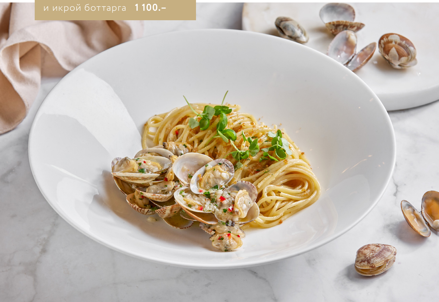
Спагетти с вонголе и икрой боттарга 1 100.-