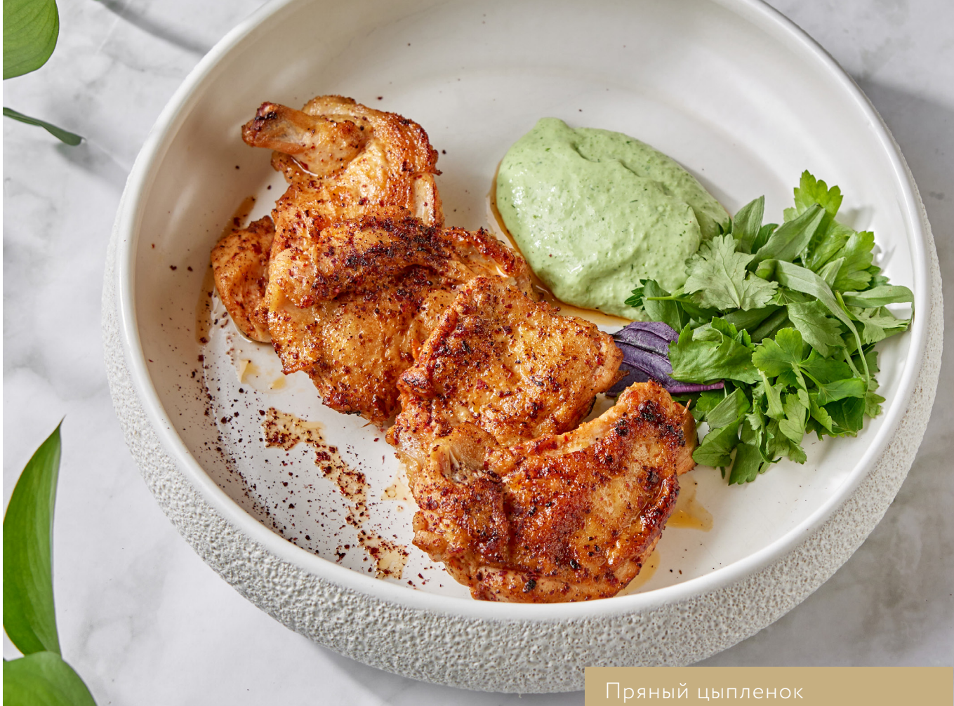
Пряный цыпленок с миксом зелени 980.-