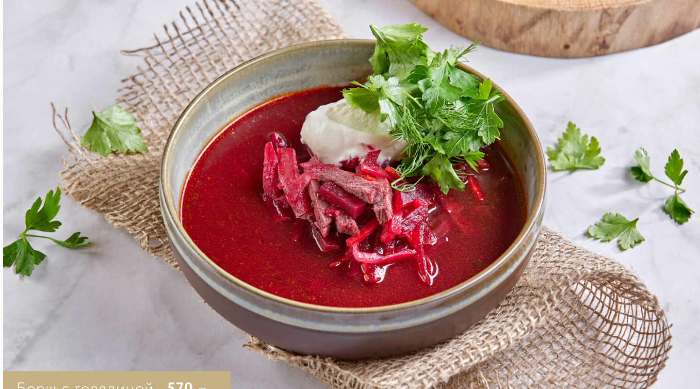
Борщ с говядиной 570.-