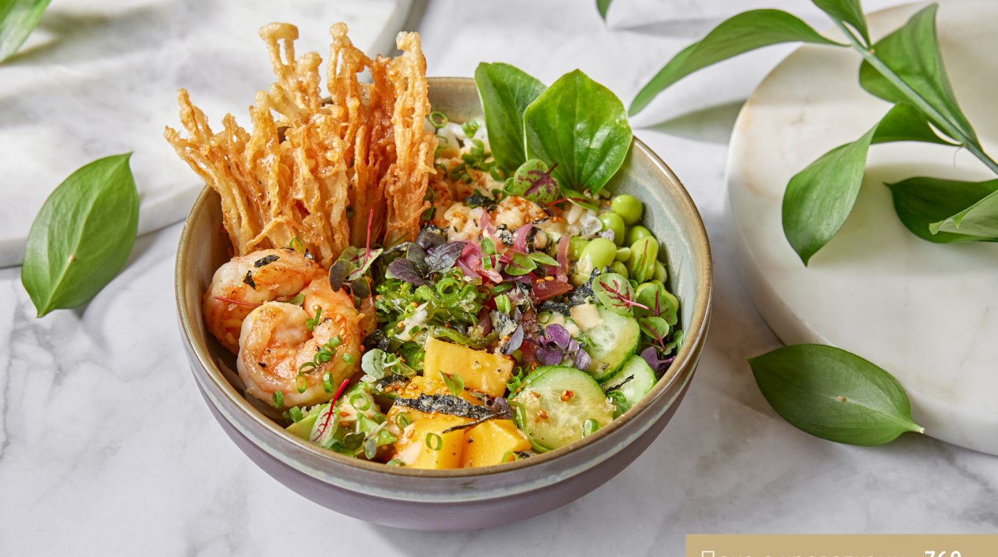
Поке с креветками 760.-