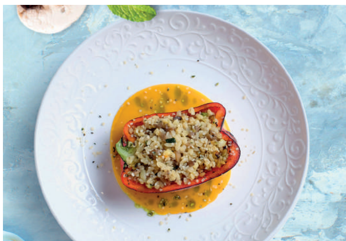
Печеный болгарский перец, фаршированный булгуром с грибами с тыквенно-имбирным соусом