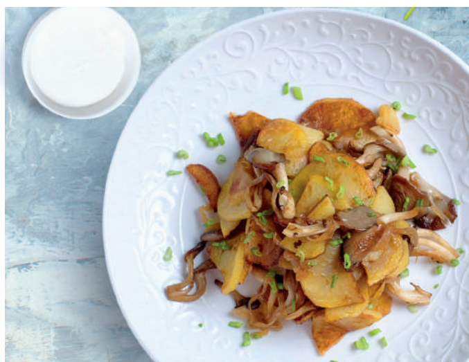
Жареный картофель с вешенками