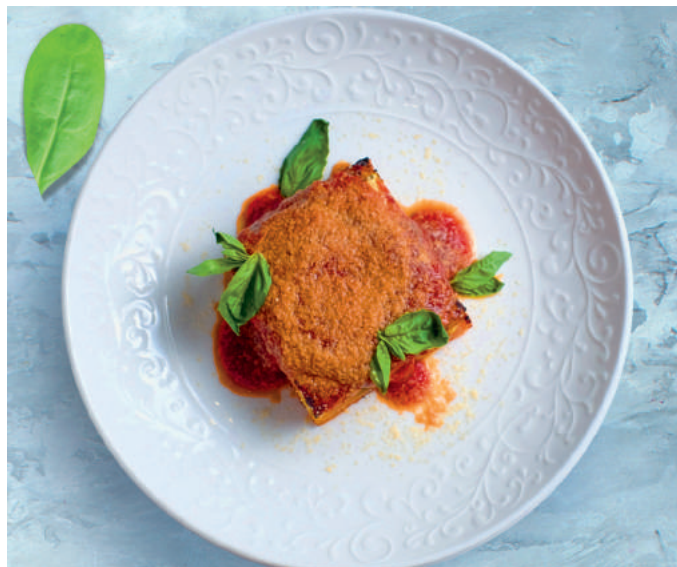
Французский классический рататуй с соусом из запечённых томатов