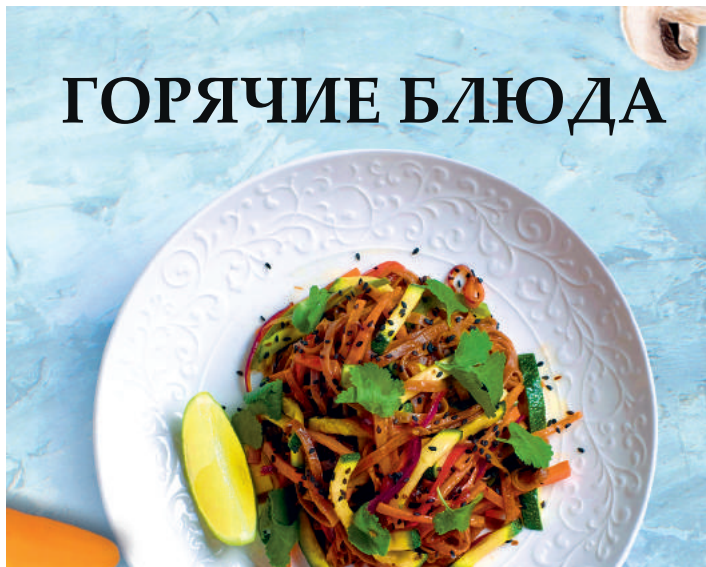
Гречневая лапша Wok с цукини в соусе терияки