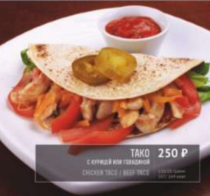
ТАКО 250 Р С КУРИЦЕЙ ИЛИ ГОВЯДИНОЙ CHICKEN TACO / BEEF TACO