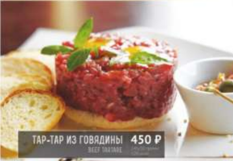
ТАР-ТАР ИЗ ГОВЯДИНЫ 450 Р BEEF TARTARE