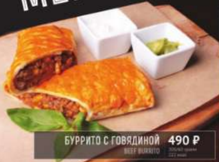
БУРРИТО С ГОВЯДИНОЙ 490 Р BEEF BURRITO