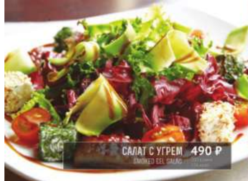
САЛАТ С УГРЕМ 490 Р SMOKED EEL SALAD