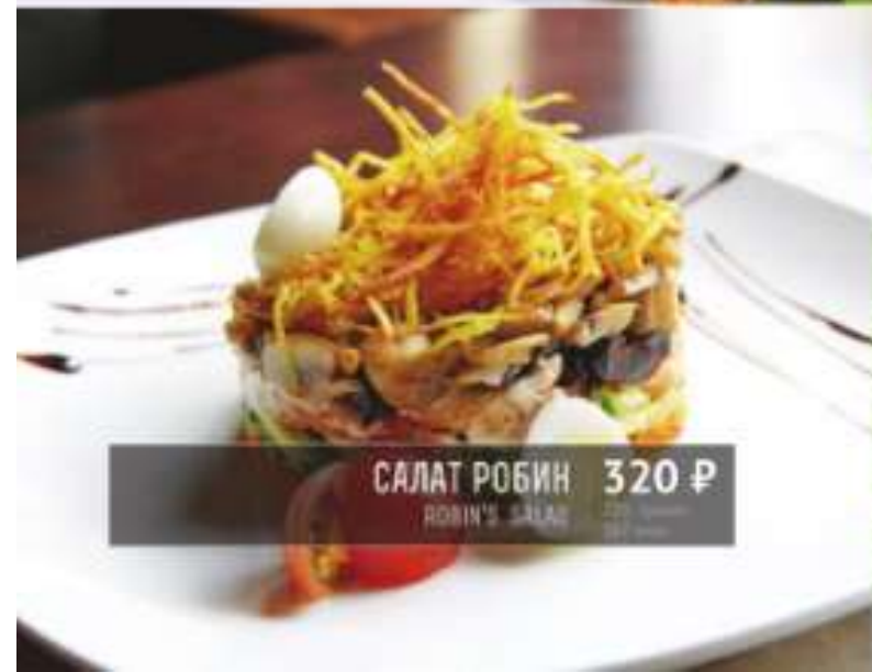
САЛАТ РОБИН 320 Р ROBIN'S SALAD