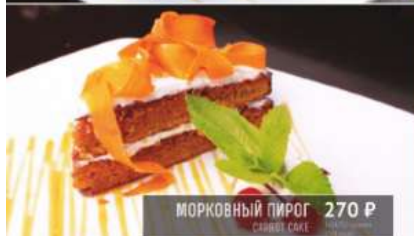
МОРКОВНЫЙ ПИРОГ 270 Р CARROT CAKE 130 грамм 274 ккал