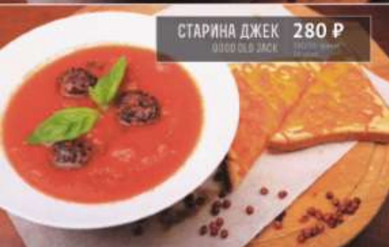
СТАРИНА ДЖЕК 280 Р