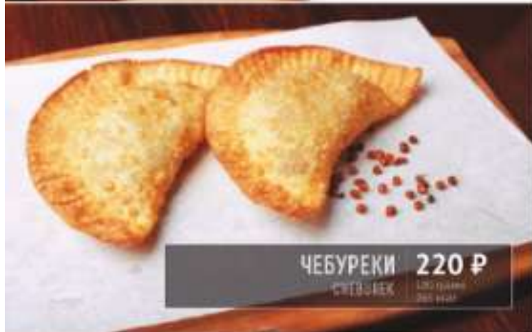
ЧЕБУРЕКИ 220 Р CHEBUREK 120 грамм 260 ккал