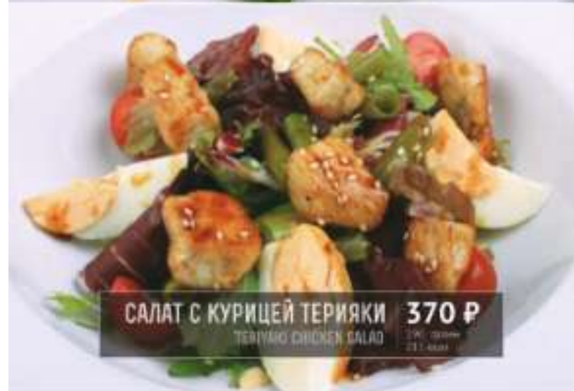
САЛАТ С КУРИЦЕЙ ТЕРИЯКИ 370 Р

TERIYAKI CHICKEN SALAD 370 грамм 211 ккал