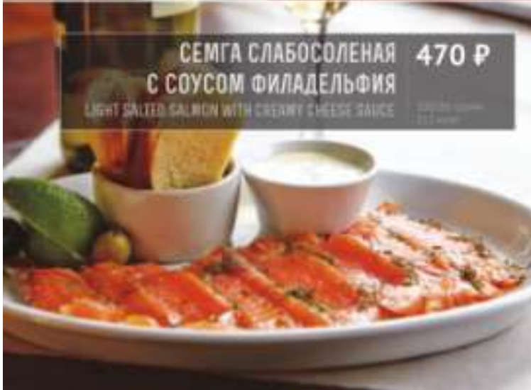
СЕМГА СЛАБОСОЛЕНАЯ 470 Р С СОУСОМ ФИЛАДЕЛЬФИЯ LIGHT SALTED SALMON WITH CREAMY CHEESE SAUCE