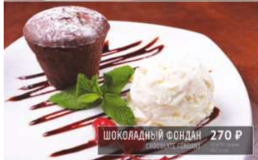
ШОКОЛАДНЫЙ ФОНДАН 270 Р CHOCOLATE FONDANT 130 грамм 272 ккал