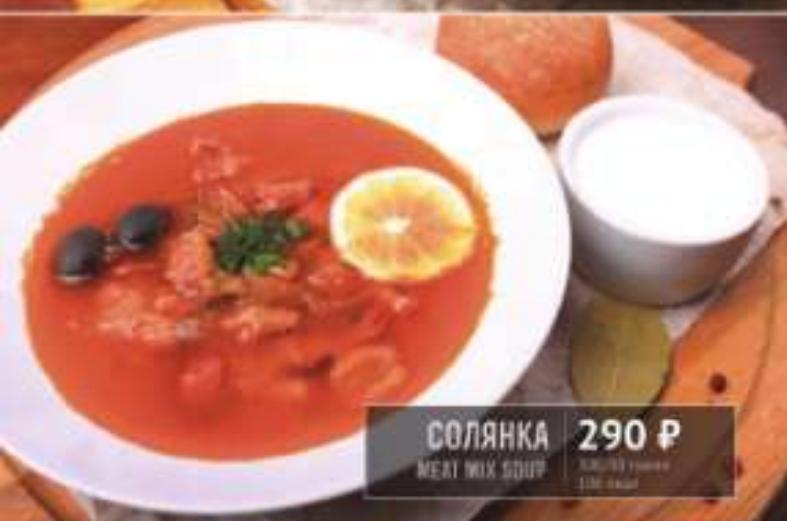
СОЛЯНКА 290 Р