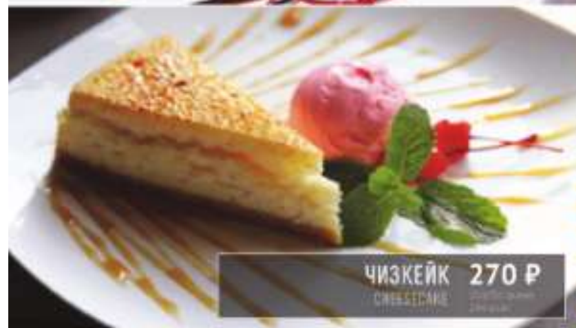
ЧИЗКЕЙК 270 Р CHEESECAKE 130 грамм 266 ккал