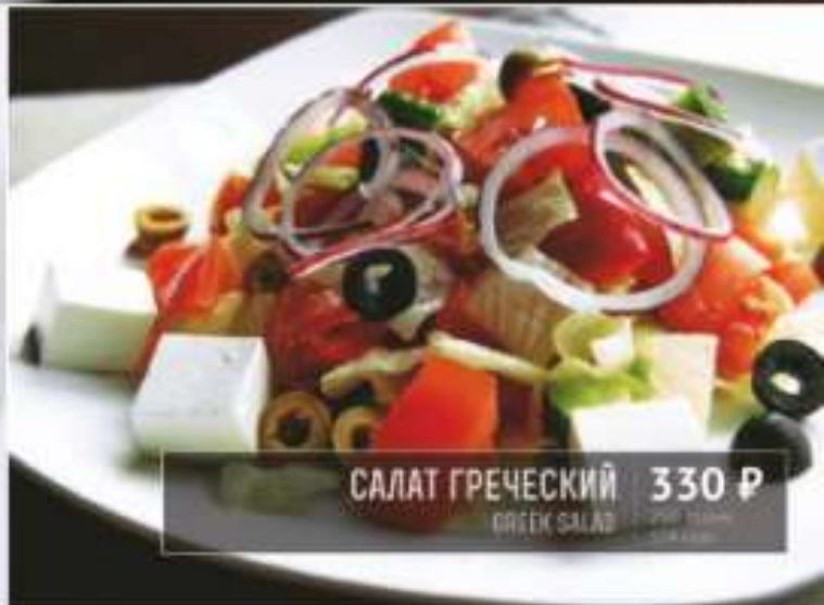
САЛАТ ГРЕЧЕСКИЙ 330 Р

TERIYAKI CHICKEN SALAD 370 грамм 211 ккал