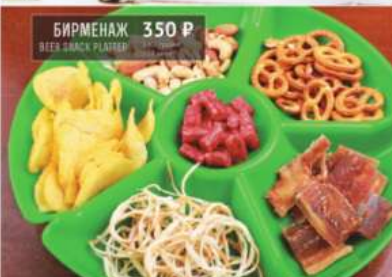
БИРМЕНАЖ 350 Р BEEF SNACK PLATTER