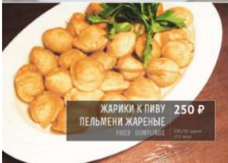
ЖАРИКИ К ПИВУ ПЕЛЬМЕНИ ЖАРЕННЫЕ 250 Р FRIED DUMPLINGS 100/120 грамм 215 ккал