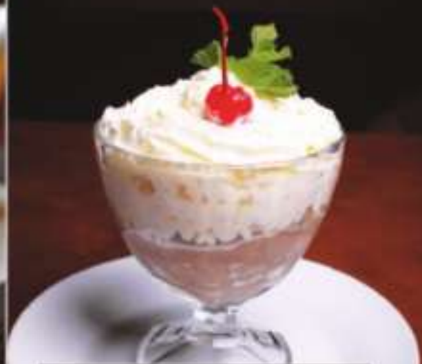
ПУДИНГ ГИНЕС 250 Р GUINNESS CHOCOLATE PUDDING 130 грамм 240 ккал