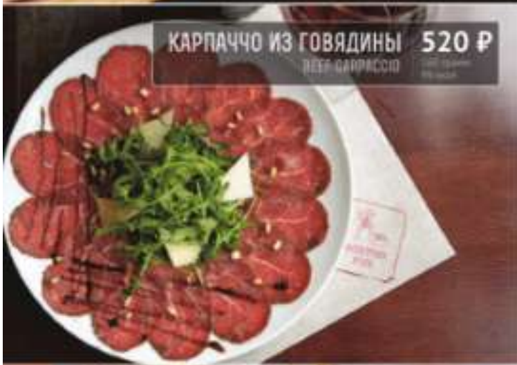
КАРПАЧЧО ИЗ ГОВЯДИНЫ 520 Р BEEF CARPACCIO 100 г / 100 grams 100 ккал