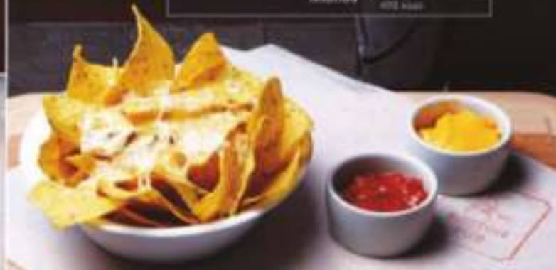
КЕСАДИЛЬЯ 370 Р С КУРИЦЕЙ ИЛИ ГРИБАМИ MUSHROOM AND CHICKEN QUESADILLA