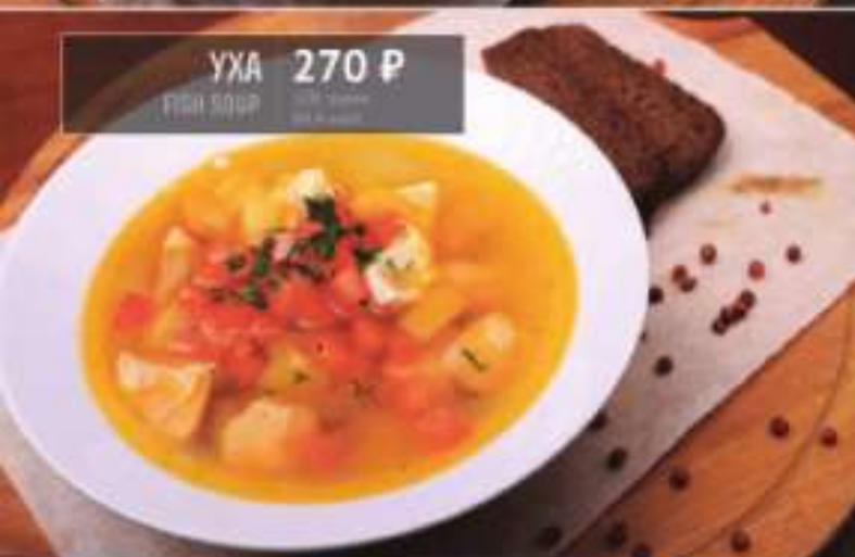
УХА 270 Р