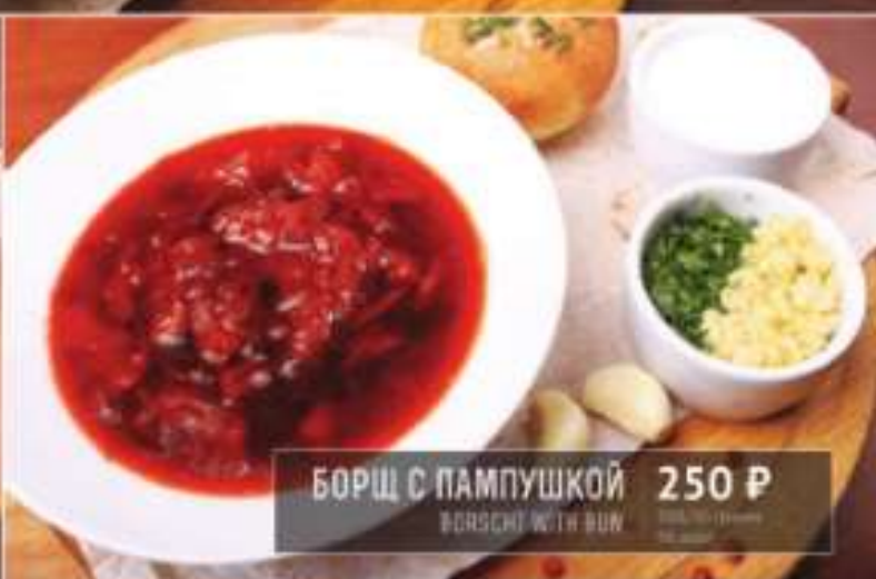
БОРЩ С ПАМПУШКОЙ 250 Р