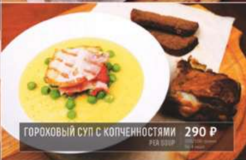
ГОРОХОВЫЙ СУП С КОПЧЕННОСТЯМИ 290 Р