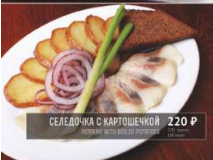
СЕЛЕДОЧКА С КАРТОШЕЧКОЙ 220 Р HERRING WITH BOILED POTATOES