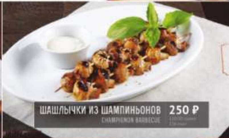
ШАШЛЫЧКИ ИЗ ШАМПИньОНОВ 250 Р CHAMPIGNON BARBECUE 110/130 грамм 175 ккал