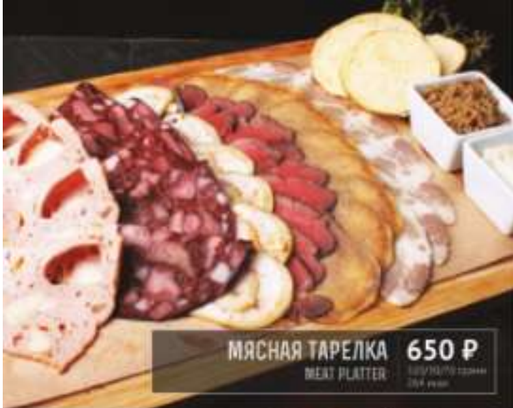
МЯСНАЯ ТАРЕЛКА 650 Р MEAT PLATTER 1000 г / 1000 grams 200 ккал