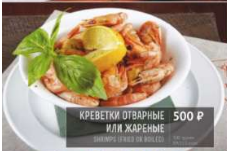
КРЕВЕТКИ ОТВАРНЫЕ ИЛИ ЖАРЕННЫЕ 500 Р SHRIMPS (FRIED OR BOILED) 140 грамм 340 ккал