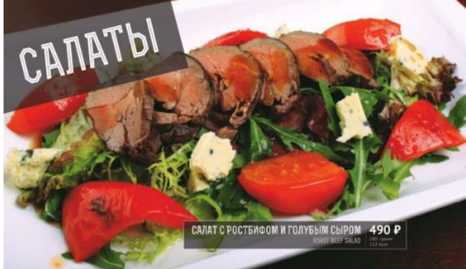
САЛАТ С РОСТБИФОМ И ГОЛУБЫМ СЫРОМ 490 Р