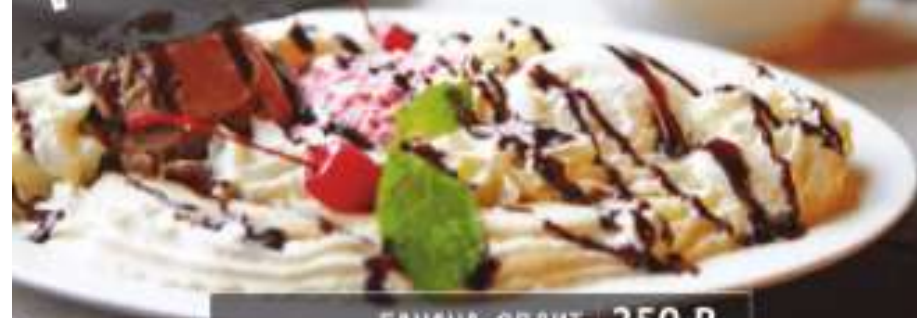
БАНАНА-СПЛИТ 250 Р BANANA SPLIT 130 грамм 223 ккал