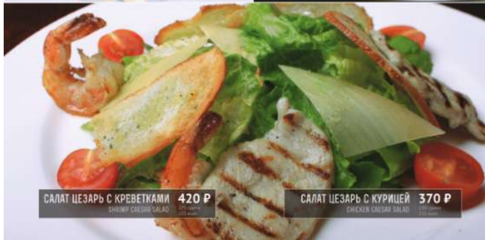
САЛАТ ЦЕЗАРЬ С КРЕВЕТКАМИ 420 Р