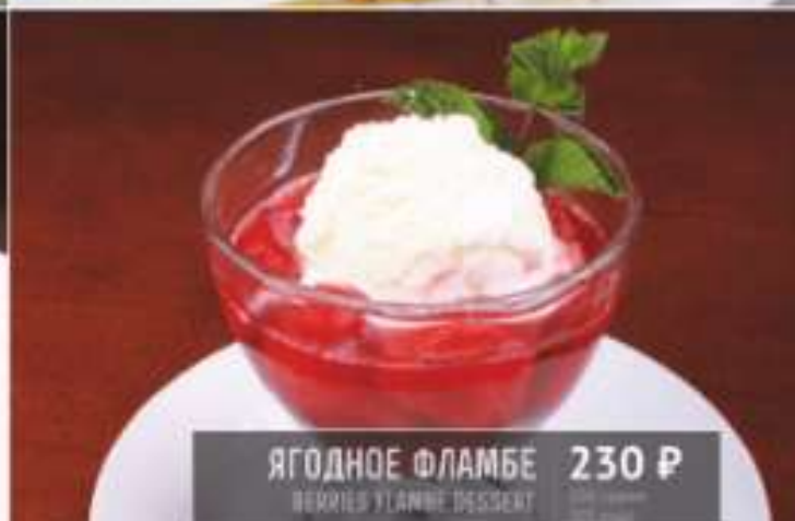
ЯГОДНОЕ ФЛАМБЕ 230 Р BERRIES FLAMBE DESSERT 130 грамм 202 ккал