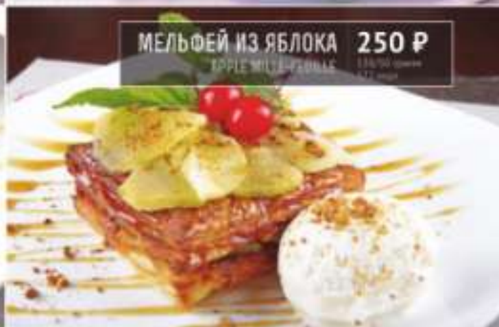
МЕЛЬФЕЙ ИЗ ЯБЛОКА 250 Р APPLE MUFFIN 130 грамм 272 ккал