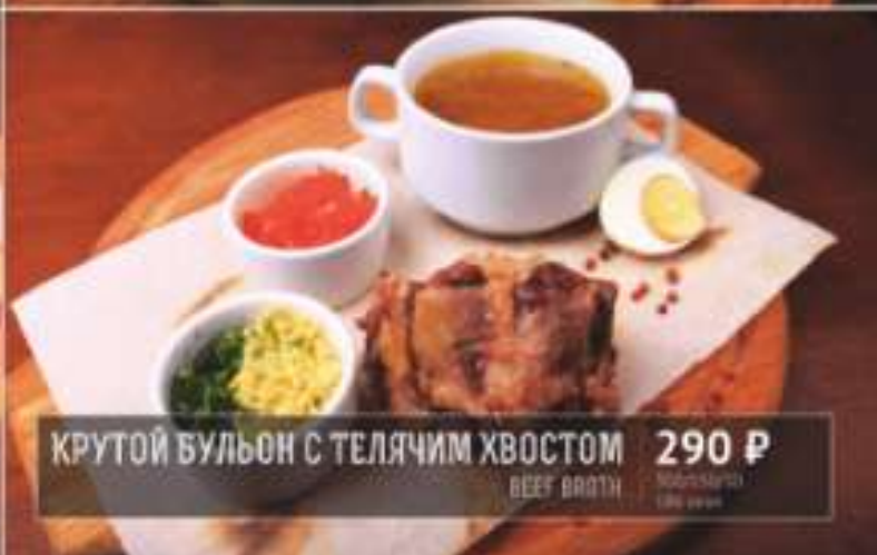
КРУТОЙ БУЛЬОН С ТЕЛЯЧИМ ХВОСТОМ 290 Р