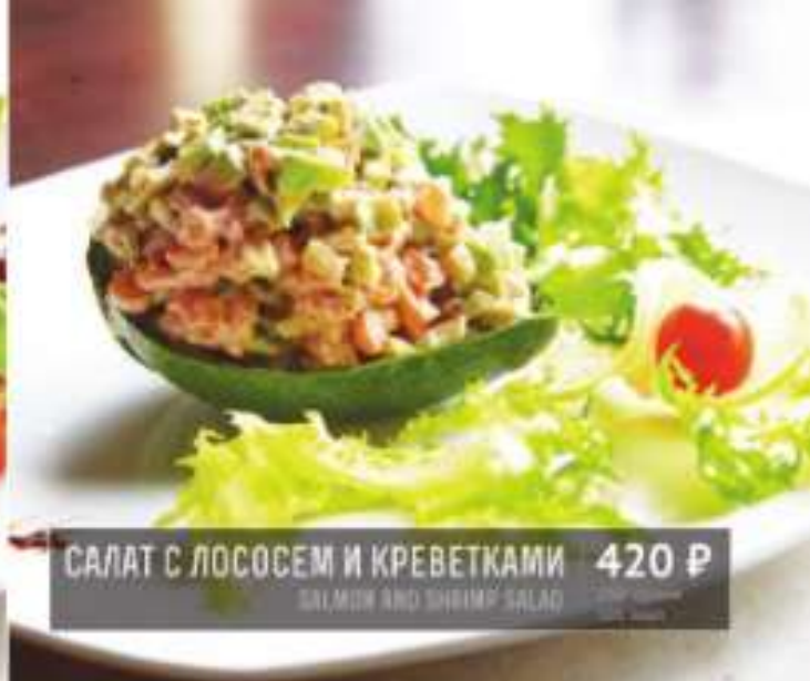
САЛАТ С ЛОСОСЕМ И КРЕВЕТКАМИ 420 Р SALMON AND SHRIMP SALAD