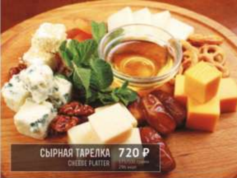
СЫРНАЯ ТАРЕЛКА 720 Р CHEESE PLATTER 1000 г / 1000 grams 270 ккал