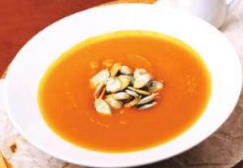
СУП-ПЮРЕ ИЗ ТЫКВЫ 270 Р