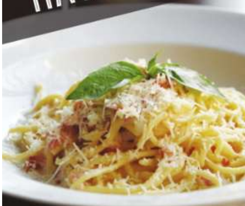
СПАГЕТТИ КАРБОНАРА 370 Р SPAGHETTI CARBONARA 380 гр/мин 370 ккал