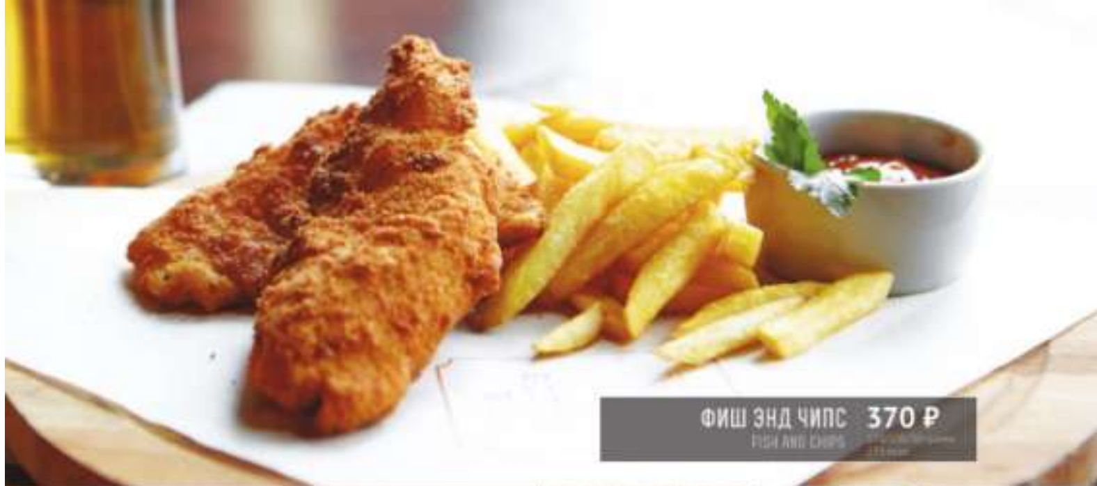
ФИШ ЭНД ЧИПС 370 Р FISH AND CHIPS 110/130 грамм 215 ккал