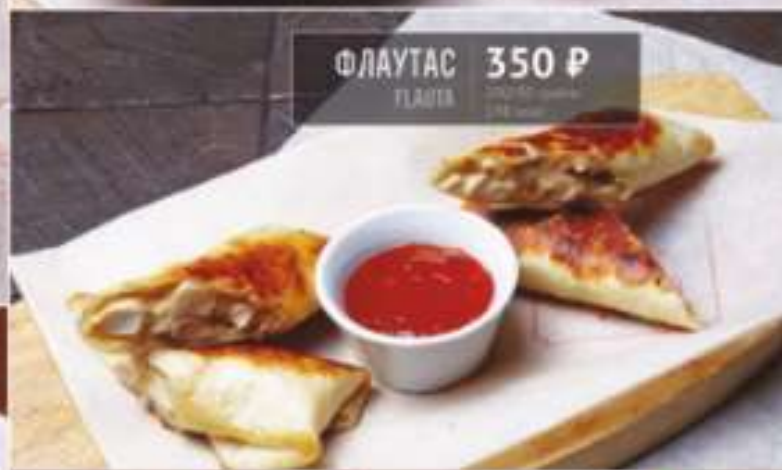
ФЛАУТАС 350 Р FLAUTAS