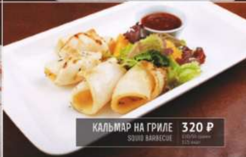
КАЛЬМАР НА ГРИЛЕ 320 Р SQUID BARBECUE 110/130 грамм 175 ккал