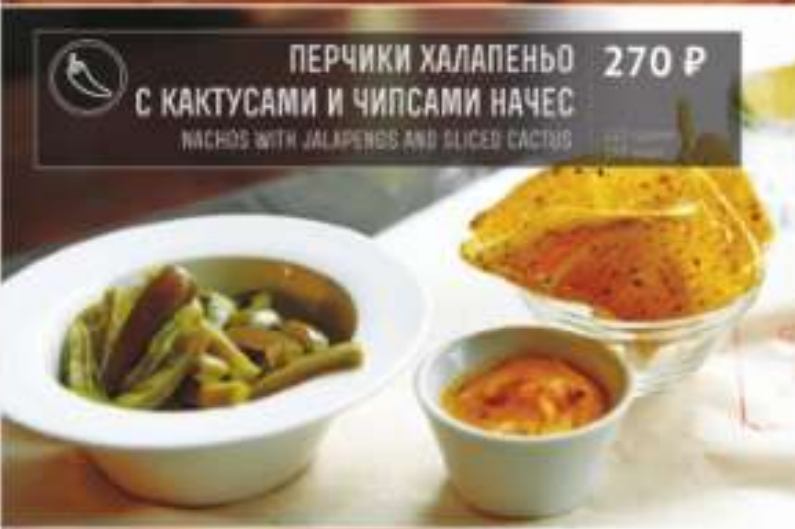
ПЕРЧИКИ ХАЛАПЕНЬО 270 Р С КАКТУСАМИ И ЧИПСАМИ НАЧЕС NACHOS WITH JALAPENOS AND SLICED CACTUS