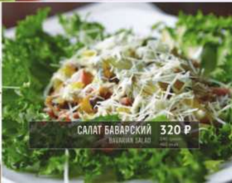
САЛАТ БАВАРСКИЙ 320 Р BAVARIAN SALAD