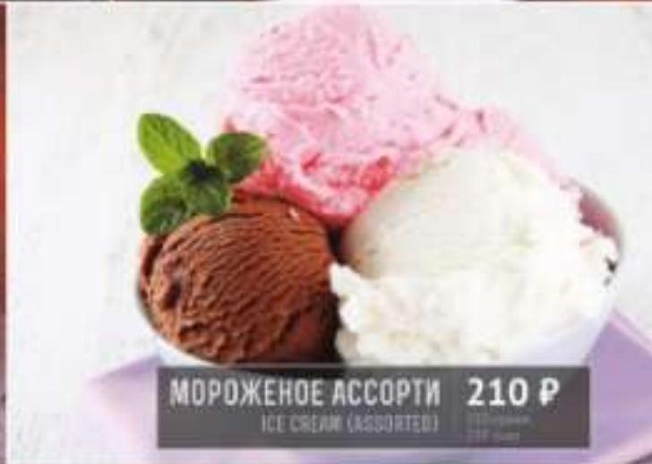
МОРОЖЕНОЕ АССОРТИ 210 Р ICE CREAM (ASSORTED) 130 грамм 239 ккал