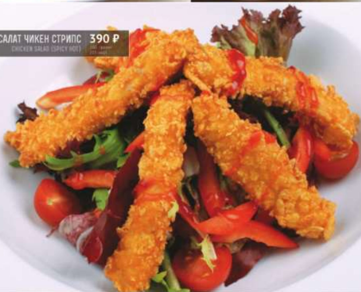
САЛАТ ЧИКЕН СТРИПС 390 Р CHICKEN SALAD (SPICY HOT)