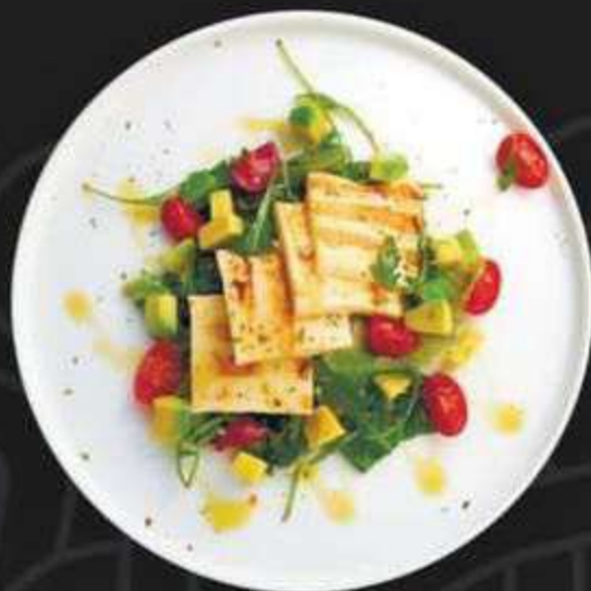
САЛАТ С СЫРОМ ХАЛЛУМИ -490/190г-