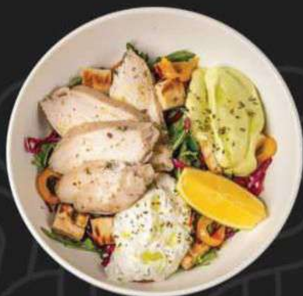
HEALTHY БОУЛ С КУРИЦЕЙ СУ-ВИД -550/310г-