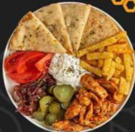
ОПЕН ГИРОС С КУРИЦЕЙ СПАЙСИ -390/350г-