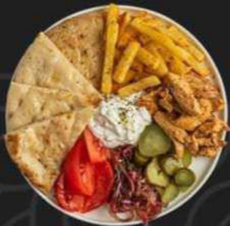
ОПЕН ГИРОС С КУРИЦЕЙ -390/350г-