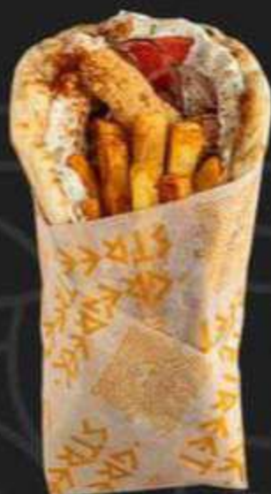
ГИРОС С КУРИЦЕЙ -330/280г-