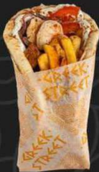
ГИРОС С КРЕВЕТКАМИ -430/280г-