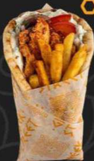
ГИРОС С КУРИЦЕЙ СПАЙСИ -330/280г-