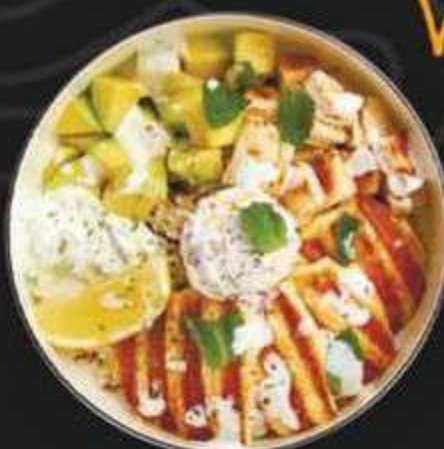
БОУЛ С СЫРОМ ХАЛЛУМИ -530/400г-