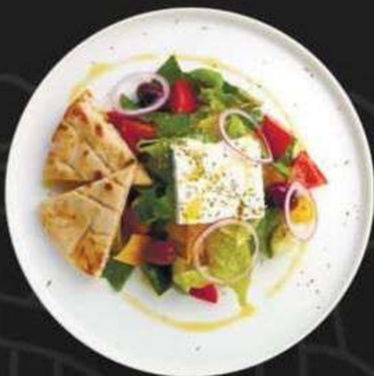
САЛАТ GREKO -430/210г-