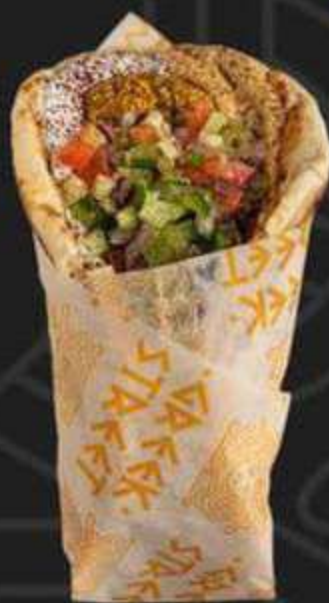
ГИРОС С ФАЛАФЕЛЕМ -330/280г-