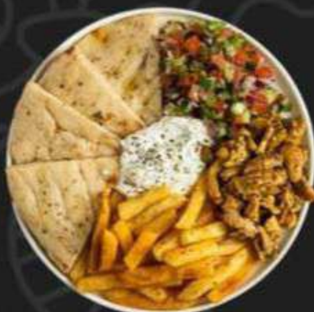
ОПЕН ГИРОС С КУРИНОЙ ШАВЕРМОЙ -390/330г-