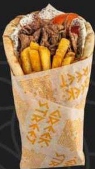
ГИРОС С ТОМЛЕННОЙ ГОВЯДИНОЙ -390/300г-