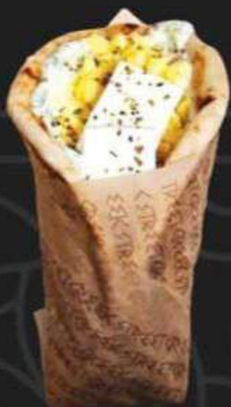
ГИРОС СО СКРЕМБЛОМ И СЫРОМ ФЕТА -260/280г-