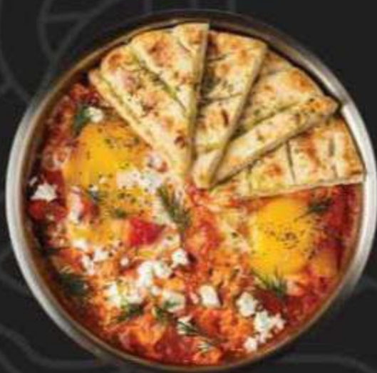
ШАКШУКА С ХАЛЛУМИ И ПИТОЙ -320/250г-