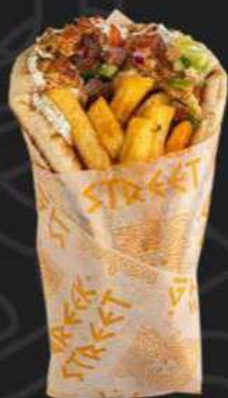
ГИРОС С КУРИНОЙ ШАВЕРМОЙ -330/280г-