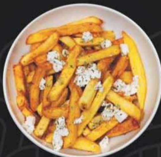
КАРТОФЕЛЬ ФРИ С ФЕТОЙ И ОРЕГАНО