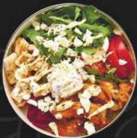
БОУЛ С КУРИЦЕЙ -490/400г-