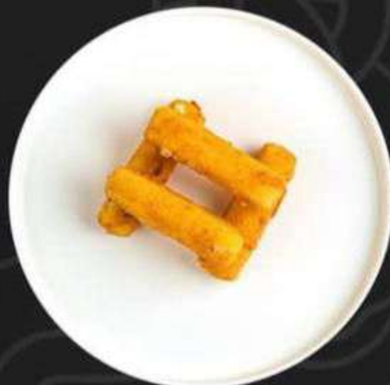
СЫРНЫЕ ПАЛОЧКИ ХАЛЛУМИ