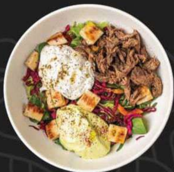
HEALTHY БОУЛ С ТОМЛЕННОЙ ГОВЯДИНОЙ СУ-ВИД -590/300г-