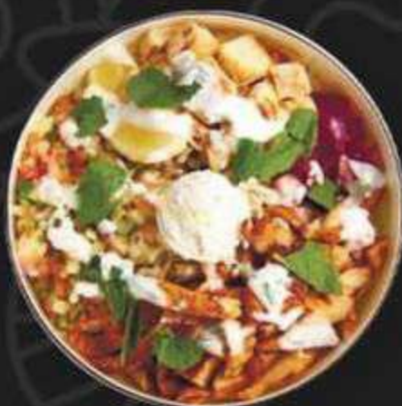
БОУЛ С КУРИНОЙ ШАВЕРМОЙ -490/400г-