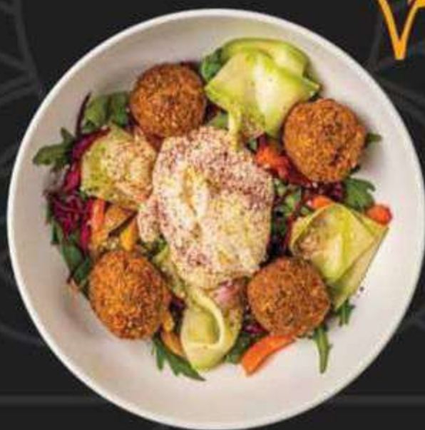
HEALTHY БОУЛ С ФАЛАФЕЛЕМ -530/330г-