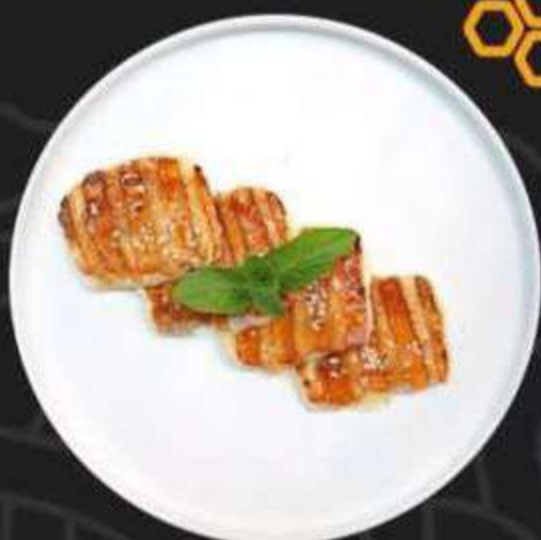
СЫР ХАЛЛУМИ НА ГРИЛЕ С МЁДОМ И КУНЖУТОМ