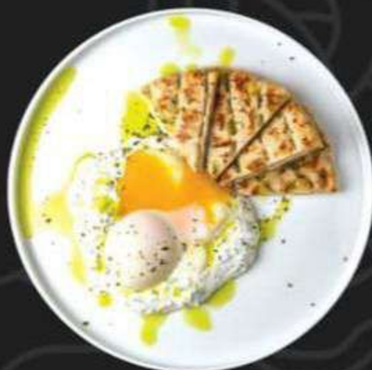
ЯЙЦО ПАШОТ С ДЗАДЗЫКИ И ПИТОЙ -270/220г-