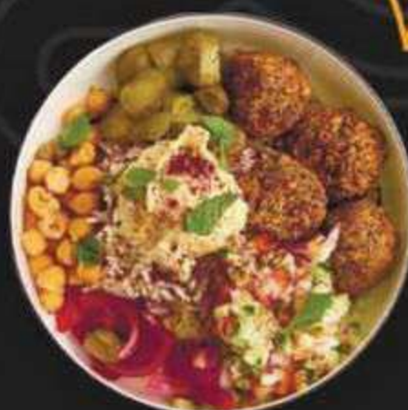
БОУЛ С ФАЛАФЕЛЕМ -460/400г-