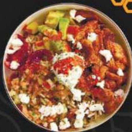
БОУЛ С КУРИЦЕЙ СПАЙСИ -490/400г-