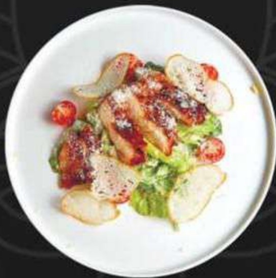
САЛАТ ЦЕЗАРЬ С КУРИЦЕЙ/КРЕВЕТКАМИ -360/530/190г-