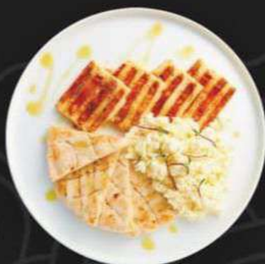
СКРЕМБЛ С ХАЛЛУМИ И ПИТОЙ -350/280г-