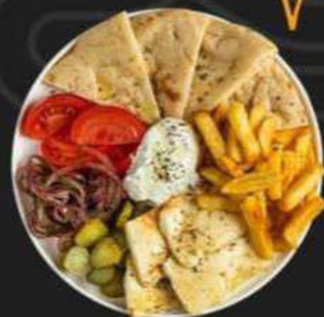
ОПЕН ГИРОС С СЫРОМ ХАЛЛУМИ -430/320г-