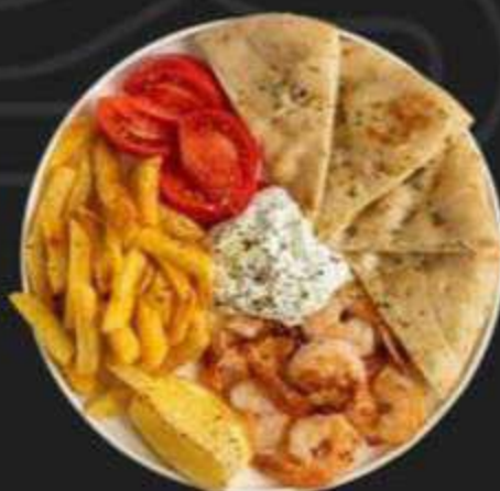
ОПЕН ГИРОС С КРЕВЕТКАМИ -490/320г-