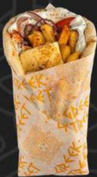
ГИРОС С СЫРОМ ХАЛЛУМИ -360/280г-