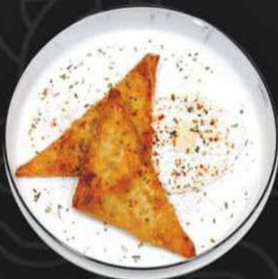
ПИРОЖКИ С СЫРОМ ФЕТА И ДЗАДЗЫКИ