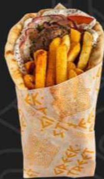
ГИРОС БИФТЕКИ -390/300г-