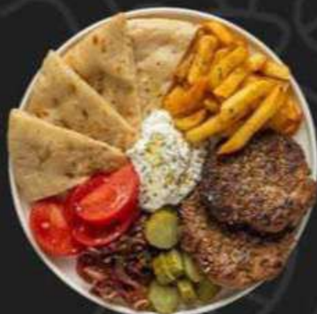
ОПЕН ГИРОС БИФТЕКИ -430/390г-