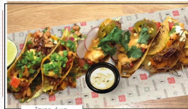
Такос, 6 шт.