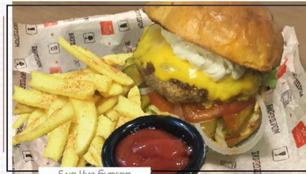
Блю Чиз бургер