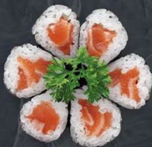
연어를 430.- 100 g Ролл с лососем Roll with salmon