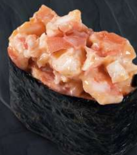
새우 스파이시 200.- 35 g 스파이시 с креветкой Spicy gunkan with shrimp