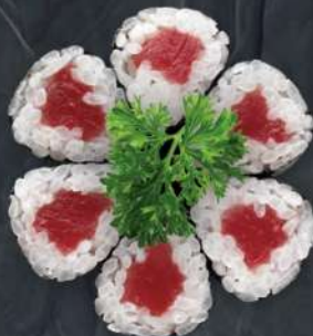
참치를 430.- 100 g Ролл с тунцом Roll with tuna