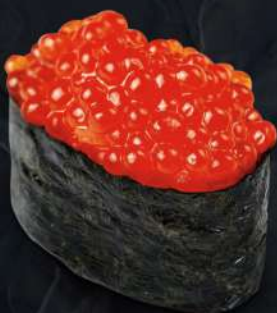
연어알 270.- 30 g Икра лососа Salmon caviar