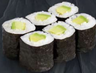
아보카도를 280.- 100 g Ролл с авокадо Roll with avocado