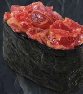
참치 스파이시 220.- 35 g 스파이시 с тунцом Spicy gunkan with tuna