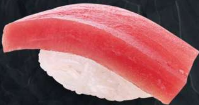
참치 200.- 35 g Тунец Tuna