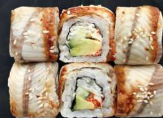
장어알 970.- 240 g Чано Аль Рис, нори, угорь, мясо краба, авокадо, кунжут, огурец, икра летучей рыбы, японский майонез Rice, nori, eel, crab, cucumber, flying fish roe, avocado, sesame seeds, japanese mayonnaise