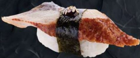
장어 200.- 33 g Угорь Eel