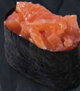
연어 스파이시 200.- 35 g 스파이시 с лососем Spicy gunkan with salmon