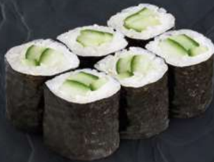
오이롤 220.- 100 g Ролл с огурцом Roll with cucumber