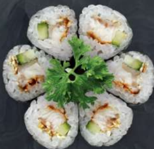
장어를 430.- 100 g Ролл с угрём Roll with eel