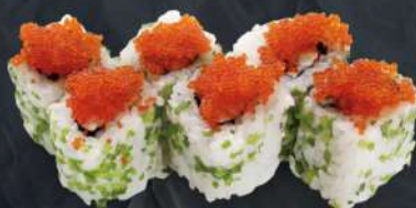
연어알 800.- 210 g Ено Аль Тигровая креветка, икра лососа, сибует, огурец. Tiger shrimp, salmon roe, chives, cucumber.