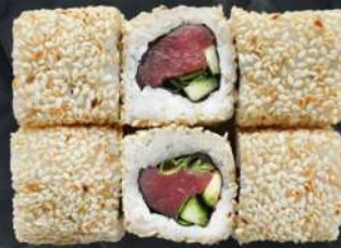
스파이시참치를 690.- 190 g Острый ролл с тунцом Рис, нори, тунец, огурец, кунжут, сибует, соус «кимчи» Rice, nori, tuna, cucumber, sesame seeds, chives, kimchi sauce