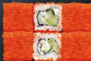
캘리포니아 800.- 200 g Калифорния Рис, нори, мясо краба, огурец, авокадо, японский майонез, икра летучей рыбы Rice, nori, cucumber, crab, avocado, japanese mayonnaise, flying fish roe