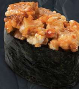
장어 스파이시 220.- 35 g 스파이시 с угрём Spicy gunkan with eel