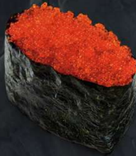
날치알 180.- 30 g Икра летучей рыбы Flying Fish Caviar