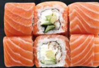
필라델피아 880.- 240 g Филадельфия Рис, нори, лосось, авокадо, огурец, угорь, сливочный сыр Rice, nori, salmon, eel, cucumber, avocado, cream cheese