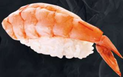
새우 180.- 33 g Тигровая креветка Tiger shrimp