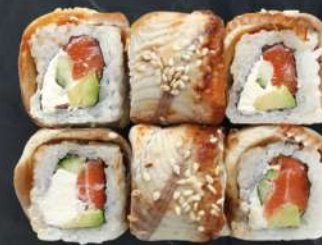
캐나다 950.- 240 g Канадский Рис, нори, угорь, лосось, огурец, авокадо, кунжут, сливочный сыр Rice, nori, salmon, eel, cucumber, avocado, cream cheese, sesame seeds