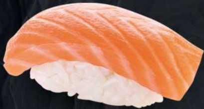
연어 190.- 35 g Лосось Salmon