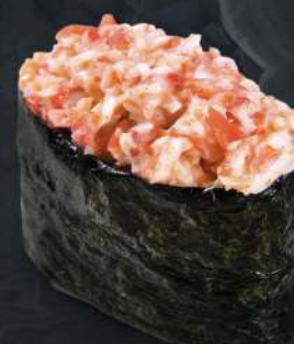
게 스파이시 220.- 35 g 스파이시 с крабом Spicy gunkan with crab