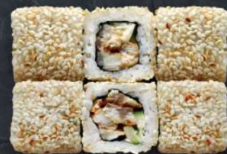
참깨장어 880.- 200 g Угорь с кунжутом Рис, нори, угорь, огурец, кунжут японский майонез Rice, nori, cucumber, eel, japanese mayonnaise, sesame seeds