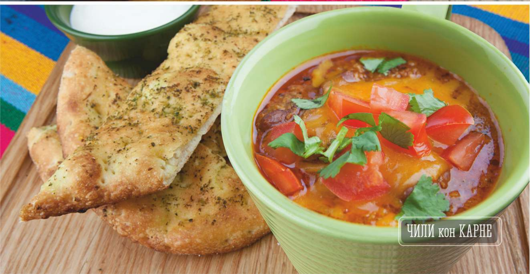
ЧИЛИ КОН КАРНЕ