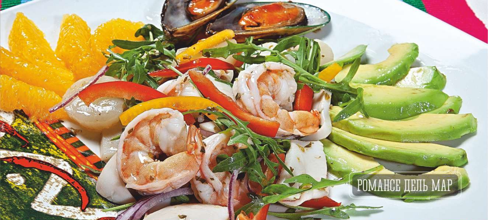
РОМАНСЕ ДЕЛЬ МАР