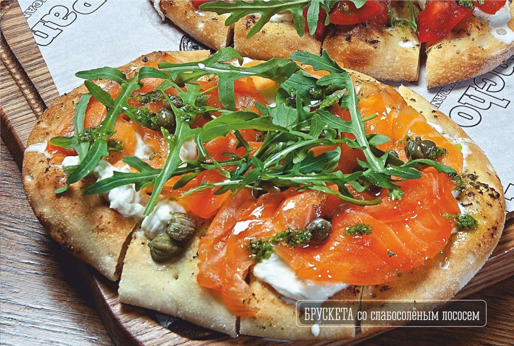
БРУСКЕТА со слабосоленым лососем