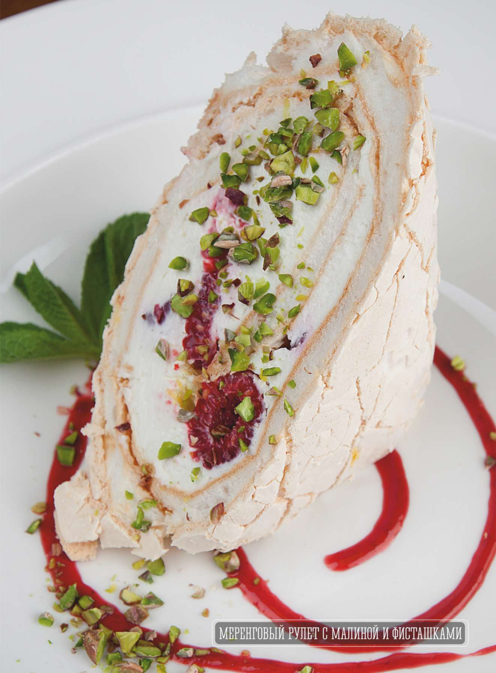
МЕРЕНГОВЫЙ РУЛЕТ С МАЛИНОЙ И ФИСТАШКАМИ