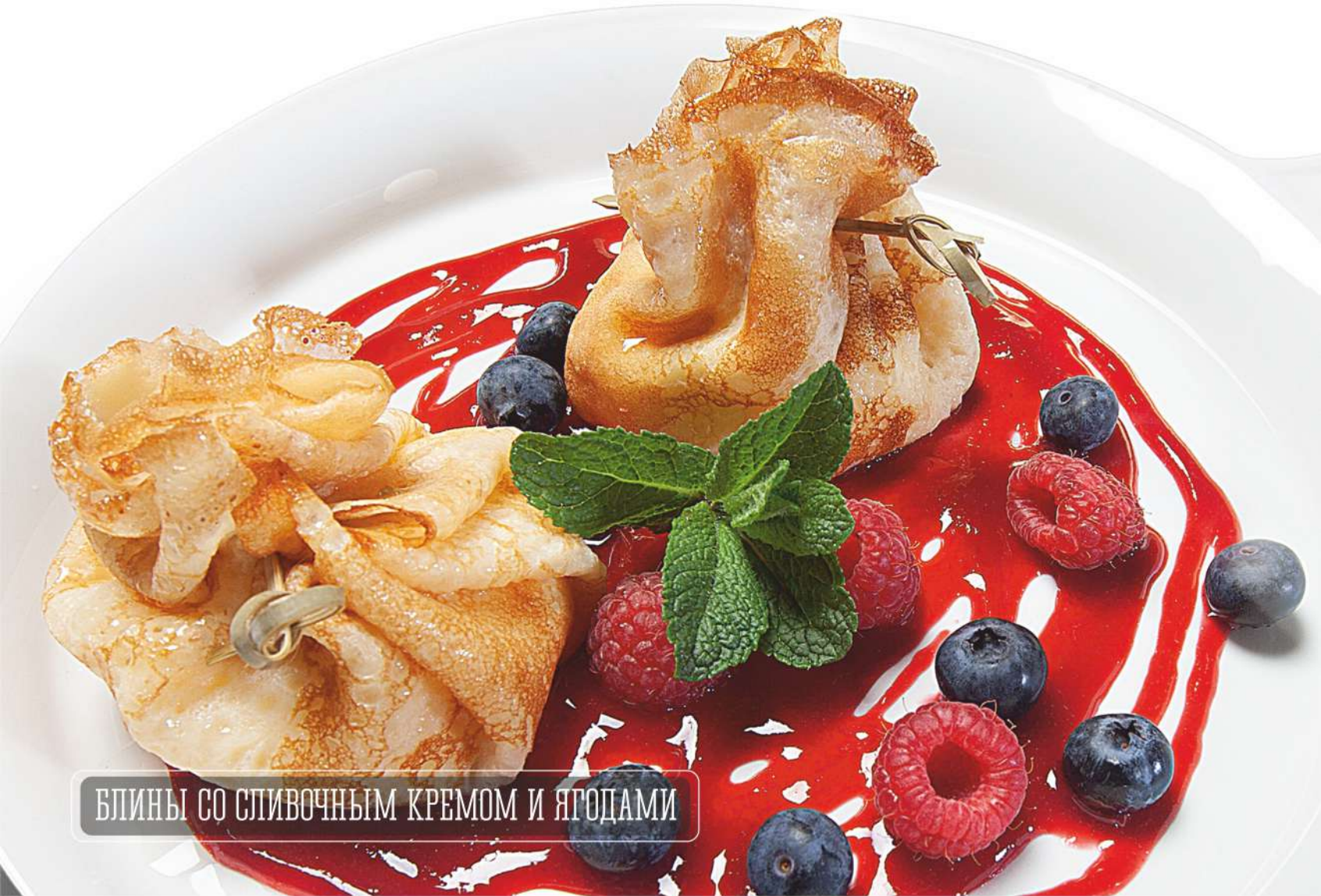
БЛИНЫ СО СЛИВОЧНЫМ КРЕМОМ И ЯГОДАМИ