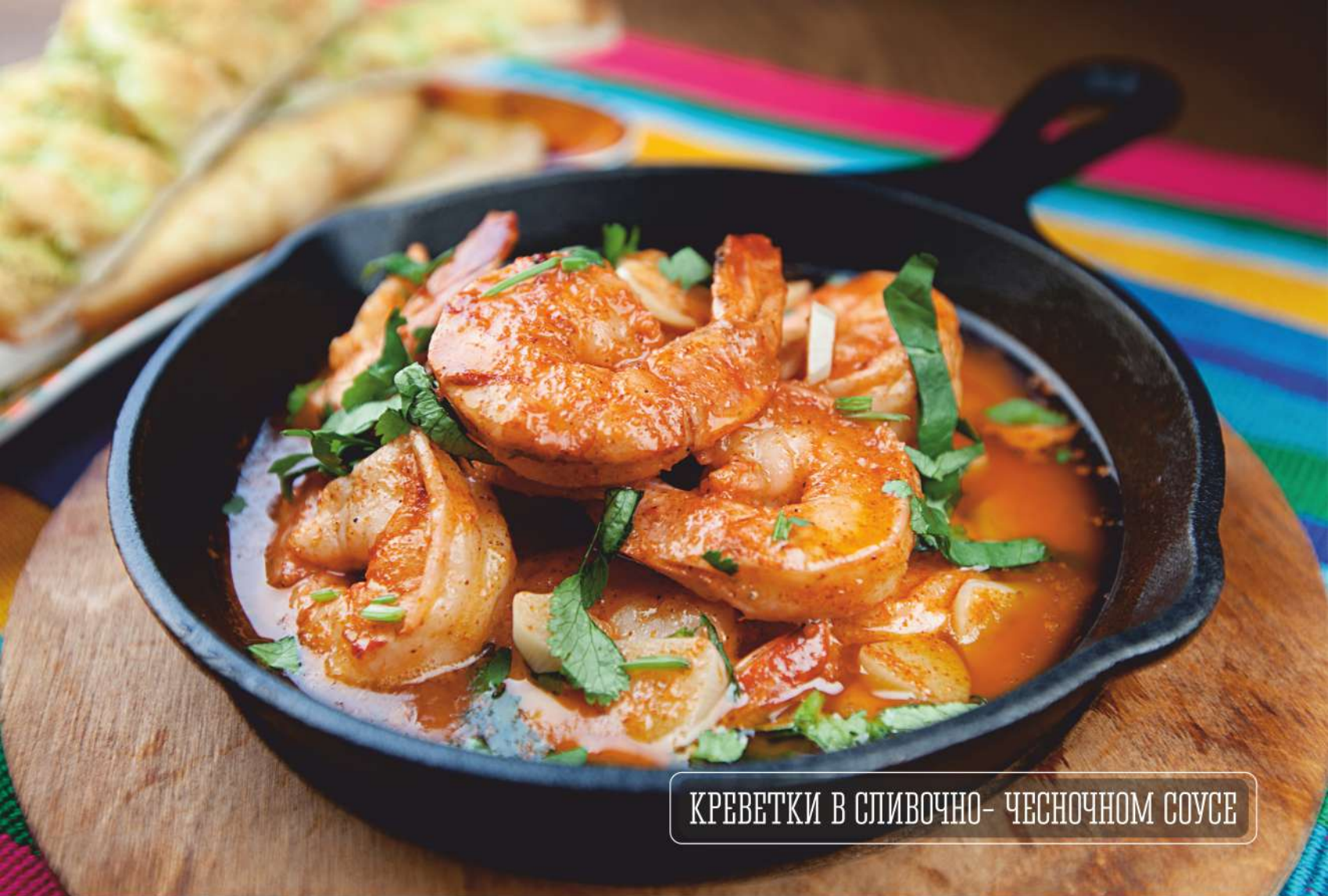
КРЕВЕТКИ В СЛИВОЧНО- ЧЕСНОЧНОМ СОУСЕ