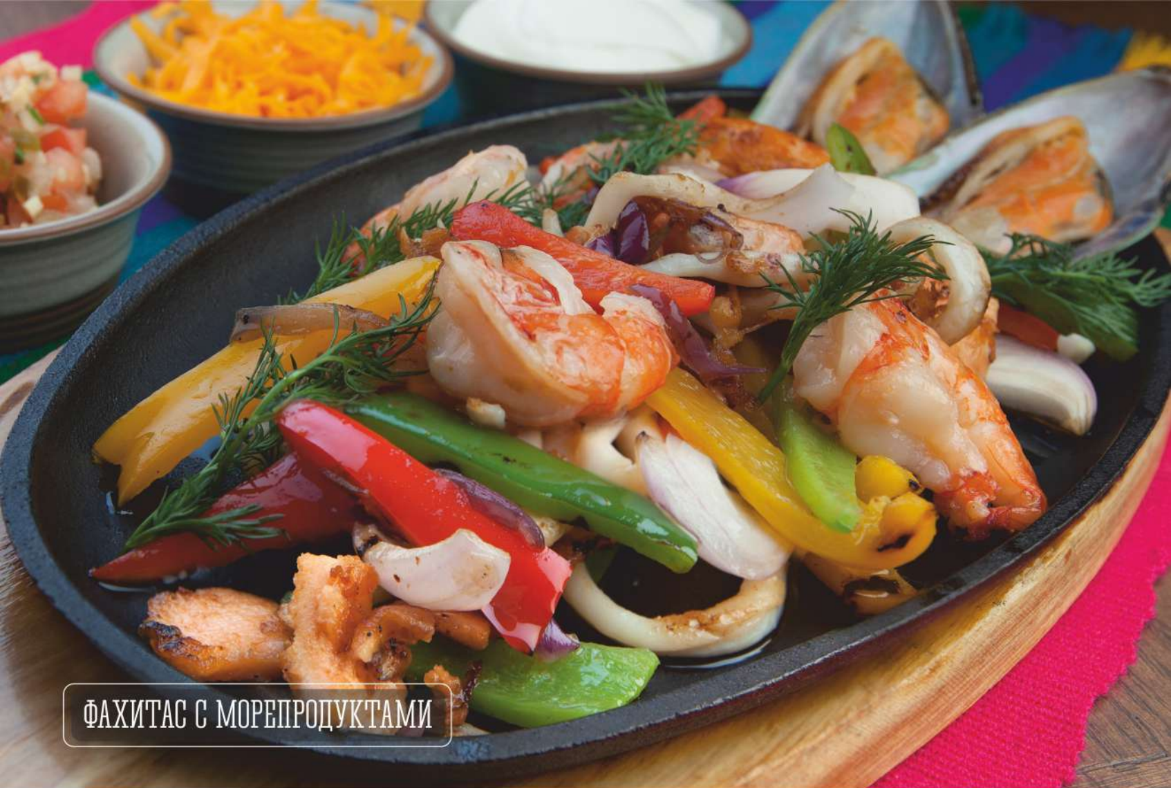
ФАХИТАС С МОРЕПРОДУКТАМИ