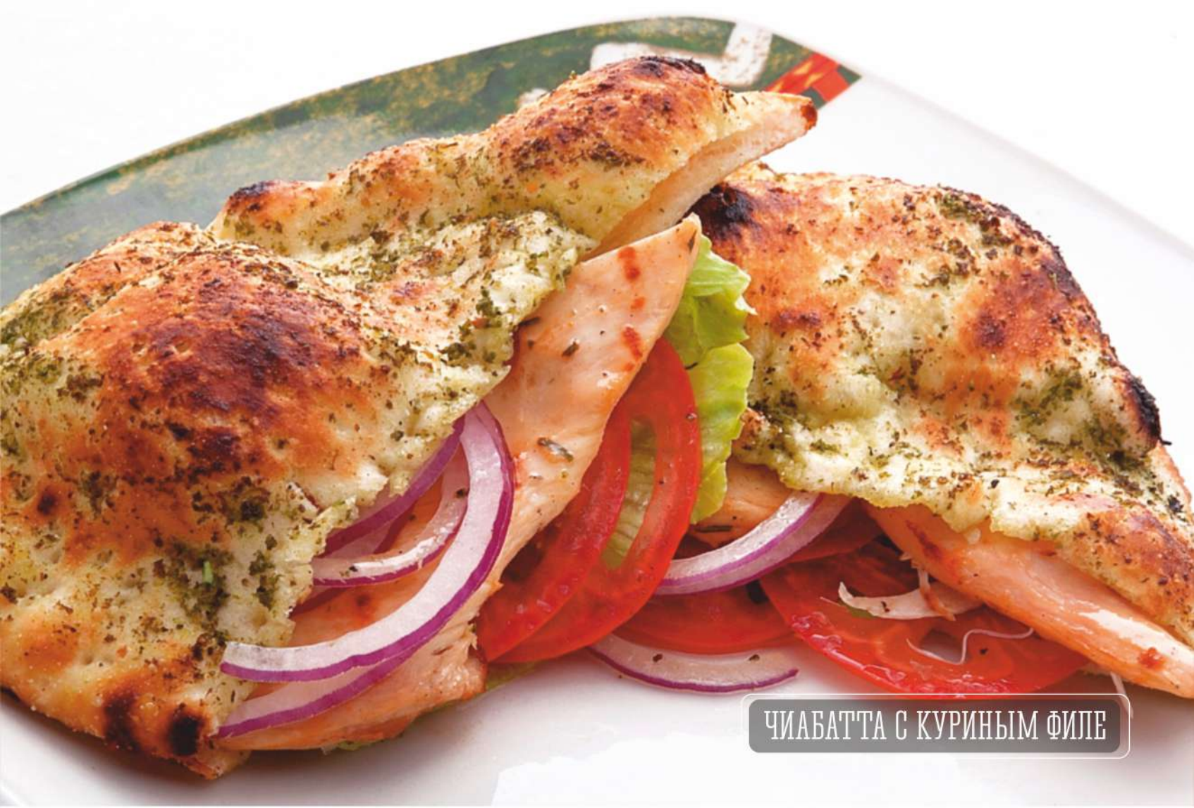
ЧИАБАТТА С КУРИНЫМ ФИЛЕ