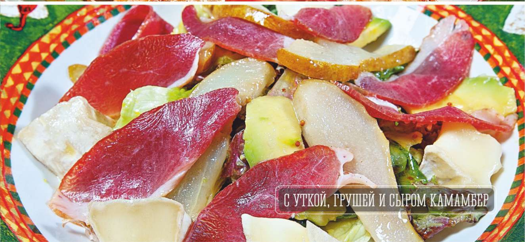
С УТКОЙ, ГРУШЕЙ И СЫРОМ КАМАМБЕР