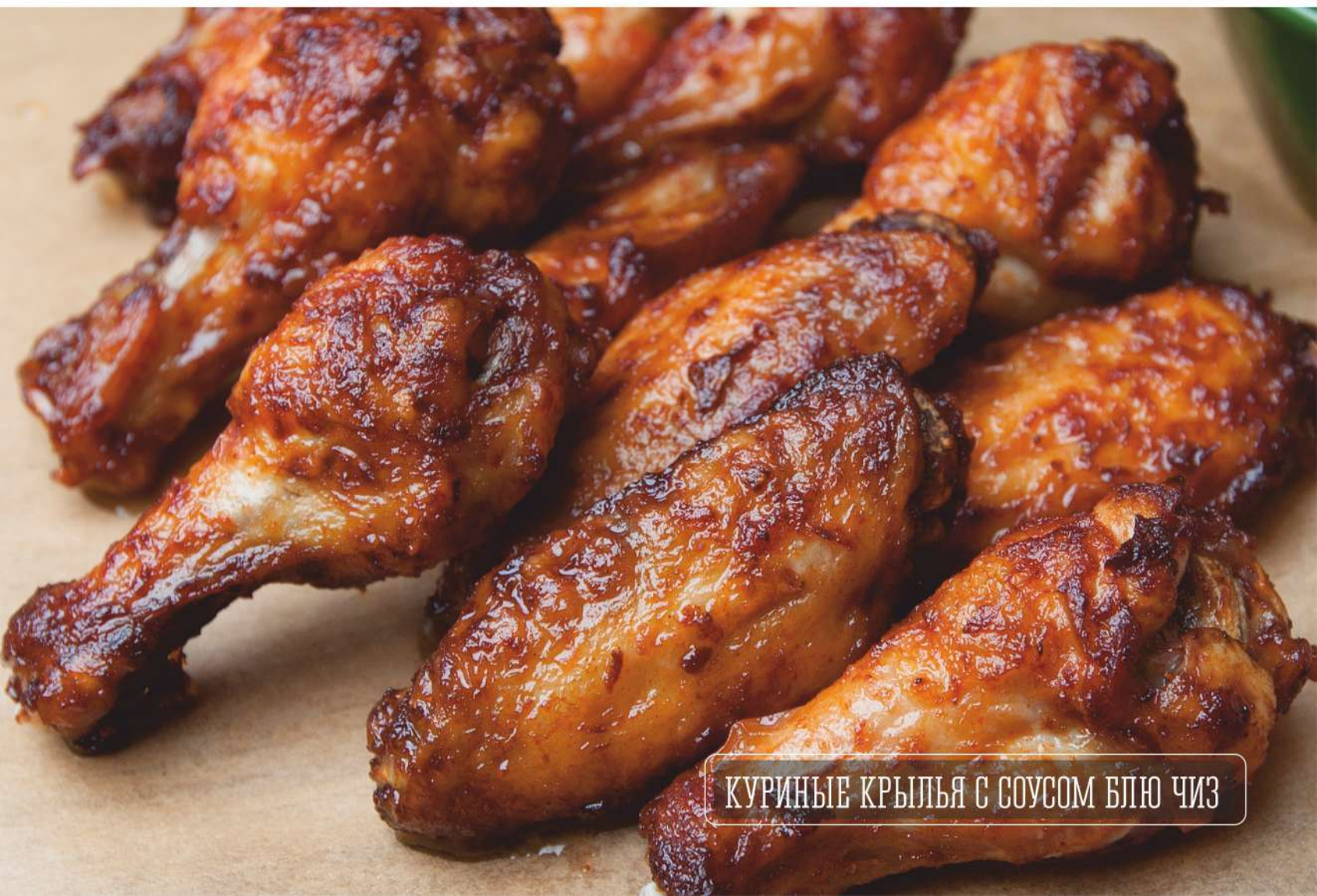
КУРИНЫЕ КРЫЛЬЯ С СОУСОМ БЛЮ ЧИЗ