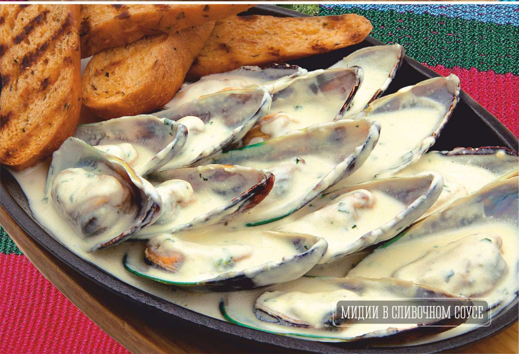
МИДИИ В СЛИВОЧНОМ СОУСЕ