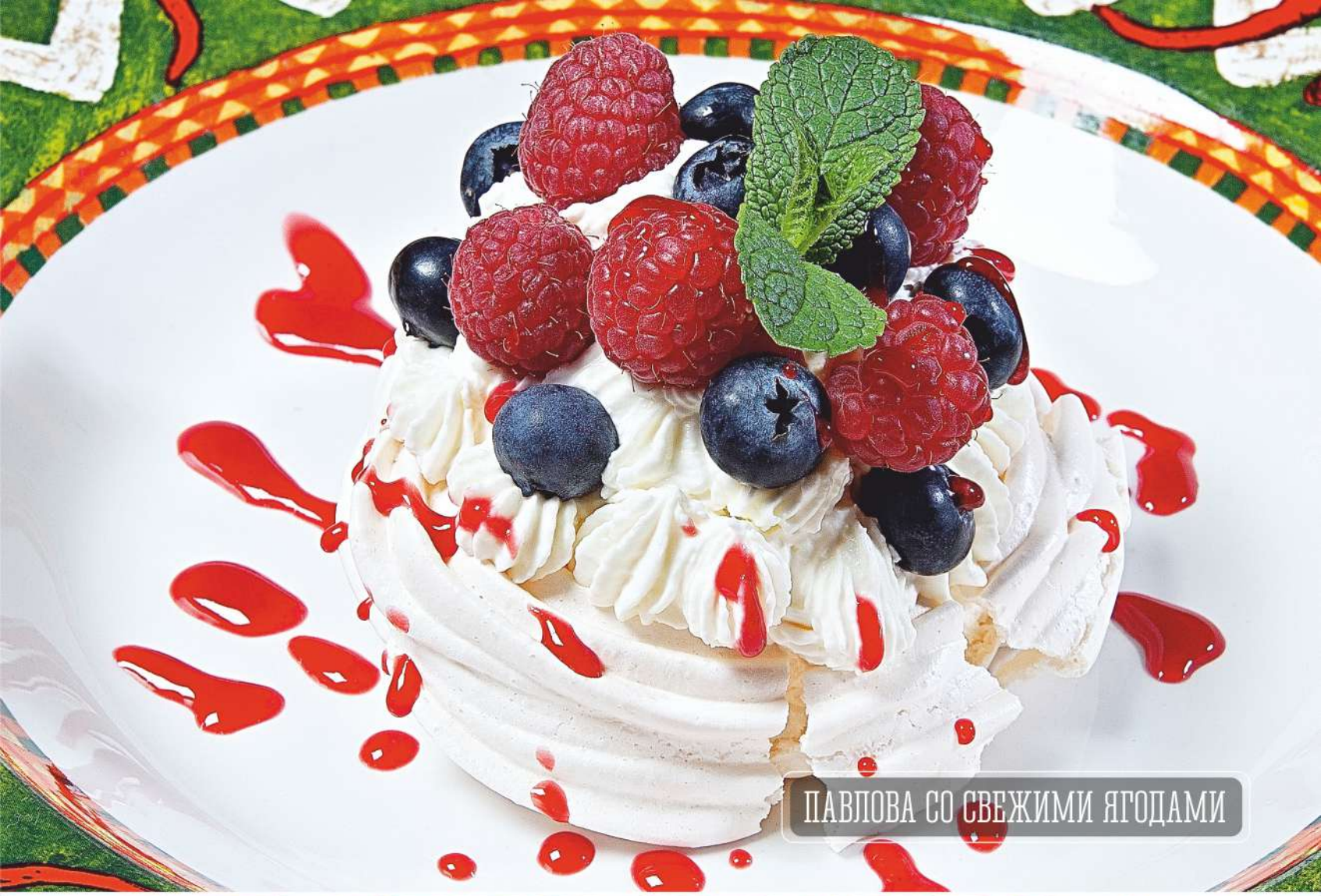
ПАВЛОВА СО СВЕЖИМИ ЯГОДАМИ