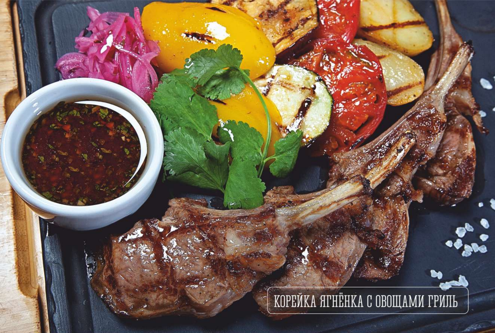
КОРЕЙКА ЯГНЁНКА С ОВОЩАМИ ГРИЛЬ