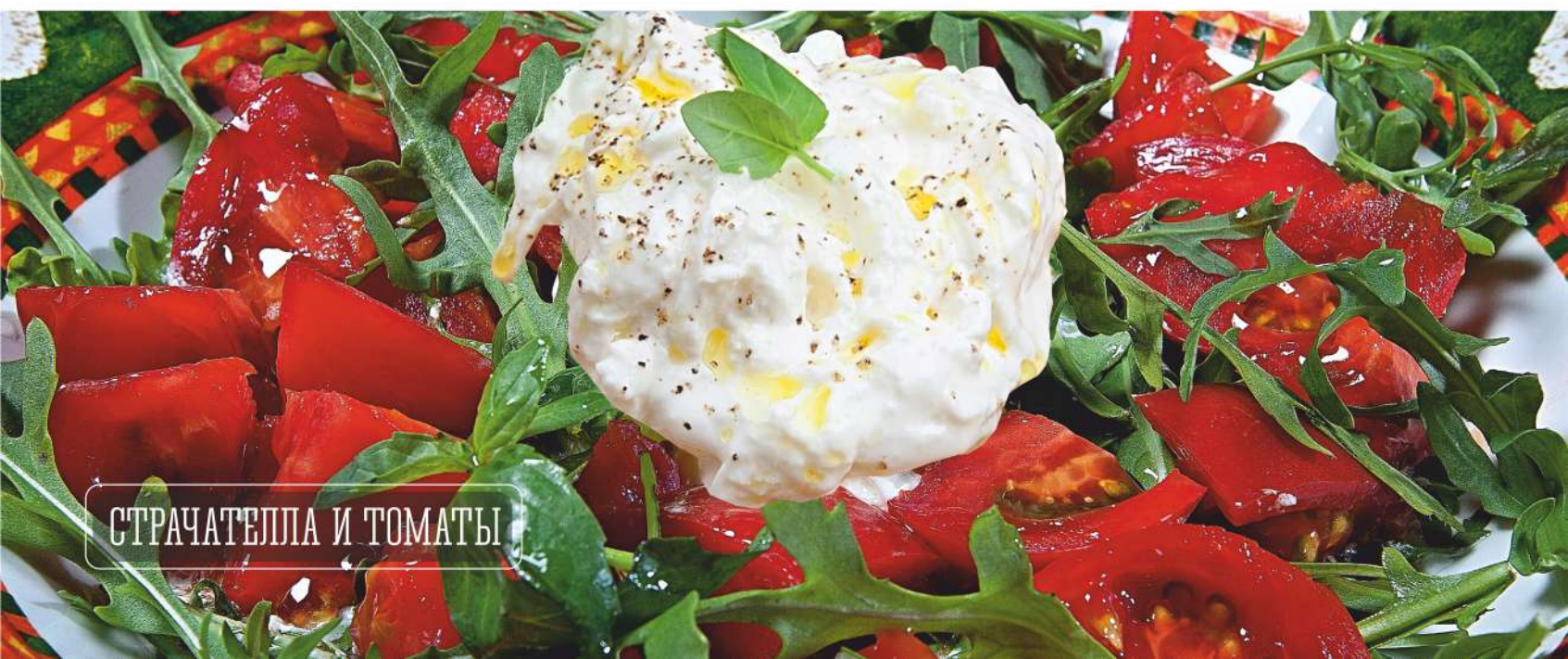
СТРАЧАТЕЛЛА И ТОМАТЫ