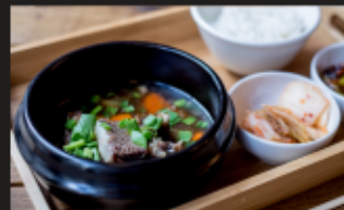
КАЛЬБИТАН Говяжьи ребра, лук, чеснок, морковь, специи + РИС + ЗАКУСКИ Вес: 290/100/90 г.