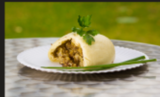
ПЯН-СЕ КЛАССИЧЕСКИЙ Свинина, говядина, капуста белокачанная, специи Вес: 260 г.