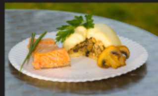
ПЯН-СЕ С СЁМГОЙ Сёмга, шампиньоны, лук Вес: 180 г.