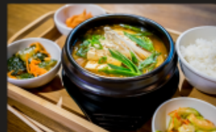
СУП КИМЧИ ТЕГИ Кимчи, свинина, тофу, грибы энoki, лук порей, лук зеленый + РИС + ЗАКУСКИ Вес: 400/90/60 г.