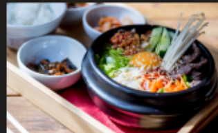
ПИБИМПАБ Рис, говядина, кимчи, морковь, салат, яйцо, грибы энoki, зеленый лук, огурцы, ростки сои, морская капуста + ЗАКУСКИ Вес: 320/90 г.