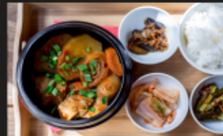
ДАКТОРИТАН Курица, картофель, чеснок, морковь, лук, имбирь, кочудян, зеленый лук + РИС + ЗАКУСКИ Вес: 400/100/90 г.