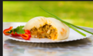
ПЯН-СЕ С КИМЧИ Свинина, говядина, кимчи Вес: 260 г.