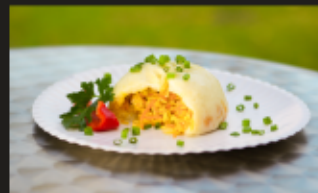
ПЯН-СЕ ВЕГЕТАРИАНСКИЙ Цукини, спаржа, морковь, пекинская капуста Вес: 180 г.