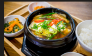
СУП МЕУНТАН Рыба минтай, дайкон, тофу, лук порей + РИС + ЗАКУСКИ Вес: 350/90/60 г.