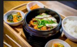
КИМЧИ ЖАРЕНЬИЙ Кимчи, свинина, тофу, специи + РИС + ЗАКУСКИ Вес: 400/90/60 г.