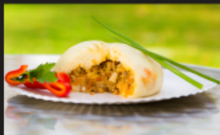
ПЯН-СЕ С КУРИЦЕЙ Курица, фунчеза, гриб муэр, перец сладкий Вес: 180 г.