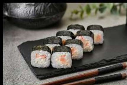
Креветка с сыром (100гр) 210руб