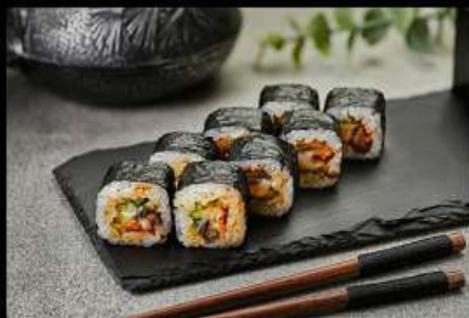
Угорь с огурцом «Унаги» (100гр) 210руб