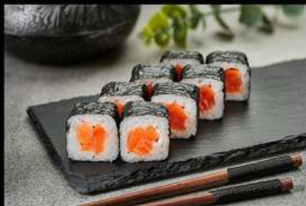
Лосось «Сяке» (100гр) 210руб