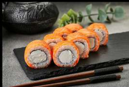
Нежный (220гр) (лосось, сыр) 490руб