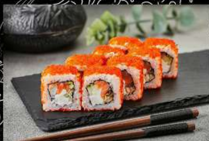
Хиго (200гр) (креветка, угорь, огурец, майонез, тобико) 480руб