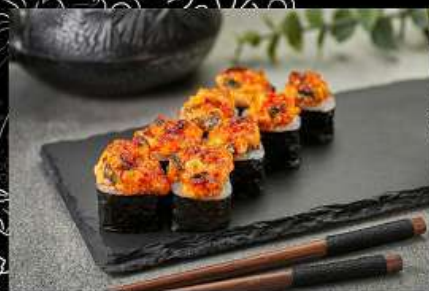
Угорь (180гр) 330руб