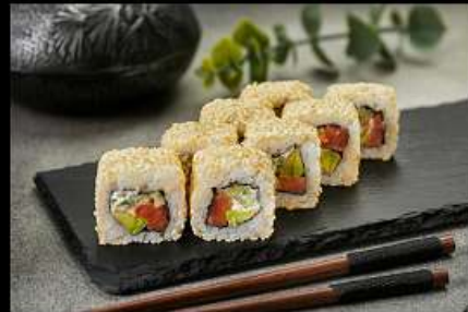
Аляска (180гр) (лосось, огурец, авокадо, кунжут) 290руб