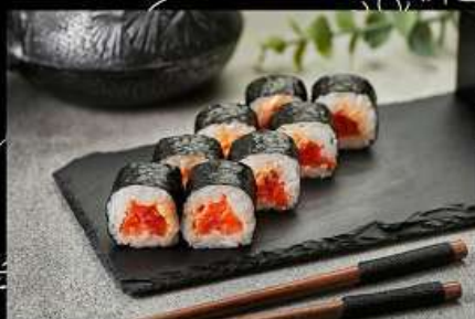
Лосось (110гр) 250руб