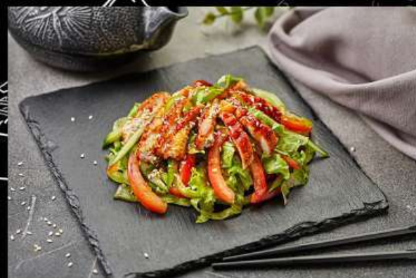
Чука Сарада (180гр)