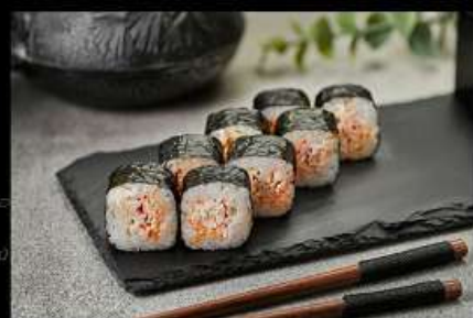
Краб (110гр) 230руб