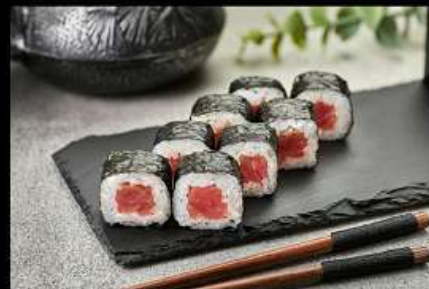
Тунец (100гр) 210руб