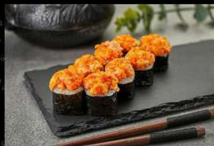
Тунец (180гр) 330руб