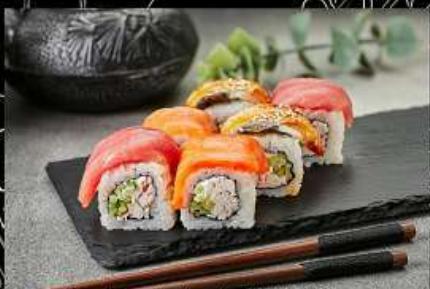
Радуга (220гр) (лосось, тунец, угорь, майонез, огурец, снежный краб) 460руб