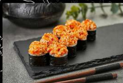
Краб (180гр) 230руб