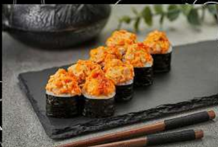
Лосось (180гр) 330руб