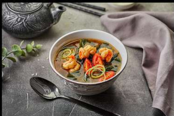
Эби Тай Сиру (300гр)