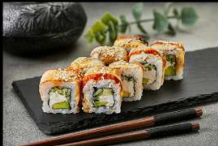
Канада (210гр) (угорь, сыр, авокадо, кунжут, соус унаги) 450руб