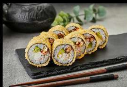
Кани Унаги (230гр)

(тунец, лосось, авокадо, майонез, тобико, кляр, сухари) 320руб