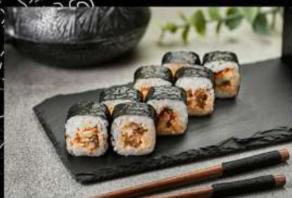
Угорь (110гр) 250руб