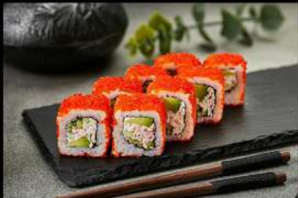
Калифорния (200гр) (снежный краб, огурец, авокадо, тобико) 310руб