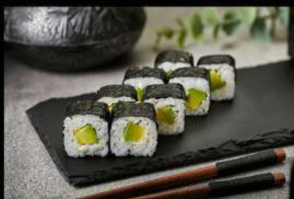
Авокадо (100гр) 160руб