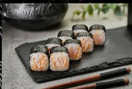
Креветка (110гр) 230руб