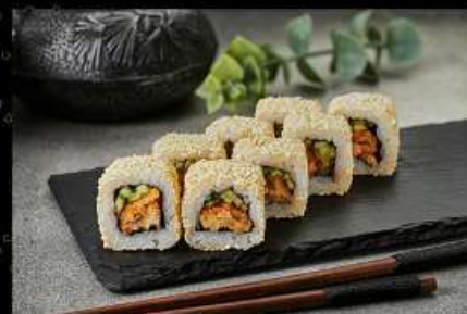
Жареный лосось (200гр) (лосось, кляр, огурец, соус спайси, кунжут) 290руб