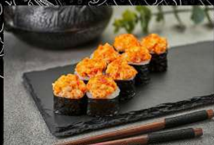
Креветка (180гр) 290руб