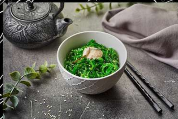
Унаги Сарада (150гр)