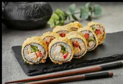
Цезарь Хот (240гр)

(снежный краб, огурец, майонез, тобико, авокадо, кляр, сухари) 310руб