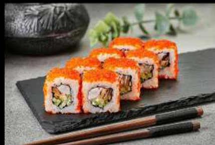
Санкакей (200гр) (лосось, угорь, сыр, огурец, тобико) 470руб