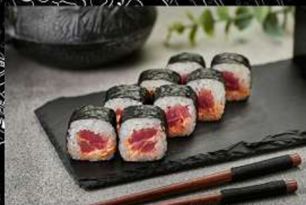
Тунец (110гр) 250руб