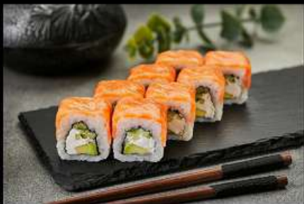
Филадельфия (220гр) (лосось, сыр, огурец, авокадо) 470руб