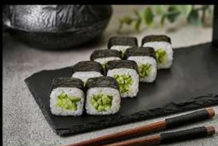
Огурец (100гр) 140руб