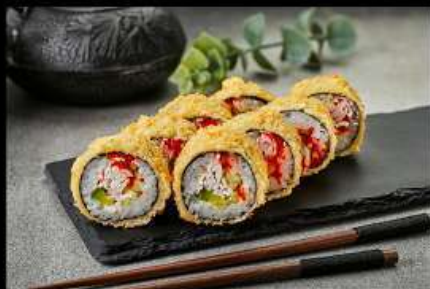
Калифорния темпура (240гр)

(снежный краб, огурец, майонез, тобико, авокадо, кляр, сухари) 310руб