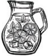
SANGRIA | 1900