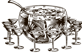
PLANTER'S PUNCH | 2700