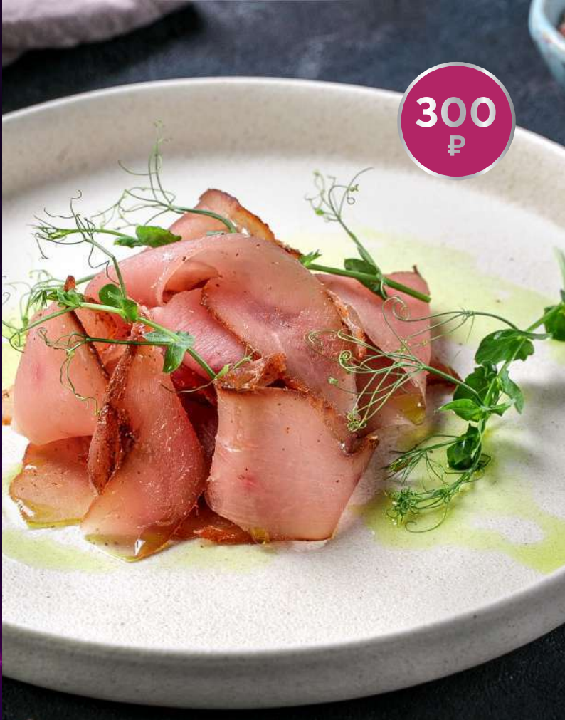
ИНДЕЙКА ВЯЛЕНАЯ, собственного приготовления 100 г