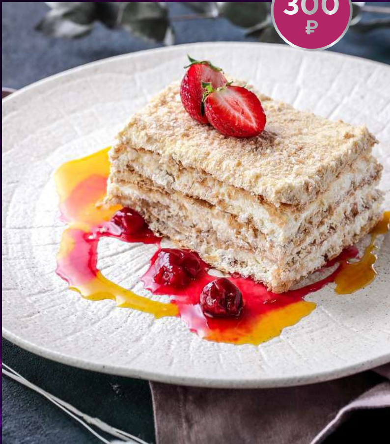
ТОРТ ЭСТЕРАЗИ 160/70 г