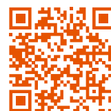
Таблица калорийности блюд

Если у вас есть аллергия на какой-либо вид продуктов, сообщите об этом официанту