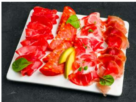
Ассорти ветчин и колбас