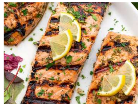
Форель на решетке