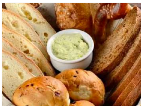
Хлебная корзина на 4 персоны