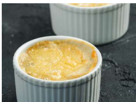
Куриный жульен в кокотнице