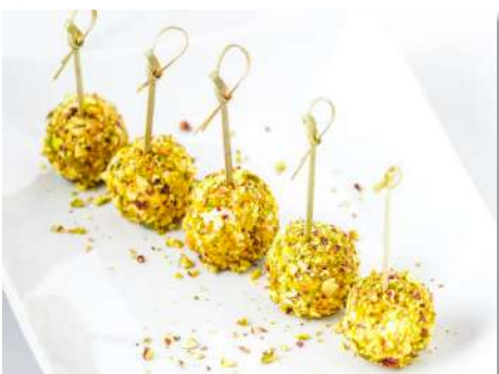
Сырные шарики с виноградом и фисташками