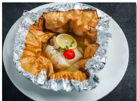
Дорадо, запеченная в фольге