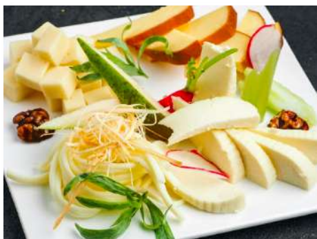
Сырная тарелка Кавказских сыров