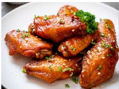
Крылья куриные барбекю