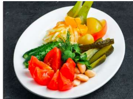
Ассорти соленьев и маринадов