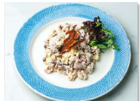
Салат с курицей-гриль, фасолью и беконом