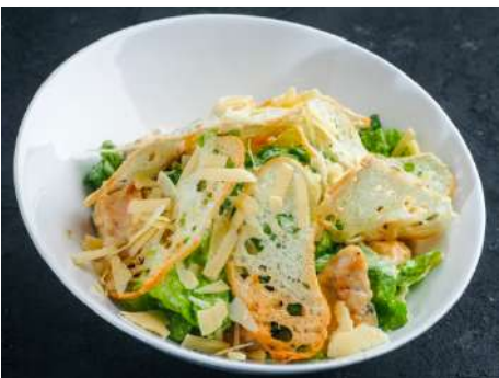
Салат Цезарь с курицей