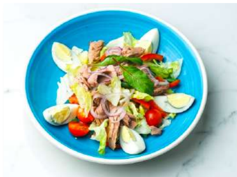
Салат Нисуаз с тунцом