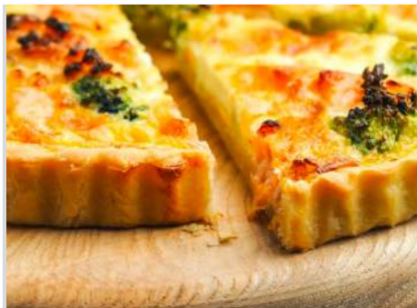
Мини киш лорен с лососем и брокколи