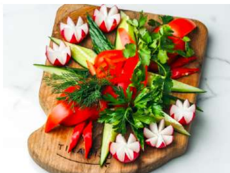
Тарелка свежих овощей со сметаной