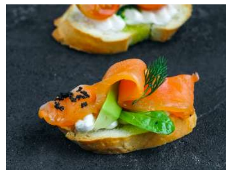
Брускетта с соленым лососем и мягким сыром