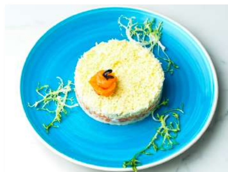
Салат Мимоза с лососем