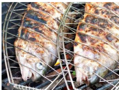
Судак на решетке