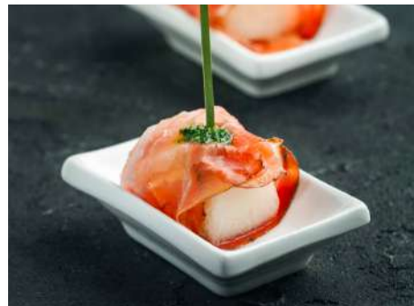
Канapé дыня с пармской ветчиной