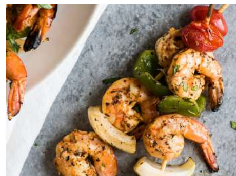
Креветки на решетке