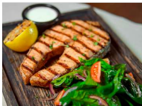
Лосось на решетке