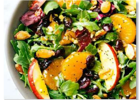
Салат овощной с цитрусовой заправкой