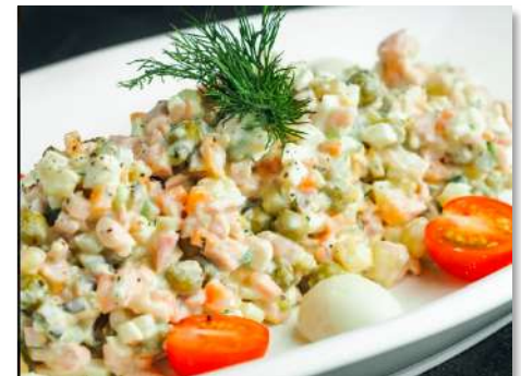
Салат Оливье с копченой куриной грудкой