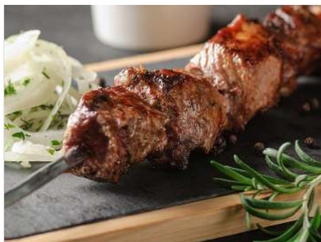
Шашлык из говяжьей вырезки