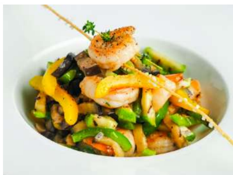
Салат с креветками-гриль