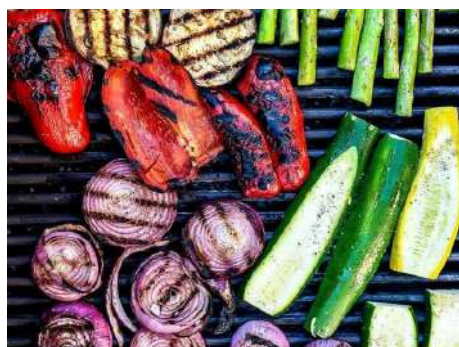
Овощи на решетке