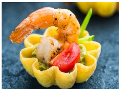
Креветка с гуакамоле в тартелетке