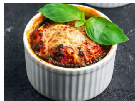
Грибной жульен из белых грибов в кокотнице