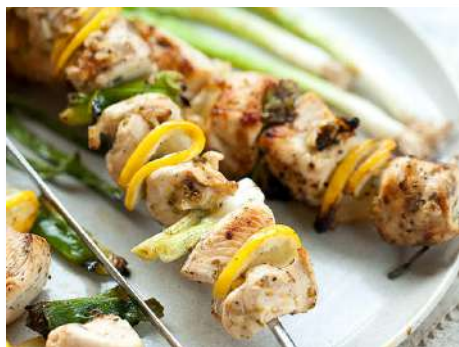
Шашлык из куриного бедр