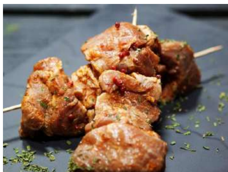
Шашлык из свиной шеи