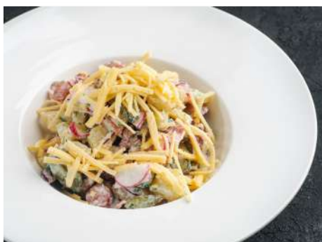
Салат с охотничьими колбасками и беконом