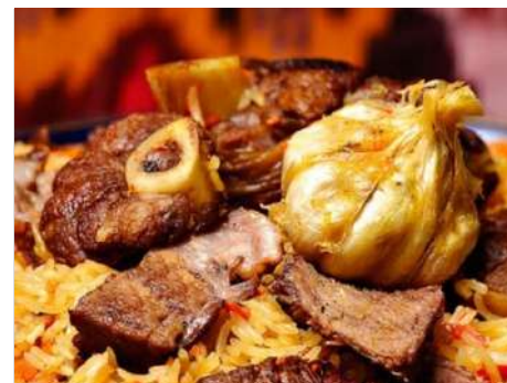
Плов с бараниной