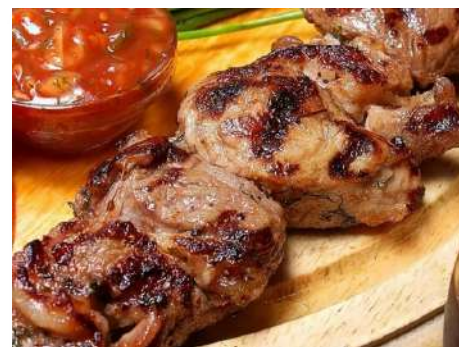
Шашлык из барашка