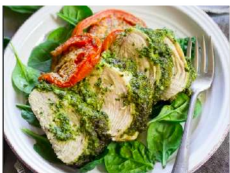
Сальтимбокка из цыпленка с соусом Песто