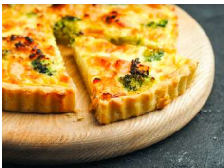
Киш лорен с лососем и брокколи