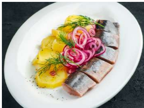
Сельдь домашнего посола с картофелем и маринованным луком