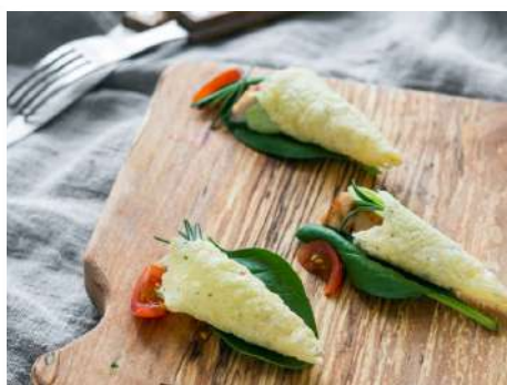
Канapé Цезарь с курицей