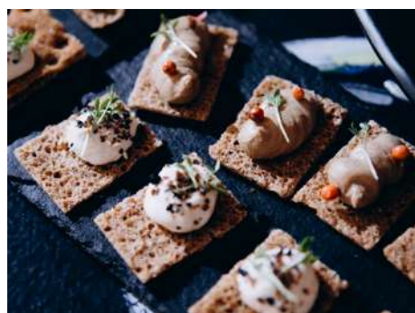
Паштет из куриной печени на хрустящем тосте