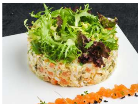
Салат Оливье с лососем и авокадо