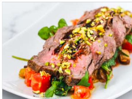
Салат с ростбифом