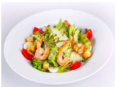
Салат Цезарь с креветками