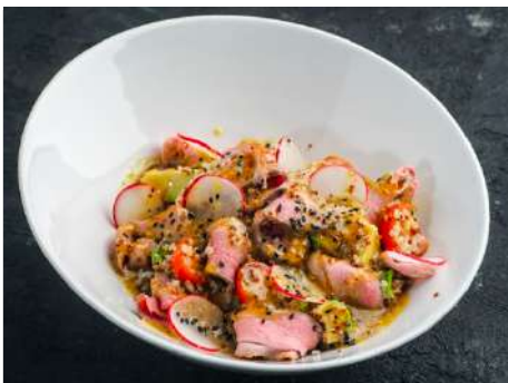
Салат с утиной грудкой и киноа с заправкой из манго