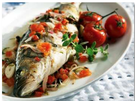
Сибас на решетке