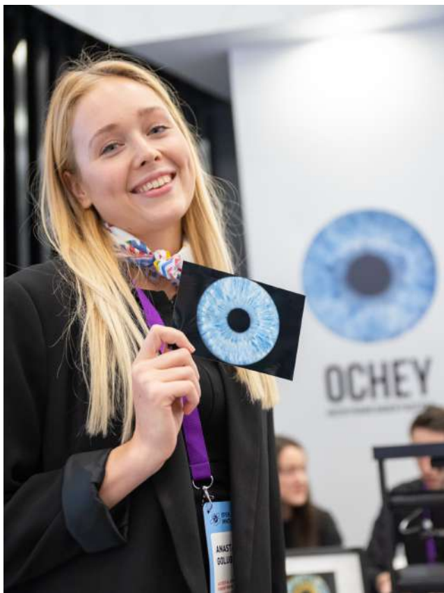
ФОТО РАДУЖКИ ГЛАЗА

Каждый гость Вашего мероприятия получит самую уникальную фотографию в своей жизни!