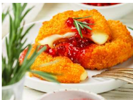
Жареный сыр с брусничным соусом