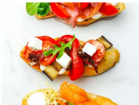
Брускетта с печеными овощами и сыром Фета