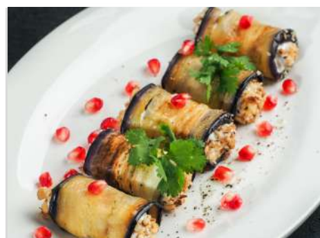
Рулетики из баклажан с мягким сыром и орехами