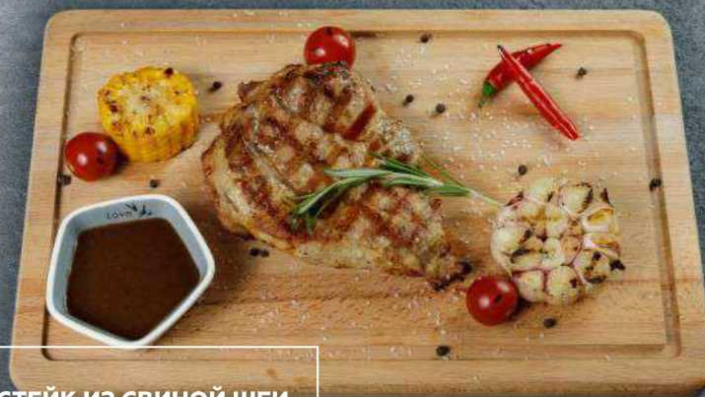
СТЕЙК ИЗ СВИНОЙ ШЕИ