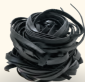
ТАЛЬЯТЕЛЛЕ С ЧЕРНИЛАМИ КАРАКАТИЦЫ