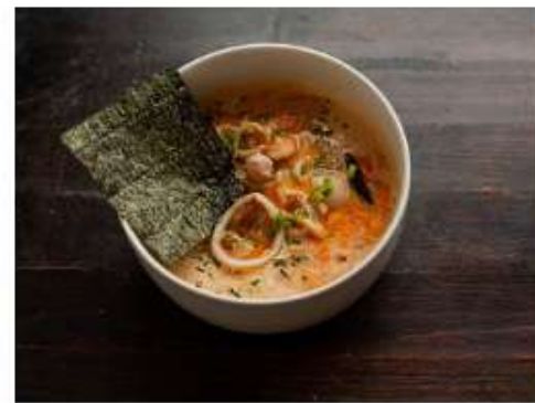
Рамэн с морепродуктами 800 г. 800 мл