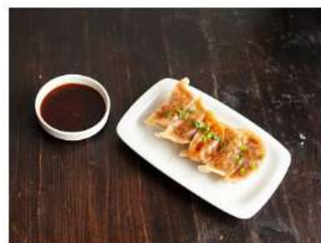
Гедза с креветками