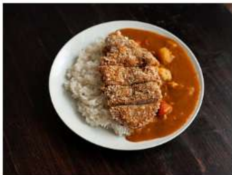
Кацу карри 550 г.