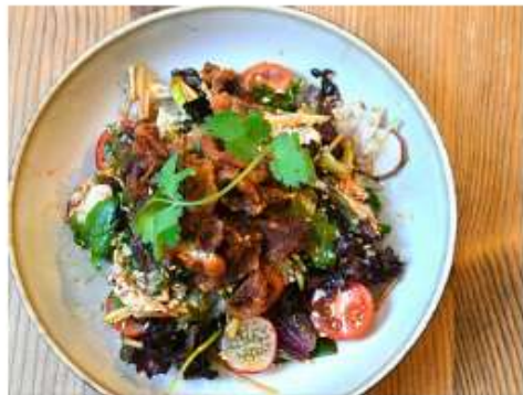
Салат с уткой