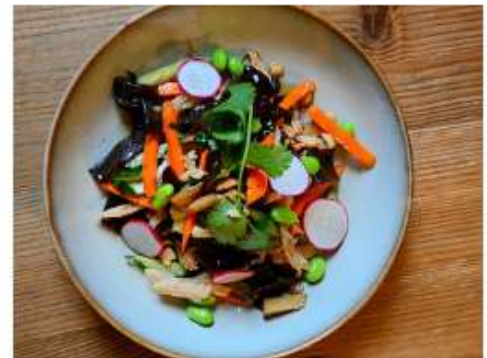
Салат с древесными грибами