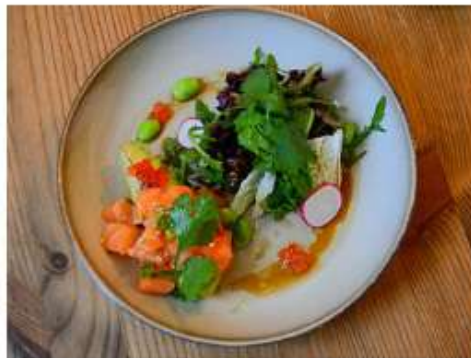
Салат с лососем и авокадо