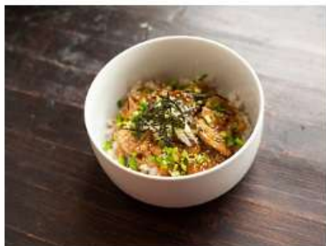
Донбури курица терияки 350 г.