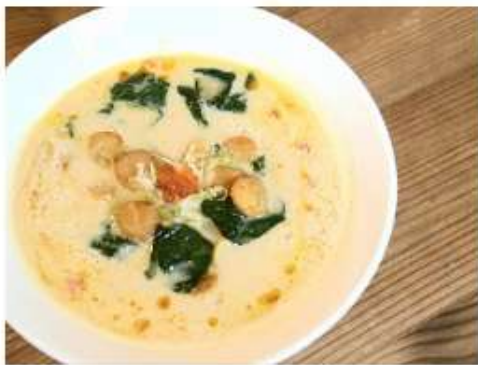
Сырный рамэн с гребешком 800 г. 800 мл