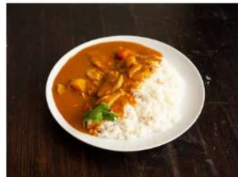
Донбури курица карри 430 г.