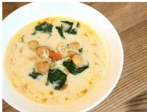
Сырный рамэн с гребешком 400 г.