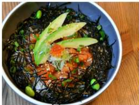
Донбури с лососем и авокадо 330 г.