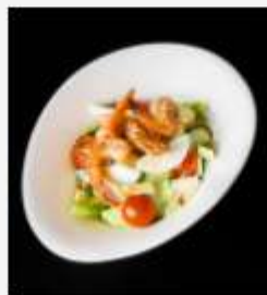
"Шримп" с креветками