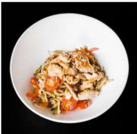
WOK с куриной грудкой