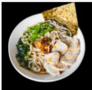
Рамен мисо с куриной грудкой