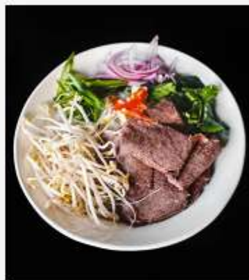
Фо-Бо с говядиной