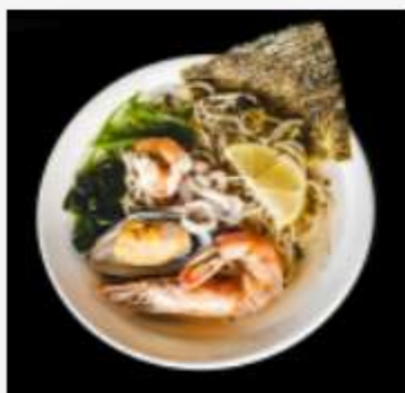
Рамен с морепродуктами