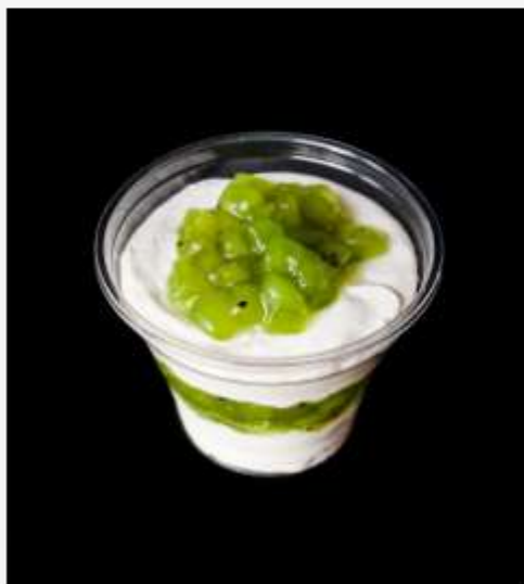
Творожный с киви