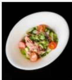
"Фиш" с тунцом