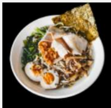
Рамен со свининой