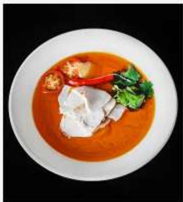
Том-Ям с куриной грудкой