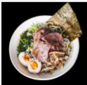
Рамен с говядиной