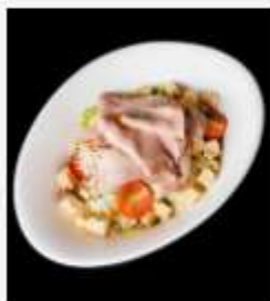
"Цезарь" с говяжьим языком