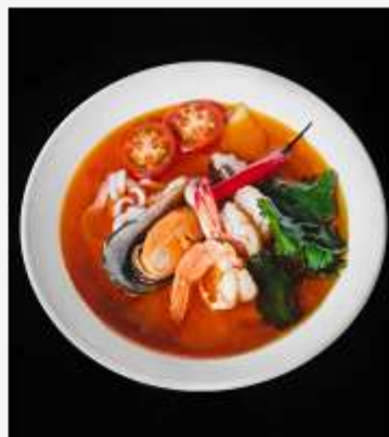
Том-Ям с морепродуктами