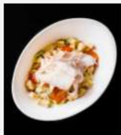
"Цезарь" с куриной грудкой