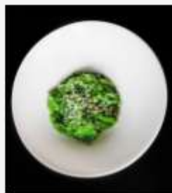
"Чукка" с ореховым соусом