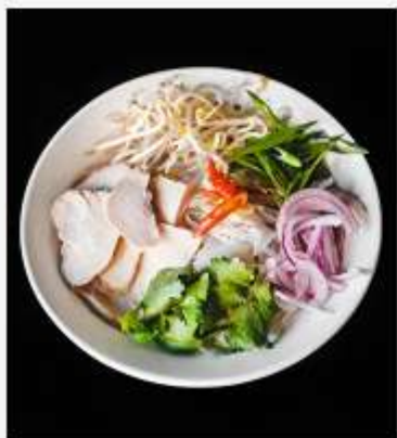
Фо-Га с куриной грудкой