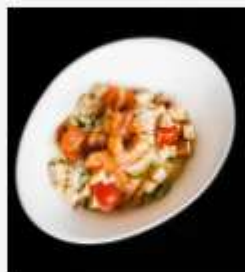
"Цезарь" с креветками