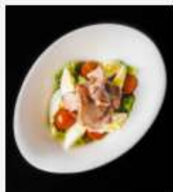
"Гютан" с говяжьим языком