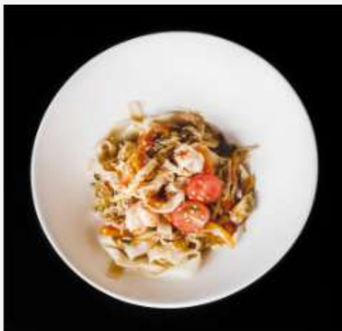
WOK с морепродуктами