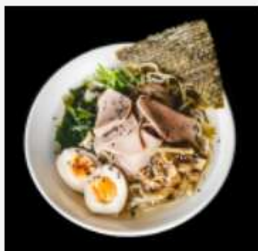
Рамен с говяжьим языком