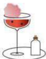
RASPY BASIL // 860= Малиновый джин, розовое вино, малина-базилек