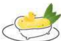
TROPICAL // 2200= Ванильный ром, манго, персик