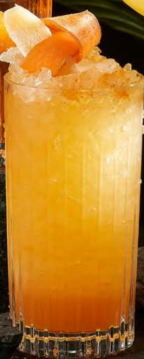
Carrot Dark & Stormy