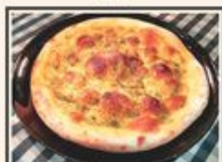
ФОКАЧЧА С СОУСОМ ПЕСТО