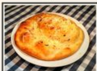
ФОКАЧЧА С ЧЕХОККИ И ПАРМЕЗАНОМ