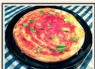
ФОКАЧЧА С ТОМАТОМ И БАЗИЛИКОМ