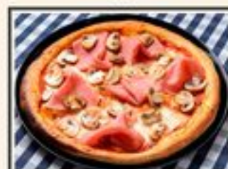
С ВЕТЧИНОЙ И ГРИБАМИ

СОУС НАПОЛИ, ВЕТЧИНА, ШАМПИНЬОНЫ, МОЦАРЕЛЛА