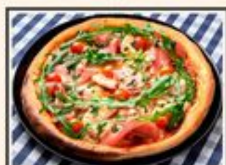
МЯСНАЯ С СОУСОМ ПЕСТО

СОУС НАПОЛИ, КУРИЦА, ВЕТЧИНА, ЧЕРРИ, МОЦАРЕЛЛА, РУККОЛА, СОУС ПЕСТО