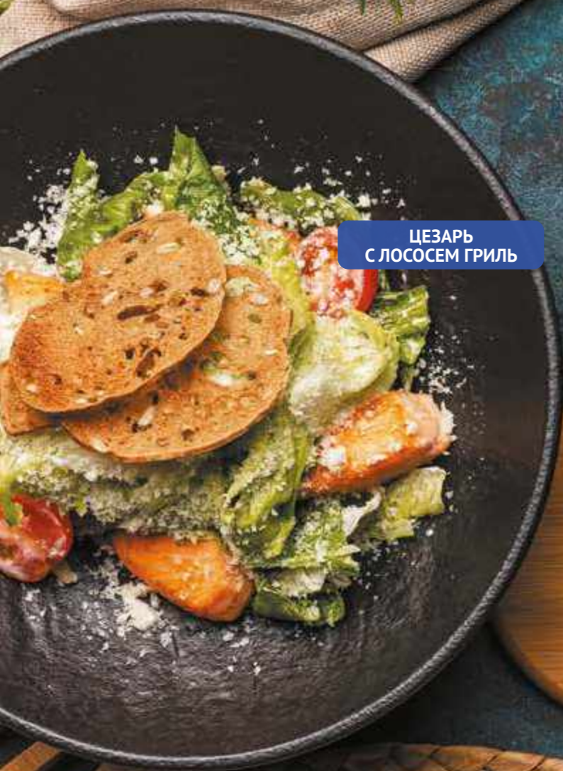
ЦЕЗАРЬ С ЛОСОСЕМ ГРИЛЬ