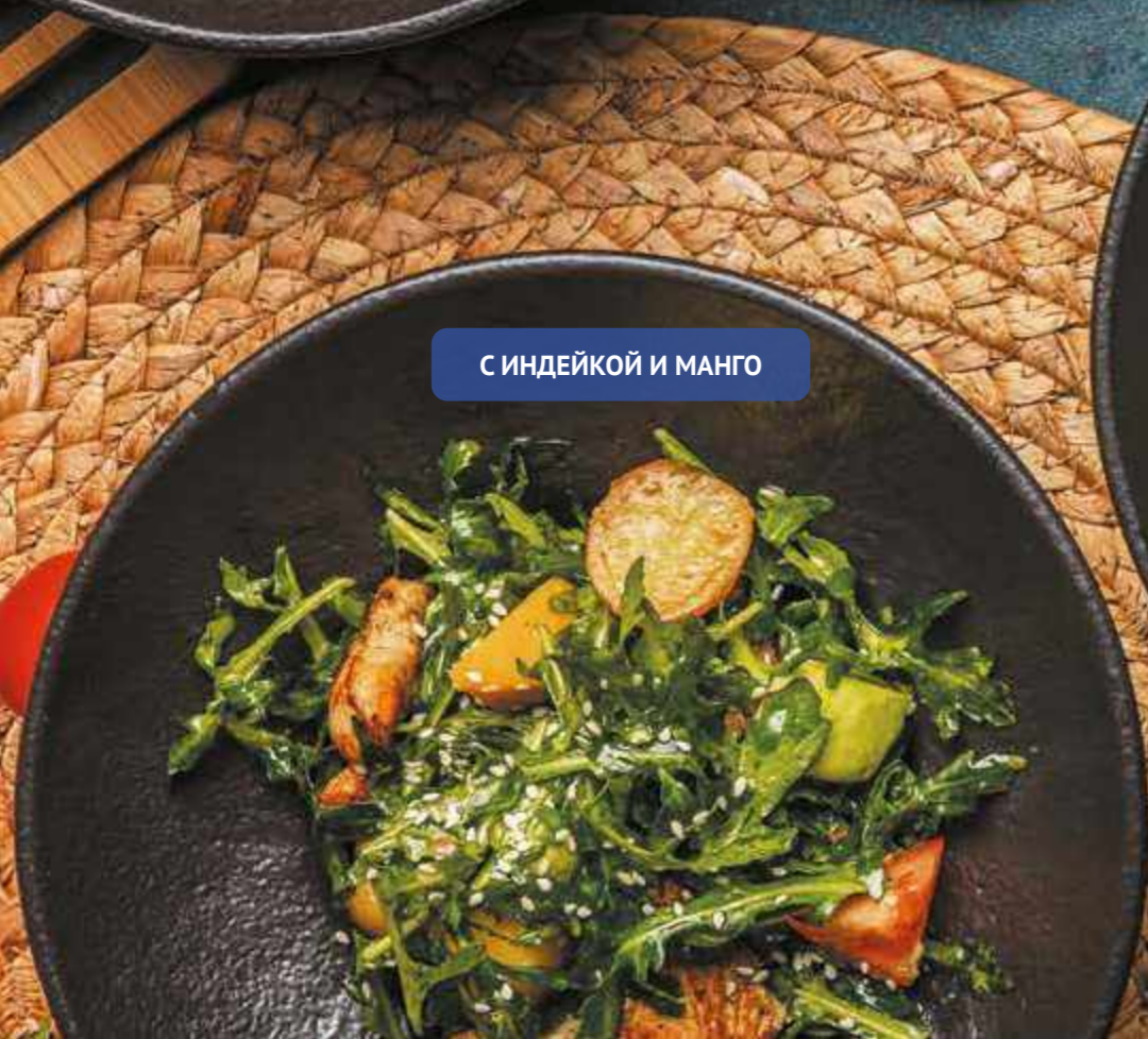
С ИНДЕЙКОЙ И МАНГО