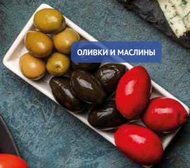
ОЛИВКИ И МАСЛИНЫ