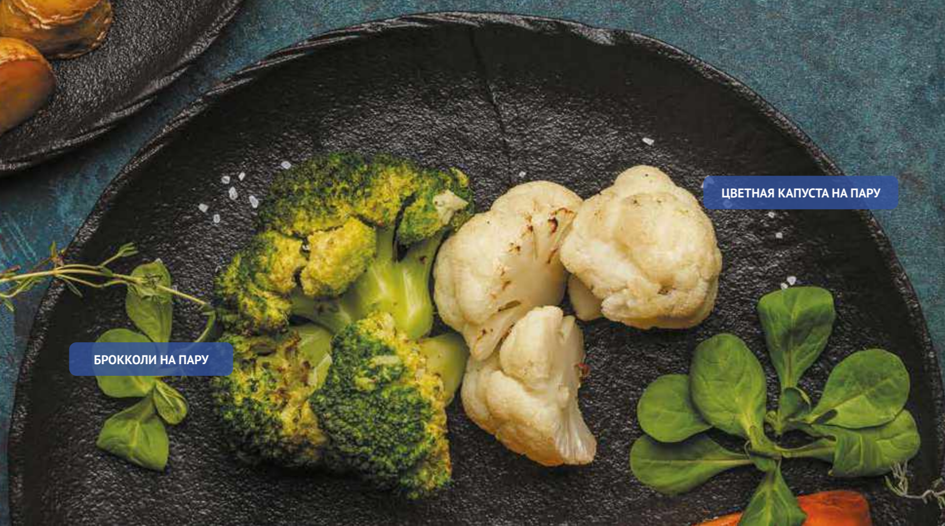
БРОККОЛИ НА ПАРУ