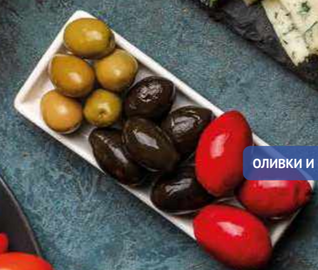
ОЛИВКИ И МАСЛИНЫ