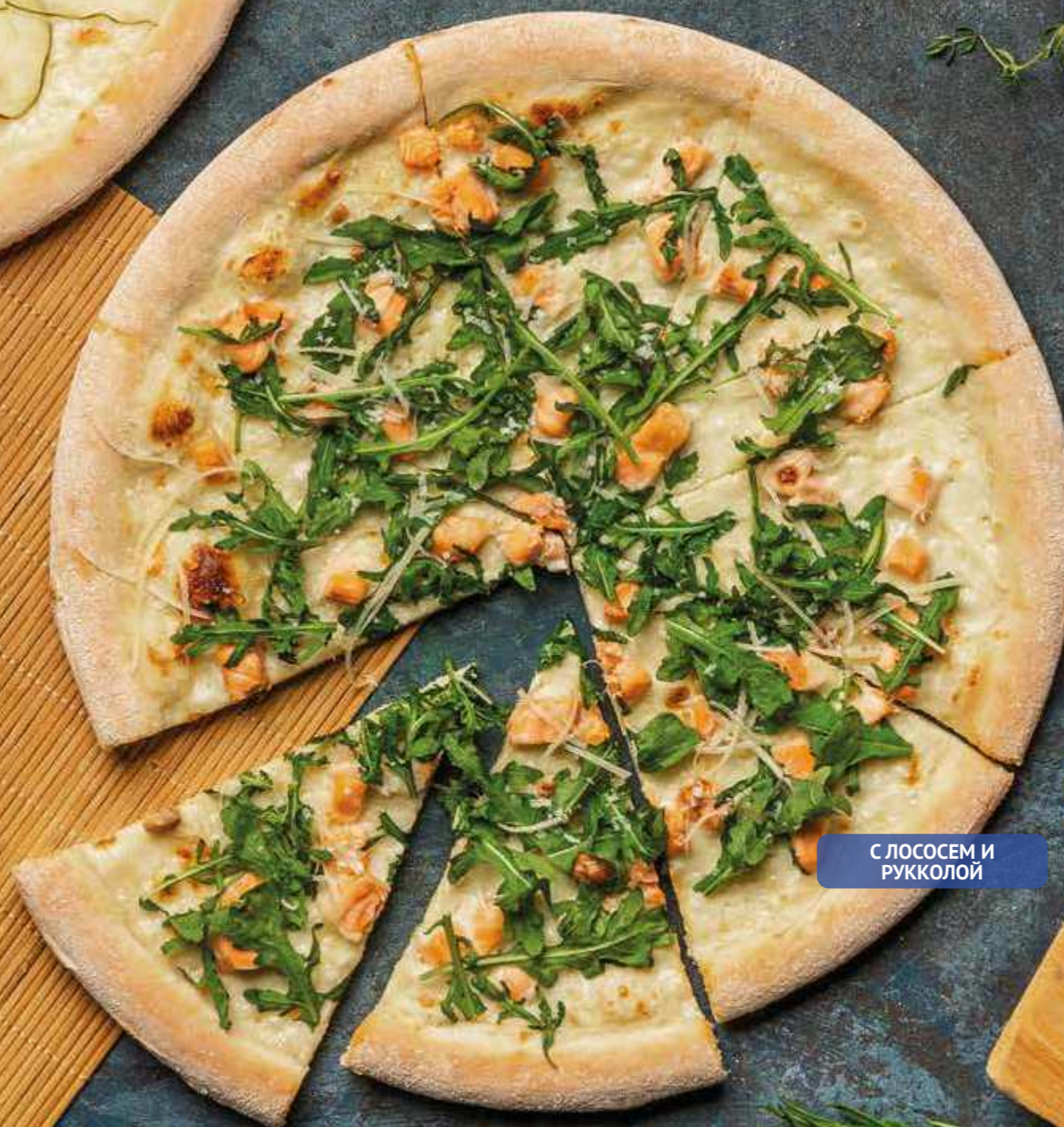
С ЛОСОСЕМ И РУККОЛОЙ