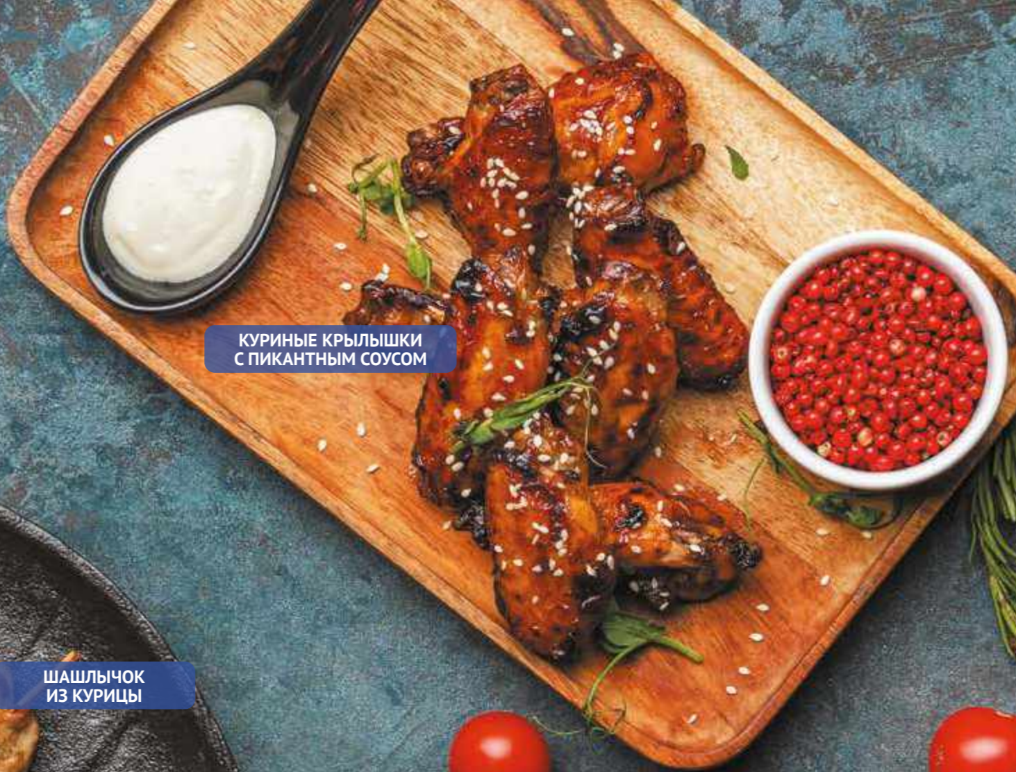
КУРИНЫЕ КРЫЛЫШКИ С ПИКАНТНЫМ СОУСОМ