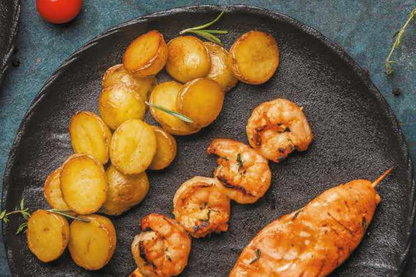
ШАШЛЫЧОК ИЗ ИНДЕЙКИ