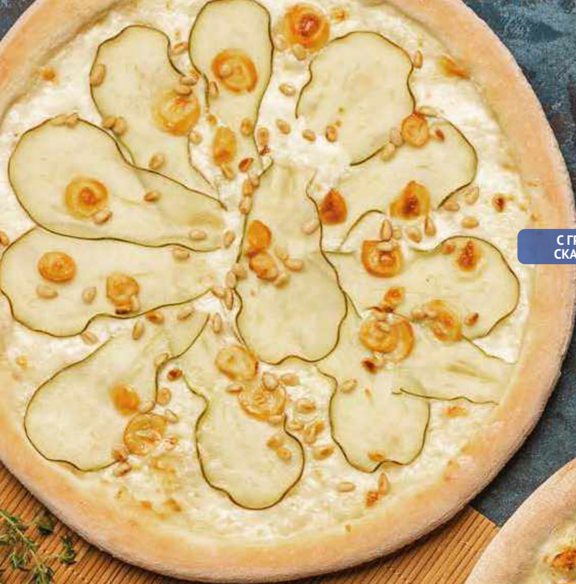
С ГРУШЕЙ И СКАМОРЦЕЙ