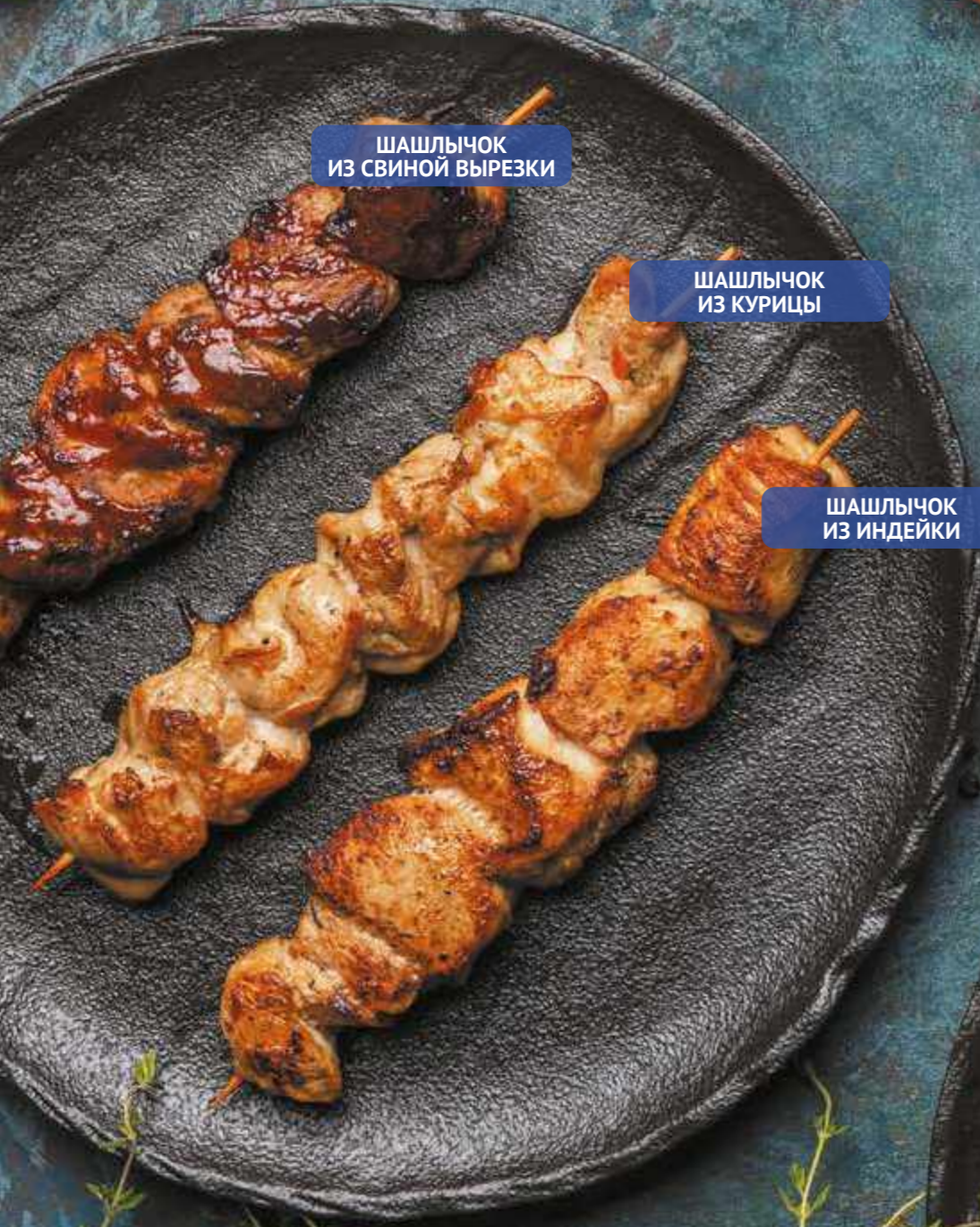
ШАШЛЫЧОК ИЗ СВИНОЙ ВЫРЕЗКИ