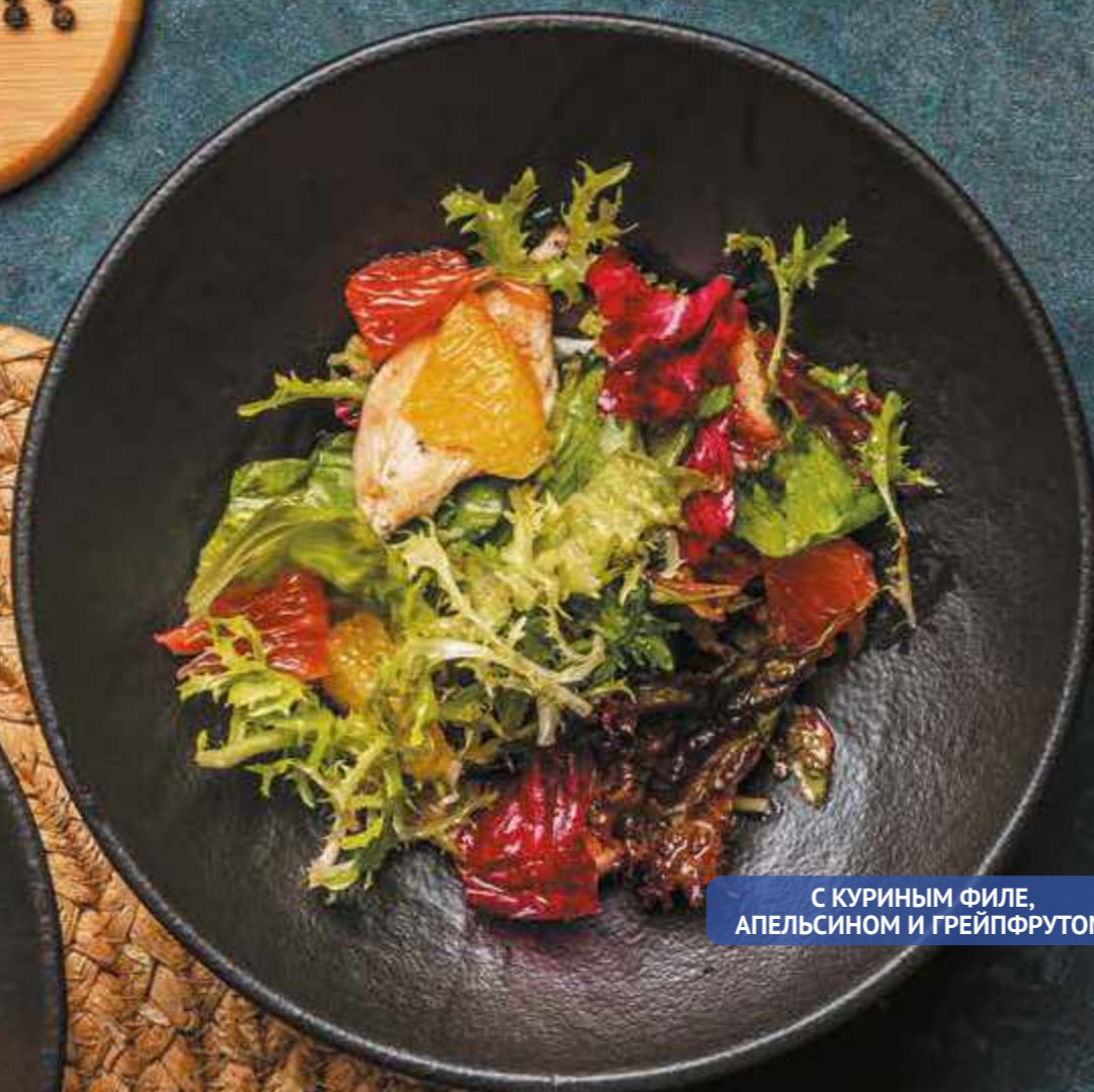
С КУРИНЫМ ФИЛЕ, АПЕЛЬСИНОМ И ГРЕЙПФРУТОМ