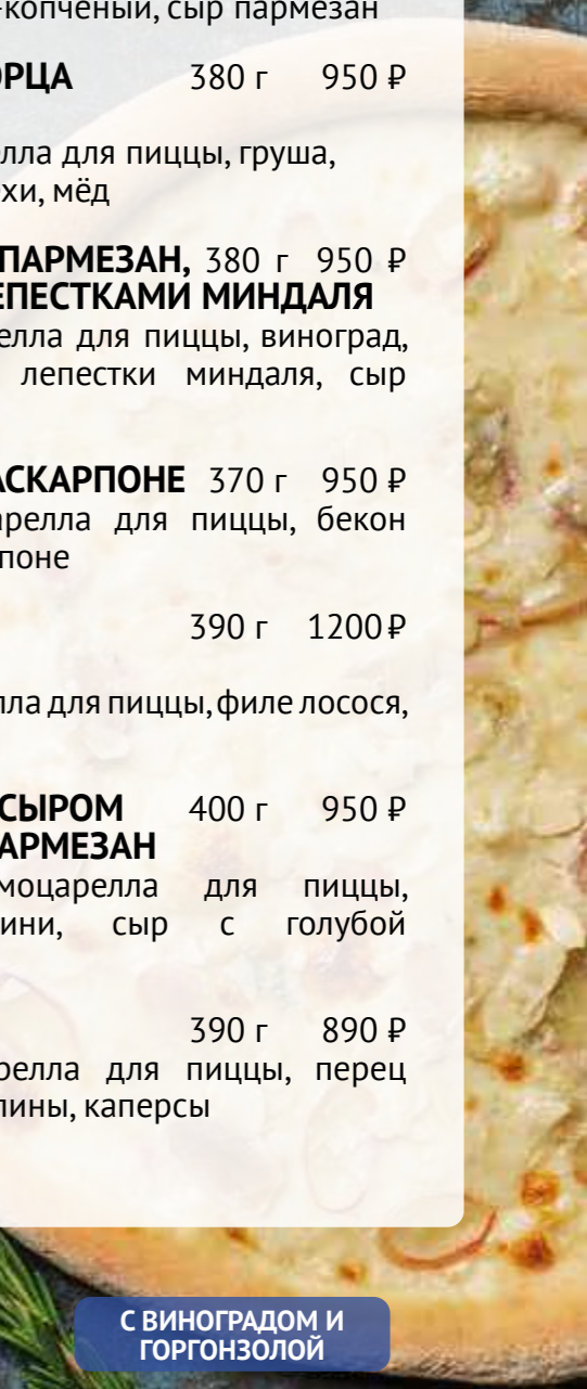
С ВИНОГРАДОМ И ГОРГОНЗОЛОЙ