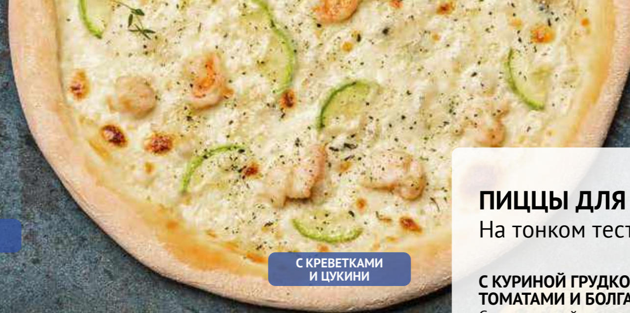
С КРЕВЕТКАМИ И ЦУКИНИ