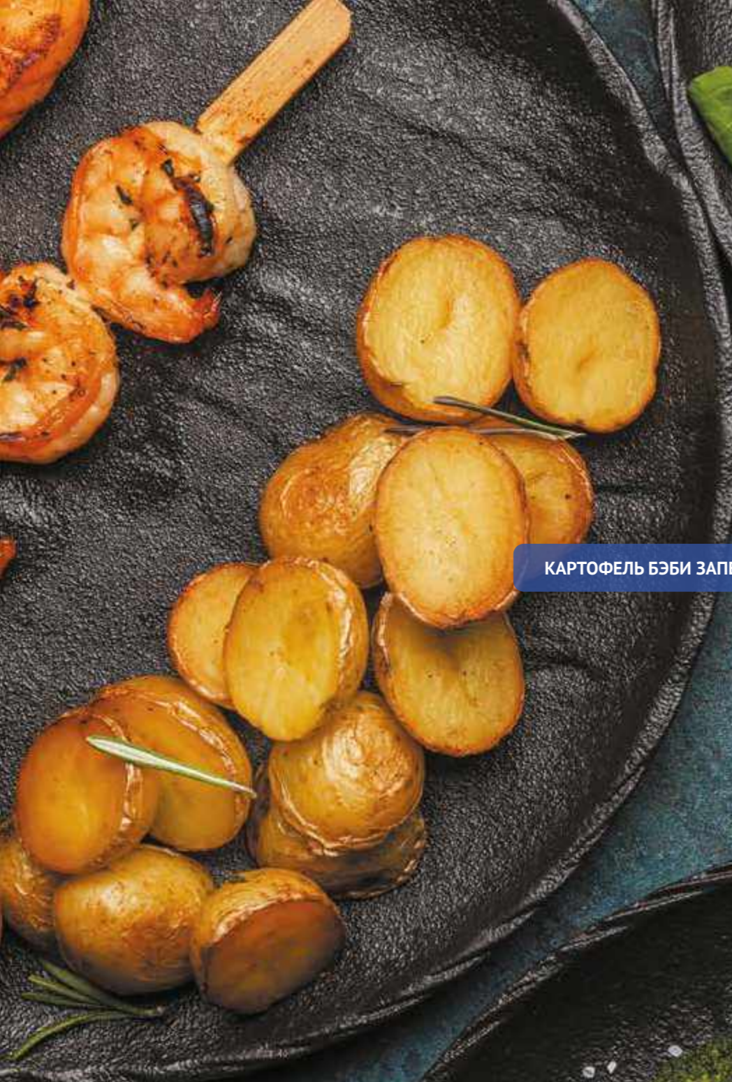
КАРТОФЕЛЬ БЭБИ ЗАПЕЧЕННЫЙ