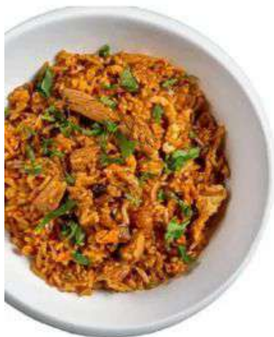
РИС С УТКОЙ

Жасминовый рис, обжаренный с яйцом, овощами (кукуруза, зеленый горошек, морковь) и с соевым соусом.