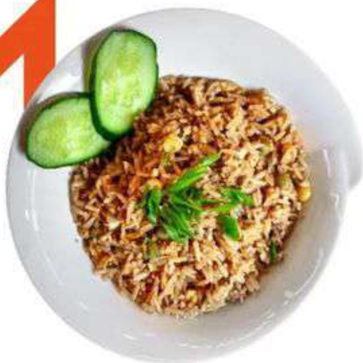
РИС С ОВОЩАМИ