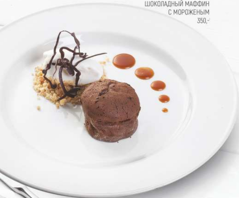
ШОКОЛАДНЫЙ МАФФИН С МОРОЖЕНЫМ 350,-