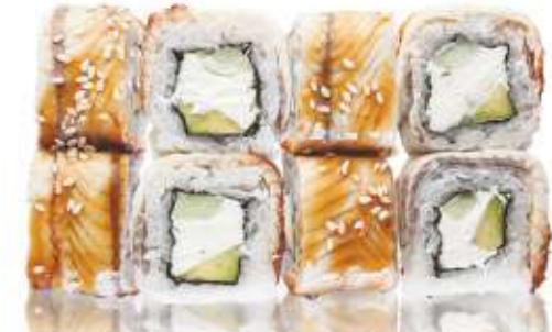
ФИЛАДЕЛЬФИЯ С УГРЁМ 590,-