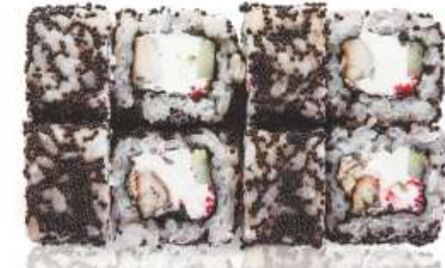
СЛИВОЧНЫЙ С УГРЁМ 520,-