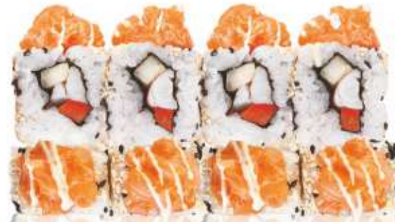
ОСТРЫЙ С КРЕВЕТКОЙ, ЛОСОСЕМ И ВАСАБИ 490,-