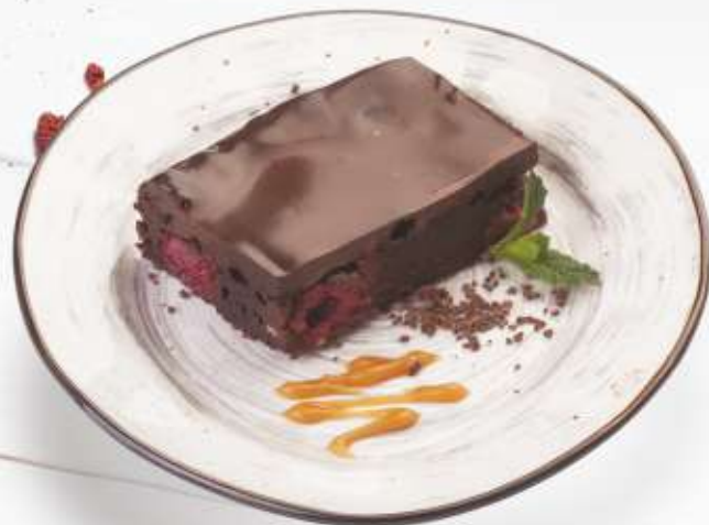
ШОКОЛАДНЫЙ БРАУНИ С ВИШНЕЙ 320,-