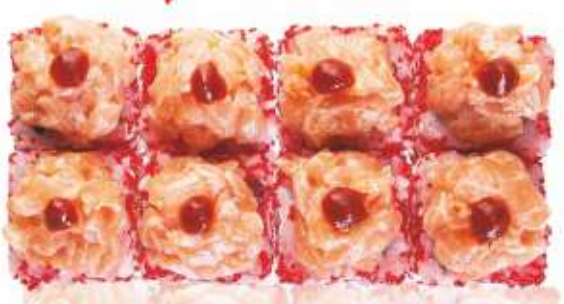
ОСТРЫЙ С ЛОСОСЕМ 440,-