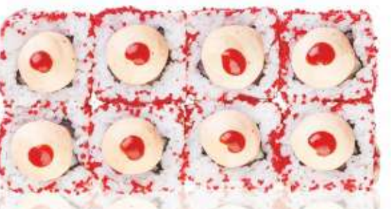
ОСТРЫЙ С ТУНЦОМ 340,-