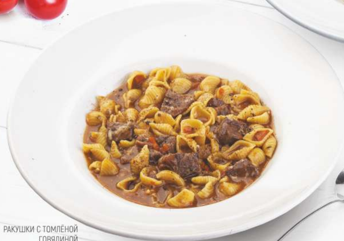
РАКУШКИ С ТОМЛЁНОЙ ГОВЯДИНОЙ 470,-