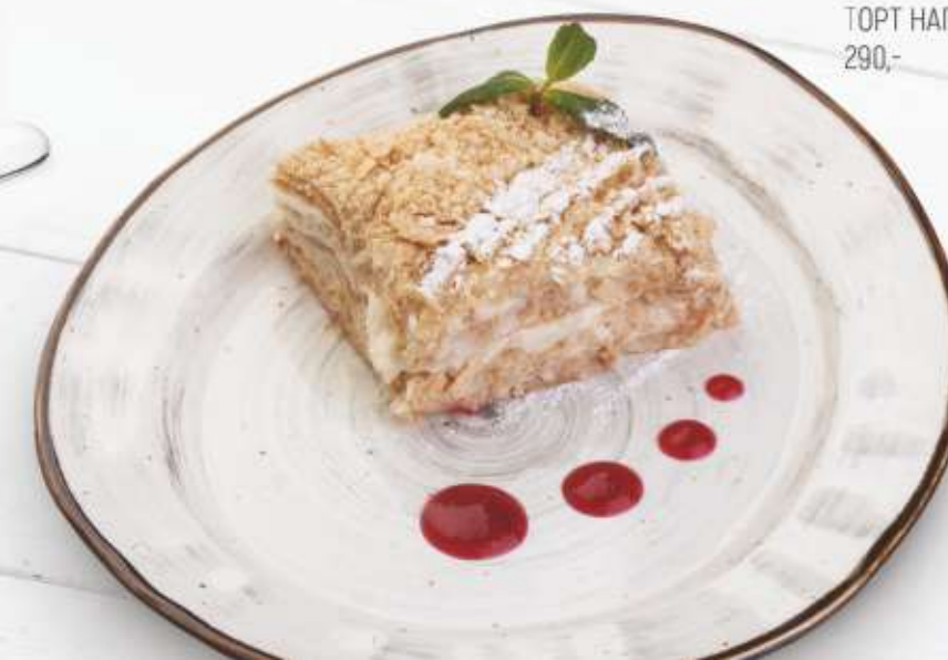
ТОРТ НАПОЛЕОН 290,-