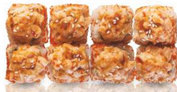
ЗАПЕЧЁННЫЙ С ЛОСОСЕМ 450,-