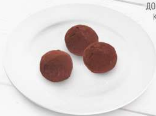
ДОМАШНИЕ КОНФЕТЫ 1 шт. 40,-