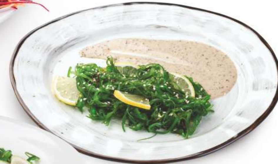
ВОДОРОСЛИ ЧУККА С ОРЕХОВЫМ СОУСОМ 260,-