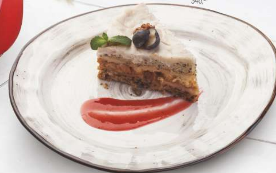
ПИРОГ С МАКОМ НА КОКОСОВОМ МОЛОКЕ (% низкокалорийный десерт) 340,-