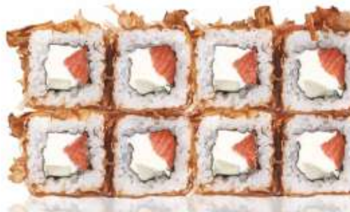
СКАНДИНАВСКИЙ С КОПЧЕНЫМ ЛОСОСЕМ 390,-