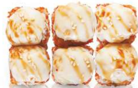
ЗАПЕЧЁННЫЙ С КРАБОМ И МОЦАРЕЛЛОЙ 370,-