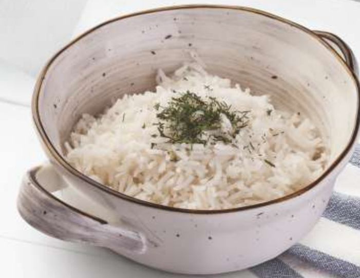
РИС БАСМАТИ 150,-