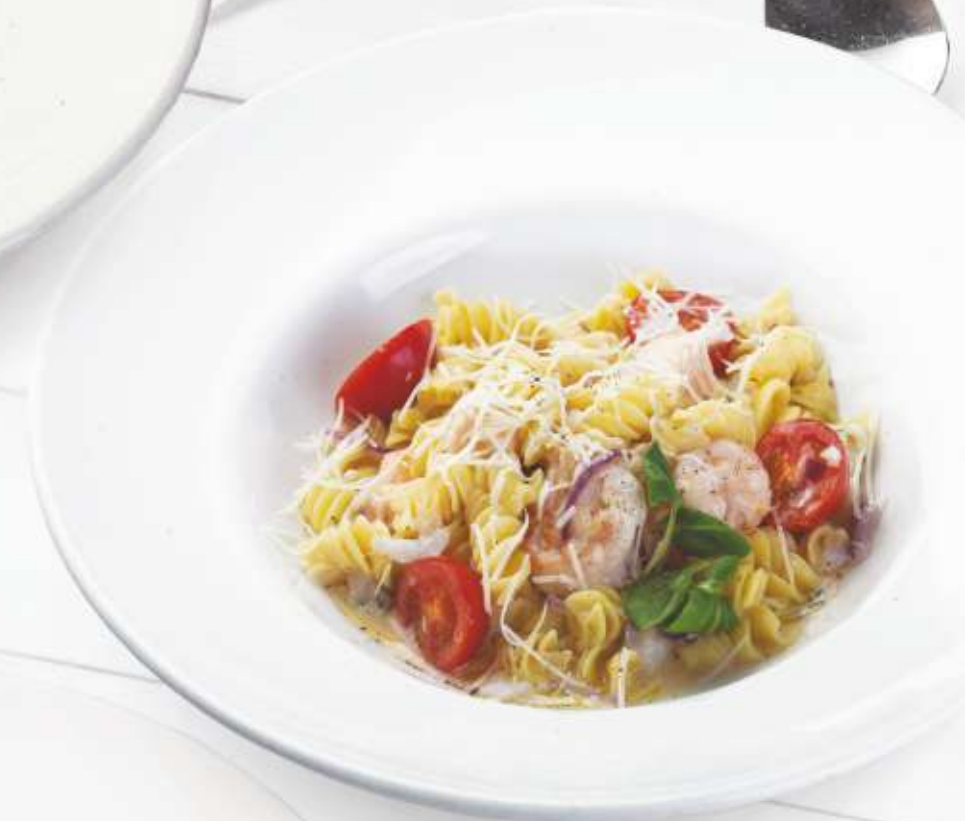
ФУЗИЛЛИ С МОРЕПРОДУКТАМИ В СОУСЕ БУЗАРА (лосось, судак, тигровые креветки) 570,-