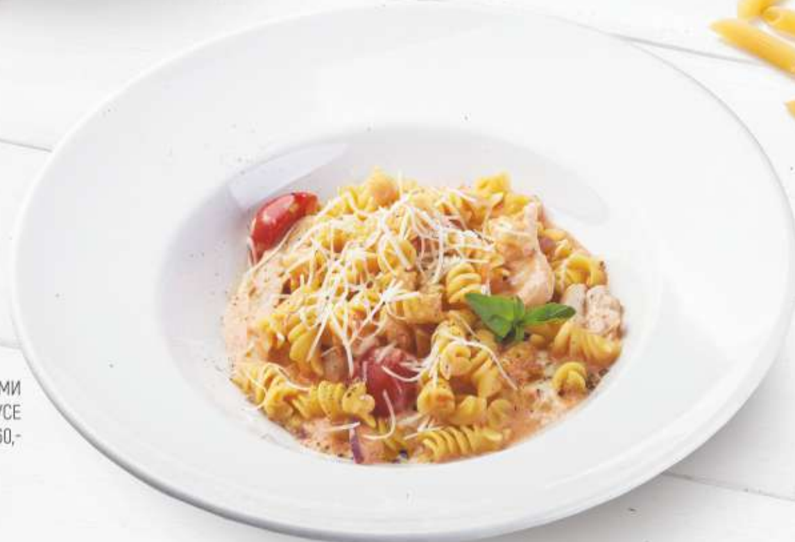
ФУЗИЛЛИ С КУРИЦЕЙ И ОВОЩАМИ В СЛИВОЧНО-ТОМАТНОМ СОУСЕ 460,-