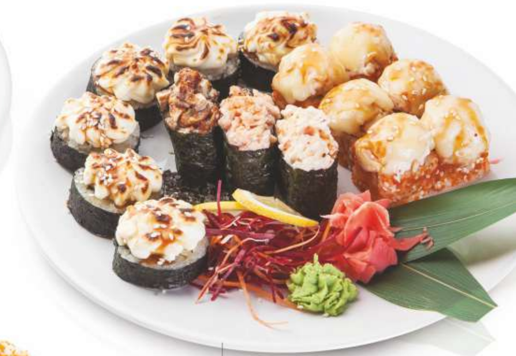
НАБОР "ЗАПЕЧЁННЫЙ" (Запечённый ролл с угрём, запечённый ролл с крабом и моцареллой, суши лосось, суши краб, суши угорь) 1190,-