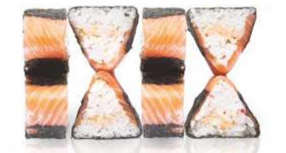
ОСТРЫЙ С ЛОСОСЕМ И КРАБОМ 420,-