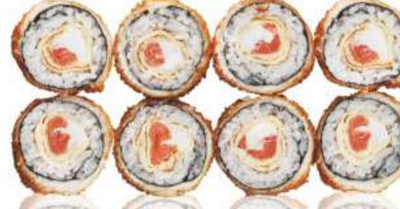
ЗАПЕЧЁННЫЙ С КОПЧЕНЫМ ЛОСОСЕМ И ОМЛЕТОМ 420,-