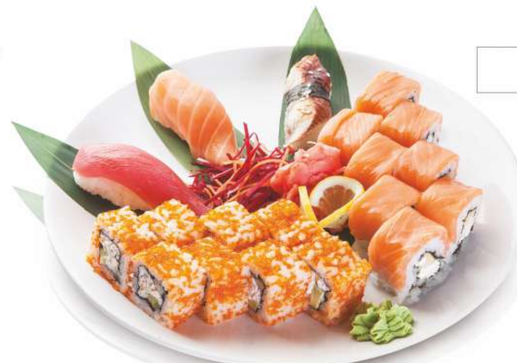
НАБОР "КЛАССИКА" (Ролл Филадельфия, ролл Калифорния, суши тунец, суши угорь, суши лосось) 1090,-