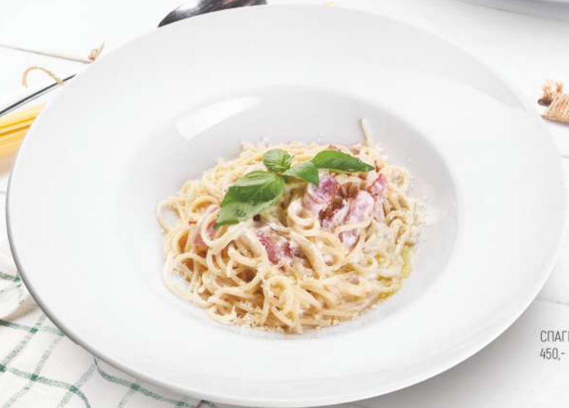
СПАГЕТТИ КАРБОНАРА 450,-