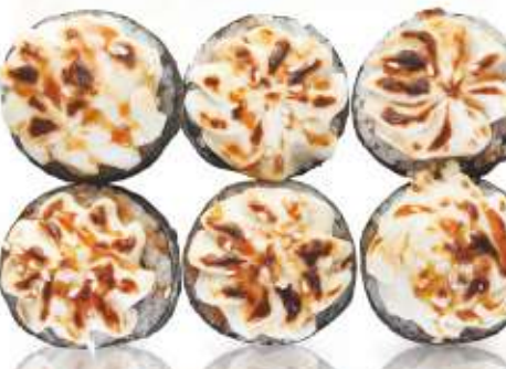
ЗАПЕЧЁННЫЙ С УГРЁМ 530,-