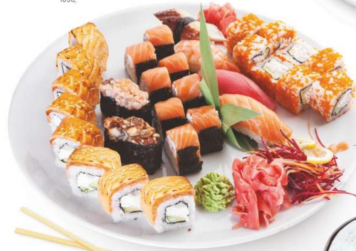
НАБОР "НА ДВОИХ" (Запечённый ролл Филадельфия, острый ролл с крабом и лососем, ролл Калифорния, суши тунец, суши креветка, суши угорь, суши лосось, суши острый лосось, суши острый угорь) 1590,-