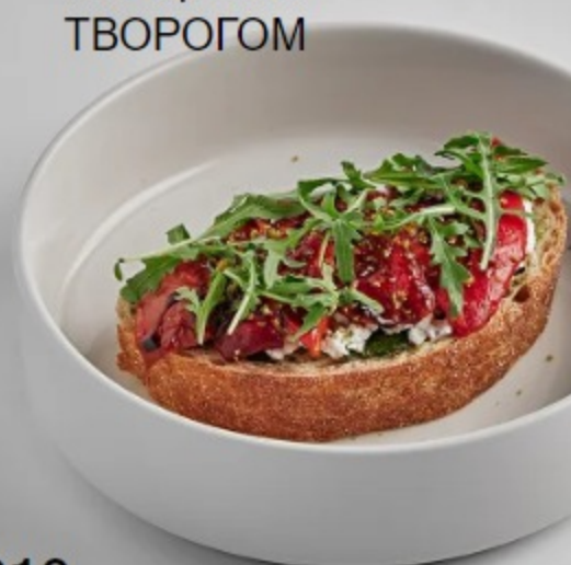
(4) БУТЕР С ПЕЧЕНЫМ ПЕРЦЕМ И ТВОРОГОМ