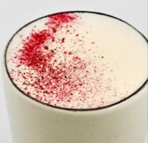
(6) РАФ АПЕЛЬСИН-ЧИЛИ