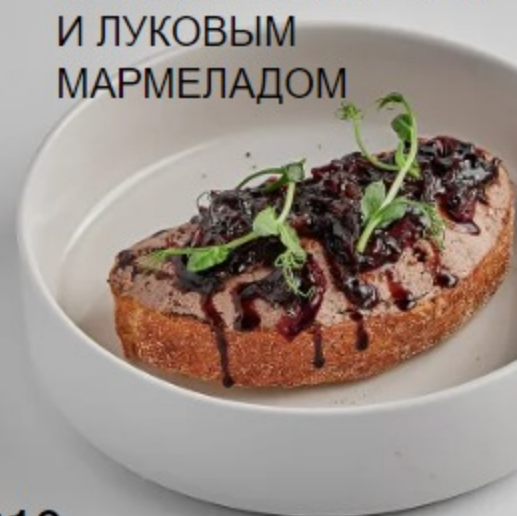
(3) БУТЕР С ПАШТЕТОМ ИЗ КУРИНОЙ ПЕЧЕНИ И ЛУКОВЫМ МАРМЕЛАДОМ