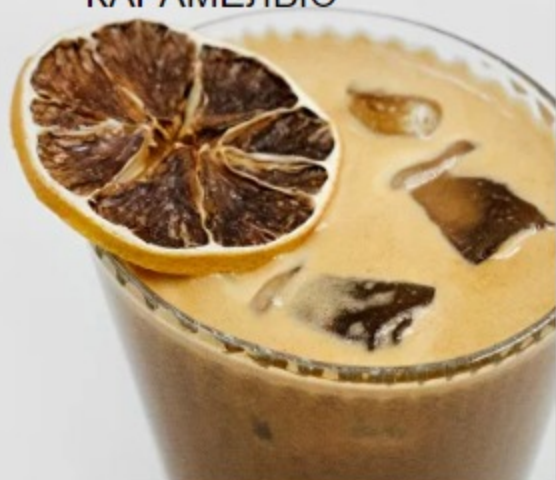
(5) БАМБЛ С СОЛЕНОЙ КАРАМЕЛЬЮ