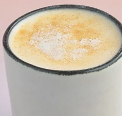
(2) РАФ КОРИЦА-ЦИТРУС