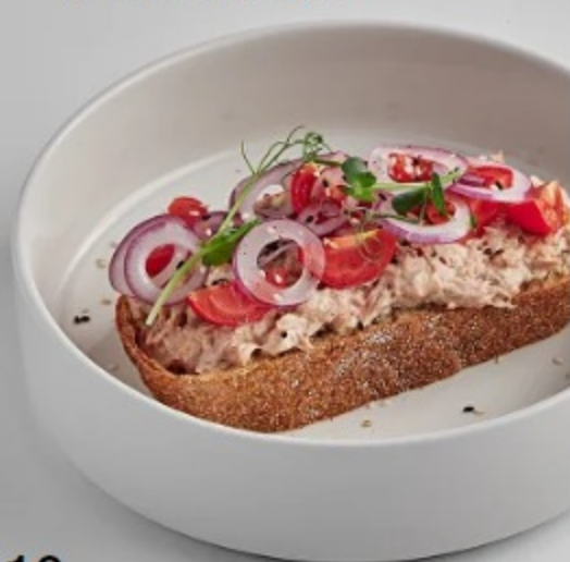
(1) БУТЕР С ТУНЦОМ И ТОМАТАМИ

наша рекомендация по сочетаемости вина и закуски [наличие актуальных вин уточняйте у сотрудников]