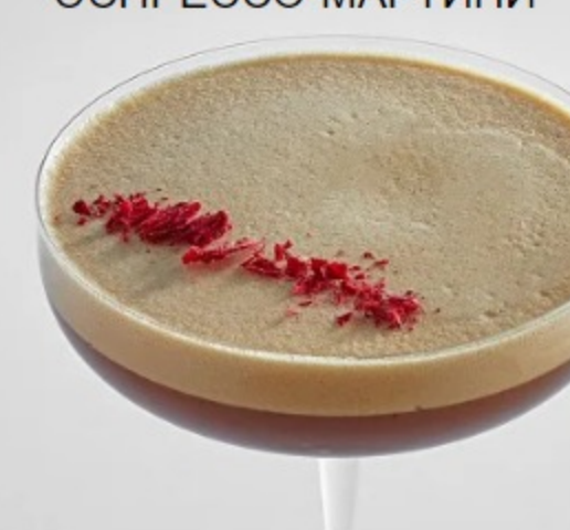
(8) КОФЕ ГРАНАТОВЫЙ ЭСПРЕССО-МАТИНИ