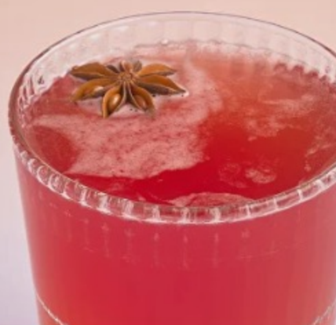
(3) HOT TODDY (алк.)