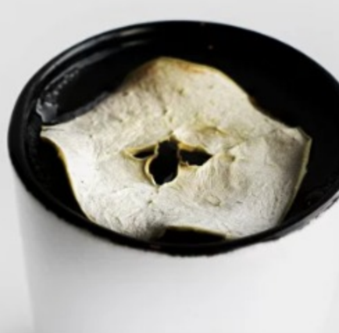
(7) ЯБЛОЧНЫЙ ФИЛЬТР