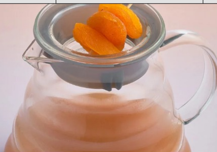
(9) ЧАЙ ПЕРСИК-КАРДАМОН