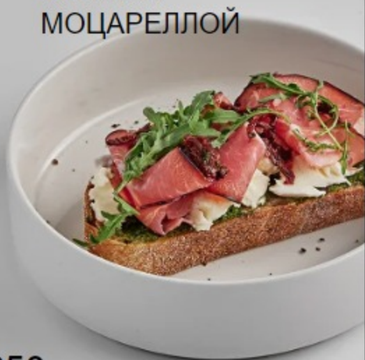
(2) БУТЕР С ШЕЙКОЙ КОППА И МОЦАРЕЛЛОЙ