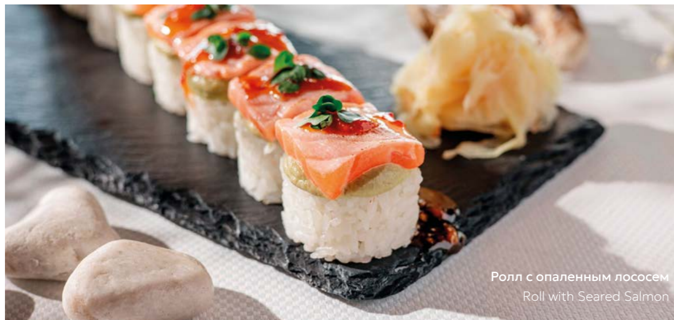
Ролл с опаленным лососем Roll with Seared Salmon