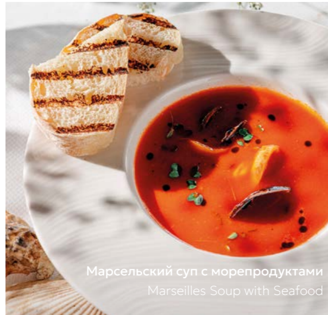
Марсельский суп с морепродуктами Marseilles Soup with Seafood