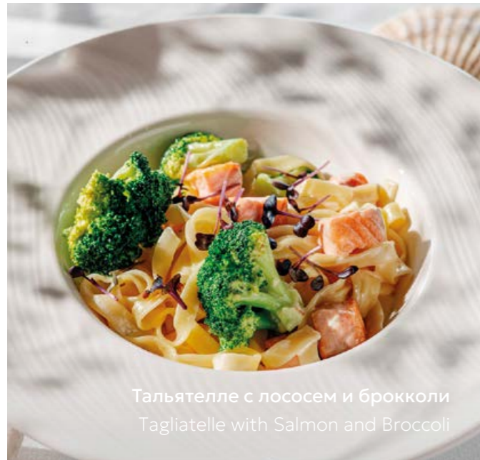
Тальятелле с лососем и брокколи Tagliatelle with Salmon and Broccoli