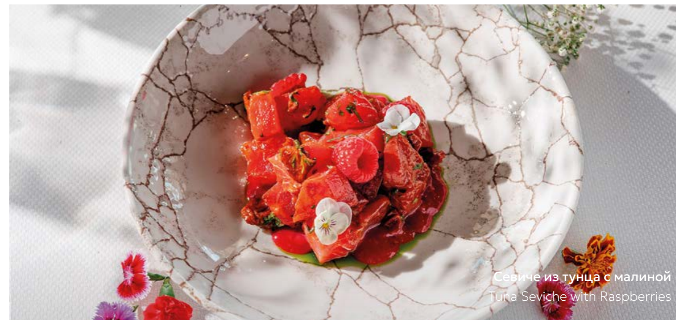
Севиче из тунца с малиной Tuna Seviche with Raspberries