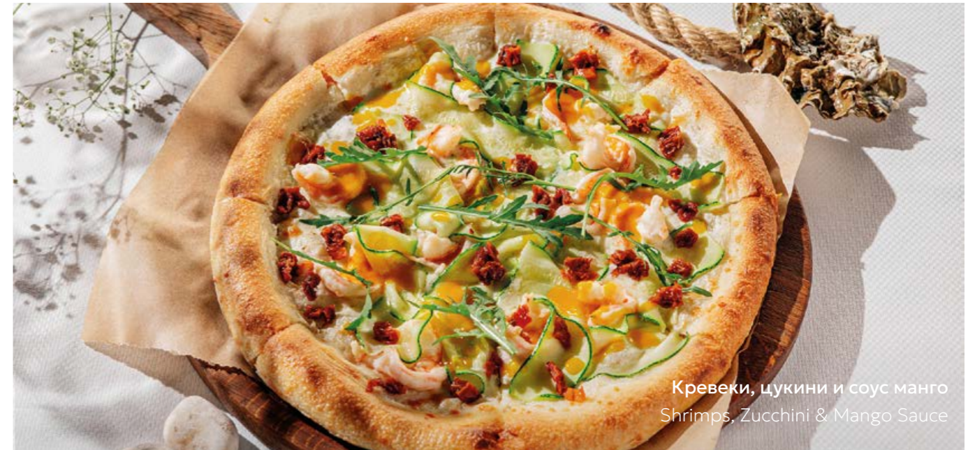
Креветки, цукини и соус манго Shrimps, Zucchini & Mango Sauce