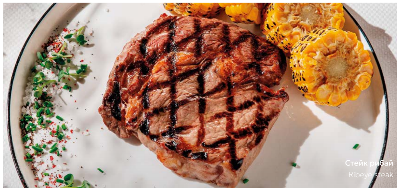
Стейк рибай Ribeye steak