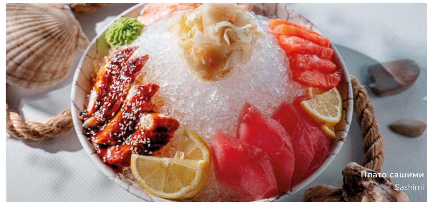
Плато сашими Sashimi