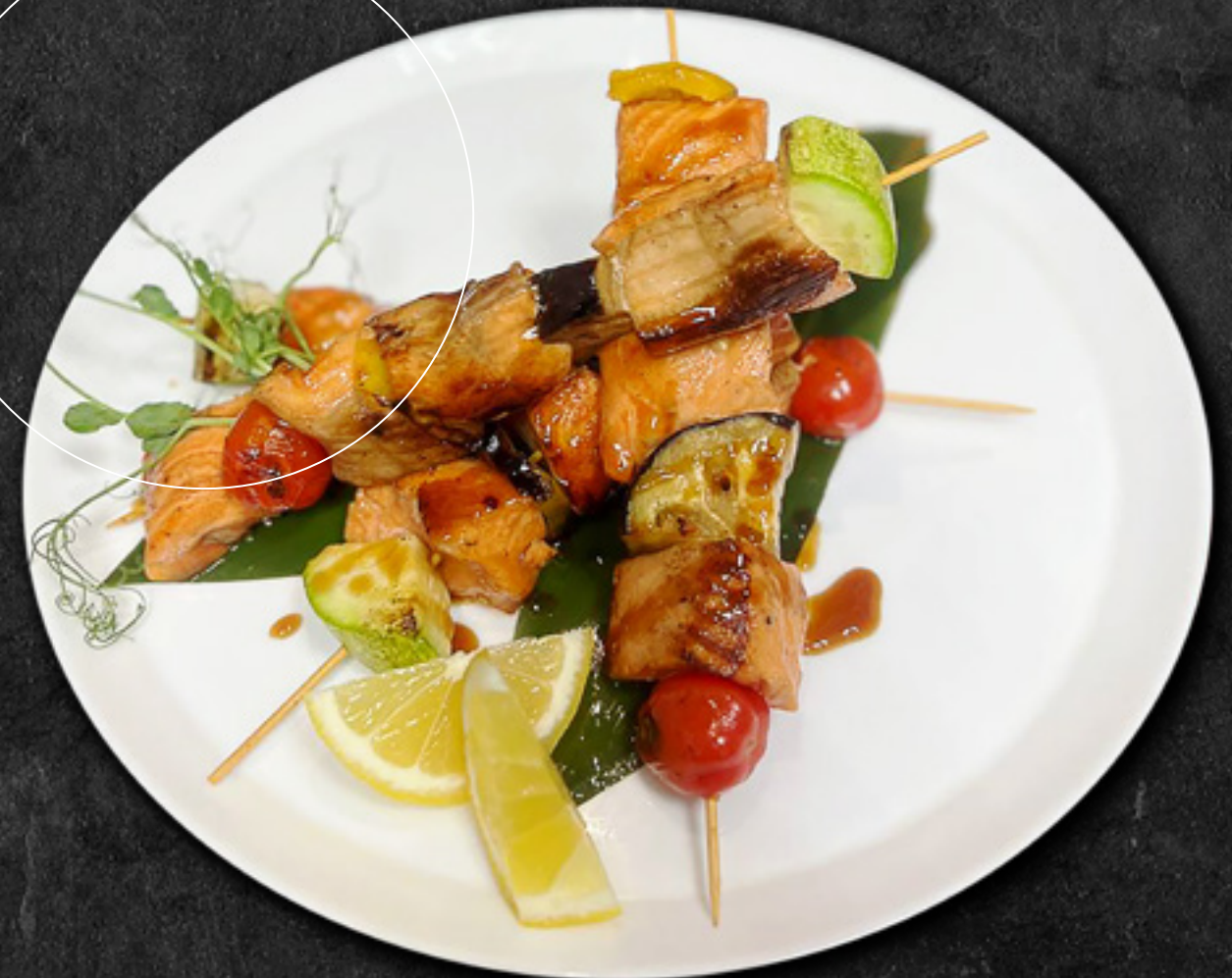
Шашлык из лосося с овощами 100 г / 1 100 Р