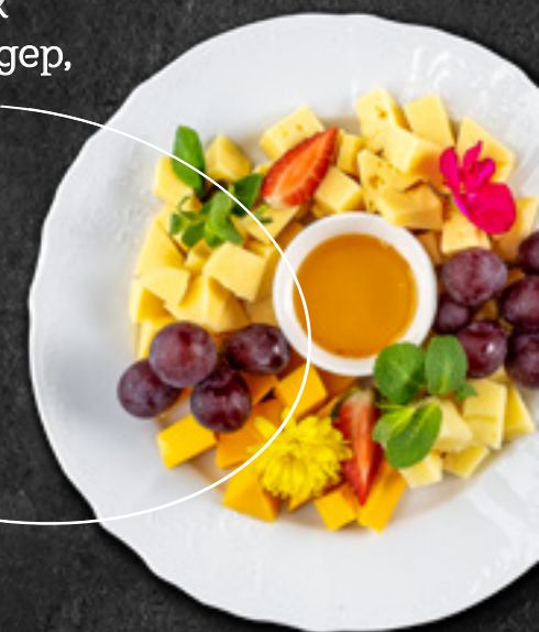
Ассорти европейских сыров (Маасгам, Чеддер, Тильтизер, Джукас, Виноград, Варенье, виноград) 320 г / 1 550 Р