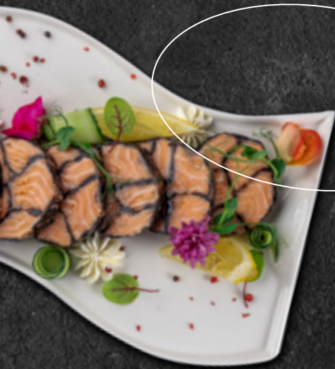
Мозаика из лосося Су-виг 200 г / 2 500 Р