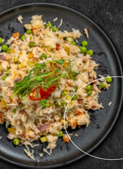
Рис басмати с овощами