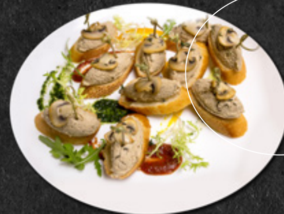
Тапасы с паштетом из кролика, шампиньонов и тимьяна 40 г / 220 Р