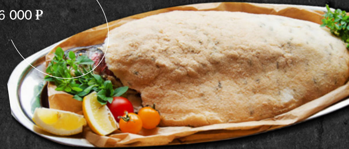
Форель запечённая в розмариновой соли со сливочно - шпинатным соусом 2 000 г / 16 000 Р