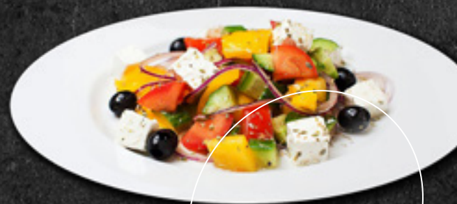
Греческий (огурец, помидор черри, перец болгарский, маслины, лук красный, сыр фета)