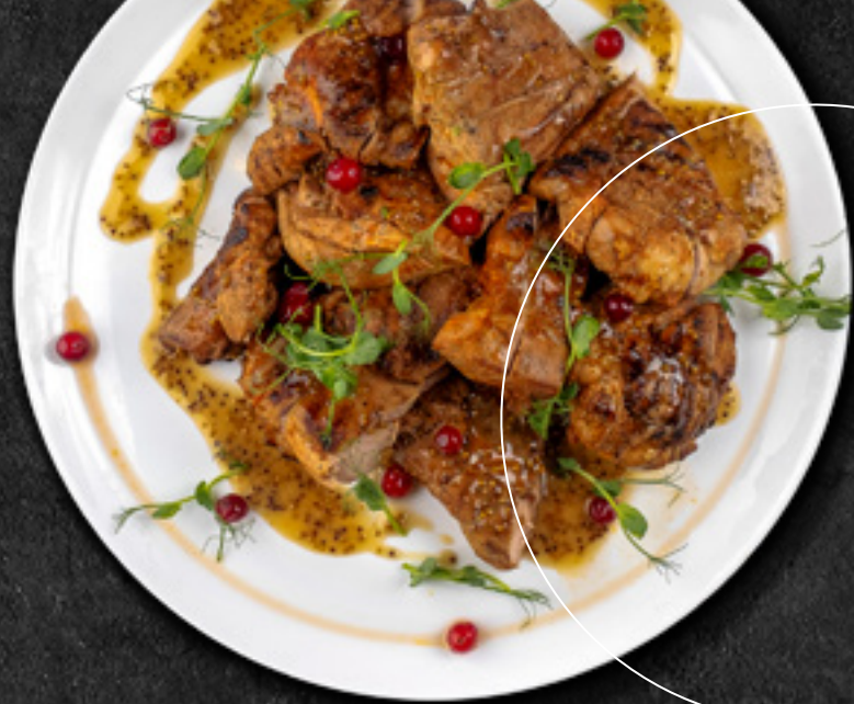
Стейк из бегра унгейки с горчичным соусом 1 000 г / 4 900 Р