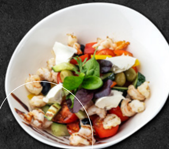
Средиземноморский салат с креветками и мягким сыром