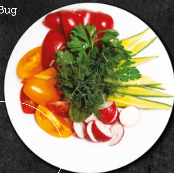
Ассорти свежих овощей (огурцы, помидоры, болгарский перец, редис, зелень) 450 г / 880 Р