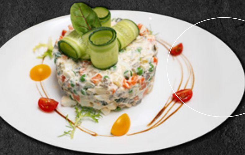
Оливье с телячьим языком 500 г / 1 350 Р