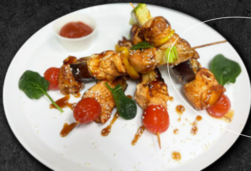
Куриные шашлычки в соусе Терияки с кунжутом 100 г / 480 Р