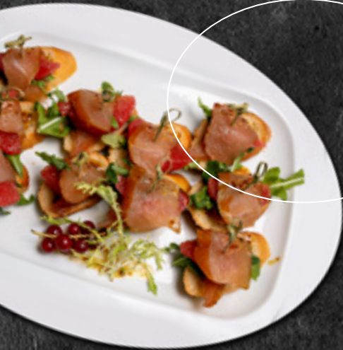
Тапасы с утиной грудкой и нектарином/апельсином 30 г / 255 Р