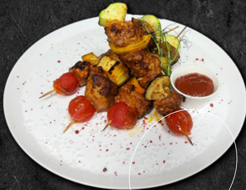
Шашлык из свинины 100 г / 500 Р