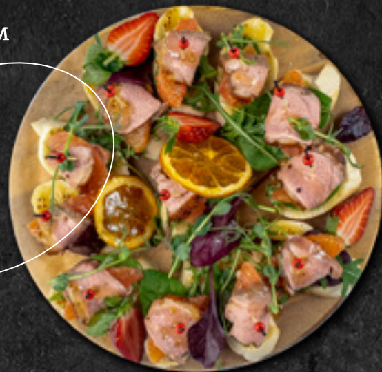
Тапасы с корначчо из вяленной куриной грудкой и грейпфруктом 30 г / 190 Р