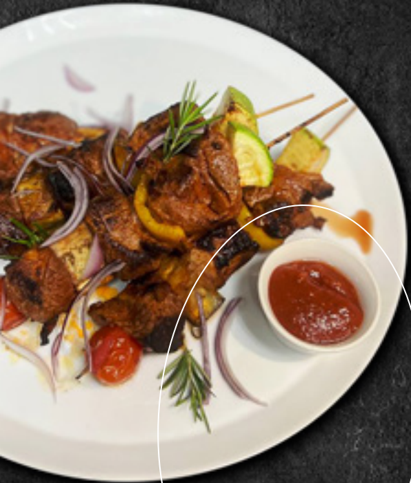
Шашлык из баранины 100 г / 780 Р