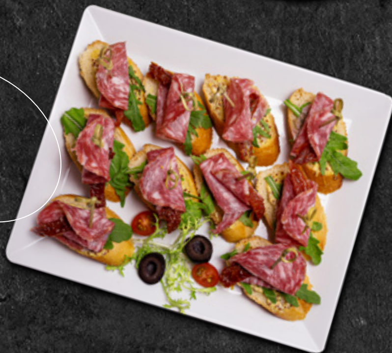
Тапасы с Саями и вялеными томатами 30 г / 200 Р