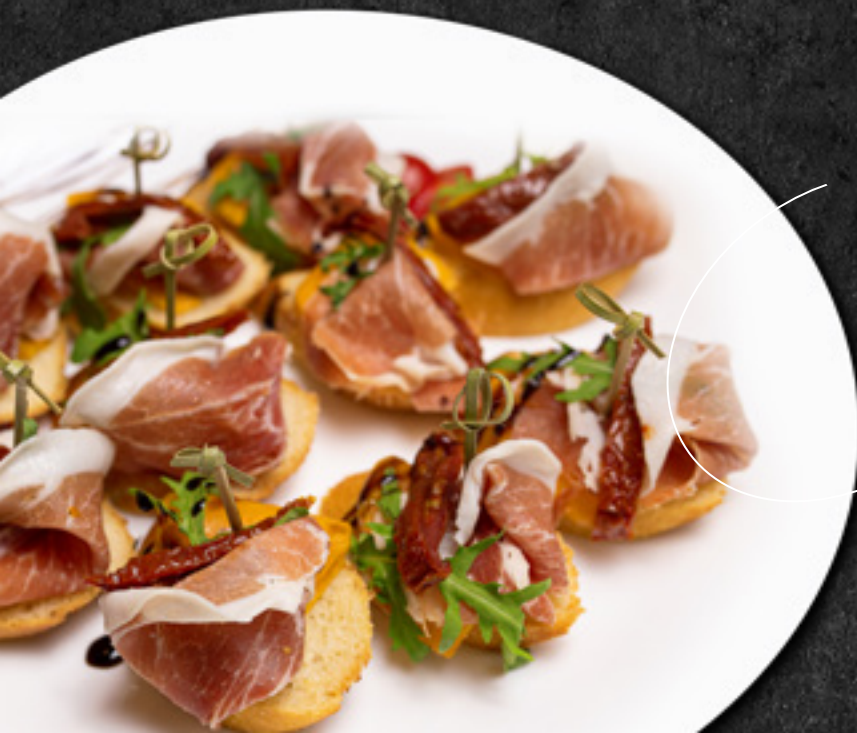
Тапасы со шпеком и печёной тыквой 30 г / 220 Р