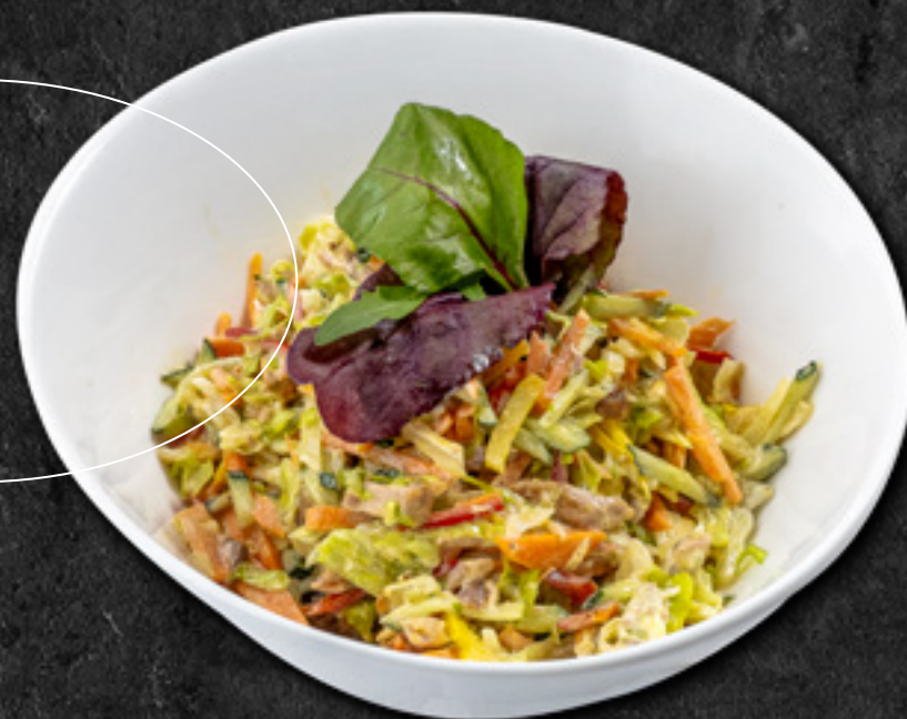
Салат с запечённым бедром цыпленка, маринованными огурцами, черри и грибами