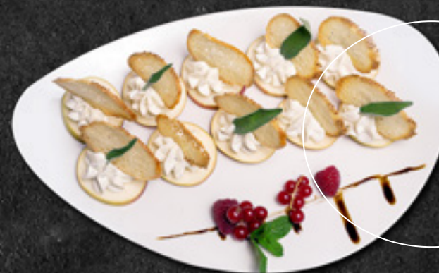
Груша с муссом Дор Блю и маслом грецкого ореха 30 г / 190 Р