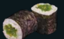
ЧУКА МАКИ NEW

рис, нори, салат чука 6 шт. / 120 гр. 290.-