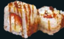
ФИЛАДЕЛЬФИЯ С УГРЕМ

лосось, креветка, авокадо, сливочный сыр 8 шт. / 240 гр. 990.-