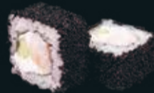
КАЛИФОРНИЯ С КРЕВЕТКОЙ

угорь, икра летучей рыбы, авокадо, сливочный сыр 8 шт. / 220 гр. 990.-