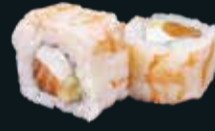
ФИЛАДЕЛЬФИЯ С КРЕВЕТКОЙ

тунец, авокадо, сливочный сыр, икра летучей рыбы, кунжут, унаги соус, огурец 8 шт. / 240 гр. 790.-