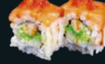
РОЛЛ С ТОМАГО

окунь морской, тунец, авокадо, огурец, сливочный сыр, стружка тунца, икра летучей рыбы, соус унаги 8 шт. / 265 гр. 790.-