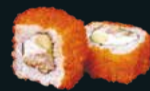
КАЛИФОРНИЯ С УГРЕМ

лосось, икра летучей рыбы, авокадо, японский майонез 8 шт. / 220 гр. 890.-