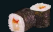
ХОТАТЕ МАКИ NEW

рис, нори, камчатский краб 6 шт. / 120 гр. 690.-