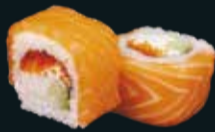
ФИЛАДЕЛЬФИЯ С ЛОСОСЕМ

лосось, огурец, икра летучей рыбы, сливочный сыр 8 шт. / 230 гр. 790.-