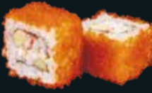
КАЛИФОРНИЯ С КРАБОМ

угорь, икра летучей рыбы, авокадо, сливочный сыр, унаги соус, кунжут 8 шт. / 240 гр. 890.-