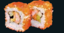
РОЛЛ С КРЕВЕТКОЙ 🌶️ И КРАСНЫМ ТОБИКО НИКАРИ

креветка, сливочный сыр, авокадо, огурец, икра летучей рыбы, унаги соус 8 шт. / 260 гр. 890.-