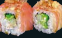
РОЛЛ С ОКУНЕМ И ТУНЦОМ SHIMAUMA

тунец, икра летучей рыбы, спайси соус 8 шт. / 220 гр. 890.-