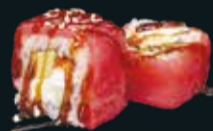
ФИЛАДЕЛЬФИЯ С ТУНЦОМ

лосось, огурец, икра летучей рыбы, сливочный сыр 8 шт. / 230 гр. 790.-