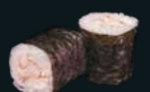
КАНИ МАКИ NEW

рис, нори, салат чука 6 шт. / 120 гр. 290.-