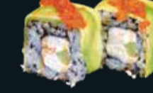
РОЛЛ С АВОКАДО И КРЕВЕТКОЙ DRAGON

лосось, японский омлет, огурец, сливочный сыр, икра летучей рыбы, соус унаги 8 шт. / 250 гр. 690.-