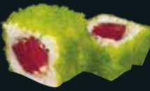
ТУНА СПАЙСИ 🌶️

лосось, авокадо, сливочный сыр, икра летучей рыбы, стружка тунца 8 шт. / 230 гр. 750.-