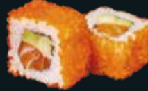
КАЛИФОРНИЯ С ЛОСОСЕМ

мясо камчатского краба, икра летучей рыбы, авокадо, японский майонез 8 шт. / 220 гр. 990.-