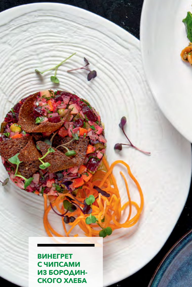
ВИНЕГРЕТ С ЧИПСАМИ ИЗ БОРОДИН- СКОГО ХЛЕБА

VINAIGRETTE SALAD WITH BORODINSKY BREAD CHIPS