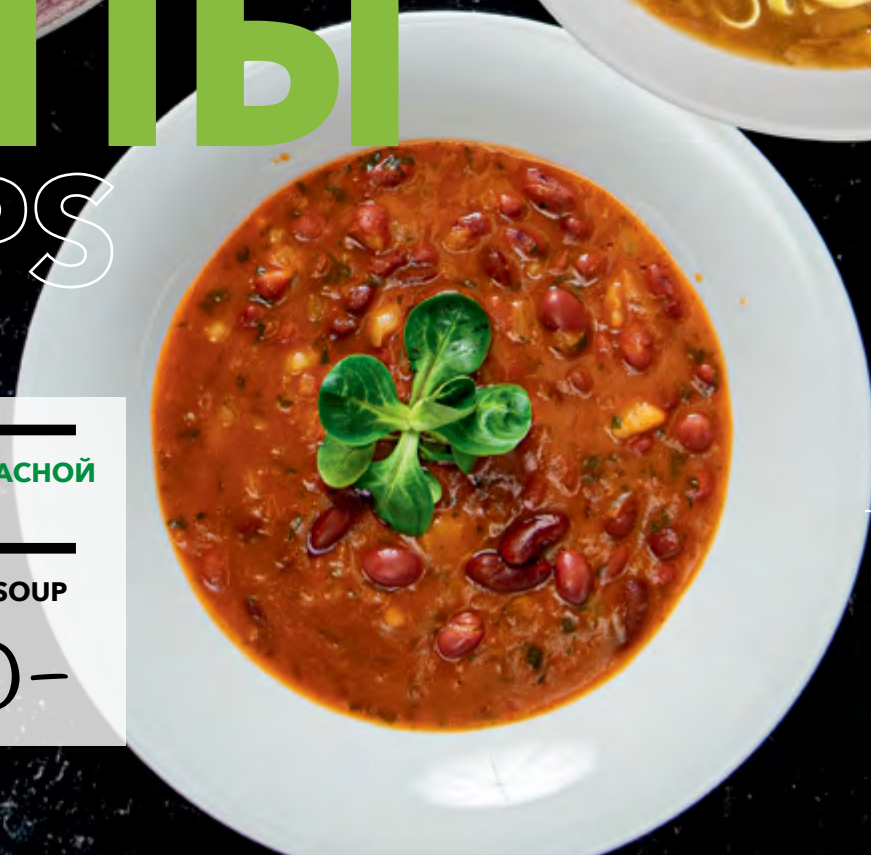
СУП ИЗ КРАСНОЙ ФАСОЛИ