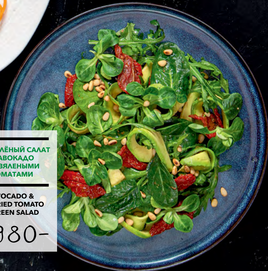
ЗЕЛЁНЫЙ САЛАТ С АВОКАДО И ВЯЛЕНЫМИ ТОМАТАМИ