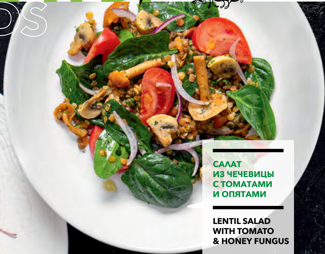
САЛАТ ИЗ ЧЕЧЕВИЦЫ С ТОМАТАМИ И ОПЯТАМИ