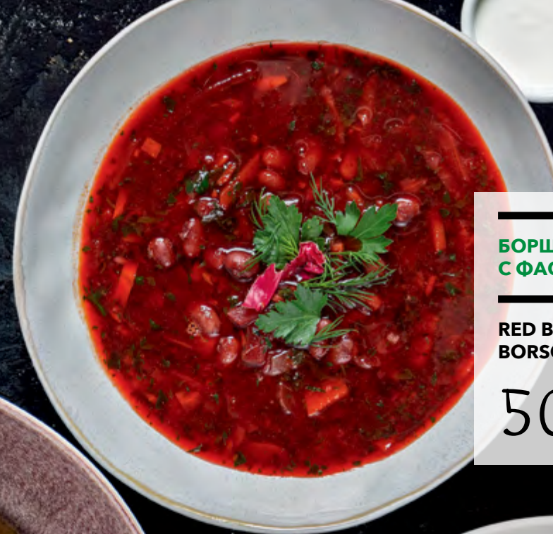
БОРЩ С ФАСОЛЬЮ