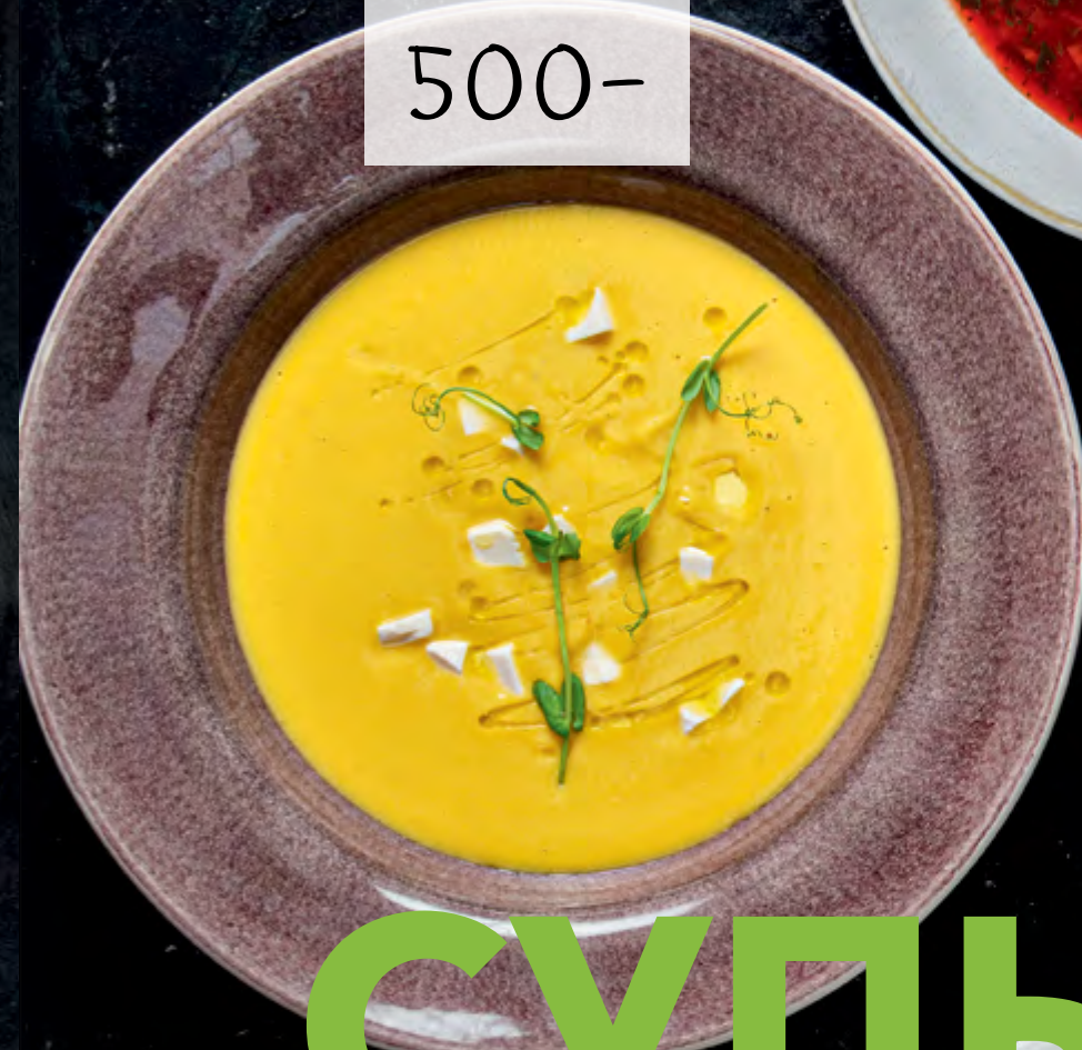
КРЕМ-СУП ИЗ ЦВЕТНОЙ КАПУСТЫ С ТОФУ И ТРЮФЕЛЬНЫМ МАСЛОМ

CREAMY CAULIFLOWER SOUP WITH TOFU & TRUFFLE OIL