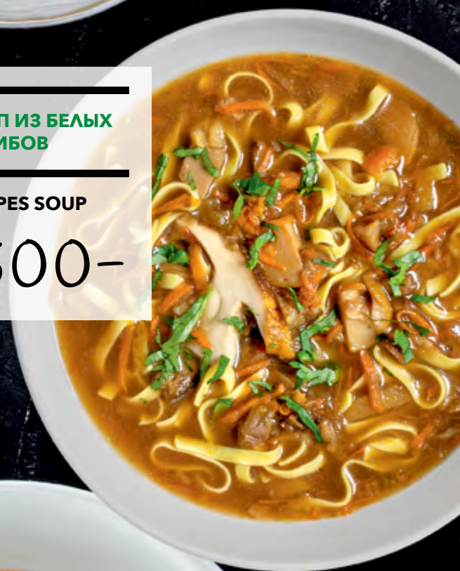
СУП ИЗ БЕЛЫХ ГРИБОВ