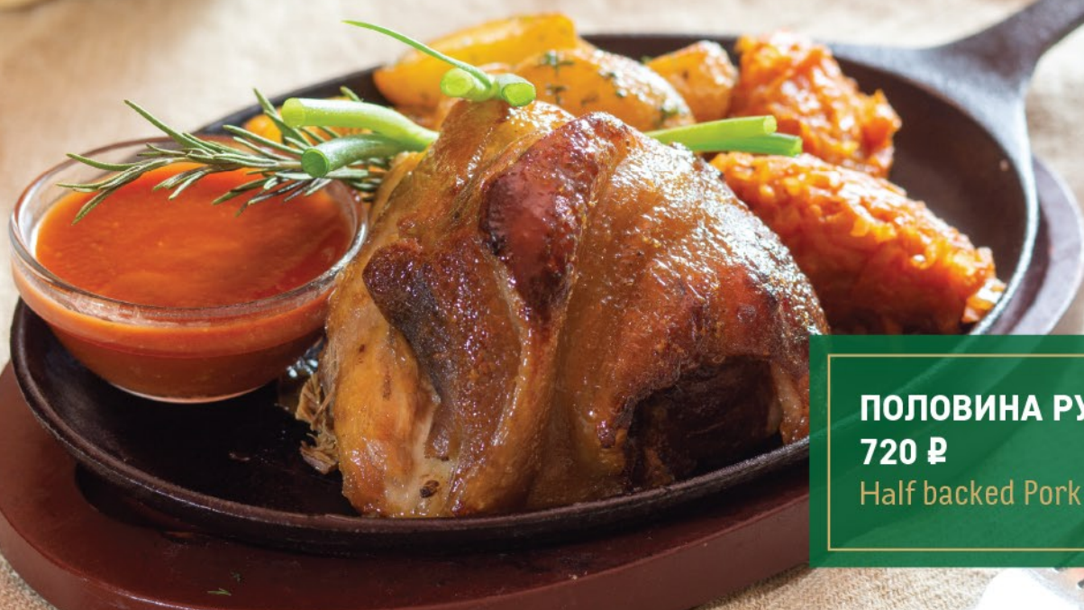
ПОЛОВИНА РУЛЬКИ 720 ₽ Half backed Pork shin