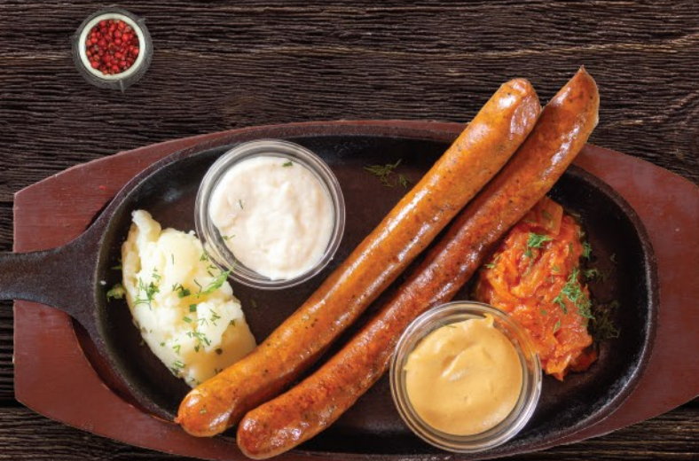
КОЛБАСКИ С БАРАНИНОЙ И МЯТОЙ 420 ₽ Pork and beef sausages