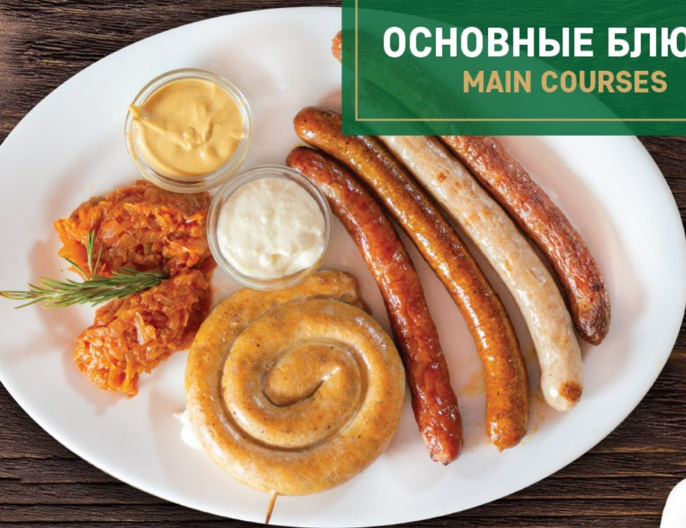
КОЛБАСКИ «ОХОТНИЧЬИ» 430 ₽ Smoked Sausages