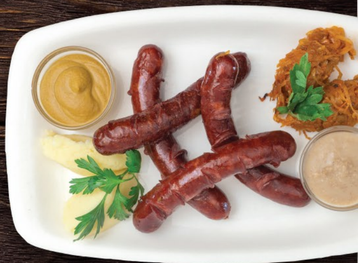
АССОРТИ ЖАРЕННЫХ КОЛБАС 870 ₽ Grilled Sausages