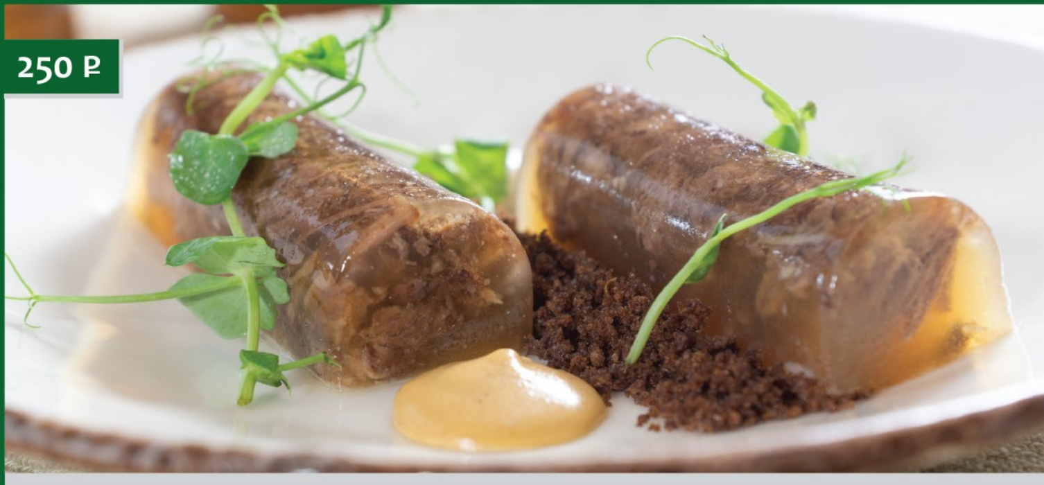
СТУДЕНЬ ИЗ ГОВЯЖЬИХ ХВОСТОВ Beef Aspic