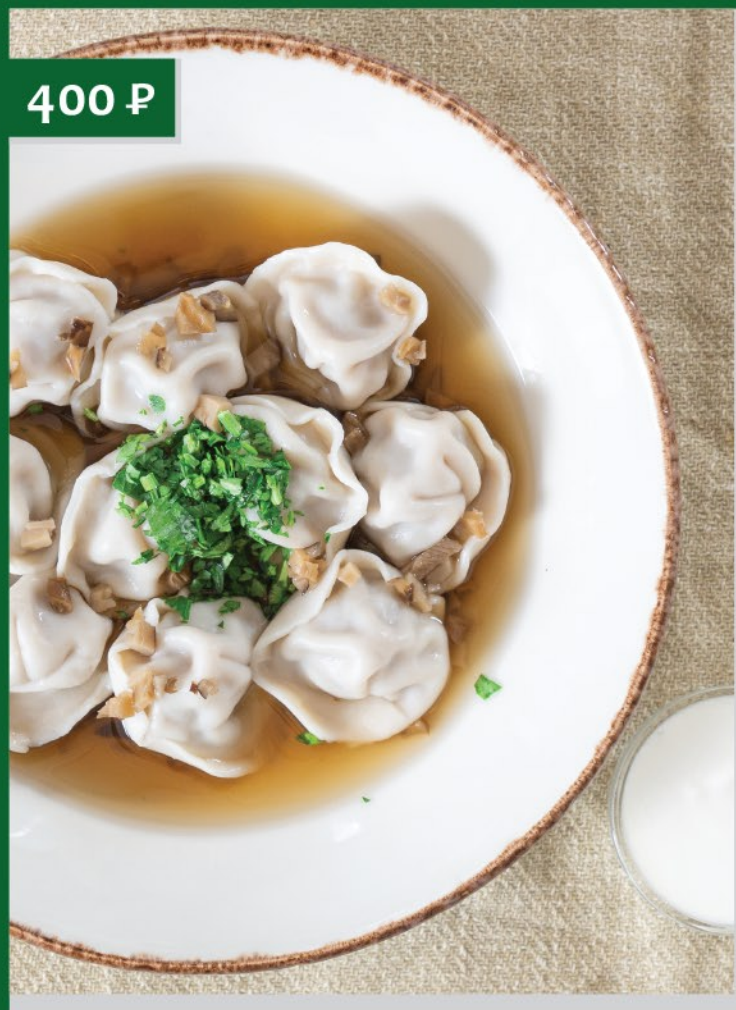
ПЕЛЬМЕНИ С ОЛЕНИНОЙ /оленина + свинина/ Dumplings with Venison