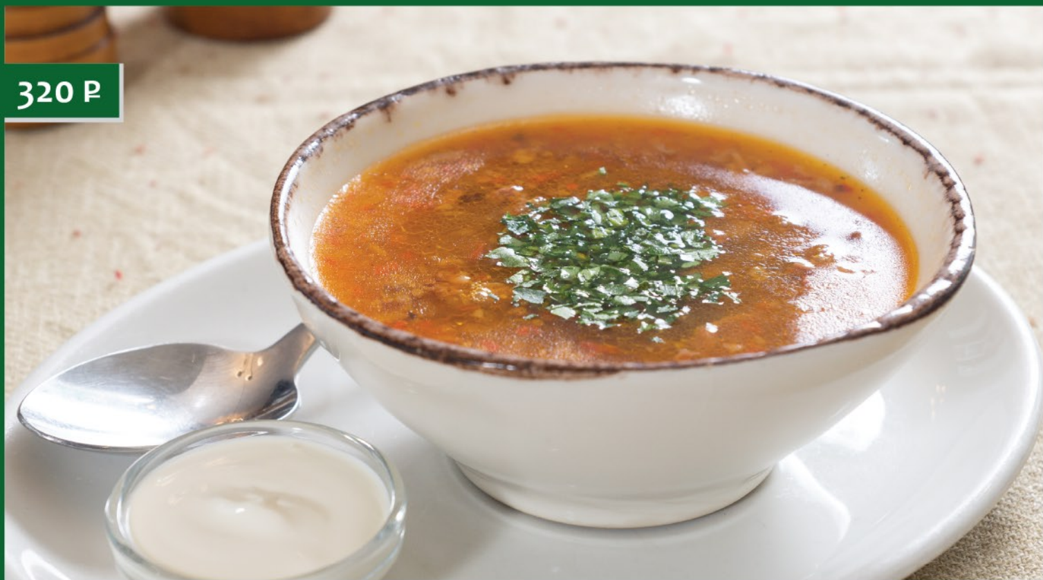
СУП ИЗ ГОВЯЖЬИХ ХВОСТОВ Spicy Soup with Beef Tail