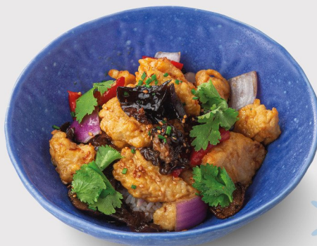
Цыплёнок с грибами шиитакэ на рисе