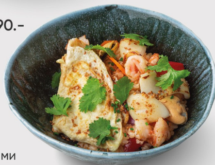
Жареный рис с морепродуктами