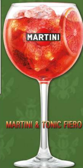
MARTINI & TONIC FIERO