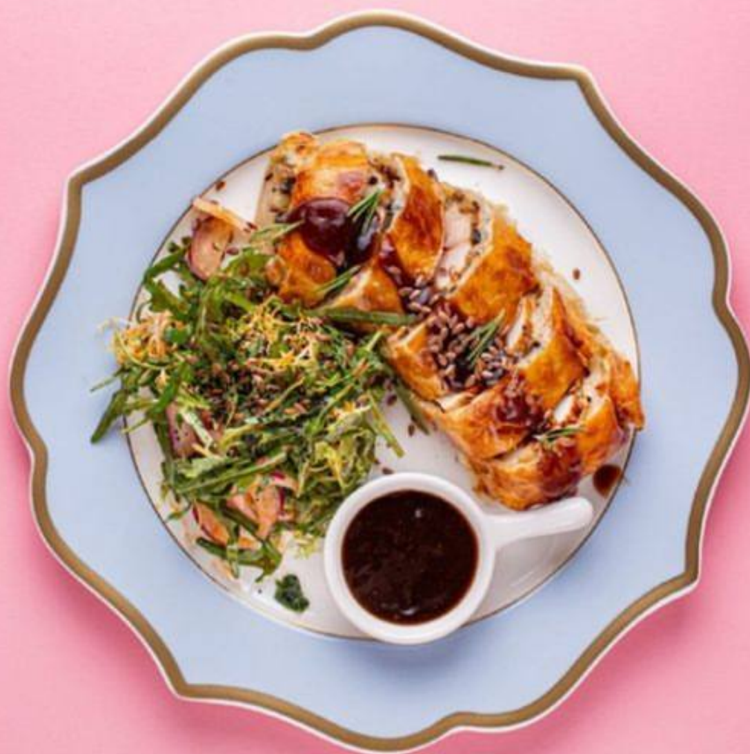
ИНДЕЙКА ВЕЛЛИНГТОН С ГРИБНОЙ НАЧИНКОЙ И СОУСОМ ДЕМИГЛАС