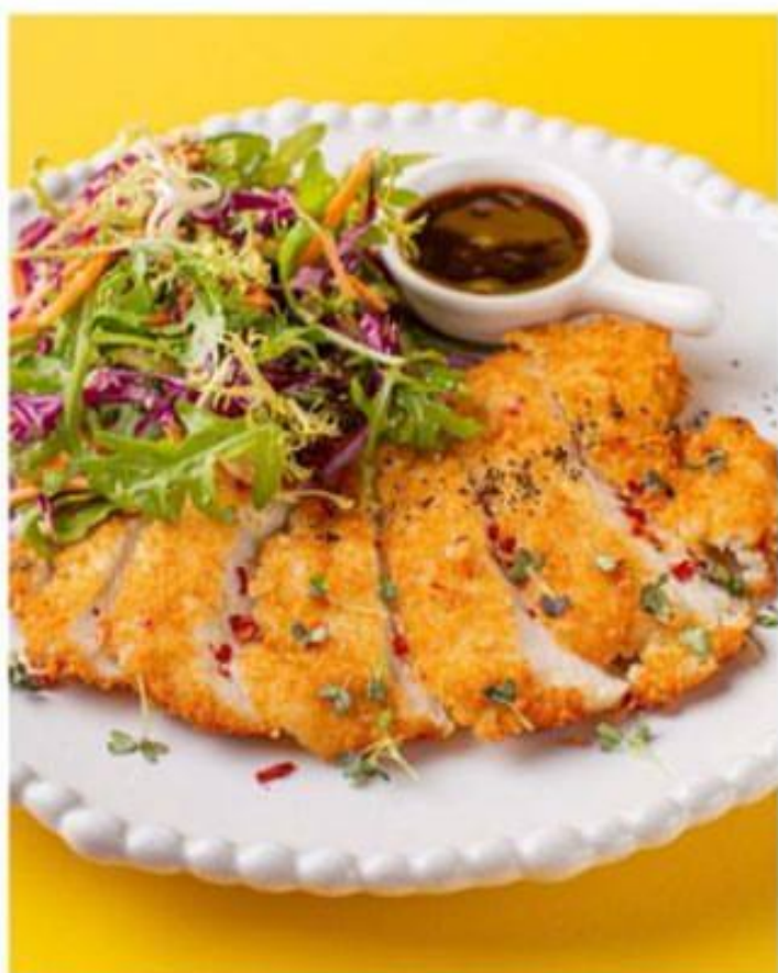
ШНИЦЕЛЬ ИЗ ИНДЕЙКИ со свежим салатом и соусом демиглас 750