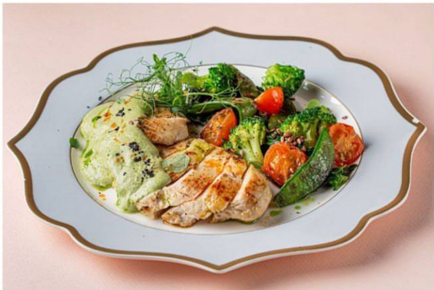
КУРИНАЯ ГРУДКА с мятным чатни и овощами гриль 880