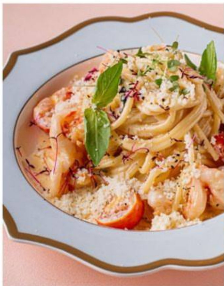
СПАГЕТТИ С КРЕВЕТКАМИ В СЛИВОЧНОМ СОУСЕ