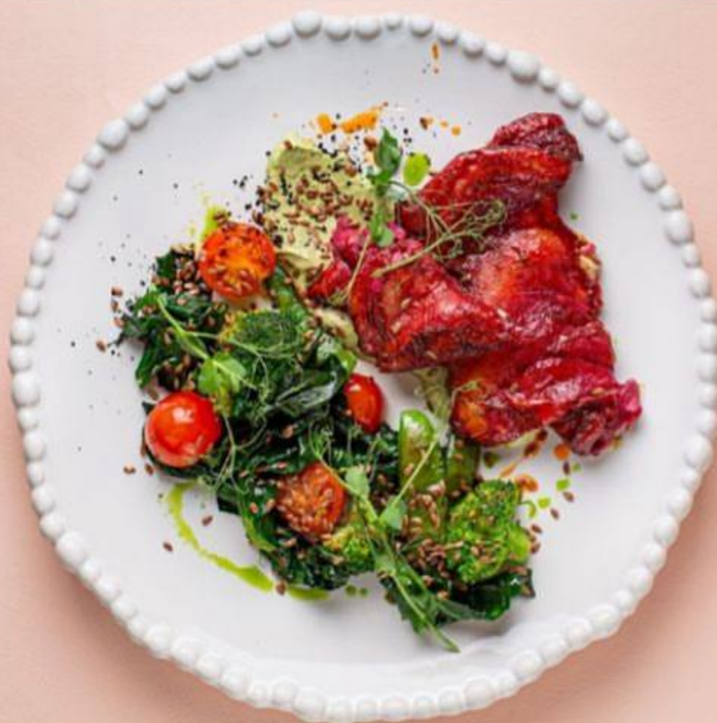
КУРИЦА ТАНДУРИ С МЯТНЫМ ЧАТНИ И ОВОЩАМИ ГРИЛЬ