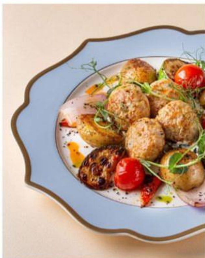
КОТЛЕТЫ ИЗ ИНДЕЙКИ на гриле с печёными овощами 750