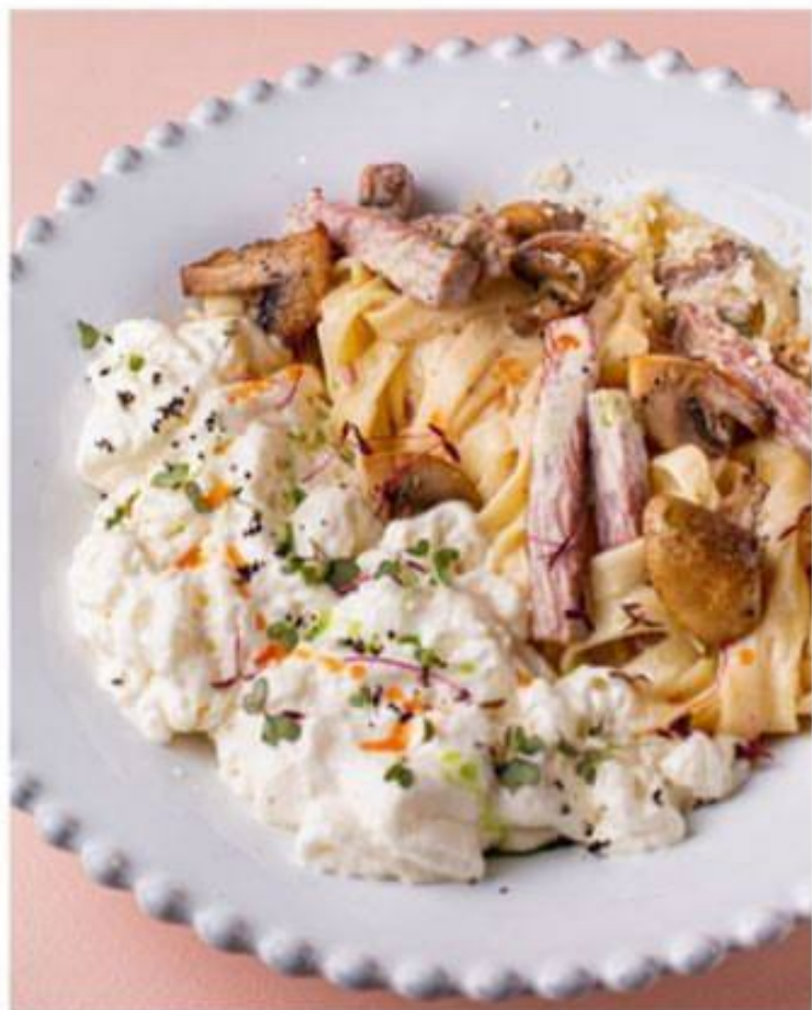
ТАЛЬЯТЕЛЛЕ С МУССОМ ПАРМЕЗАН