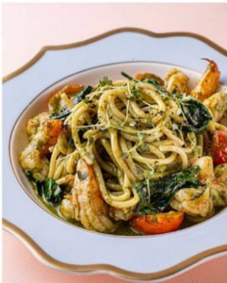
СПАГЕТТИ С КРЕВЕТКАМИ ШПИНАТОМ И ПЕСТО