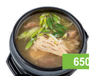
рис в подарок

Мисо суп с морскими водорослями, грибами намеко, тофу, 275 гр