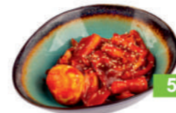
Токпокки с говядиной И овощами, 370 гр