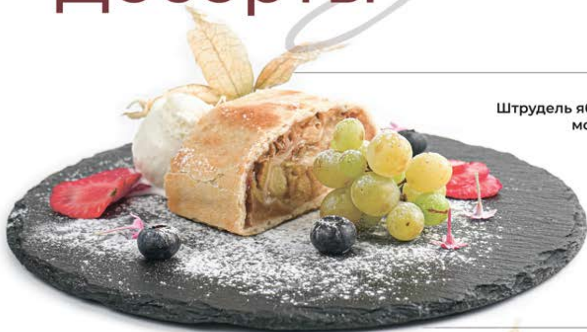
Штрудель яблочный с мороженым