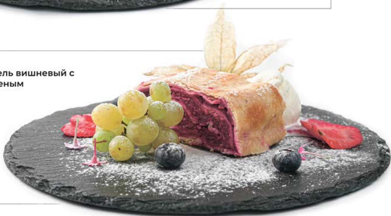
Штрудель вишневый с мороженым