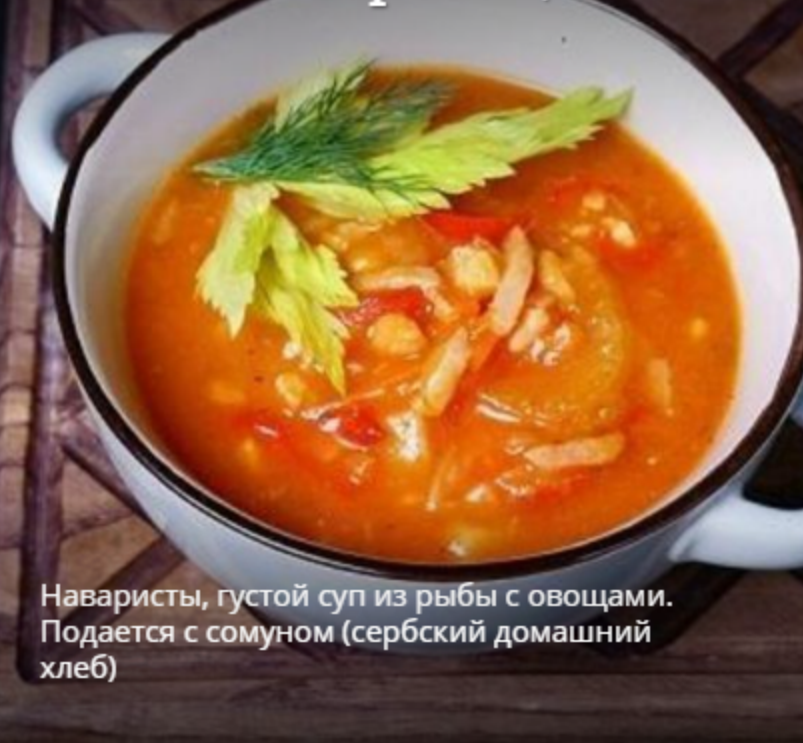
Рыбная Чорба 300 гр

Наваристый, густой суп из рыбы с овощами. Подается с сомуном (сербский домашний хлеб)