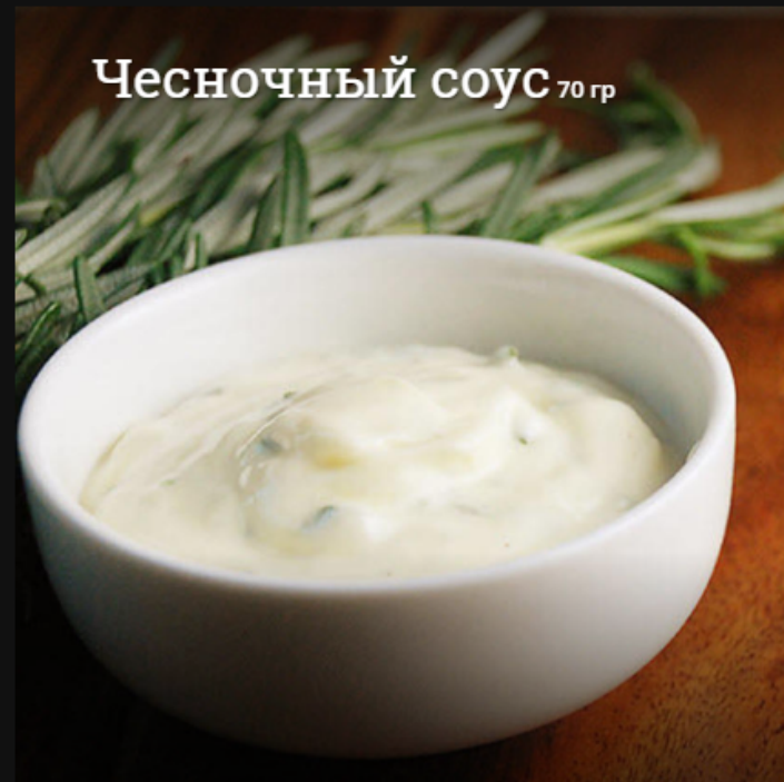
Чесночный соус 70 гр

Сербская закуска из сладкой печеной паприки