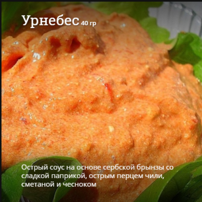
Урнебес 40 гр

Острый соус на основе сербской брынзы со сладкой паприкой, острым перцем чили, сметаной и чесноком