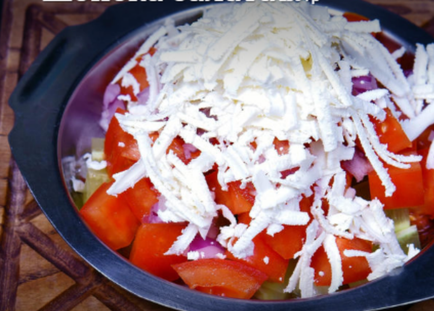
Шопска салата 250 гр

Помидор, огурец, красный лук, оливковое масло, сербская брынза