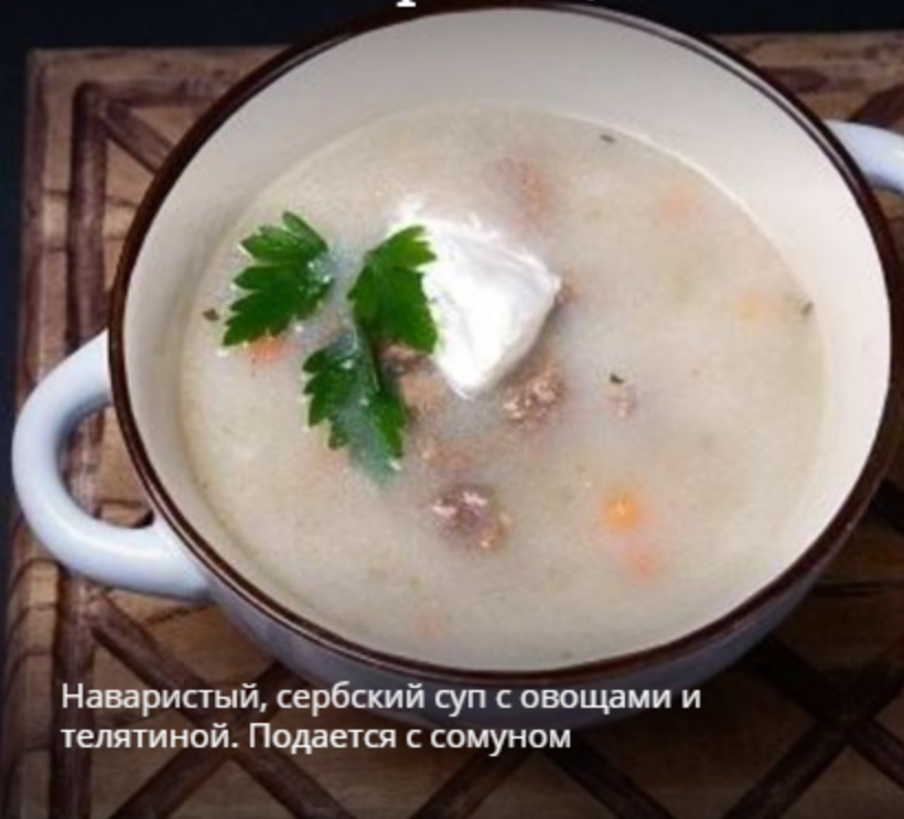
Телеча Чорба 300 гр

Наваристый, сербский суп с овощами и телятиной. Подается с сомуном