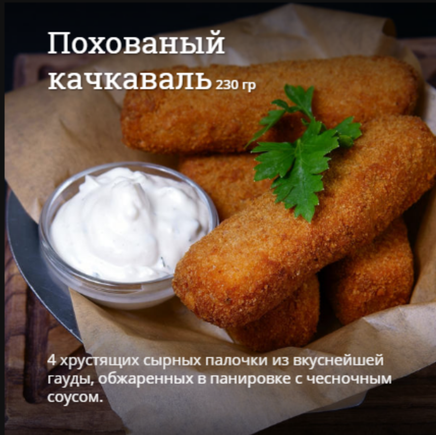
Похованый качкаваль 230 гр

4 хрустящих сырных палочки из вкуснейшей гауды, обжаренных в панировке с чесночным соусом.