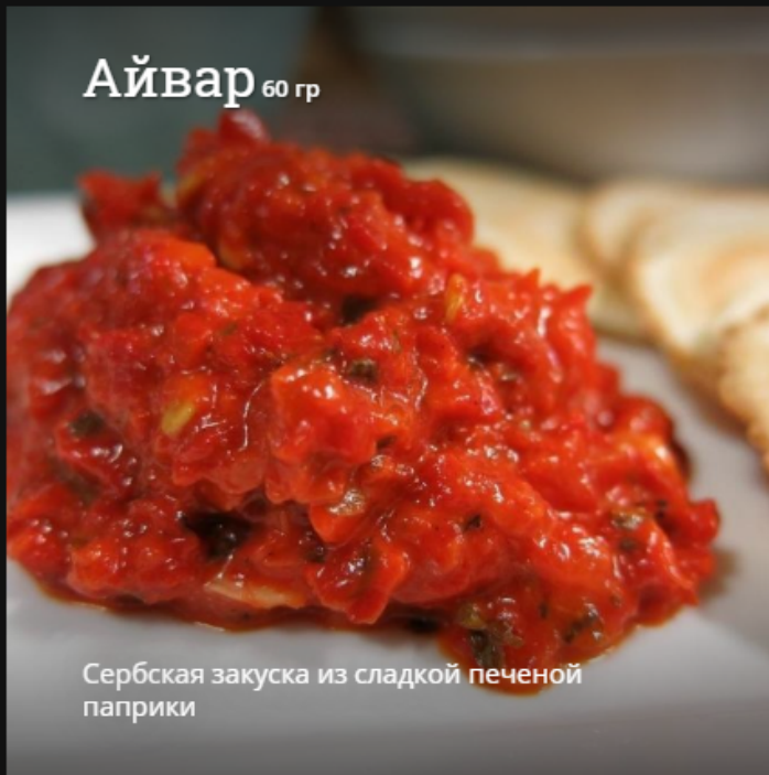
Айвар 60 гр

Сербская закуска из сладкой печеной паприки