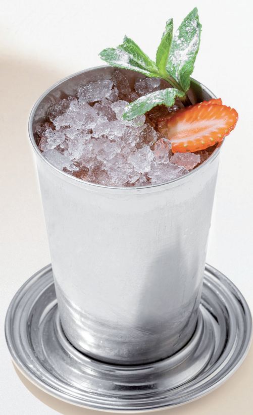
Summer garden Летний сад ликер бранкаменга, ром настоящий на клубнике, мятный кордиал 560