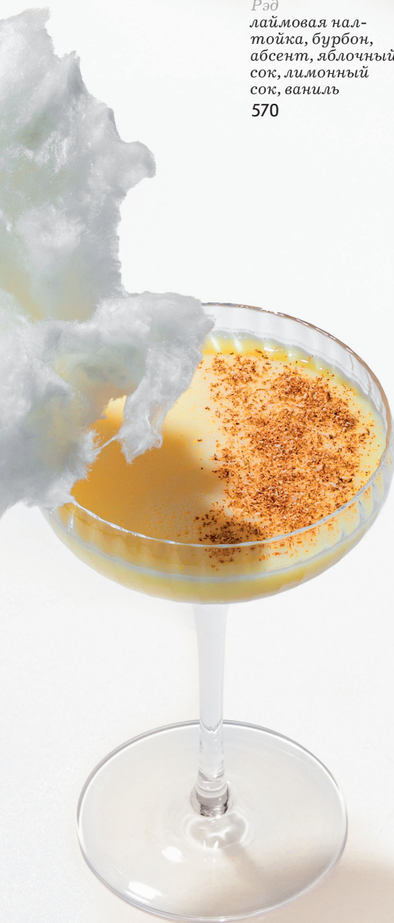
Crème de la crème Сливки общества сливочный ром, апель- синовый ликер, бит- тер, апельсиновый сок, ванильный сироп, сливки, мускат 580