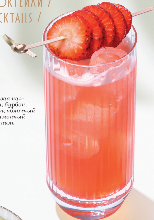
Red Рэд лаймовая на- тойка, бурбон, абсент, яблочный сок, лимонный сок, ваниль 570